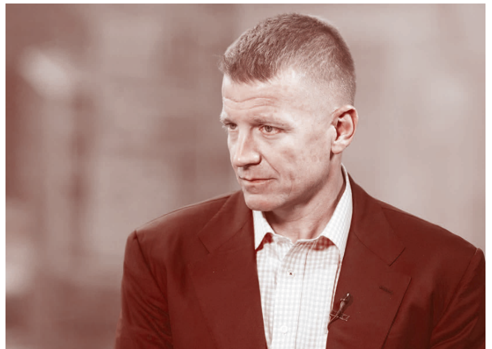
Основатель ЧВК Blackwater Эрик Принс