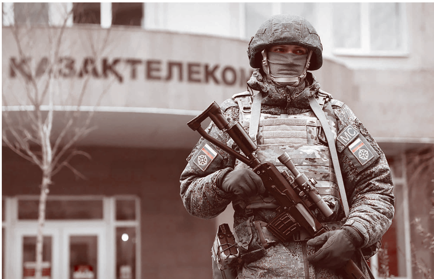
Миротворец ОДКБ в Алматы во время беспорядков в январе 2022 года

Этот документ объявляет, что американцы обязуются в течение 16 месяцев вывести из Афганистана свой 14-тысячный контингент, причем первые 5,4 тыс. амери-