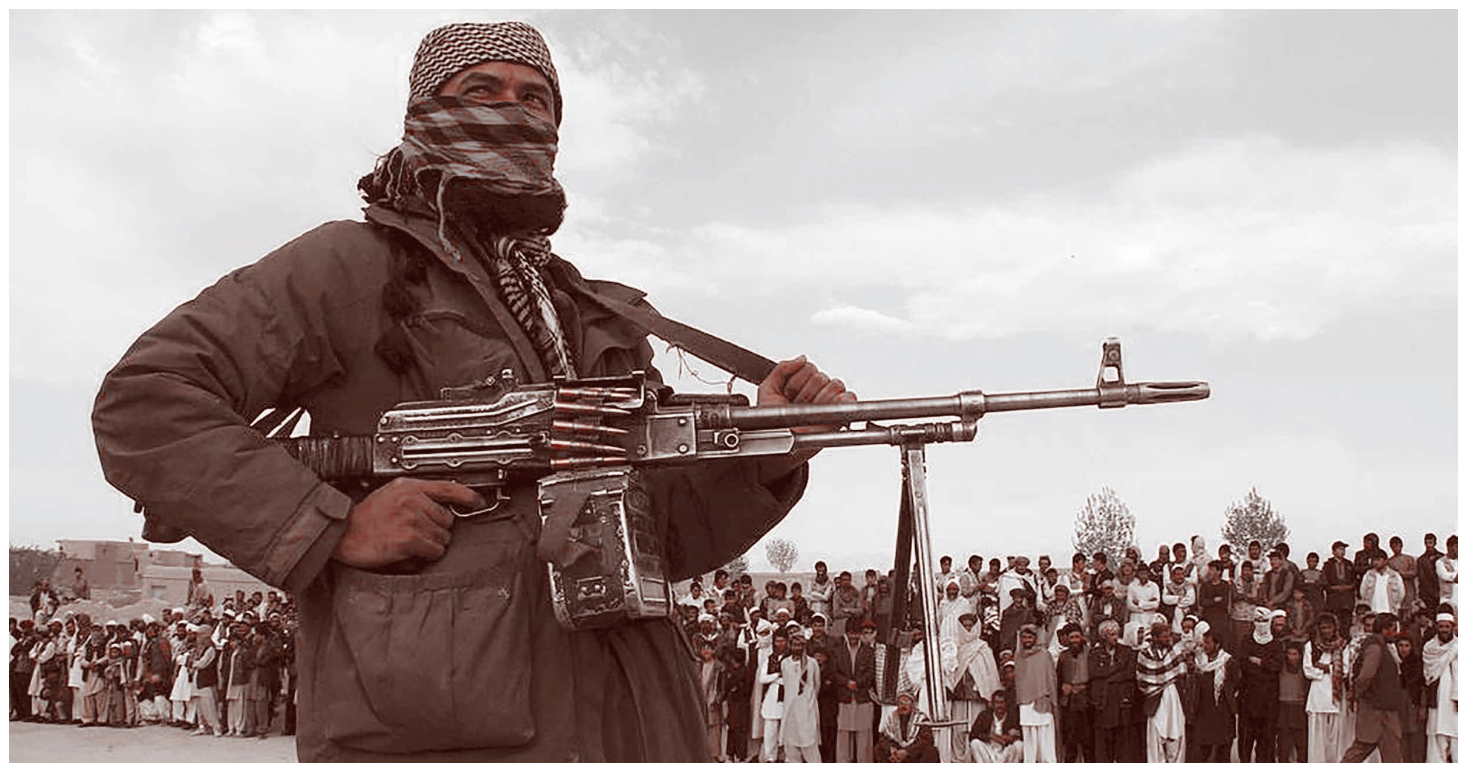
Представитель Талибана*

риканцами боевиков «Исламского государства»* в северные районы Исламской Республики Афганистан для «просачивания» в соседние страны СНГ».