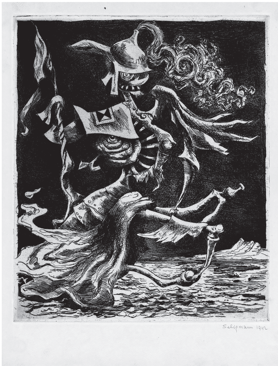
Курт Зелигманн. Призрак прошлого. 1942

Я хочу напомнить: мне ведь не приснилось, что немцы заявили, что они 100 млрд евро вложат в свои вооруженные силы? Это надо себе представить, что такое 100 млрд евро — это крупные деньги, серьезные. Мне не приснилось, что японцы требуют гораздо большего разворота своих военных возможностей? Значит, под это дело происходит неясное добивание Ялтинско-потсдамского мира, а это крупная задача, да? Потому что если Германия вложит 100 млрд евро в свои вооруженные силы, то это уже будет