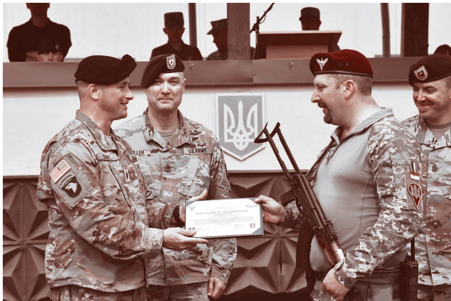
Военные США вручают награды украинским военным

Исследование называется «Запад создал условия для украинского взрыва». Автор рассматривает всю историю конфликта с госпереворота 2014 года на Украине.