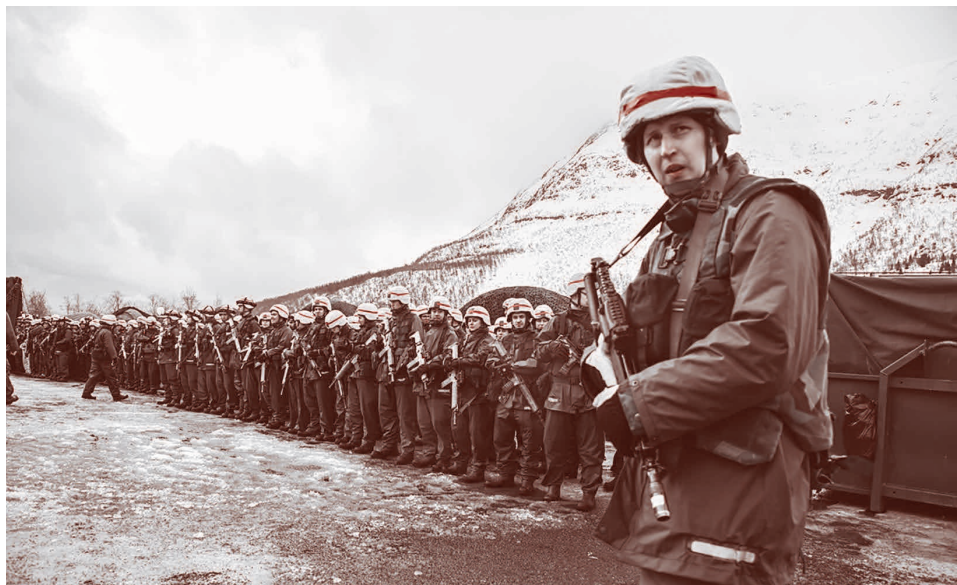
Шведские солдаты участвуют в международных военных учениях «Cold Response 22» в Норвегии, 21 марта 2022 года

Масштабные международные учения Cold Response проходили в Норвегии с 14 марта в течение двух недель. Это крупнейшие маневры под руководством Норвегии с 1980-х годов, отметили в МИД страны. В них приняли участие около 30 тыс. военных из 27 государств, в том числе Финляндии и Швеции — партнеров НАТО.