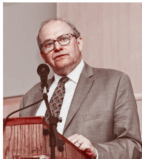
Андерс Ослунд

Бывший советник Гайдара шведский дипломат Андерс Ослунд дал ряд рекомендаций НАТО насчет того, как, по его мнению, Североатлантический альянс должен вести себя с Россией.