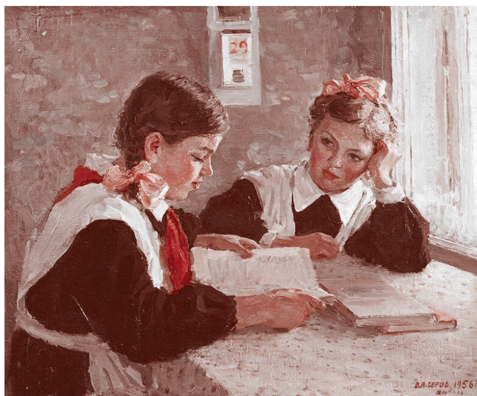
Владимир Серов. Домашняя работа. 1956

Первая проблема, которая тут видится — противоречие между знаниево-ориентированным подходом и подходом личностно-ориентированным.