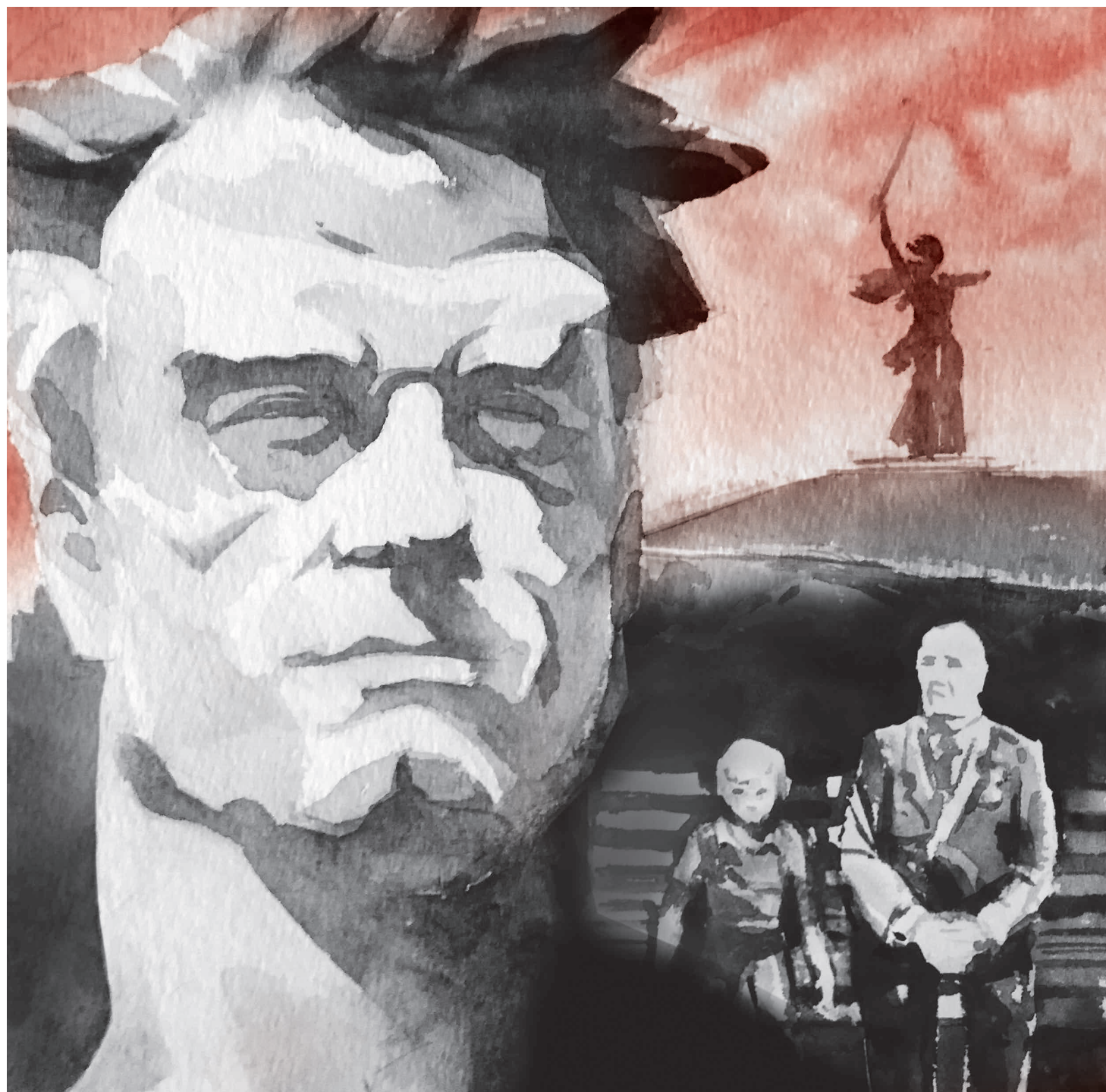
Галина Брусницяна. Майский день. 2022

Наконец они были на вершине. «Родина-мать» здесь грозно нависала над ними, словно туча. Зато было видно весь город и Волгу, и даже больше — уходящий вдаль, до самого горизонта, густой заволжский лес. Самые большие дома отсюда казались игрушечными, а люди — и вовсе букашками. Некоторое время они просто стояли так и смотрели вниз. Прохладный ветер трепал им волосы и оде-