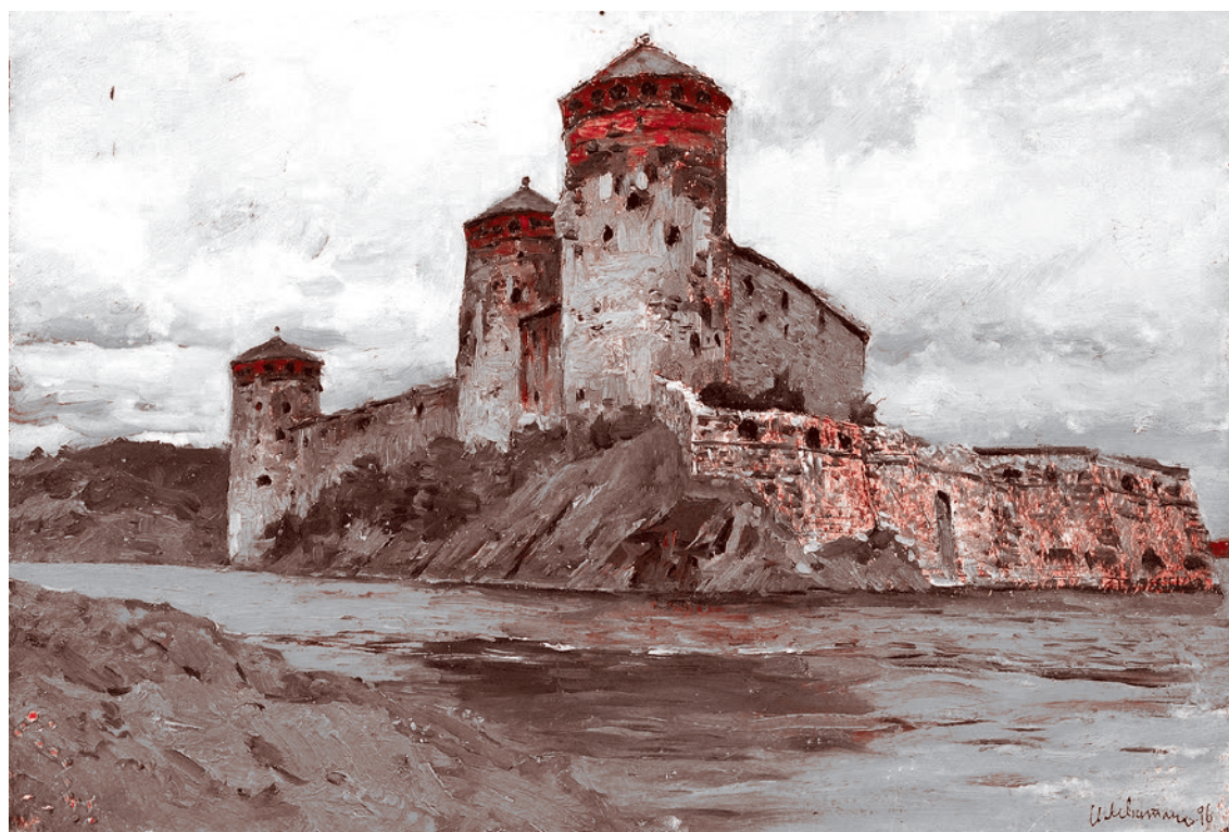
Исаак Левитан. Крепость в Финляндии. 1896

Но аппетиты финнов не ограничивались Карелией и Кольским полуостровом. Маннергейм намеревался отторгнуть от России и Петроград, превратив его в «вольный город» по образцу Данцига. Уже в начале мая, после подавления революции, белофинны вышли к Сестрорецку и оказались в 30 км от Петрограда, надеясь схватить его. Но получив отпор частей Красной Армии Петроградского гарнизона,