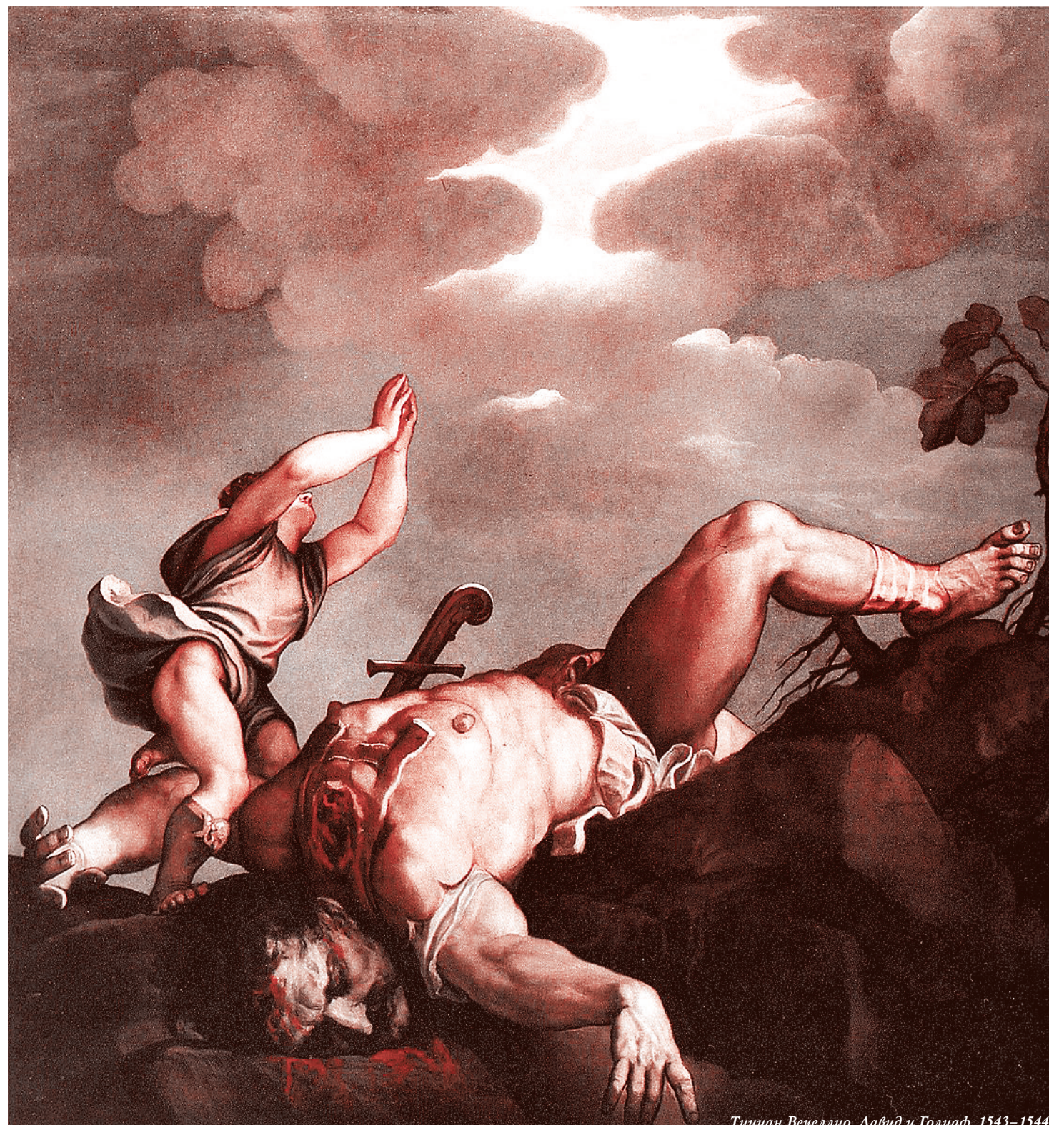
Тициан Вечеллио. Давид и Голиаф. 1543–1544