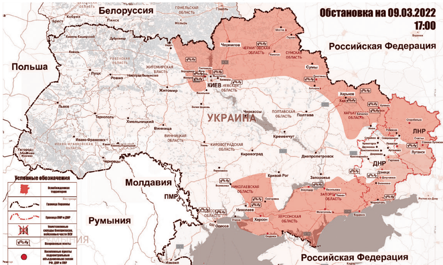
Ход спецоперации на Украине, составлено по отчетам Минобороны РФ на 09.03.2022

ния основных государственных функций, говорится в заявлении канцелярии премьер-министра страны Бориса Джонсона.