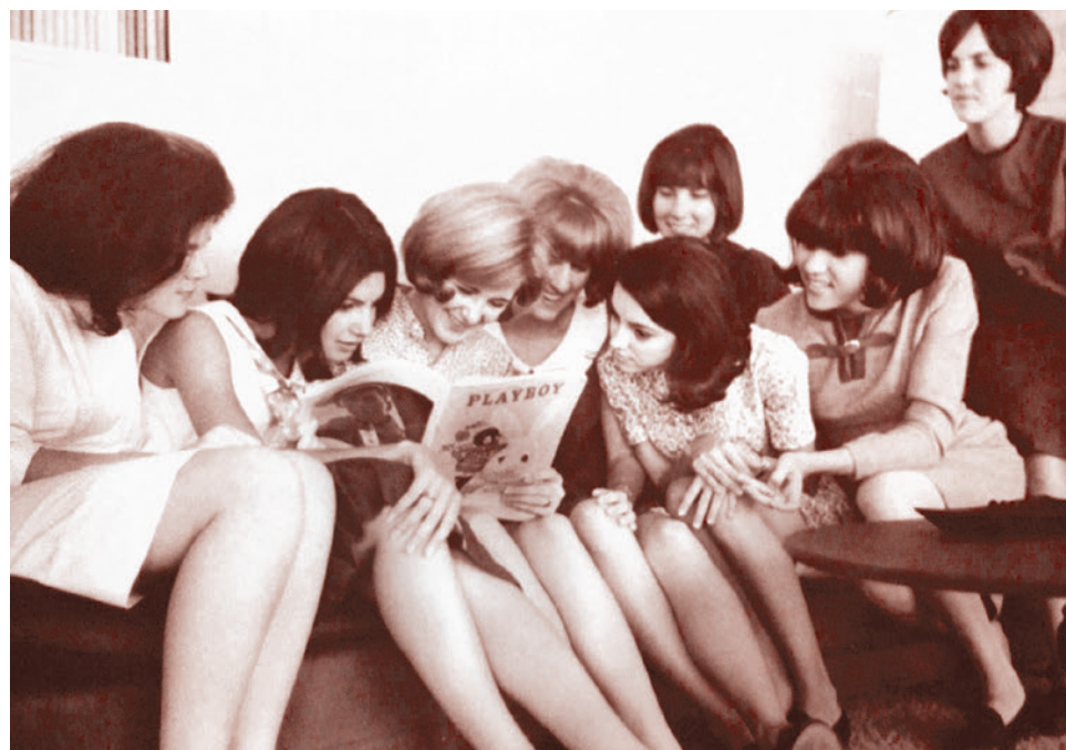
Американские девушки читают Playboy. 1966

До того массовая культура Запада основывалась на коммерческой адаптации старых, хорошо опробованных художественных приемов. Ее продукты создавались для неискнутого потребителя по «рецептам», обеспечивающим широкий успех. При этом содержание было по существу соглашательским, не ставящим ост-