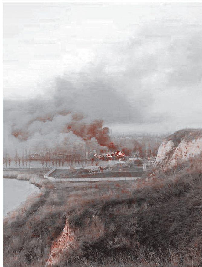
ВС РФ уничтожили военную базу ВСУ в Очакове

«Наступательная операция должна была начаться 8 марта текущего года. Факты указывают на то, что вторжение планировалось одновременно как на территорию республик Донбасса, так и в Российскую Федерацию — в Крым», — заявил он.