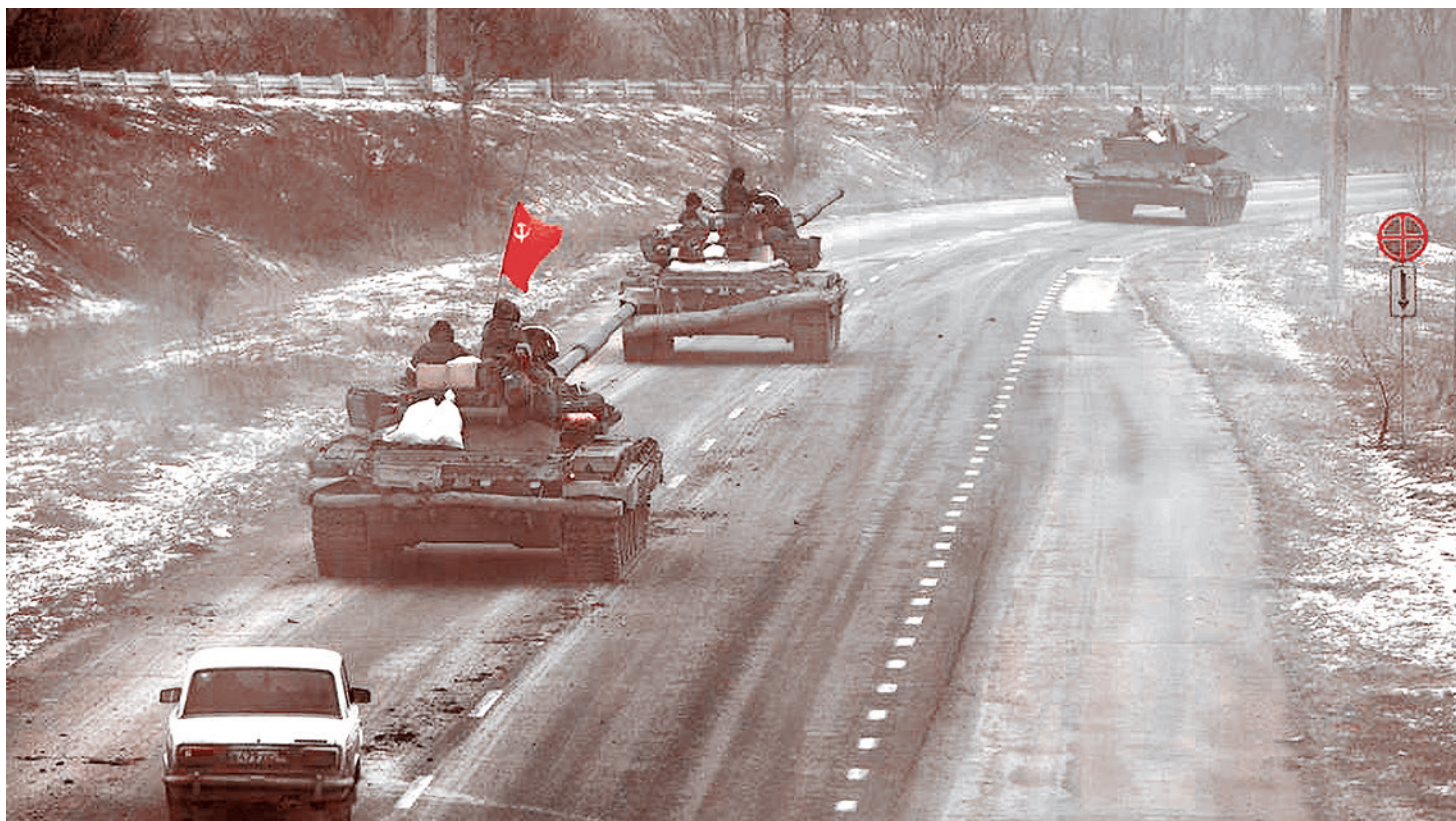
Перемещение российской военной техники

Великобритания направит дополнительные $100 млн помощи правительству Украины, которые предназначены для восполнения потерь бюджета, понесенных из-за специальной военной операции России, и для обеспечения осуществле-