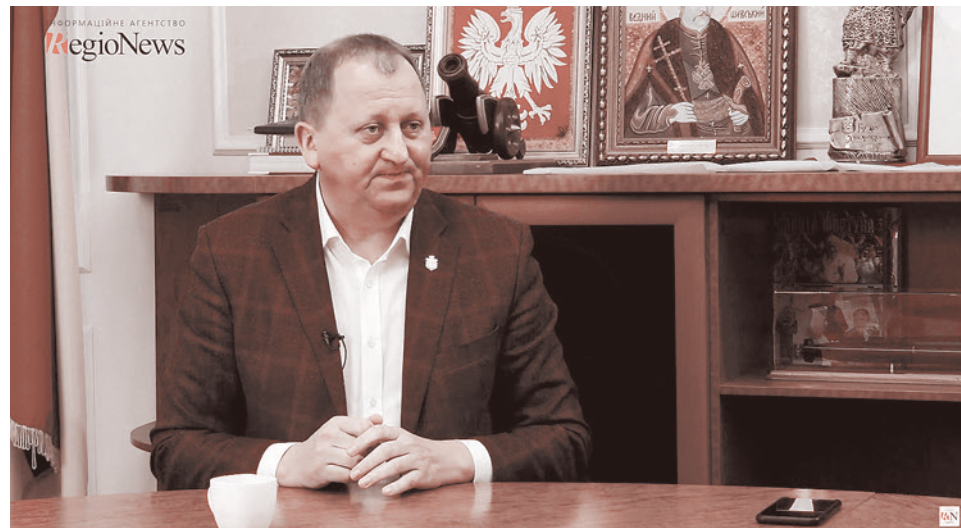
Мэр Сум Александр Лысенко

По его словам, в Краматорске под казармы боевиков переоборудованы спортзалы школ № 6, 15, 19, 20, и 31; в Дзержинске