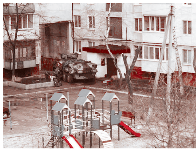
Типичное расположение техники ВСУ — среди жилых домов и соцобъектов

в профилактории «Радуга» устроен командный пункт 95-й десантно-штурмовой бригады, а обстрелы Горловки ведутся в том числе из реактивной артиллерии, размещенной на территории местной больницы им. Ленина; в Угледаре боевики и бронетехника украинской нацгвардии обнаружены на территории школы № 2 и детского сада № 1. «Во всех перечисленных населенных пунктах националисты перекрывают выезды с целью блокирования в них гражданского населения», — подчеркнул Басурин.