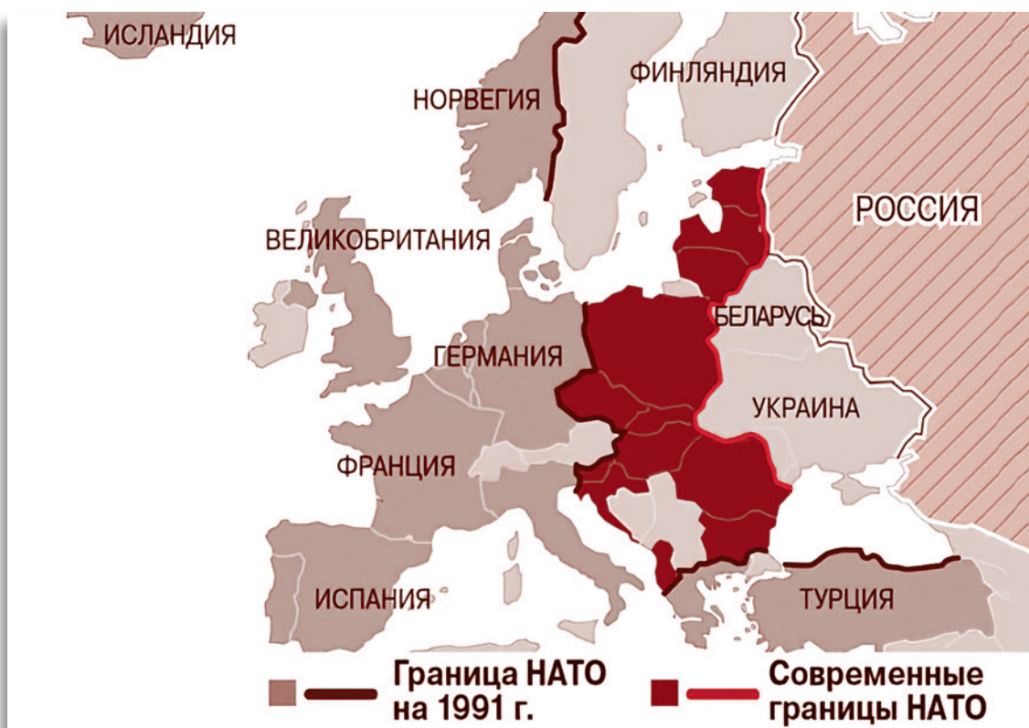
Карта НАТО

Ведь, по словам г-жи Марин, решение о присоединении к альянсу должно быть