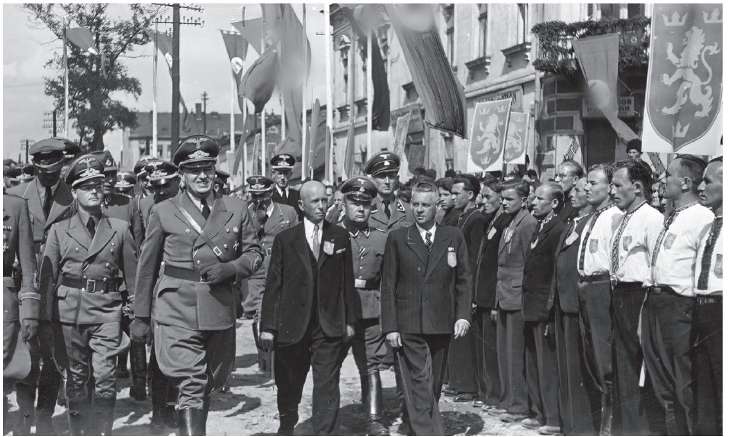
Парад во Львове. 1941

То есть Ленин, если он действительно надеялся на ограниченность возможности Запада в том, что касается подавления советской революции, сыграл, образно говоря,