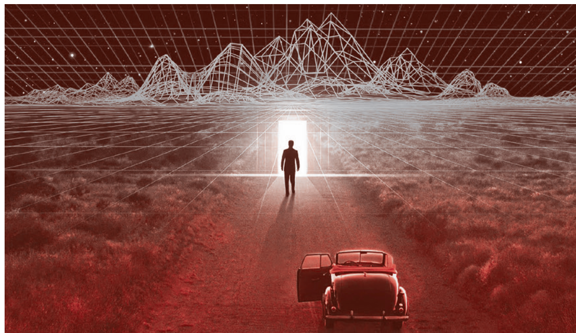
Кадр из фильма «Тринадцатый этаж». 1999

И дея устроить «карантин наоборот», не изолировав больных от здоровых, а заставив здоровых сидеть безвылазно по домам, захватила умы политиков по всему миру практически с самого начала так называемой пандемии коронавируса. И почти тотчас же ЮНЕСКО стала бить тревогу по поводу того, как это отразится на учебе детей.