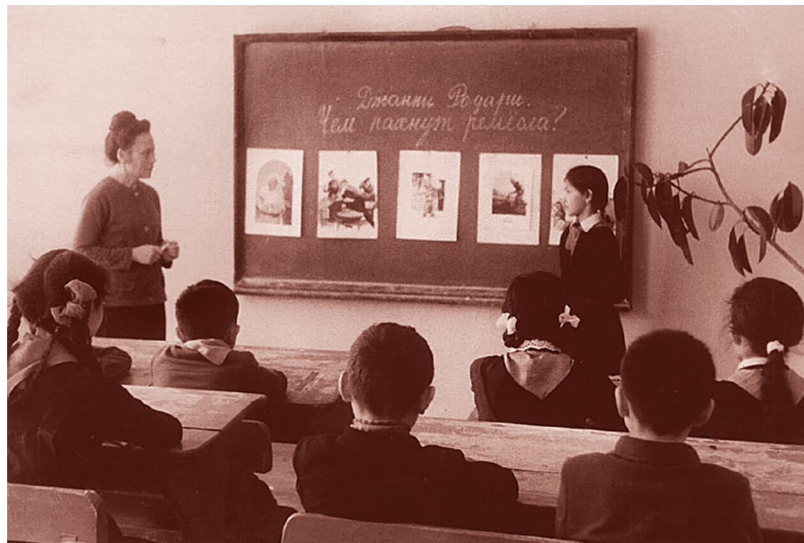
Урок русского языка в казахской школе. 1960–1970-е годы

Потому Токаев предпологал, что казахский национализм и русофобия, скорее всего, «преодолеют» исламскую версию социальной справедливости, на которую сделал ставку клан Назарбаева. Но недооценил пантюркистскую решимость Турции и исламское рвение арабских стран. Которые, подчеркну, явным образом наложились на резкое ухудшение социально-экономической ситуации. Так, по имеющимся статистическим данным, если ВВП Казахстана в пересчете на душу населения в 2013 году был 13,9 тыс. долл., в 2020 го-