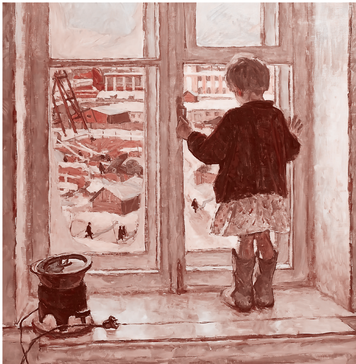
Владимир Васильевич Жуков. Девочка на окне. 1960

Был в Ирландии (как и в Великобритании) и контроль за решениями учи-