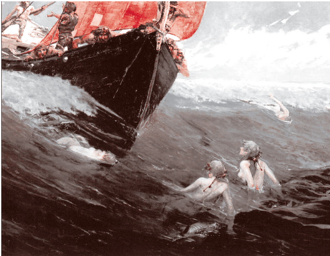
Эдвард Мэтью Хейл. Риф с русалками. 1894

Первый из них предполагает только признание ЛДНР (минимальный вариант).