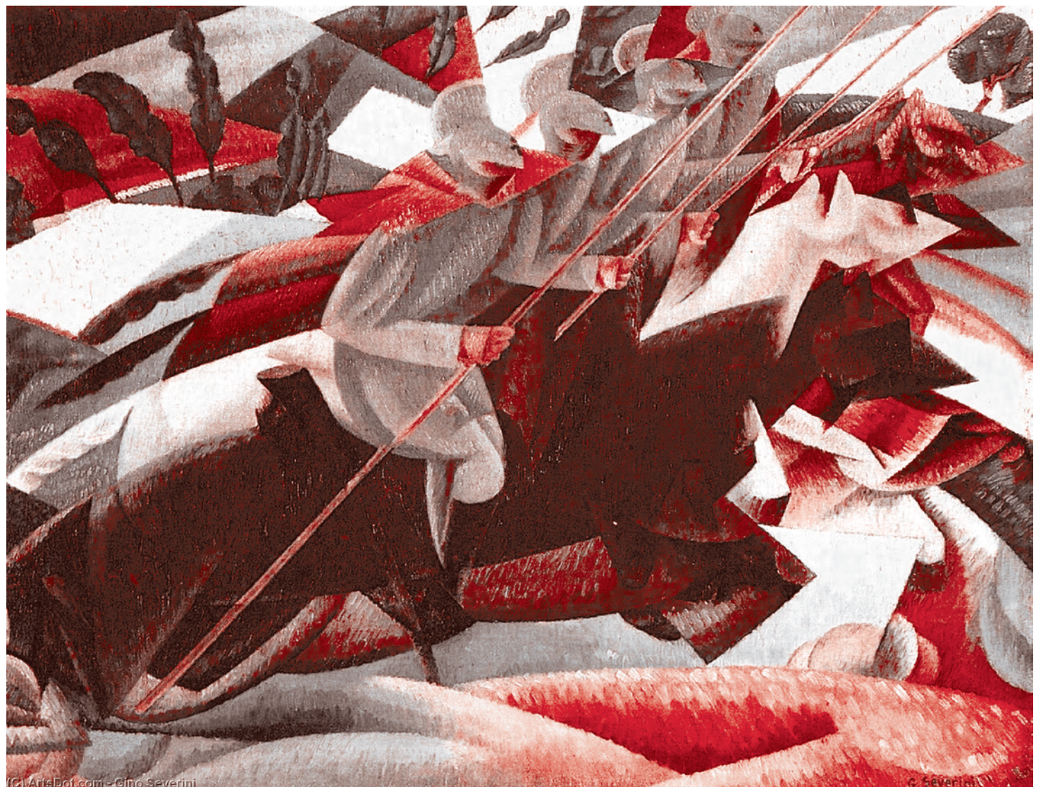
Джино Северини. Стожет 12. 1910-е

М не никогда не нравилась песня «Хотят ли русские войны». Во-первых, в силу ее пошловатой патетичности.