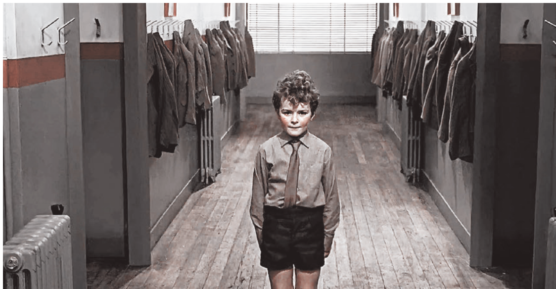
Кадр из фильма «451 градус по Фаренгейту». 1966

В США раньше, чем в России, начали проводить цифровизацию школ вместе с экспериментами по онлайн-обучению школьников, и американцы раньше нас столкнулись с издержками подобного учебного формата.