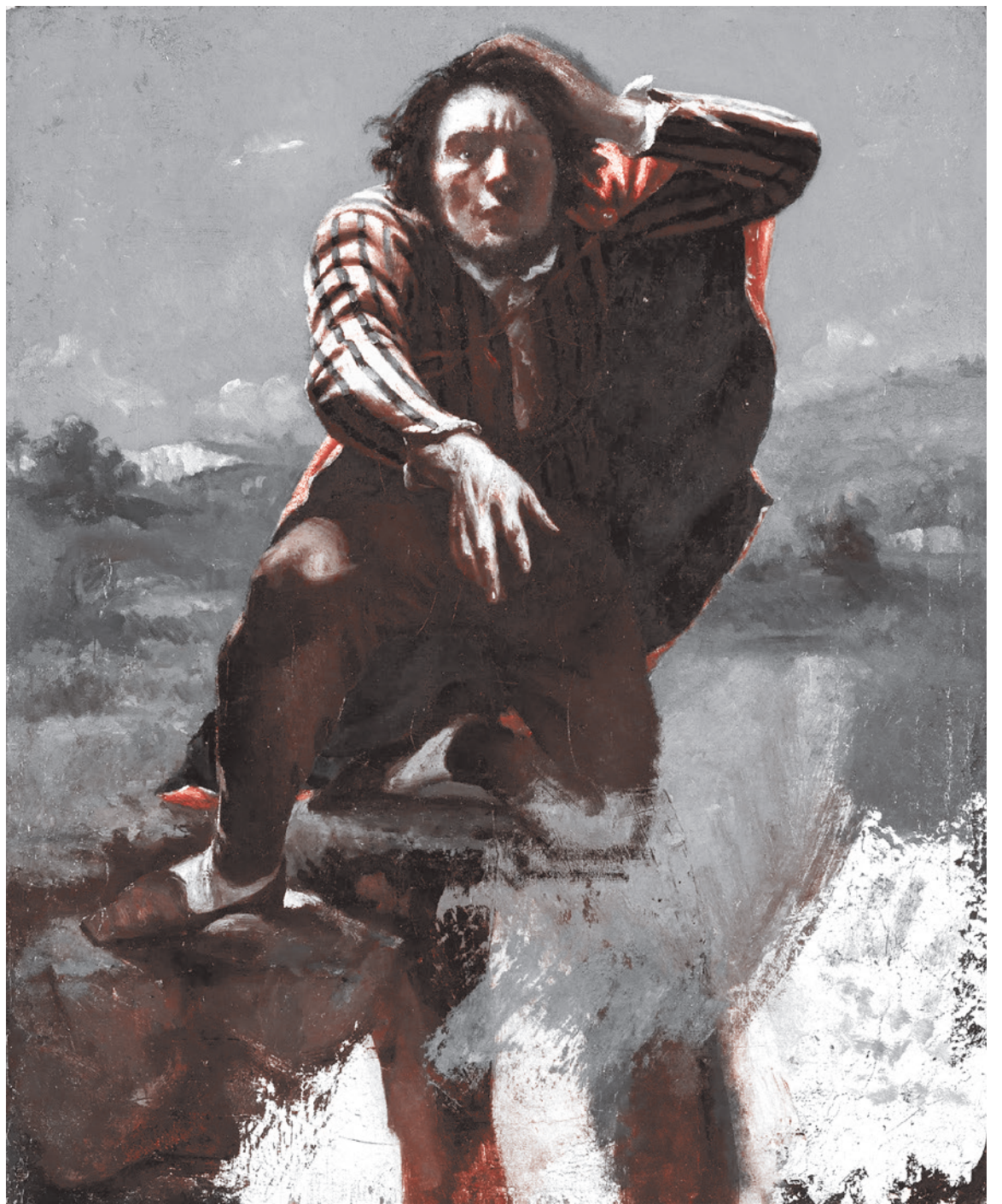
Гюстав Курбе. На краю обрыва. 1845

Другая эпоха... Другая мера вовлеченности в систему клановых сдержек и противовесов... И всё же, как мне представляется, все эти кланы и противовесы знают, что Путин может с ними поступить, об-разно говоря, по-чапаевски. И ждут этого,