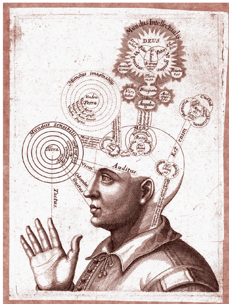
Старинная гравюра, представляющая область мозга. Около 1650

Россия пытается включиться в мозговую гонку, но процесс этот идет с большими сложностями. Это и удивительно, и досадно.