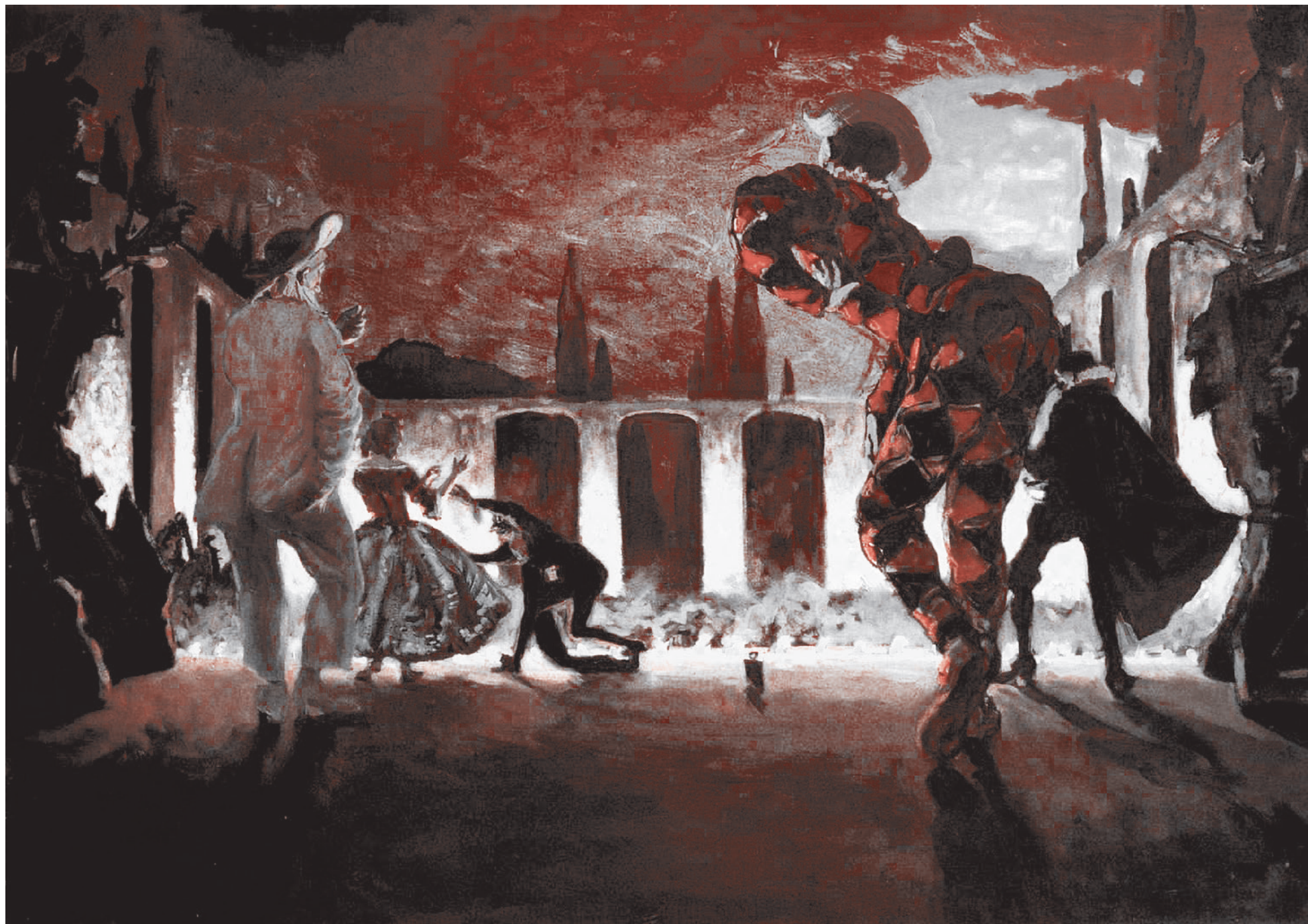
Александр Бенуа. Итальянская комедия. 1906