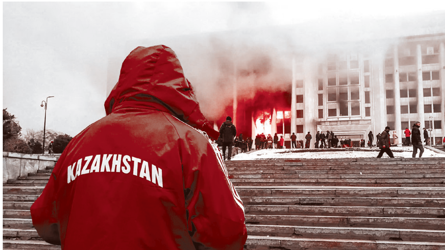
События в Жанаозене в 2011 году

По закону «О Международном финансовом центре «Астана» МФЦА пре-