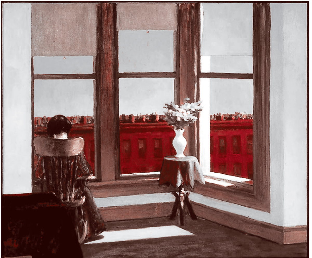
Эдвард Хопер. Комната в Бруклине. 1932

Кстати, о ковидных ограничениях как окне в «светлый мир с широкими возможностями досуга» — и о настоящей реальности. По данным Немецкого фонда помощи при депрессии, социальная изоляция, связанная с карантином, резко увеличила число депрессий. «Когда я обычно еду в офис, я провожу полчаса в пути. Теперь я выхожу из двери спальни, иду по коридору и открываю дверь на свое рабочее место в домашнем офисе. Меня больше ничто не разделяет. Раньше было два мира: мир карьеры и частный, теперь эти два слились, и я не могу избавиться от профессионального стресса», — рассказывал один из пациентов фонда. Другой пациент этого фонда сообщил, как он пережил «тяжелый крах» в начале пандемии: «Я снова мог просто лежать целыми днями. Я тоже это ви-