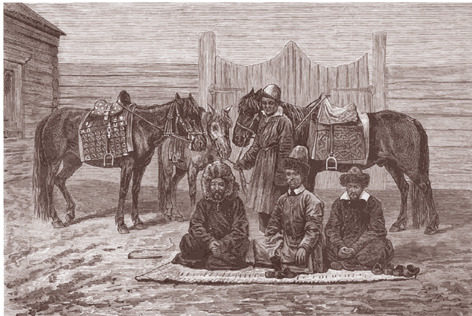
К. Брож. Почтовая станция в степи

Кстати, единственное место на постсоветском пространстве, где, с моей точки зрения, объективно регресс был или оста-