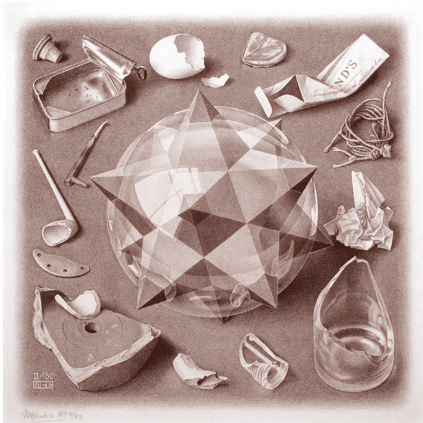
Мауриц Корнелис Эшер. Порядок и хаос.

Поэтому как ранее, так и теперь, вместе с приходом демократов приходит концепция управляемого хаоса, Новый мировой беспорядок. Республиканцы цепляются за концепцию Нового мирового порядка, но осуществить его не могут, потому что заплатить за это американский народ уже не может. Он не может, как Рим, ставить гарнизоны во все провинции