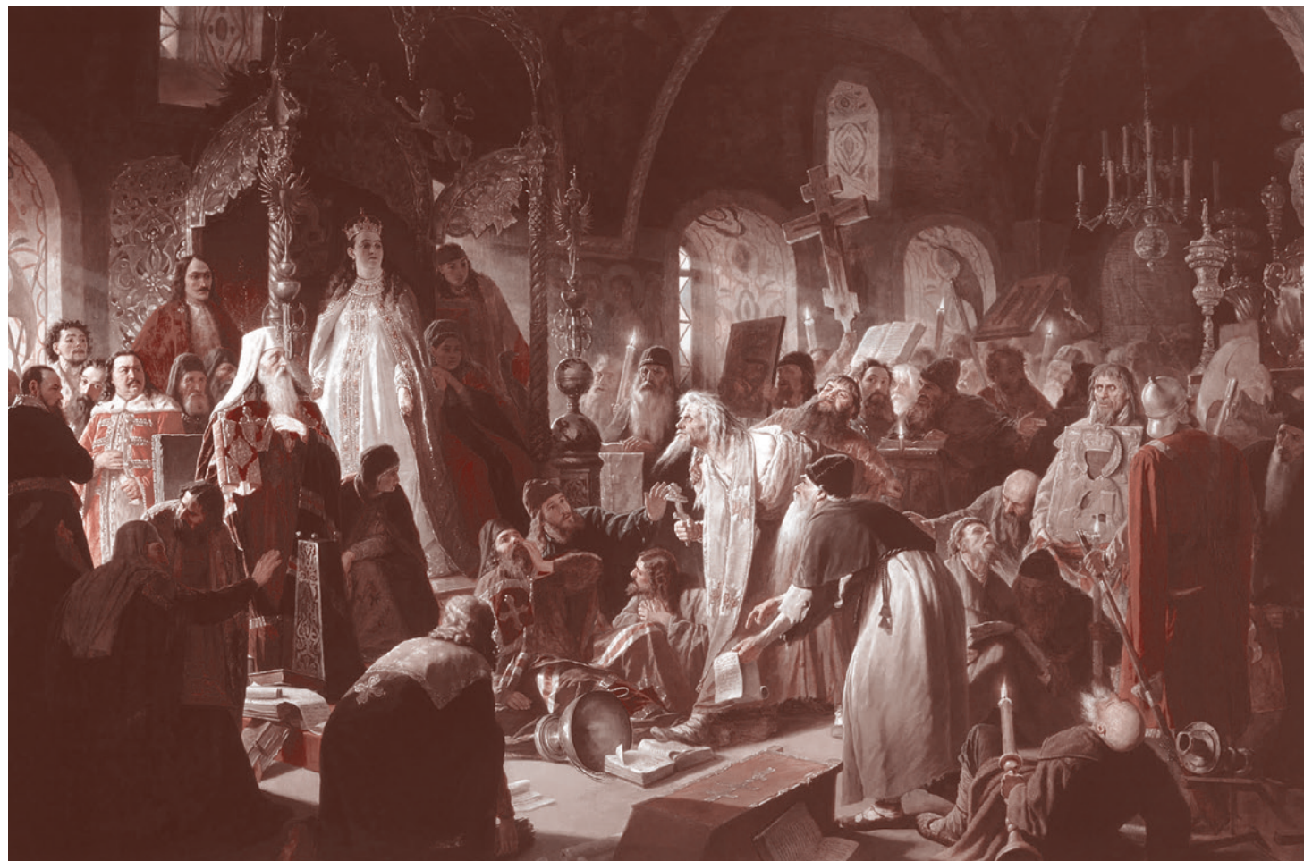
Василий Перов. Никита пустосвят. Спор о вере. 1880–1881

Ну и наконец, тогда общество пыталось понять, как спасти свою Душу, и вокруг этого возник раскол. А сейчас пытаются понять, как спасти тело, и власти раскалывают общество уже по признаку вакцинации. Можно только сожалеть о том, как низко пало наше общество.