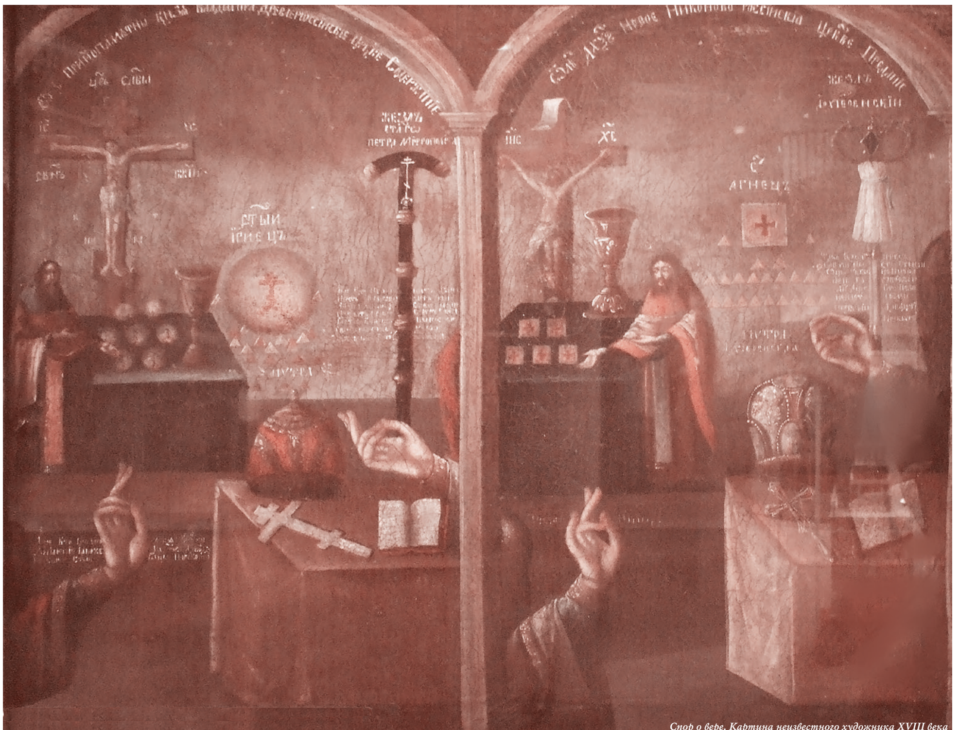
Спор о вере. Картина неизвестного художника XVIII века