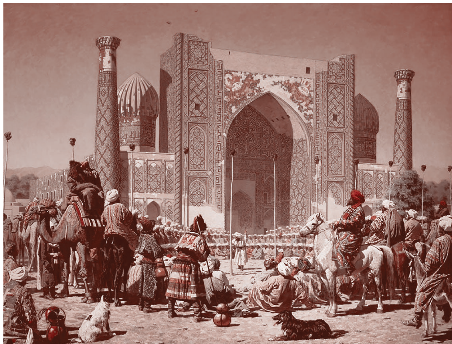
Василий Верещагин. Торжествуют. 1872