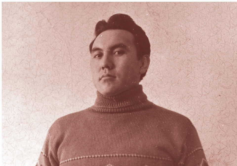
Нурулман Назарбаев в 1960-е годы

По определенным причинам я уже довольно долго живу в близком к Москве дачном поселке, который теперь стал частью Новой Москвы. Переехав туда в связи с болезнью одного ближайшего родственника, которому нужен был свежий воздух, я там и остался. А оставшись там, я завел собаку, чего всегда хотела моя мать, говорившая, что в Москве собаку заводить нельзя. Да и я сам — вполне себе такой собачник, не очень умелый, но трепетно относящийся к собакам как таковым. Поскольку в конце XX века и в самом начале XXI эти дачные поселки были уж совсем нестабильными, то возникшая собака была