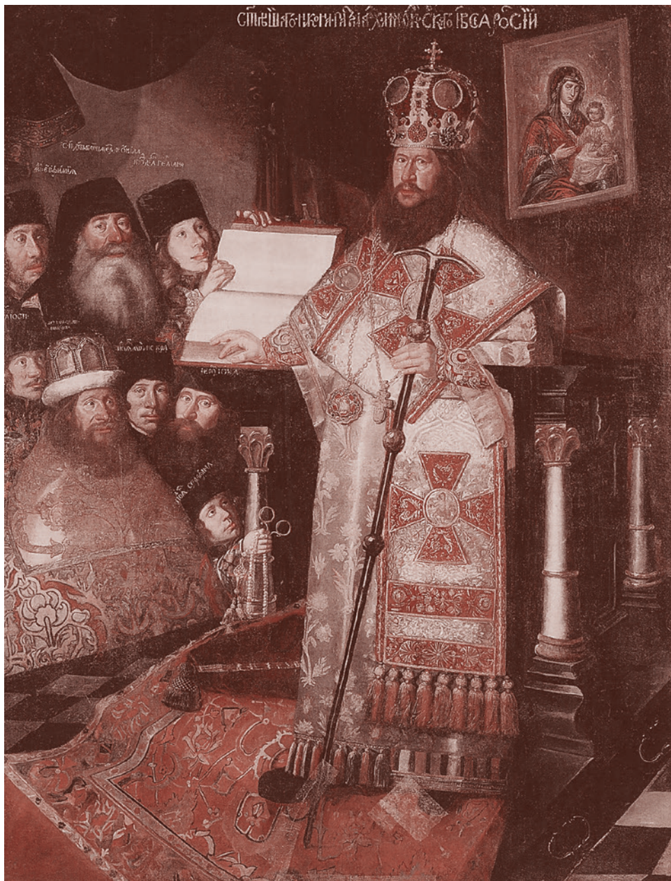
Патриарх Никон с братией Воскресенского монастыря. XVII век

Реформе предшествовала переписка с восточными патриархами по поводу