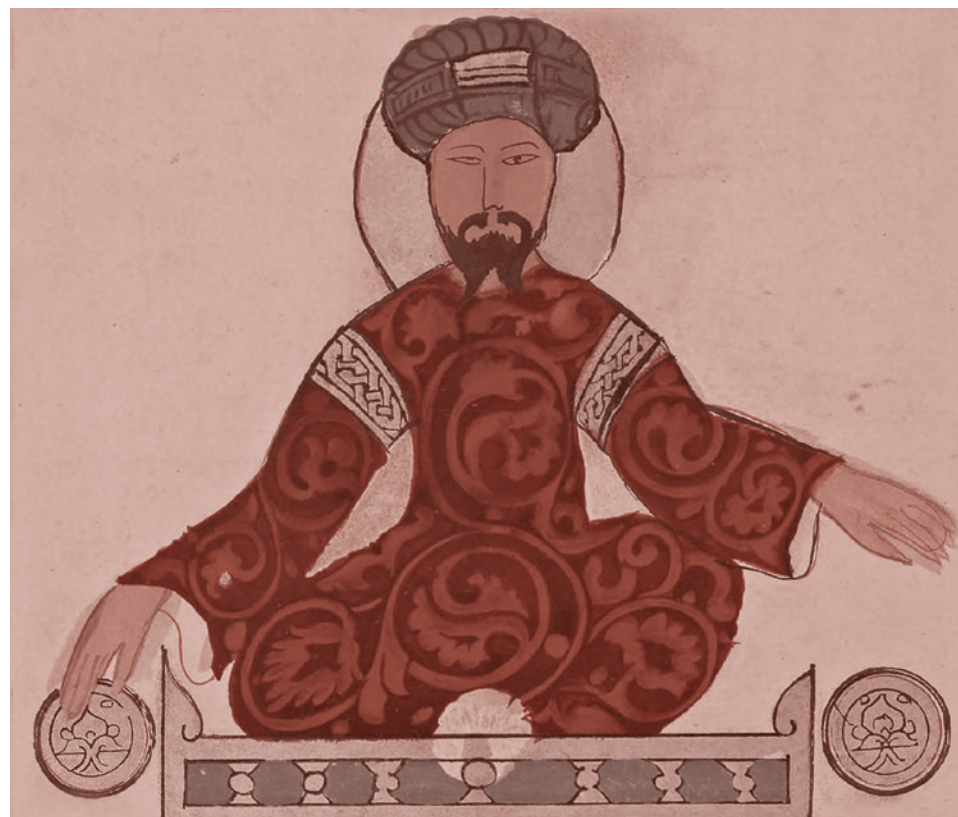
Исмаил Аль-Джазари. Портрет Саладина, ок. 1185