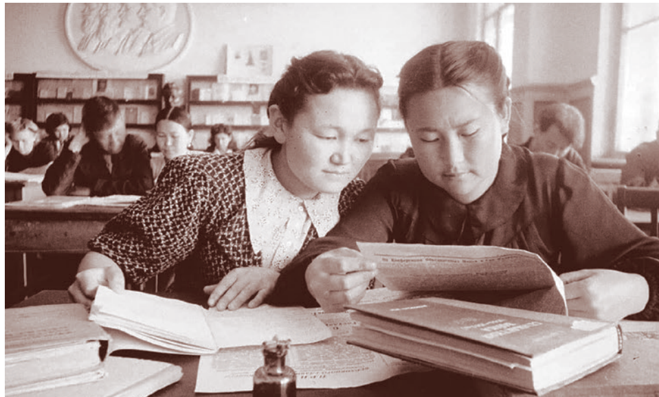
В университетской читальне. Алма-Ата, 1950-е