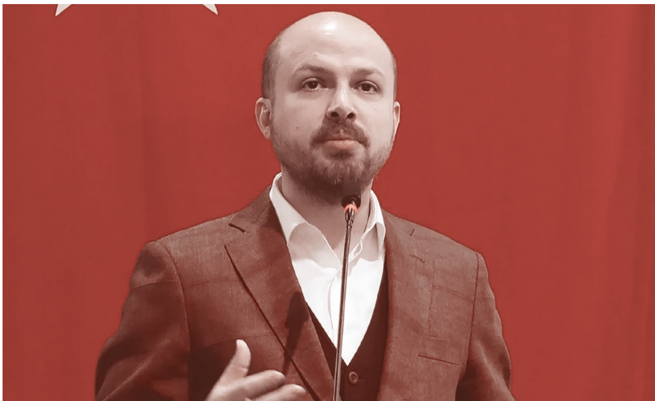
Предприниматель и сын Реджепа Эрдогана Билал Эрдоган