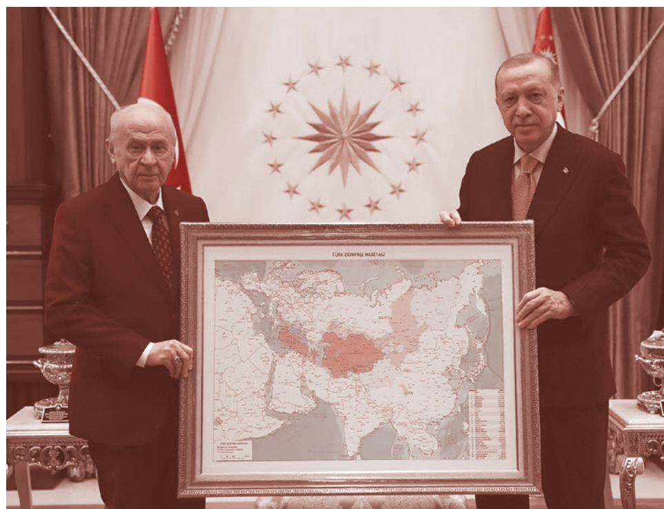
Реджеп Эрдоган и Девлет Бахчели с картой «тюркского мира». 13 ноября 2021

Вот что 17 ноября пишет крупное японское издание Nikkei Asia по поводу прошедшего Саммита ОТГ. «Проектируемый автомобильный и железнодорожный Зангезурский (другое название — Сюникский. — Прим. ред.) коридор даст Тур-