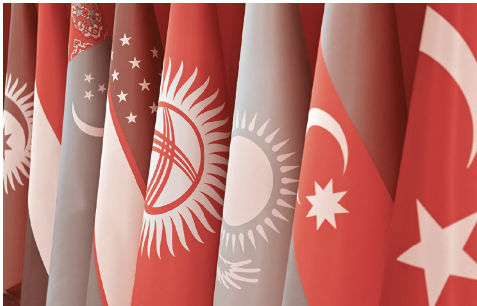
Флаги стран-участниц VIII саммита Совета сотрудничества тюркоязычных государств

В 2021 году произошла очередная попытка уничтожить коридор. На этот раз поводом стало заявление вице-премьера правительства РФ Марата Хуснуллина (представителя так называемого «татарского клана» во власти) о том, что принцип административно-территориального деления России на регионы устарел, и их нужно укрупнить до агломераций, заодно доуточнив административные границы. «Свободный Идель-Урал» тут же подсутился и снова предложил теперь уже Хуснуллина присоединить Кувандыкский и Гайский районы к Башкирии. Но идея об агломерациях «не взлетела», и вопрос в очередной раз отложили. Надолго ли?