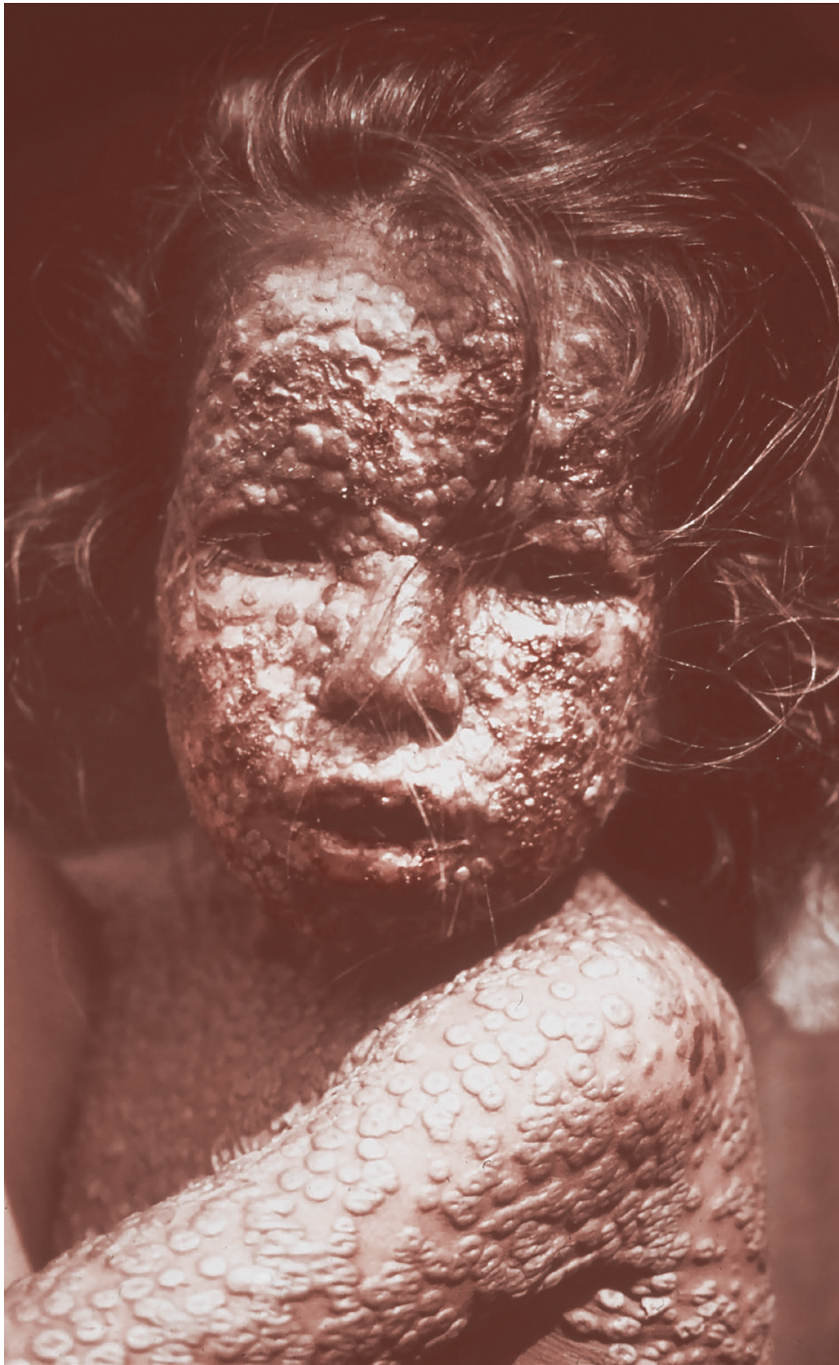
Девочка из Бангладеш, больная натуральной оспой. 1973