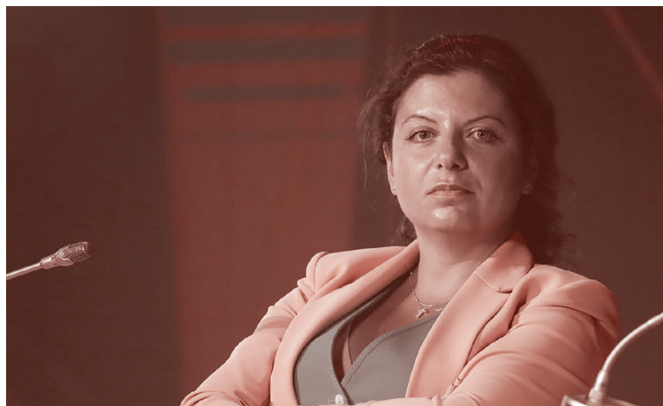
Главред Russia Today Маргарита Симоньян

Если сжать содержание документа до одного тезиса, то его формулировка такова: «Скажите спасибо, что мы вас не расстреливаем, а только вакцинируем». Что ж, видимо, таково истинное отношение правящего класса (и партии) к населению. Впрочем, партия в данном вопросе не едина, и это внушает робкие надежды.