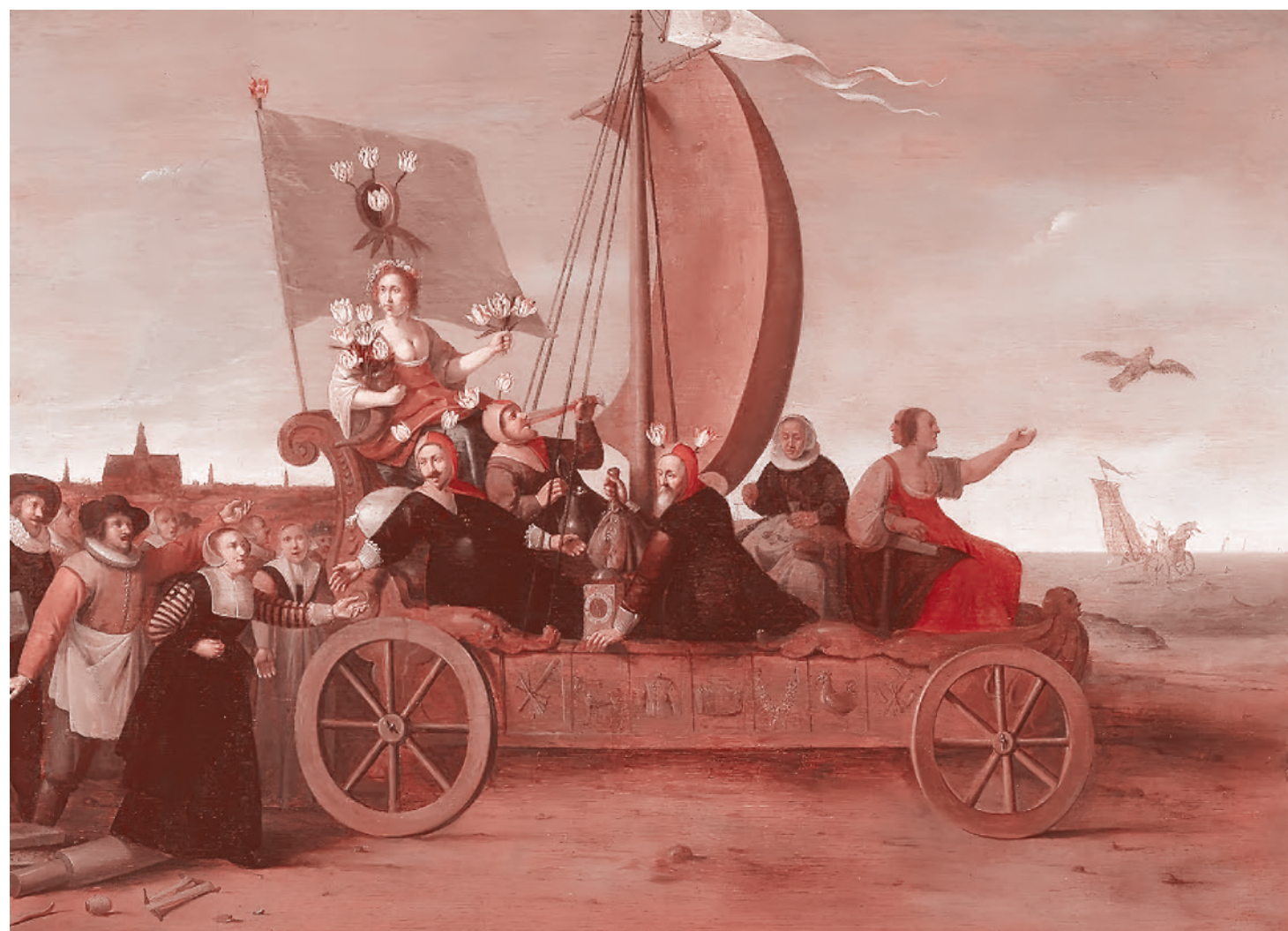
Хендрик Герритс Пот. Сумасшедший фургон флоры (Аллегория тюльпаномании). 1637–1638