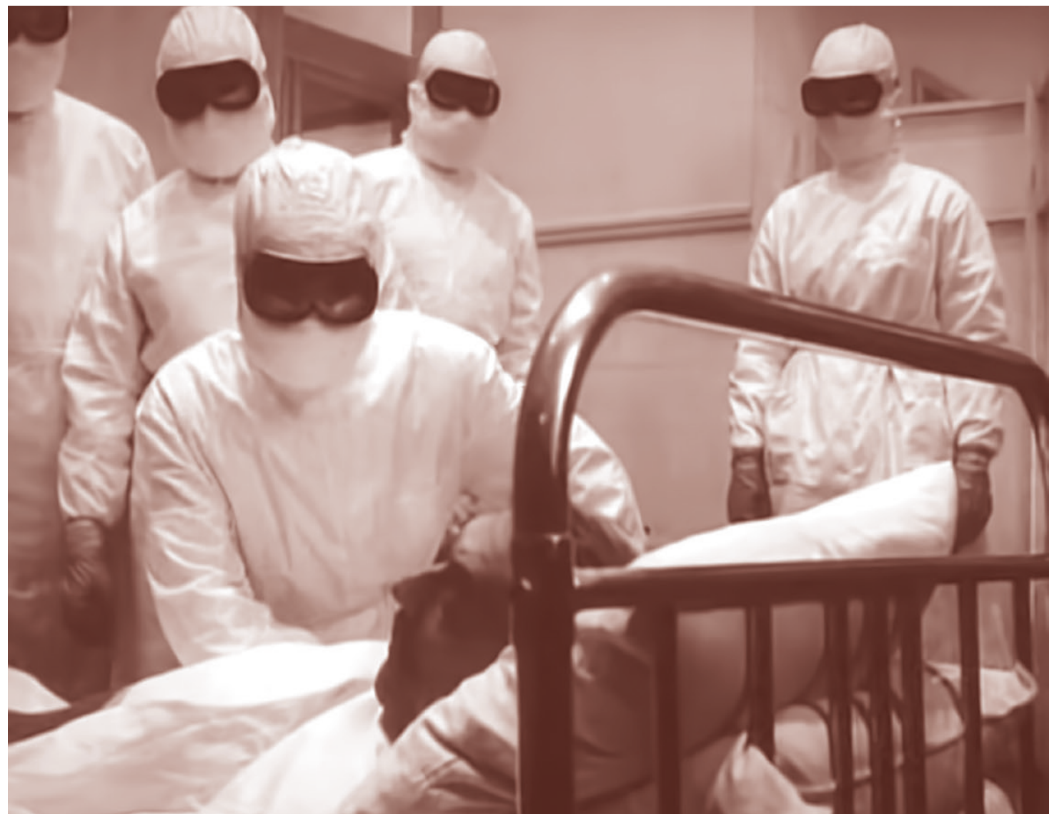
Кадр из фильма «В город пришла беда». 1966