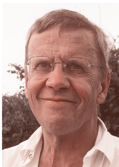
Антрополог и доктор медицины Питер Аби

смертность стала ниже, чем у невакцинированных от кори, более чем на 50%. Это наблюдение подтверждалось неоднократно