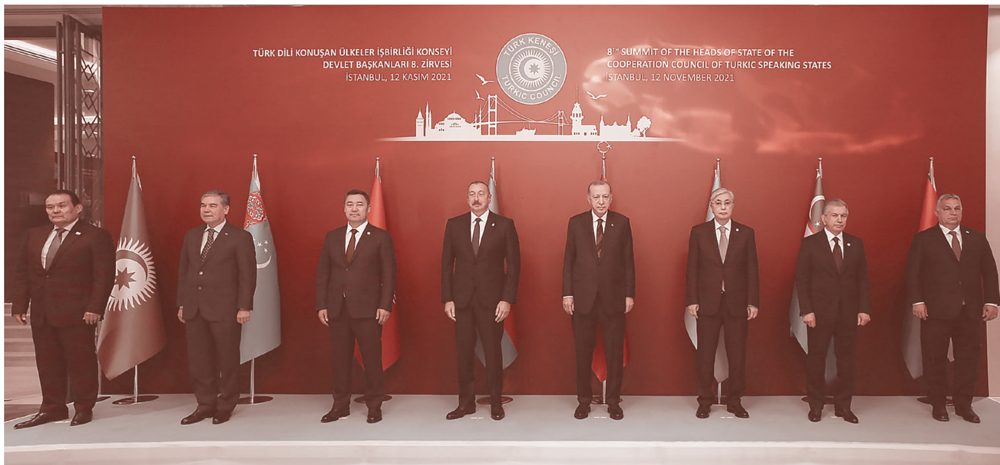
Участники VIII саммите Совета сотрудничества тюркоязычных государств. 12 ноября 2021

12 ноября в Стамбуле завершился VIII саммит государств Тюркского совета, по его итогам была подписана Стамбульская декларация и провозглашено создание новой особой экономической зоны «Туран» (TURAN-SEZ) на территории Казахстана. Название происходит от Туранской степи, исконного дома тюркских народов. Отныне термин для обозначения проекта «Великого Турана» — государства всех тюрков — существует на официальном уровне и зафиксирован в международных документах, подписанных представителями Организации тюркских государств (ОТГ — новое название Совета сотрудничества тюркоязычных государств). А 12 ноября можно считать Днем рождения «Турана».