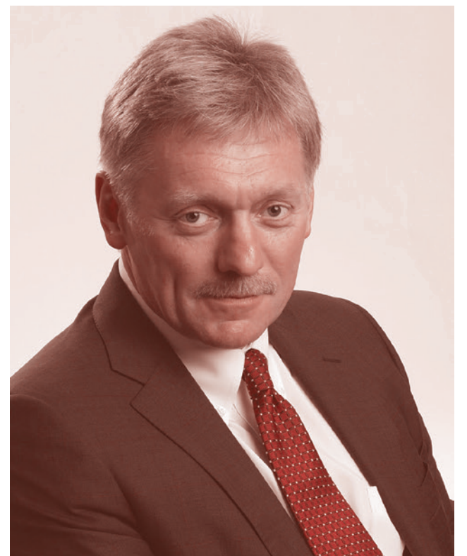
Пресс-секретарь президента РФ Дмитрий Песков