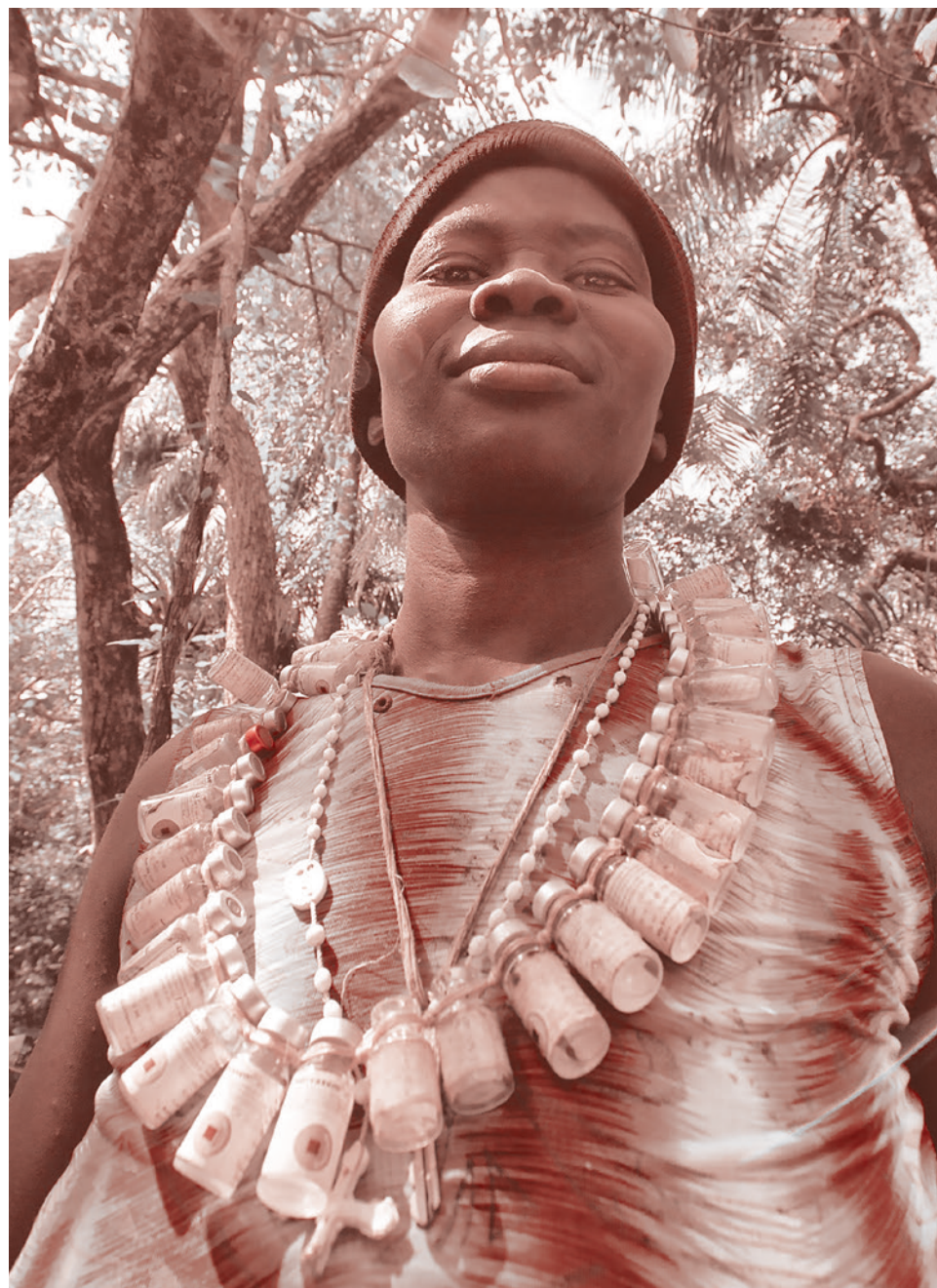
Ожерелье из флаконов от вакцин

В классической парадигме применения вакцин понятие о неспецифических эффектах не существует, так как вакцины традиционно рассматриваются как обеспечивающие специфическую защиту против конкретного инфекционного заболевания, и только. Эта парадигма не подразумевает иных воздействий на иммунную систему. Позиция же настоящих «антиваксеров», то есть убежденных противников вакцинации как таковой — с удовольствием говорить о неспецифических действиях, но ограни-