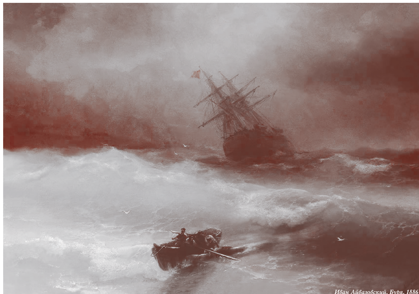
Иван Айвазовский. Буря. 1886