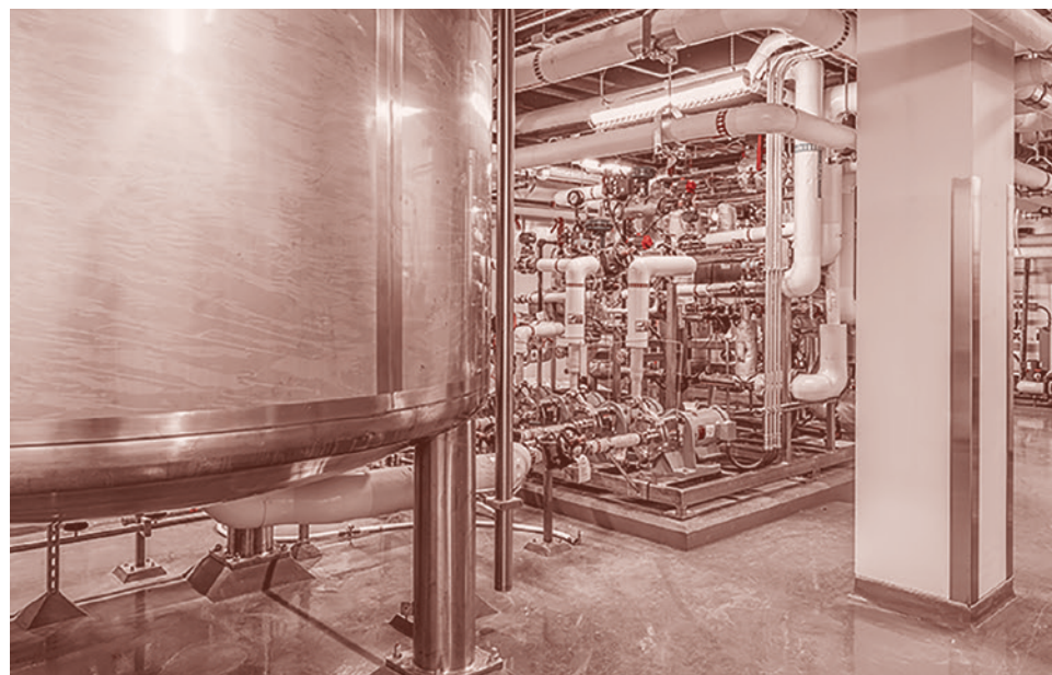
Завод по производству вакцин компании Moderna

И вот тут возникает следующее качество, и это касалось всего всегда. Это загадочное качество определенной части нашей интеллигенции, которая пользуется любым поводом, чтобы выразить свою ненависть к народному большинству. Вот любым поводом, вот пофиг дым, что является поводом, лишь бы сказать, как она, эта интеллигенция, ненавидит «эту страну».