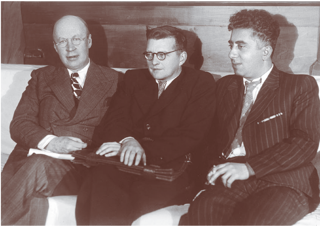
Сергей Прокофьев, Дмитрий Шостакович и Арам Хачатурян. 1945