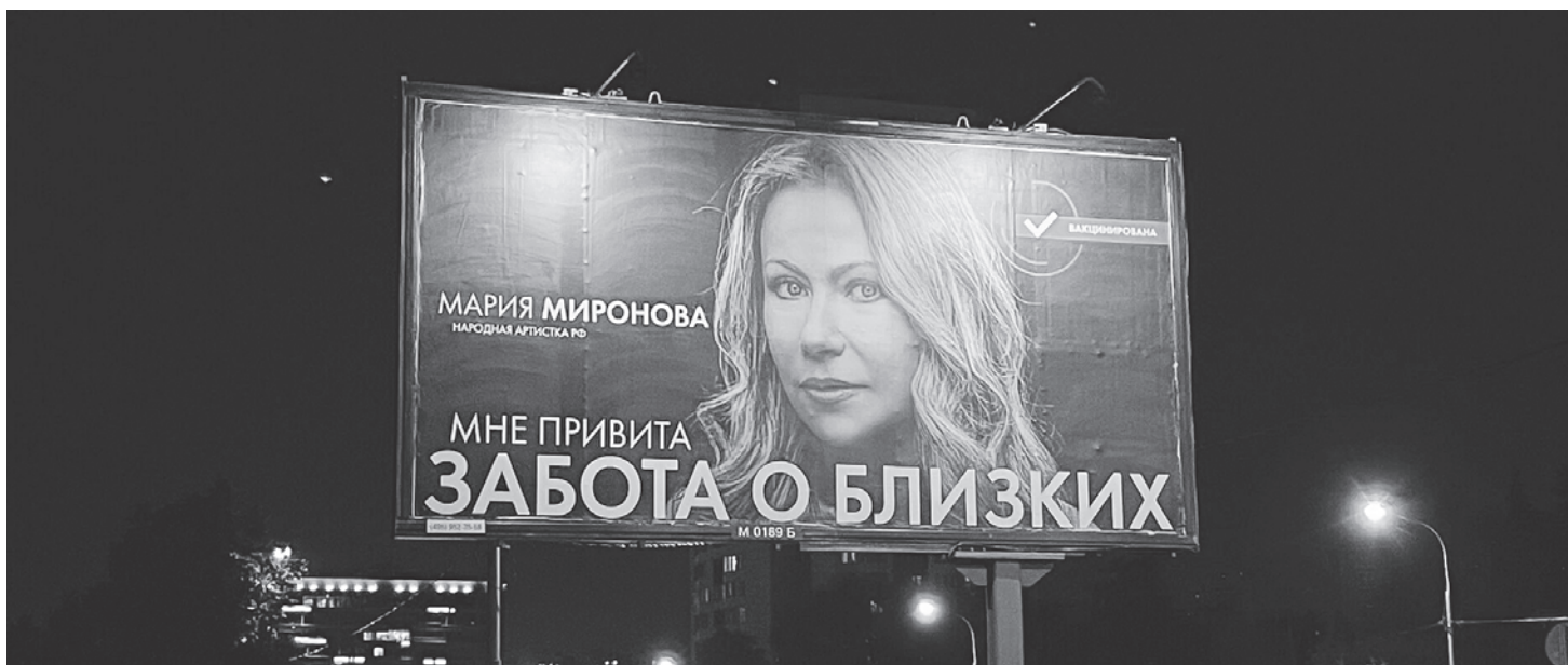
Социальная реклама в Москве

— Да я не в том смысле. Пап, ты отдохнуть хочешь?