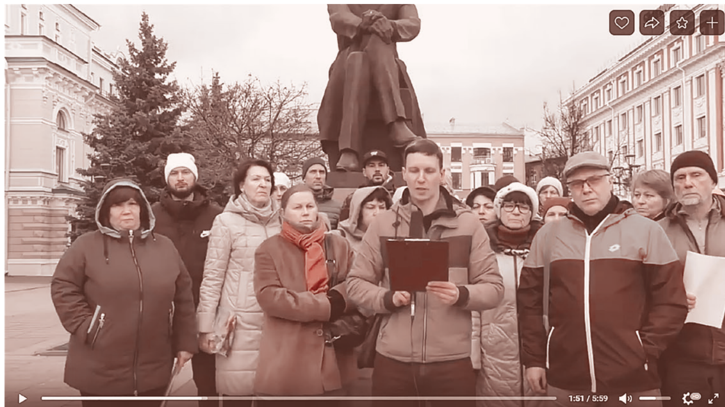
Скриншот из видео «Требования граждан России к Путину»

Действуя через страх, общество уже разделили на два лагеря: людей, готовых требовать от властей «санитарной диктатуры» и репрессий к непривитым, и тех, кто считает происходящее вакци-фашизмом. Причем не только считает так, но уже самоорганизуется на низовом уровне для неповиновения. При этом такое народное отношение к происходящему как к фашизму существует и там, где его могло бы и вовсе не быть.