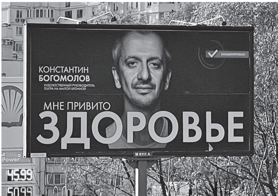
Социальная реклама в Москве

Газета «Суть времени» зарегистрирована Федеральной службой по надзору в сфере связи, информационных технологий и массовых коммуникаций (Роскомнадзор) Свидетельство ПИ № ФС77-50554 от 9 июля 2012 года