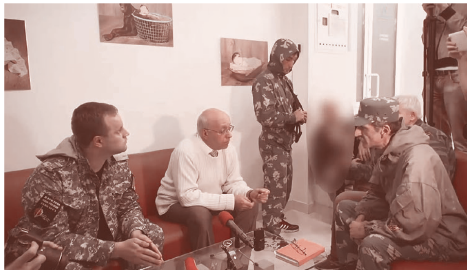
Пресс-конференция Сергея Кургияна в Донецке. 7 июля 2014

А потому что это наш народ. Вы пытаетесь коллективными усилиями сейчас создать в этом народе раскол — такой же, каким был религиозный (я не буду комментировать, к чему он привел). А народ этого не хочет. Он знает, что закон как телеграфный столб: перепрыгнуть нельзя, обойти можно. Он привык жить в условиях сомнительного соблюдения его прав. Он знает, как вести себя в этих случаях, но внутренне всё более и более напрягается. А поэтому, какие цифры вы заказываете вашим социологам, или какие цифры они высасывают из пальца, или какие цифры они добывают ответственным научным трудом — это не важно. Но эти цифры