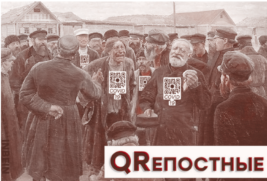
Фотомонтаж на злободневную тему, распространяемый в соцсетях

Вот пара взвешенных комментариев с местного сайта под сообщением о введении