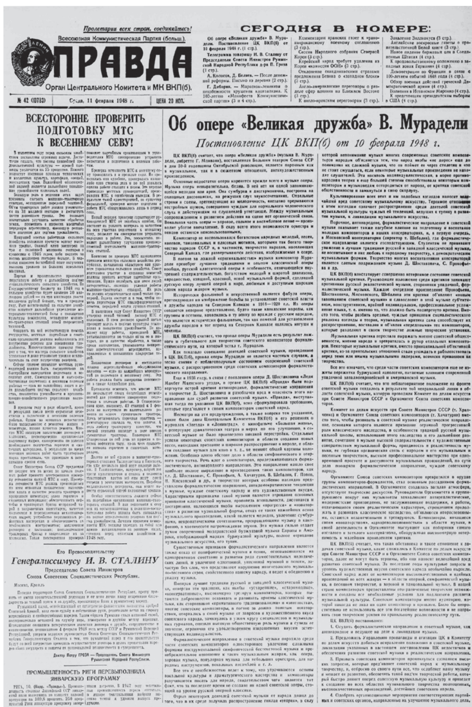
Текст постановления ЦК ВКП(б) от 10 февраля 1948 г. в газете Правда

Опера представляла собой типичный образец официального мифологизированного изображения революционного прошлого. Либретто было, мягко говоря, слабым, стихи тоже сомнительного качества. Однако эти недостатки ни в постановлении, ни в предшествующих ему обсуждениях не упоминались. Речь шла в основном о таких вопросах, как трактовка роли раз-