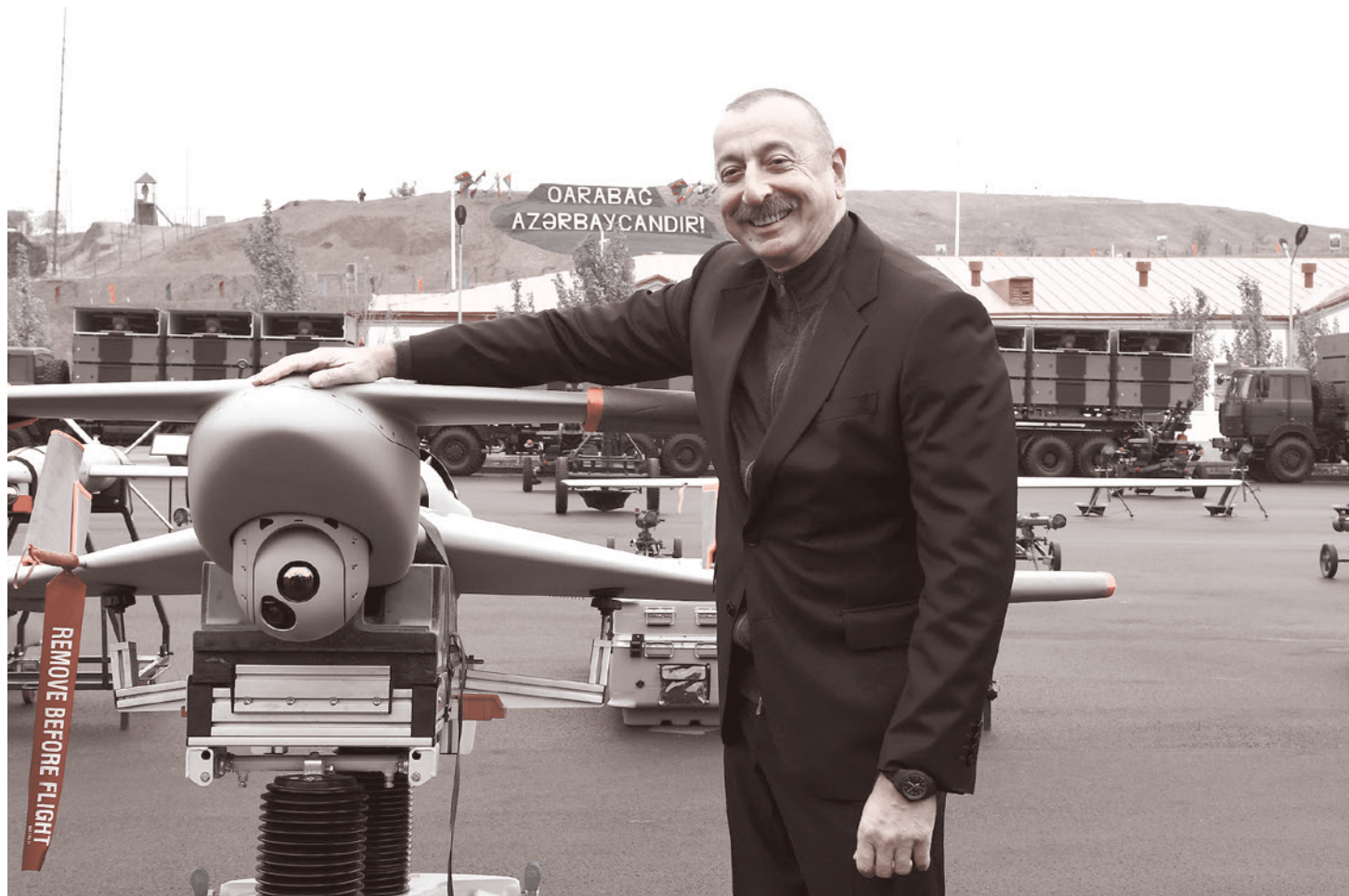
Ильхам Алиев и израильский дрон Harop

П ротиворечия между Ираном с одной стороны и Азербайджаном и Турцией с другой накапливались долго. На этом фоне, казалось бы, незначительный инцидент с иранскими грузовиками на трассе Капан — Горис стал спусковым крючком к серьезному обострению ситуации в регионе. В то же время причины, по которым Иран принял решение вступить в конфронтацию с официальным Баку, отнюдь не так просты и однозначны, и не сводятся к частному случаю захвата дальнбойщиков.