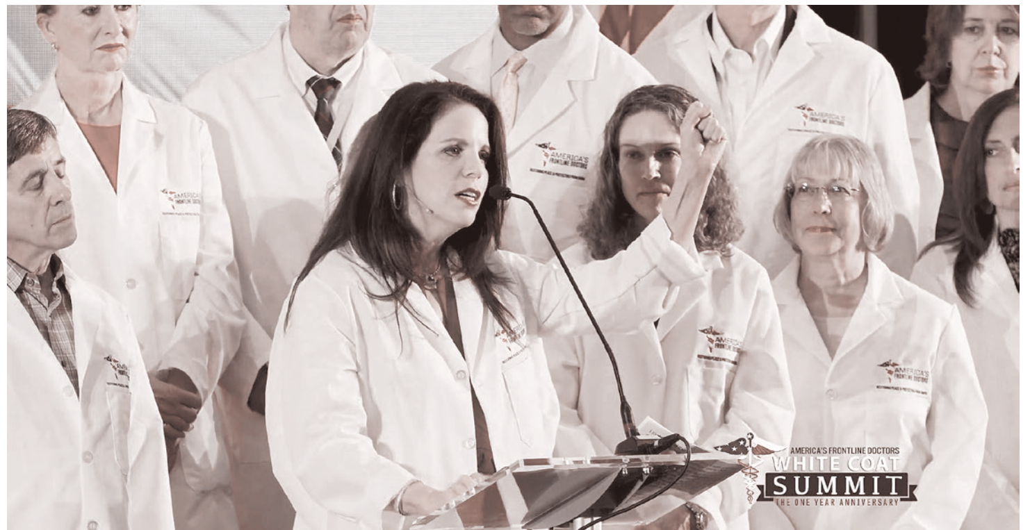
Съезд «Американских врачей с передовой»

Я буду обсуждать слабость формирующихся антиковидных «партизанских отрядов», противостоящих проковидной «регулярной армии», без всякого злорадства и без всякого заражения вирусом уныния. Я, напротив, нацелен на то, чтобы преодолеть слабость этих, еще раз подчеркну, метафорических (а то потом скажут, что вы неизвестно к чему призываете) парти-