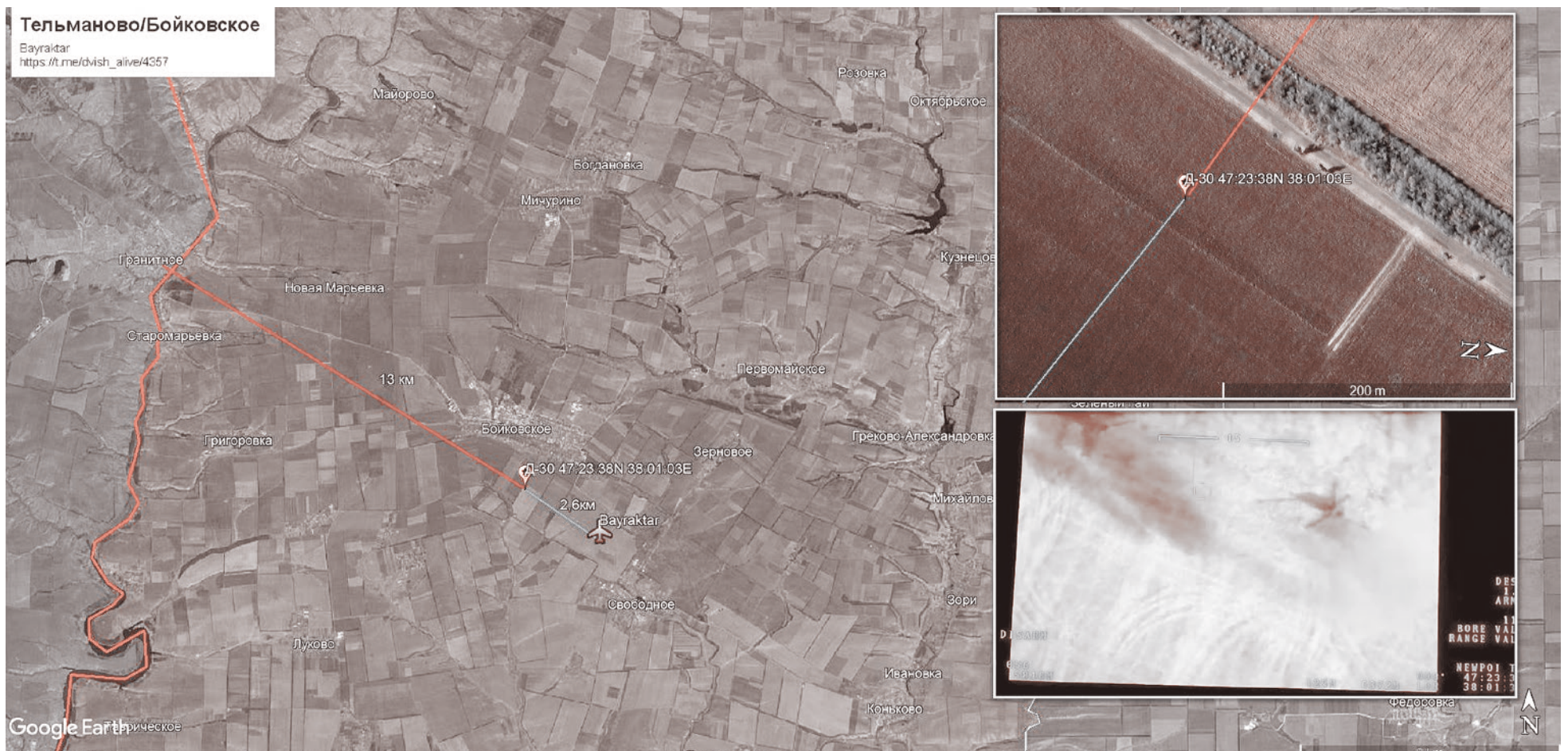
Bayraktar наносит удар по артиллерии ДНР

и методов ведения войны в отношении гражданского населения.