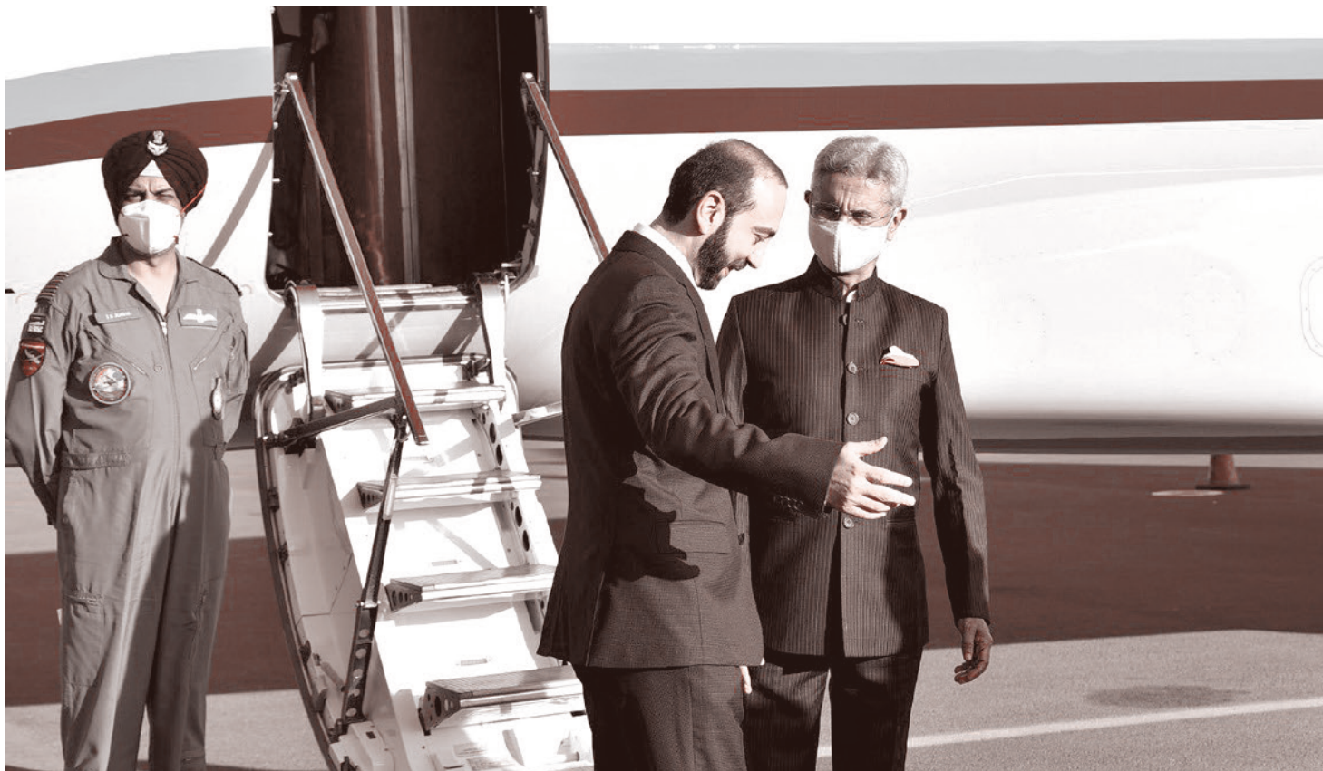
Визит главы МИД Индии в Армению, 12 октября 2021 года

16 октября представитель МИД Исламской Республики Саид Хатибзаде заявил, что обвинения президента Азербайджана в адрес Армении и Ирана являются «сфабрикованными и фальшивыми». Хатибзаде отметил, что высказывания главы Азербайджана служат интересам «только сионистского режима» и нацелены против «братских отношений» между Тегераном и Баку. Он отметил, что Иран играет ведущую роль в борьбе с наркотрафиком и за последние 40 лет тысячи иранцев погибли в «борьбе с этим зловецким явлением».