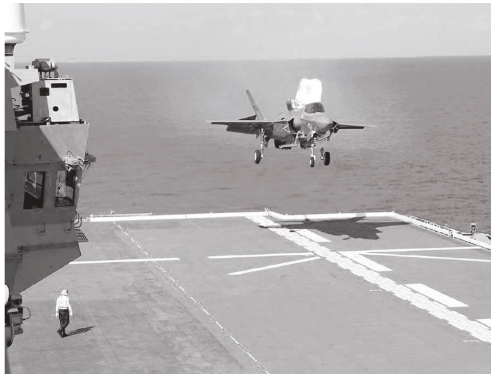
Полет американского истребителя Lockheed Martin F-35B Lightning II с японского авианосца DDH 183 Izumo, 3 октября 2021

В Японском море начались совместные российско-китайские учения «Мор-