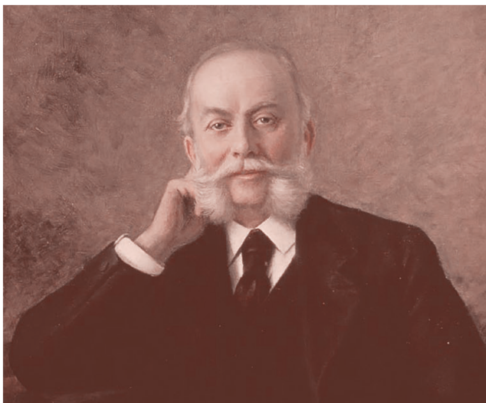
Чарльз Файзер, один из основателей компании Pfizer