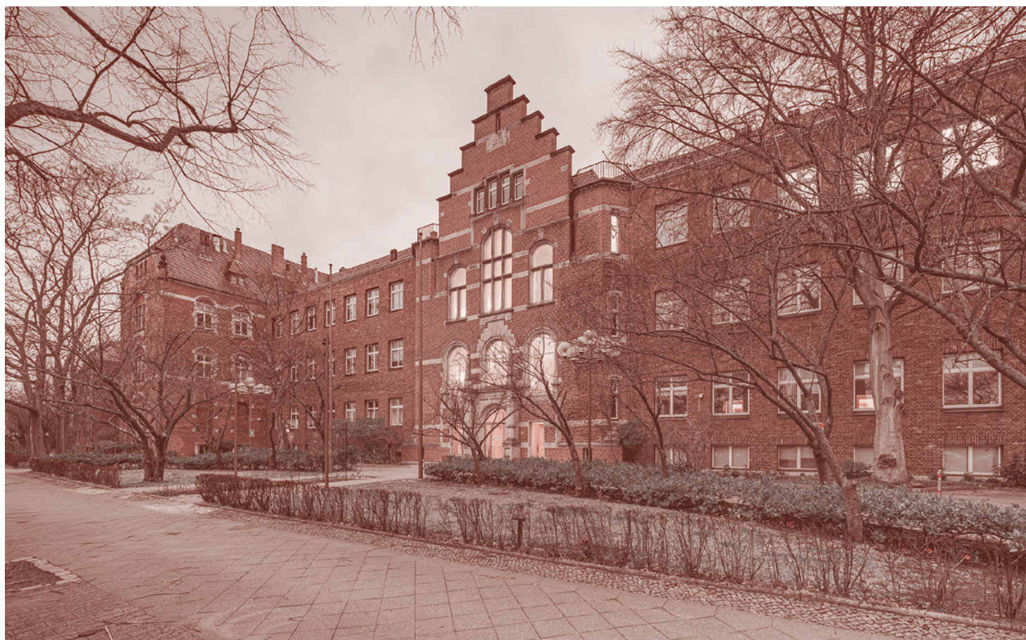
Здание Института им. Роберта Коха в Веддинге, Берлин, Германия. 2021

Это мы описали идеальную картину. В действительности все гораздо запутаннее. Необходимая информация зачастую поступает в ИРК гораздо позже. В том числе потому, что многие больницы и врачебные практики передают информацию в местные департаменты по факсу. Вот