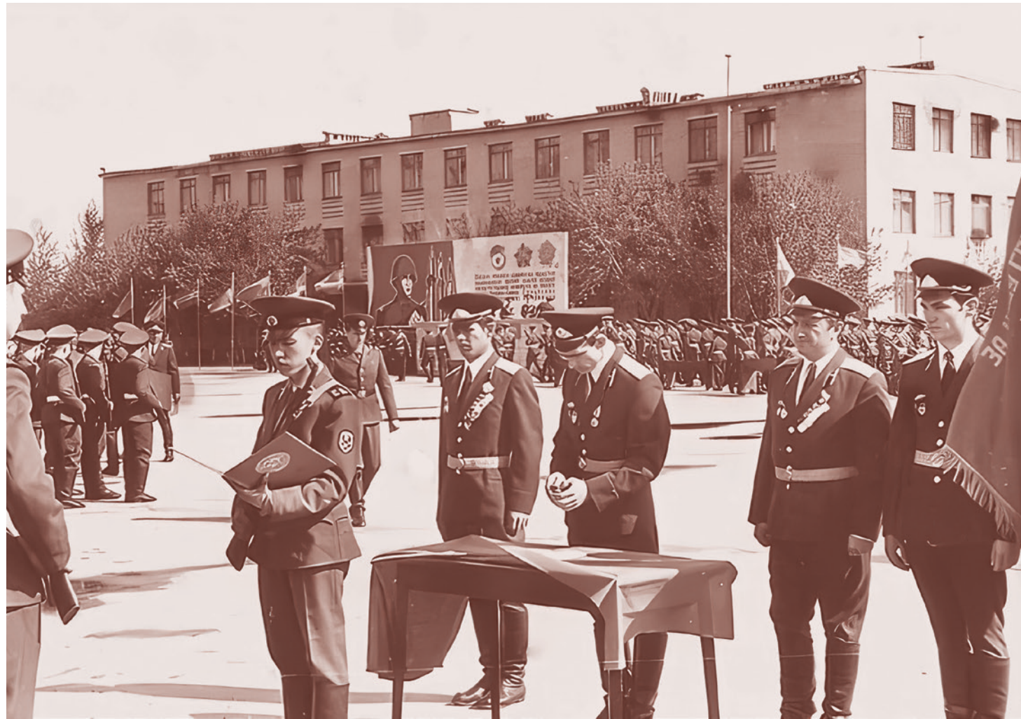
Приведение к присяге молодого пополнения в войсковой части 44102

— Тумбочку я тебе не обещаю, — снова улыбнулся мужик, — а вот новое место службы для тебя уже есть.