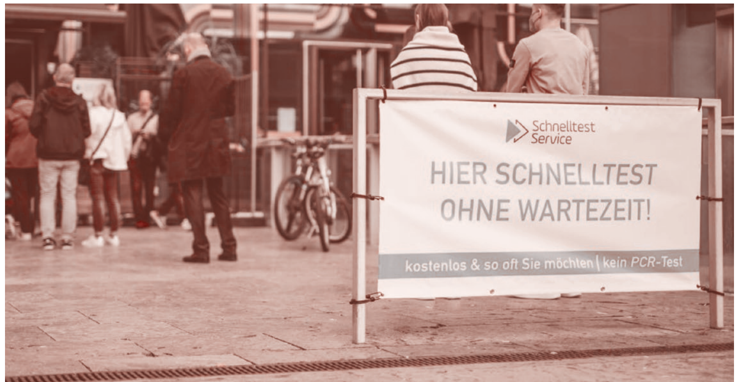
Очередь в центр тестирования

Но с введением правила 3G (от нем. geimpft — привит, genesen — выздоровел, getestet — протестирован) на территории