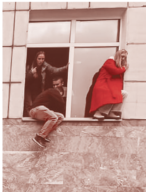
Студенты ПГНИУ пытаются спастись