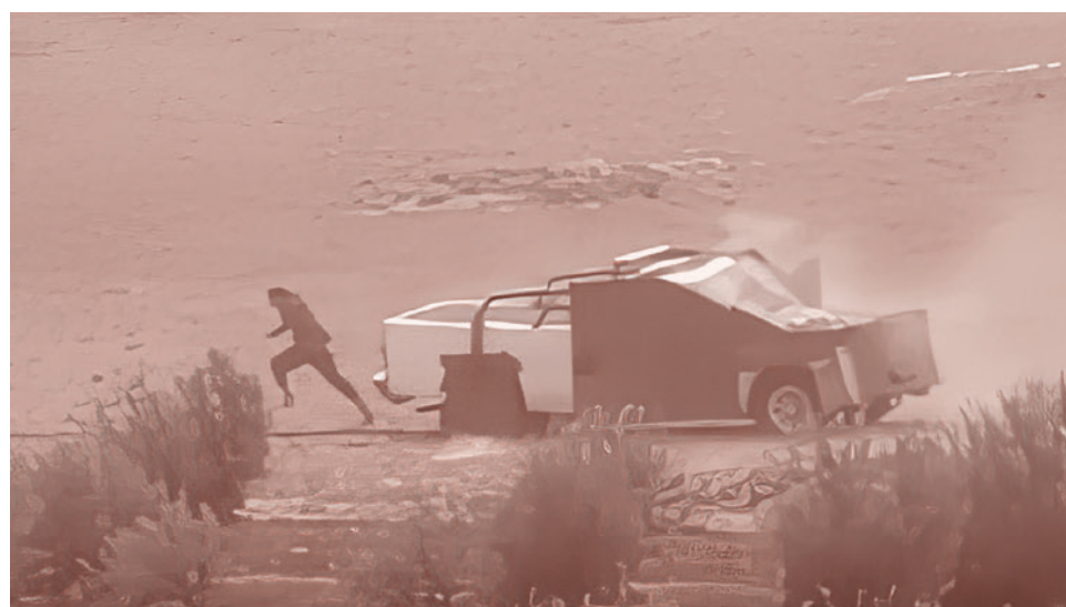
Террорист-смертник покидает автомобиль-бомбу («шахид-мобиль»). Сирия

— Вон, видишь ту бабу с блядскими глазами? Она нас тоже заметила, глядит на тебя.