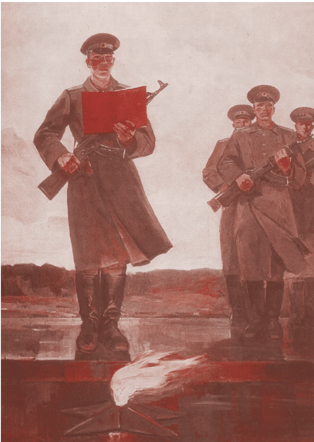
Ф. П. Успенко. Присяга. 1983

— Равняйся! Смирно! — услышал сержант и привычно подобрался, чувствуя, что его спутник сделал то же самое.