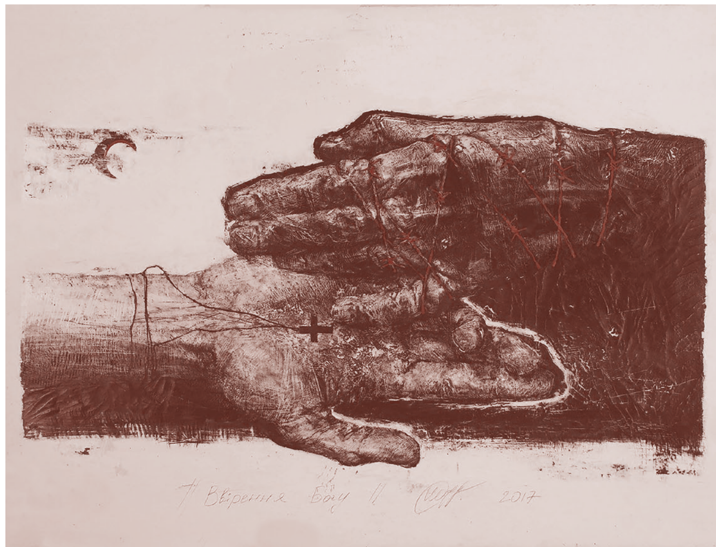
Иллюстрация к роману Виктора Гюго «Отверженные». Slava Shults

П родолжим знакомство с выступлениями участников «Саммита белых халатов», который был организован и проведен в конце июля 2021 года организацией «Американские врачи с передовой».