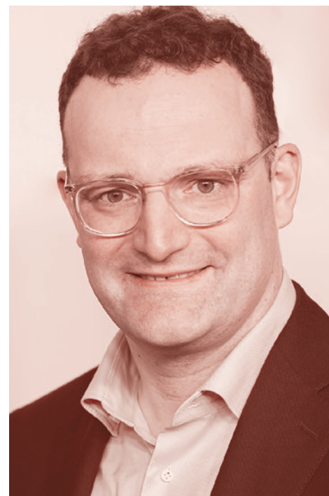
Министр здравоохранения Германии Йенс Шпан