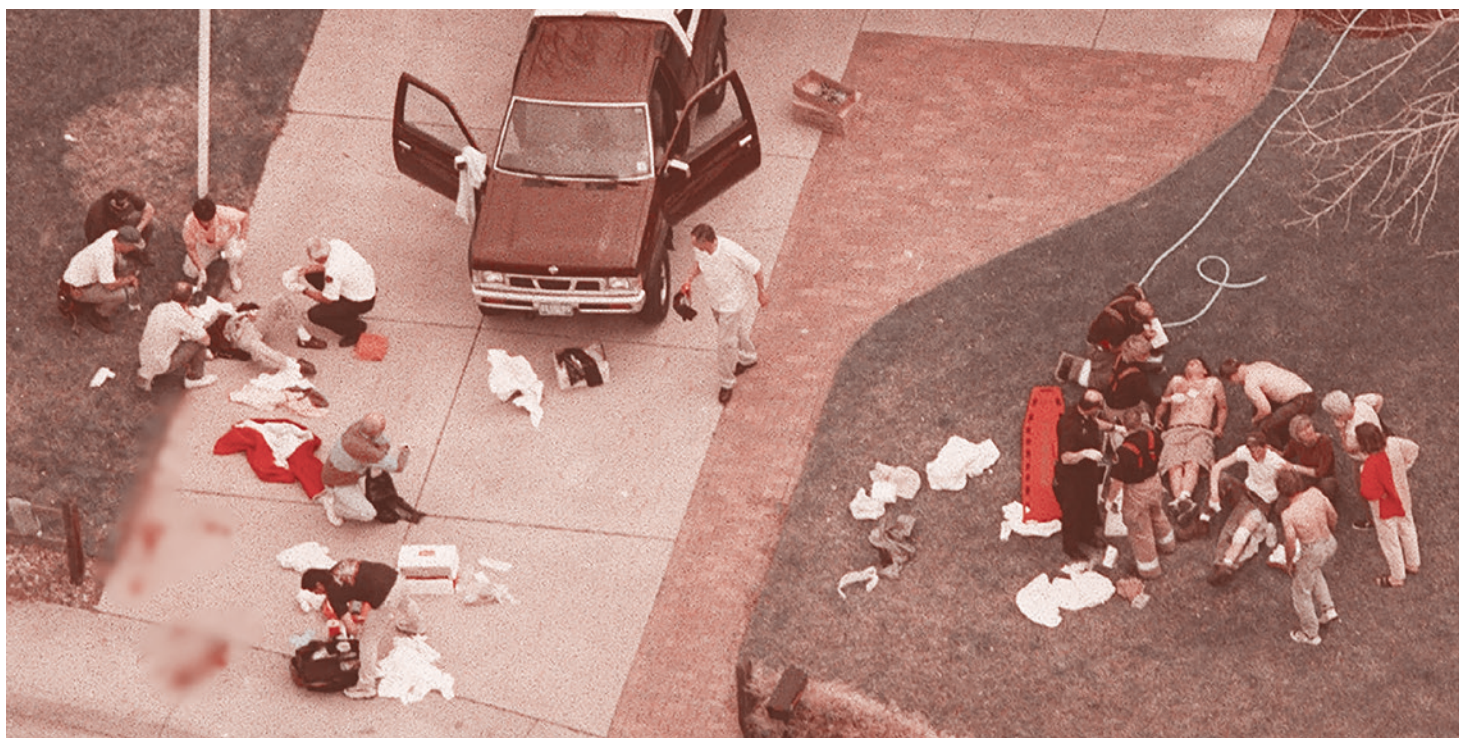
Последствия нападения Харриса и Клиболда на школу Колумбайн, США. 1999

Но глядя на участников «перформанса», как-то не очень верится, что они действительно возмущены карантинными мерами и паспортами вакцинации. На их лицах отражается странная радость