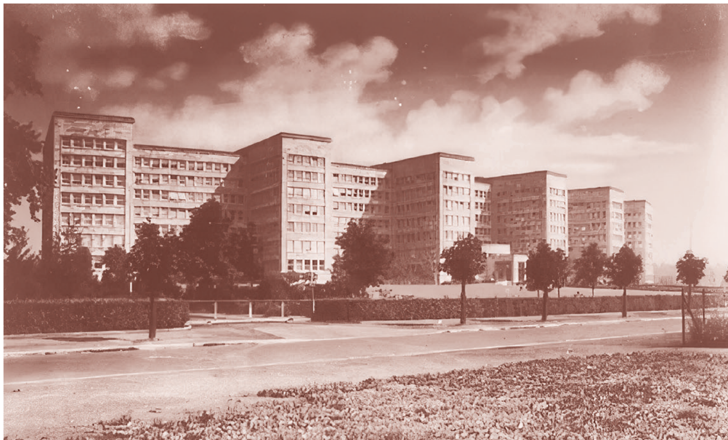
Здание компании «И. Г. Фарбениндустри». 1932

Никто не понес никакой серьезной ответственности за это преступление. Pfizer и власти нигерийского штата Кано подписали мировое соглашение, в рамках которого фармкомпания выплатила штату 75 миллионов долларов США.