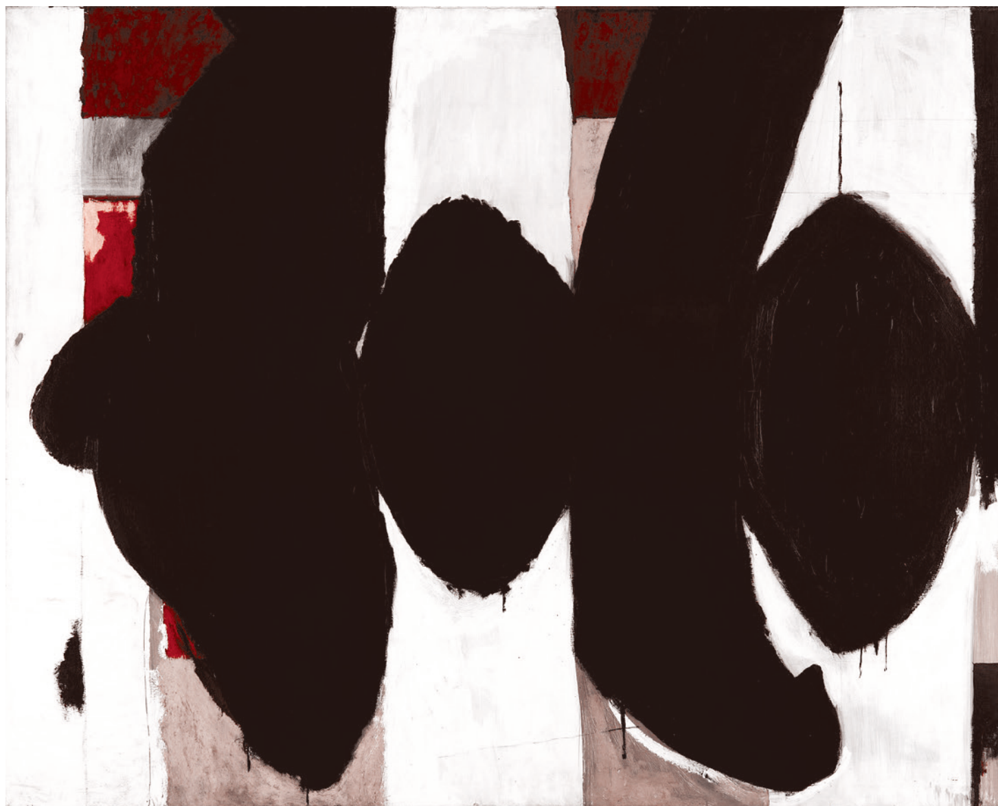
Роберт Мазервелл. «Элегия для Испанской Республики №34». 1953

О том, что американское абстрактное искусство было «проектом» ЦРУ, написано уже очень много. Это не какие-нибудь «конспирологические» домыслы, а документально доказанный факт. Хотя стоит уточнить, что никакие спецслужбы никогда не могли (и не могут) сами, в проектом порядке, создавать какие-либо стили или направления в искусстве. Утверждения типа «ЦРУ изобрело рок-музыку», которые можно услышать порой из уст серьезных людей, говорят об их недостаточной компетентности в вопросах искусства. Однако спецслужбы всё-таки могут очень многое. Они могут выдвинуть и направить в определенное русло уже возникшие или зарождающиеся художественные явления, помогать финансами, связями, пиар-кампаниями (с нужными им акцентами), организацией громких мероприятий, медийной поддержкой (опять-таки с акцентами, рассчитанными на определенный результат) и т. д.