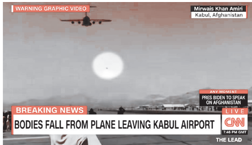
«Тела падают с самолета, покидающего кабульский аэропорт»

по 15 августа, пока талибы* захватывали Афганистан. Общий вывод: в Белом доме царил растерянность и апатия. Что это — профнепригодность, воля случая или точно рассчитанный план по хаотизации региона, который заодно задел и самих американцев?