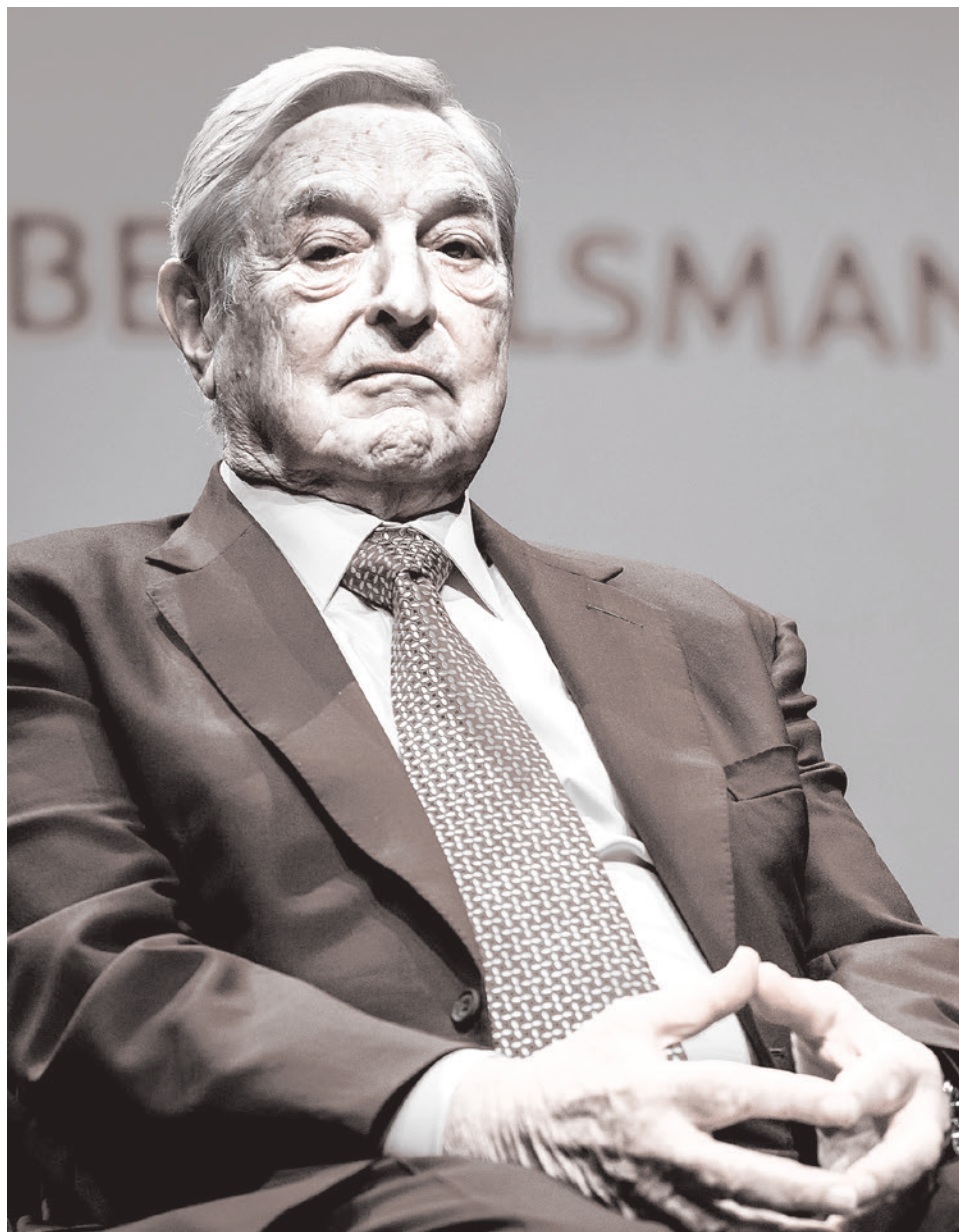
Джордж Сорос

Но вбрасывали бюллетени на местах в США отнюдь не китайцы — это делали нанятые на деньги Сороса, Цукерберга и других спонсоров работники избирательных комиссий. Эти люди попали в участковые избирательные комиссии (УИКи) потому, что из УИКов под предлогом коронавируса и заботы о здоровье были уволены местные пенсионеры. А наняли туда «беспартийную» молодежь из BLM и феминистских организаций.