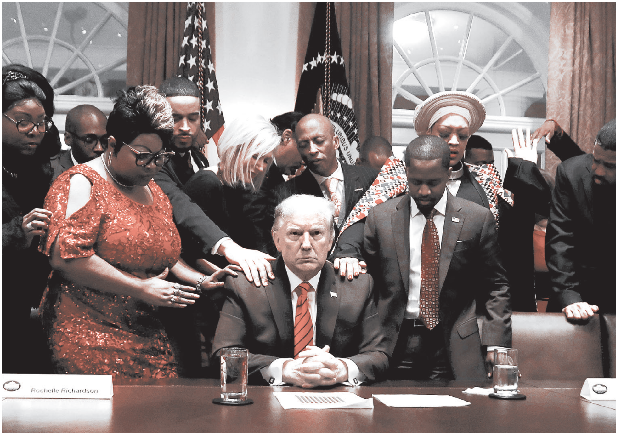
Чернокожие религиозные и политические лидеры молятся за Трампа