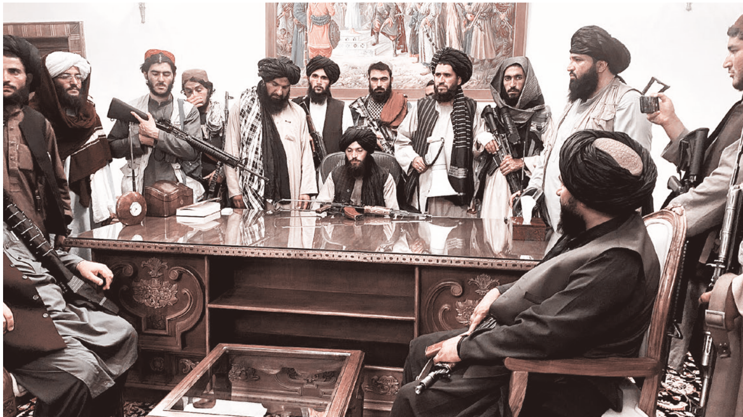
Боевики за столом в президентском дворце Кабула, 15 августа 2021 года

Да, в Афганистане осуществляется не фиаско американской политики, а нечто совсем другое. Об этом же говорит закрытая информация. Мы же видим, как они ухмыляются. Налицо серьезные концептуальные разработки, связанные с так