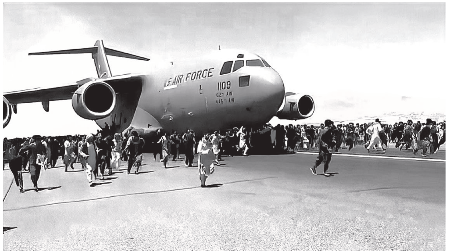
Жители Кабула пытаются зацепиться за взлетающий американский военный транспортный самолет

Попробуйте перечитать то, что было написано в различных уважаемых СМИ, или пересмотреть то, что говорилось в разных передачах по поводу развития процесса в Афганистане где-нибудь пару месяцев назад. И вы убедитесь, что не только какие-то американские специалисты, не только сами афганцы, противостоящие талибам*, но и наши эксперты, причем очень умудренные, хорошо понимающие внутриафганскую специфику, говорили, что талибы* застрянут, что их атаки захлебнутся или что всё это будет тянуться безумно долго. А потом мы увидели то, что мы увидели в кабульском аэропорту.