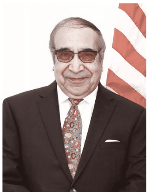
Али Ахмад Джалали в 2017 году

Экс-глава МВД Афганистана Ахмад Джалали принял на себя обязанности главы переходной власти в стране, сообщает Al Arabiya. По информации, полученной из дипломатических источников, Джалали «избран главой переходного правительства Афганистана». Отмечается, что он «принял на себя обязанности главы временной администрации» страны.