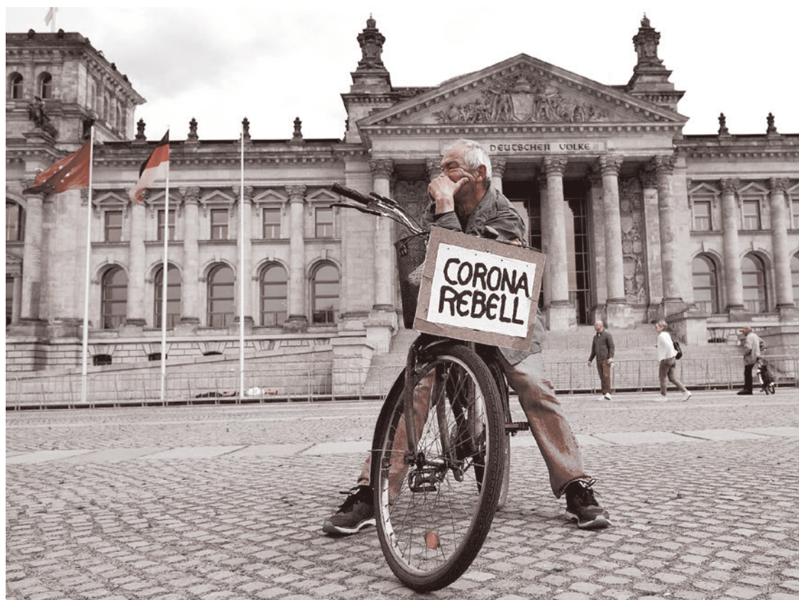
Противник правительственных мер по борьбе с COVID-19 у Рейхстага, 23 мая 2020 года

В Германии никакой альтернативы карантинам и вакцинам не предвидится. В стране действует несколько протестных