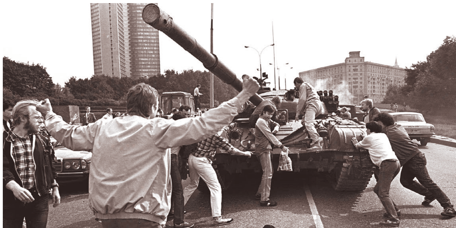
Рядом с Домом Советов во время ГКЧП

Крючков был уже достаточно сильно болен. Я понимал, что эта болезнь не сказалась на мышлении Владимира Александровича. Но тем не менее рискнул задать уточняющий вопрос (что делал крайне редко). Разу-