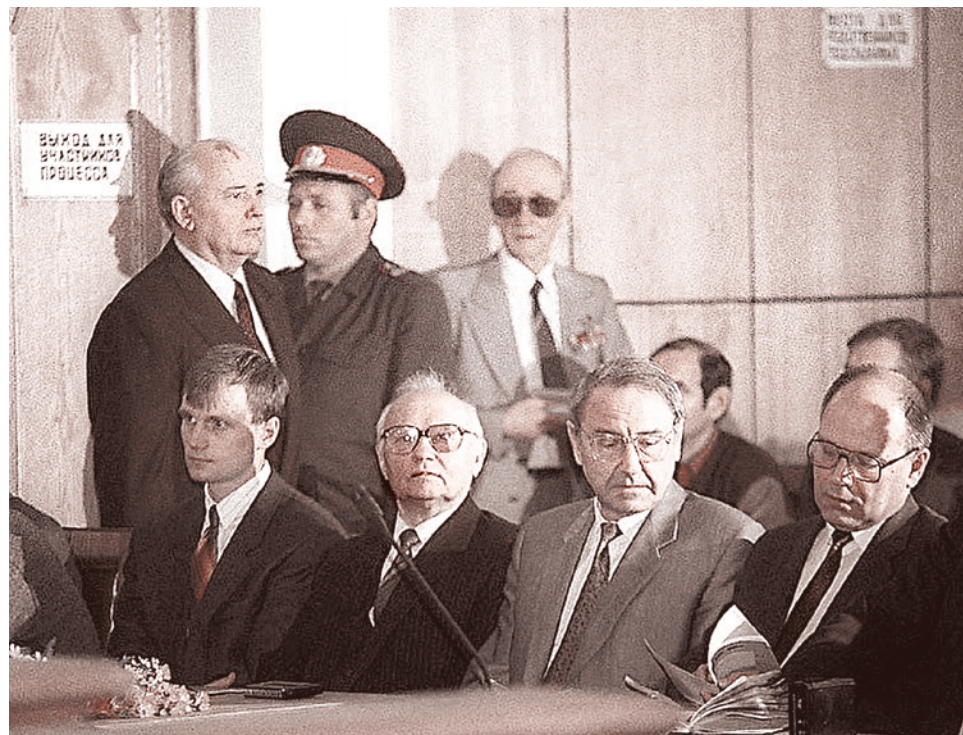
Суд над ГКЧП: Крючков на скамье подсудимых рядом с Олегом Баклановым (справа). Михаил Горбачев (слева, стоит) был приглашен как свидетель

И вот тогда возникает вопрос: что дальше? Иначе говоря, какой демографический и иной потенциал нужен для существования в формирующемся мире? Вряд ли мы хотим быть наравне с одной из китайских провинций. И вряд ли нашим интересам отвечает то, что сейчас произошло в Афганистане.