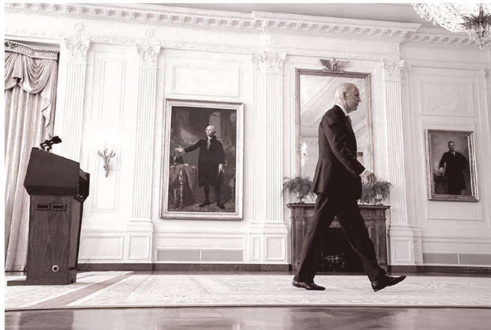
Президент США Джо Байден сошел с подиума в Белом доме после произнесения речи об Афганистане, 16 августа 2021 года

* — Организация, деятельность которой запрещена в РФ.