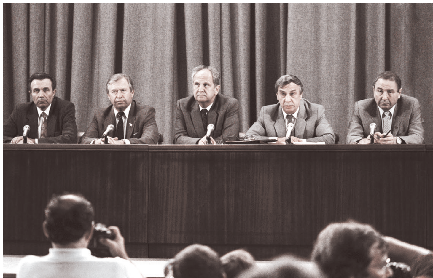
Пресс-конференция ГКЧП 19 августа 1991 года