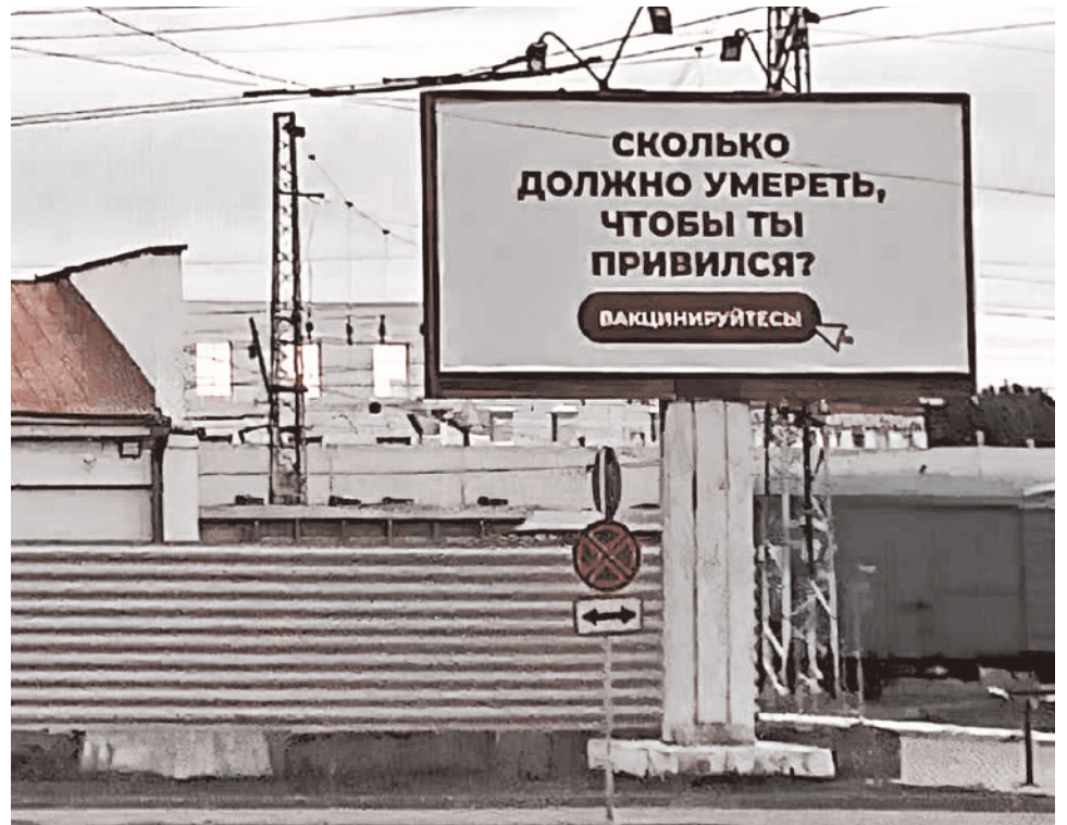
Примеры социальной рекламы, призывающей граждан России вакцинироваться

«Мы знаем, что основными факторами риска болезней сердца и инсульта являются неправильное питание, физическая инертность, употребление табака и злоупотребление алкоголем. Все эти факторы риска в 2020 году резко усилились. По распоряжениям Роспотребнадзора были запрещены прогулки