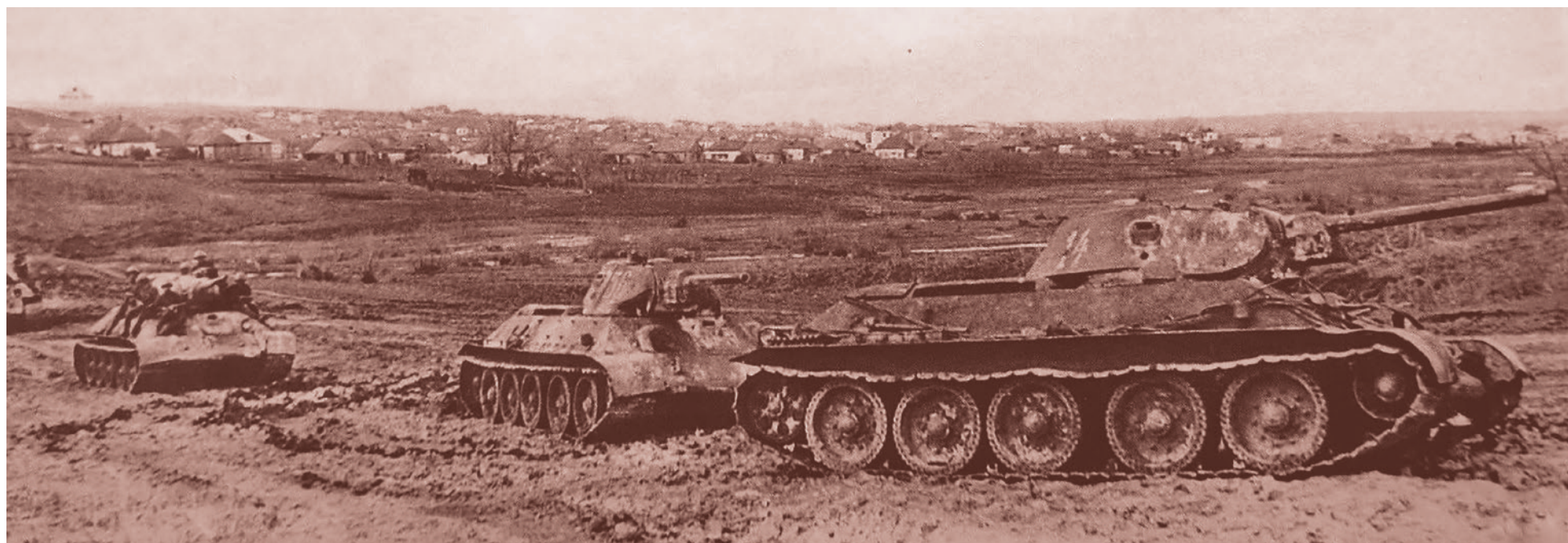
Советские танки Т-34 перед атакой, Юго-Западный фронт. Май 1942