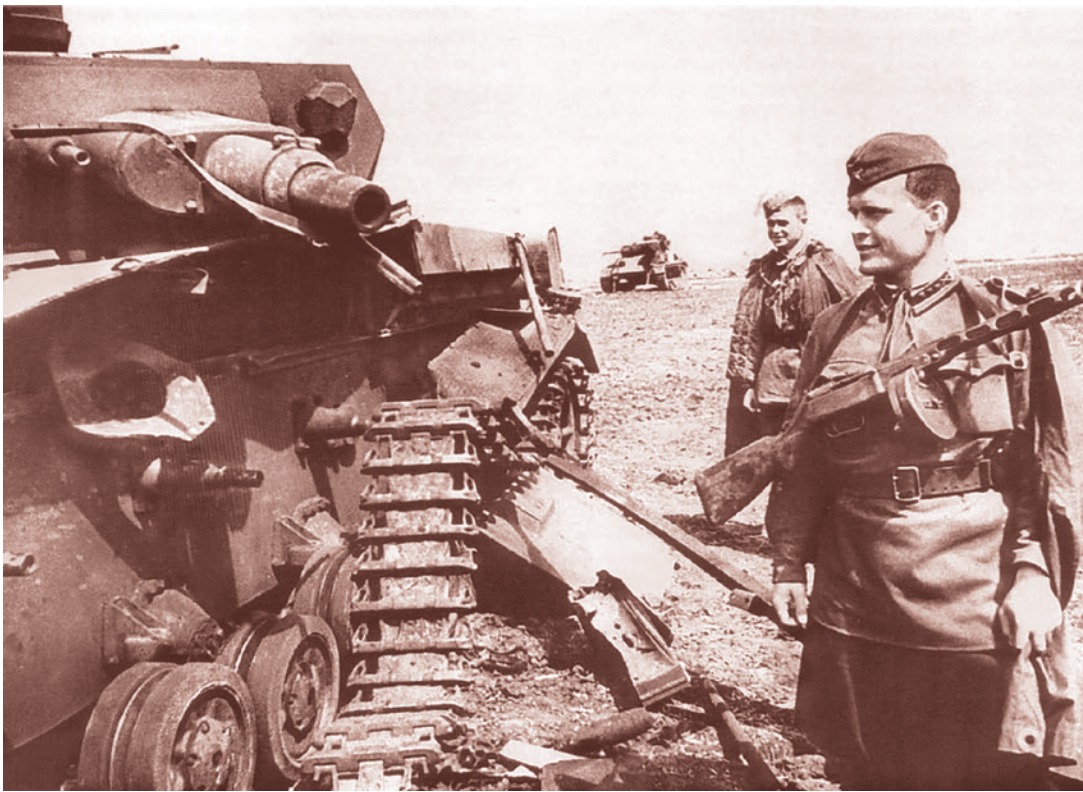
Артиллеристы советской 6-й танковой бригады осматривают подбитые немецкие танки. 1942

Советское руководство видело ситуацию иначе. Важнейшим фактором