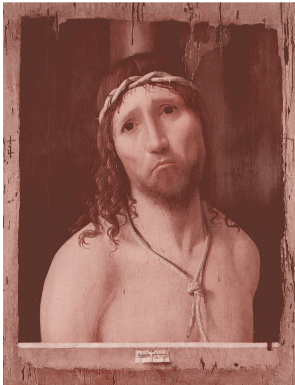
Эссе вотто. Антонелло да Мессина. 1473

Может быть, ответ на вопрос о том, кто хочет покончить с гуманизмом, и будет одновременно ответом на вопрос о том,