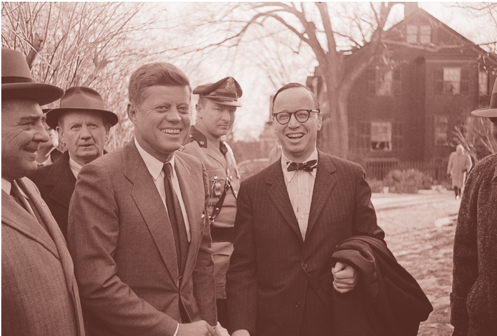
Джон Кеннеди и Артур Шлезингер, 1961

нах — в Африке, в Азии, но измельчают, утратив универсализм (останутся идеологии модернизации и национализмы местного масштаба). Подлинной ценностью остается лишь свобода — свобода слова, мнения, мысли. Пассионарность же западной талантливой молодежи будет находить выход в университетских карьерах, технике и самовыражении через искусство, хотя будет при этом неминуемо угасающей (заметим по ходу, как всё это приближается к «концу истории» Фукуямы).