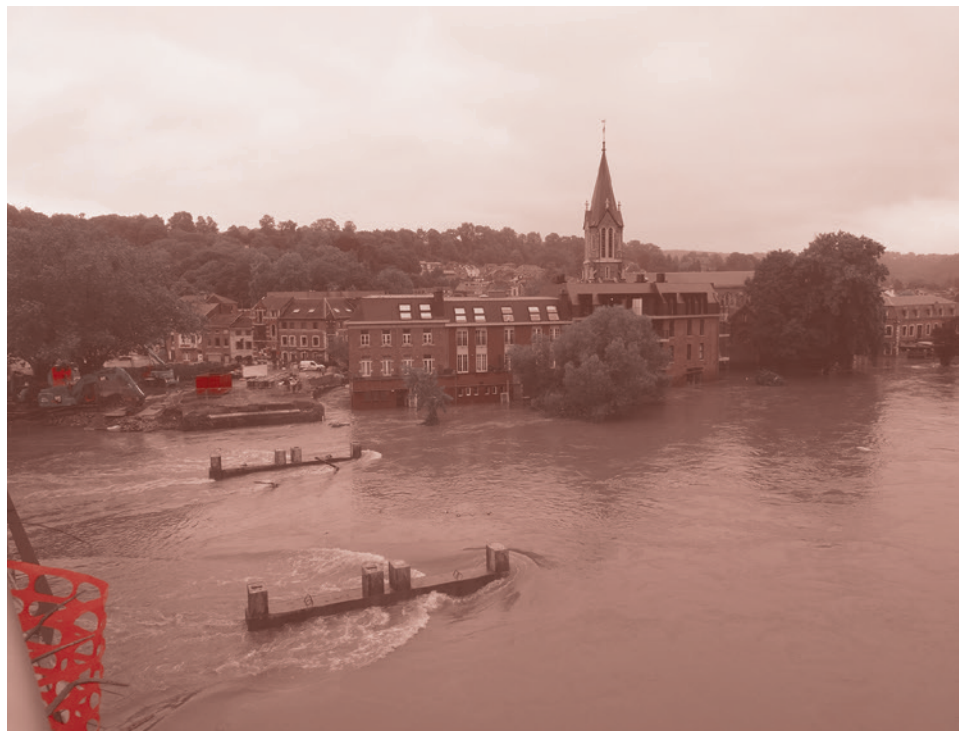
Долина реки Урт, вид с нового моста. 16 июля 2021

На фоне общенационального горя в стране разразился неприятный скандал с