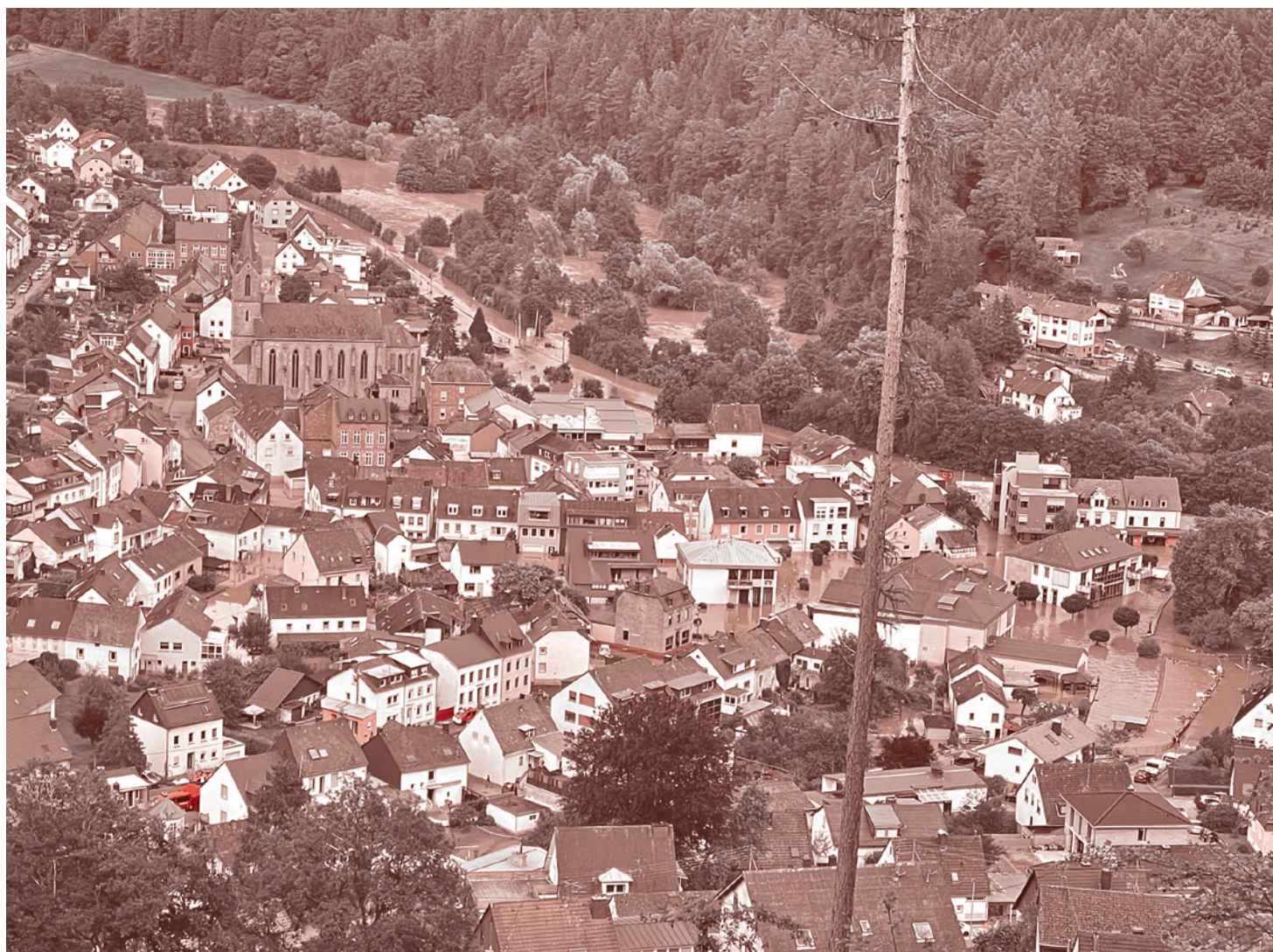
Наводнение в Корделе, Рейнланд-Пфальц, Германия. 15 июля 2021

Еще есть система оповещения при помощи сирен, но далеко не во всех регионах Германии они работают — после окончания холодной войны многие города и регионы полностью отказались от них, как,