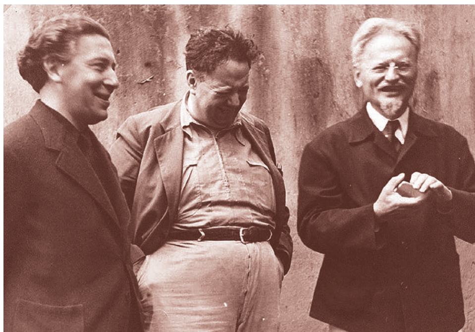
Андре Бретон, Диего Ривера и Лев Троцкий в Мексике, 1938

В манифесте не указано, как именно возможно строить общество, сочетая в нем, с одной стороны, дисциплину и под-