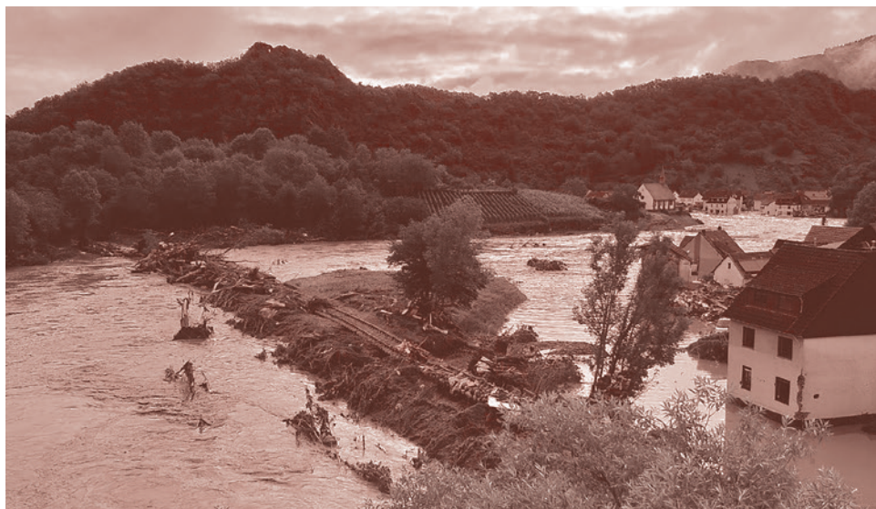
Наводнение в Альтенафе, Рейнланд-Пфальц, Германия. 15 июля 2021

Никогда ранее эта карта не использовалась. Все перечисленные выше проблемы замалчиваются политиками. Ведущие политики — как Германии, так и Европы — единогласно списывают причину катастрофы на «глобальное изменение климата». Сразу после катастрофы с такими заявлениями выступили президент ФРГ Франк-