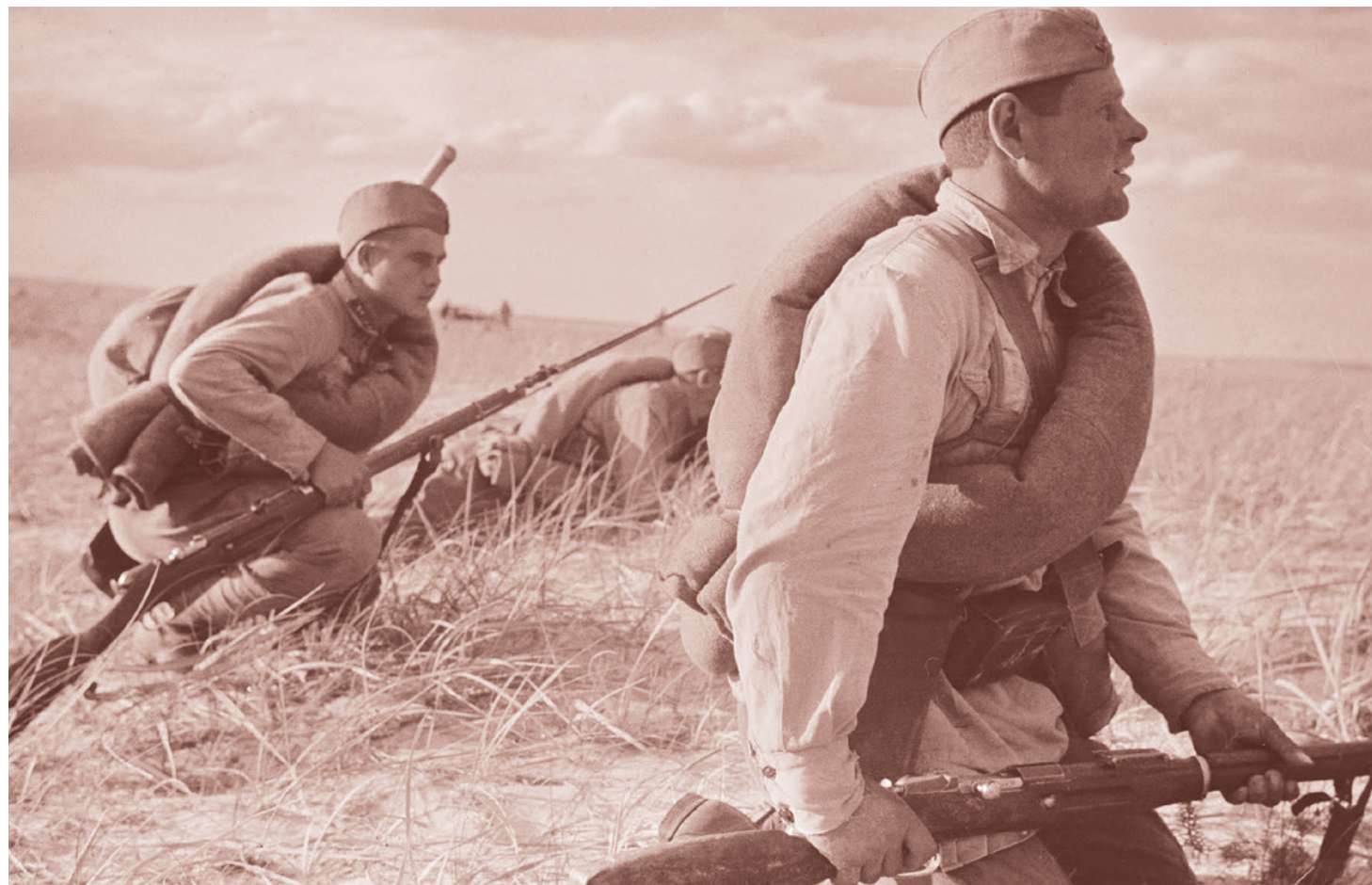
Советские солдаты в поле во время наступления на Харьковском направлении. 1942

Эти строки напишет чилийский поэт и политик Пабло Неруда, восхищенный советским триумфом, увидевший в нем зарю будущей победы и благородную месть за всё причиненное фашизмом горе. Давайте же и мы пристально и вни-