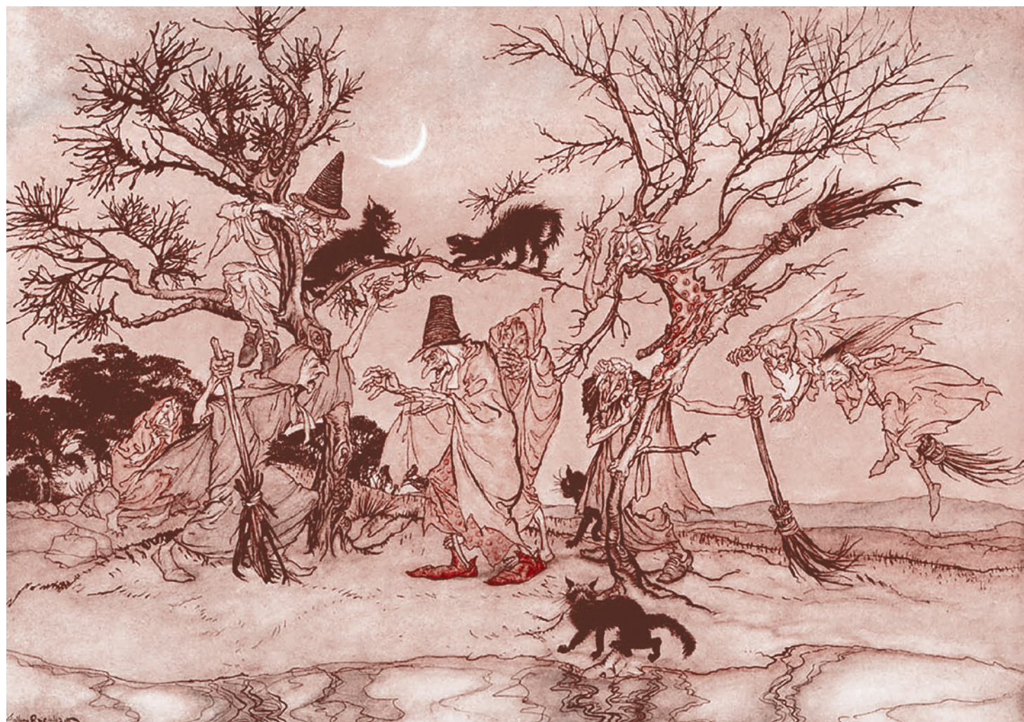
Рэксэм Артур. Шабаш ведьм. Начало XX века

На сегодняшний день, помимо четырех вакцин от COVID-19, применяемых в России, более сотни вакцин по всему миру проходят через разные этапы клинических испытаний. Вакцины семи иностранных производителей одобрены Всемирной организацией здравоохранения (ВОЗ). Вероятно, их вскоре станет больше.