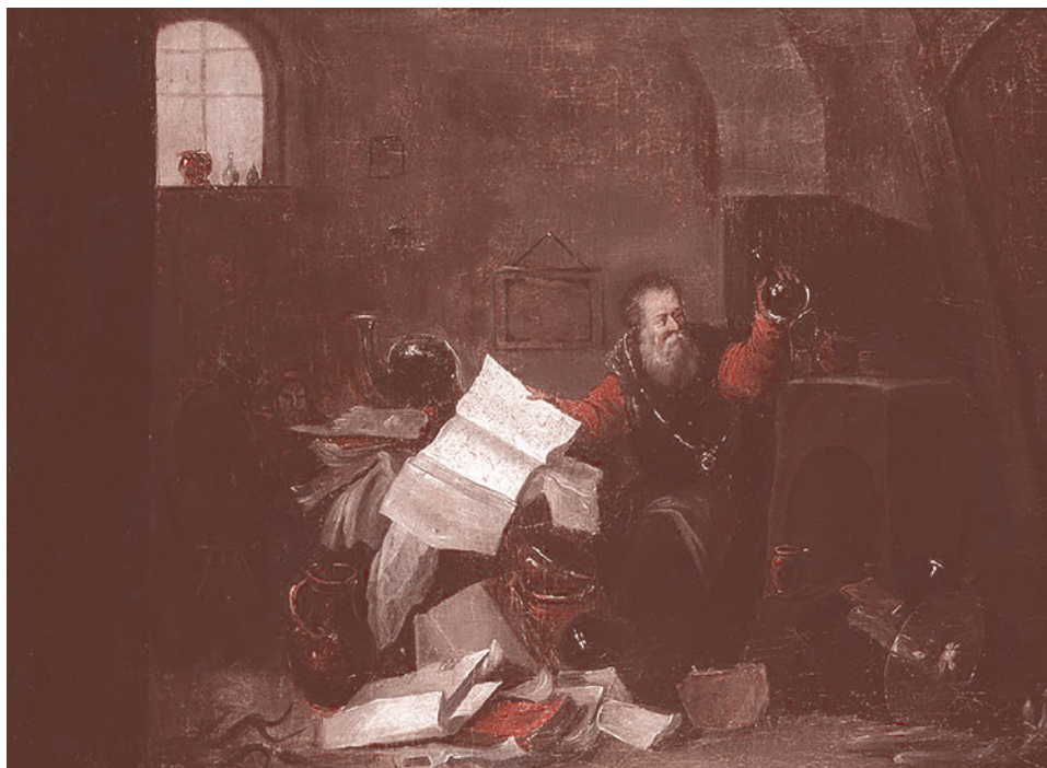
Тенебрис Давид. Алхимик в своей лаборатории

Кроме массово применяемых генетических вакцин сейчас проходят разные этапы испытаний генетические вакцины с вирусными векторами, способными (в отличие от того же «Спутника V»), к размножению внутри организма. Также созданы новые экспериментальные вакцины, доставляемые