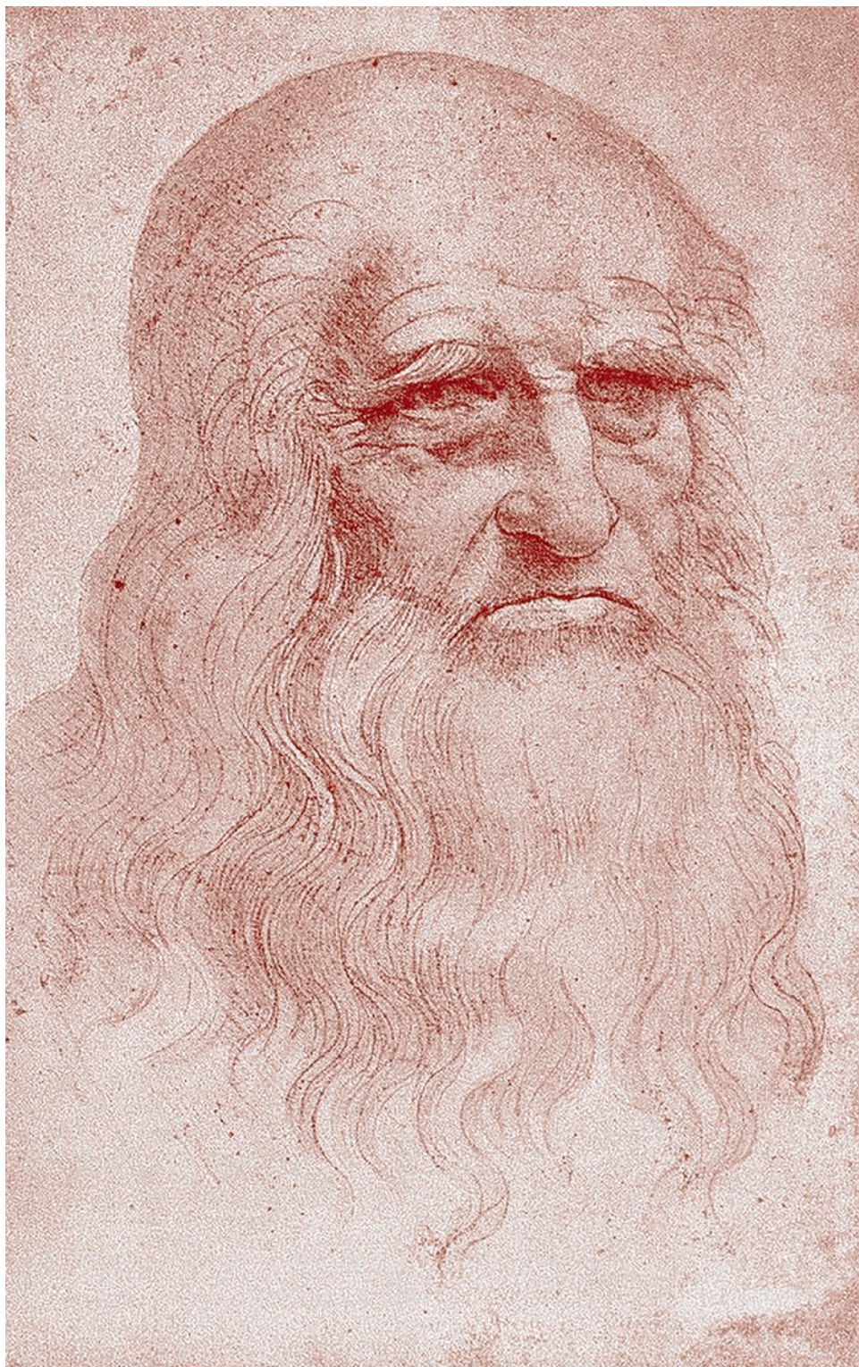
Предполагаемый автопортрет Леонардо да Винчи

Начав такое обсуждение проблемы гуманизма, я должен сразу оговорить, что не приравниваю гуманизм к Ренессансу.