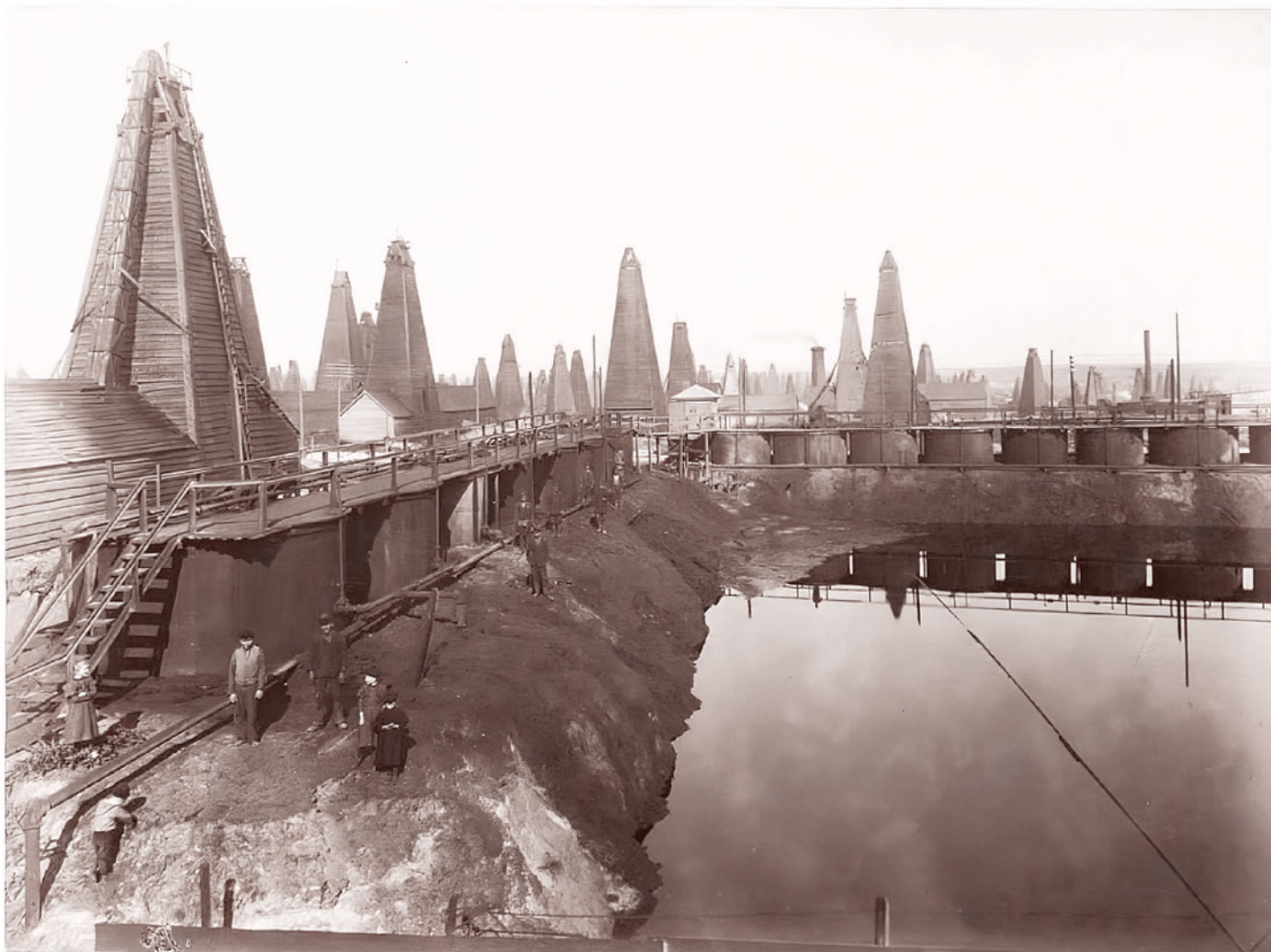
Бакинские нефтепромыслы. Начало XX века

События начала Второй мировой войны исследованы очень подробно — и в геополитическом аспекте, и в экономическом, и в военном. Но история, как известно, это не сами факты, а их интерпретация. Так вот, у советской, а позднее российской истории войны существует одна интерпретация тех военно-дипломатических шагов, которые делали две главные европейские страны по отношению к Германии, позволившие Гитлеру начать войну сначала в Европе, а потом напасть на СССР, а у западной историографии — несколько другая. Если взять, к примеру, такое событие, как встречу в Мюнхене в сентябре 1938 года глав Англии, Франции, Германии и Италии по поводу проблемы судетских немцев, то наша позиция в том, что Великобритания и Франция просто отдали Чехословакию германскому агрессору и разожгли его аппетиты («Мюнхенский сговор»), а европейские историки говорят об «умиротворении Германии» с целью предотвратить большую мировую войну.