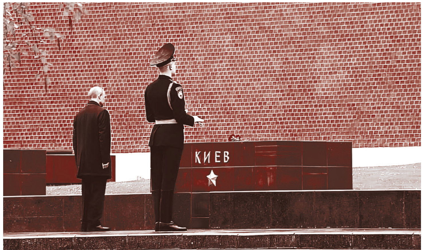
Путин возложил цветы к памятникам городам-героям у Могилы Неизвестного солдата. 2020