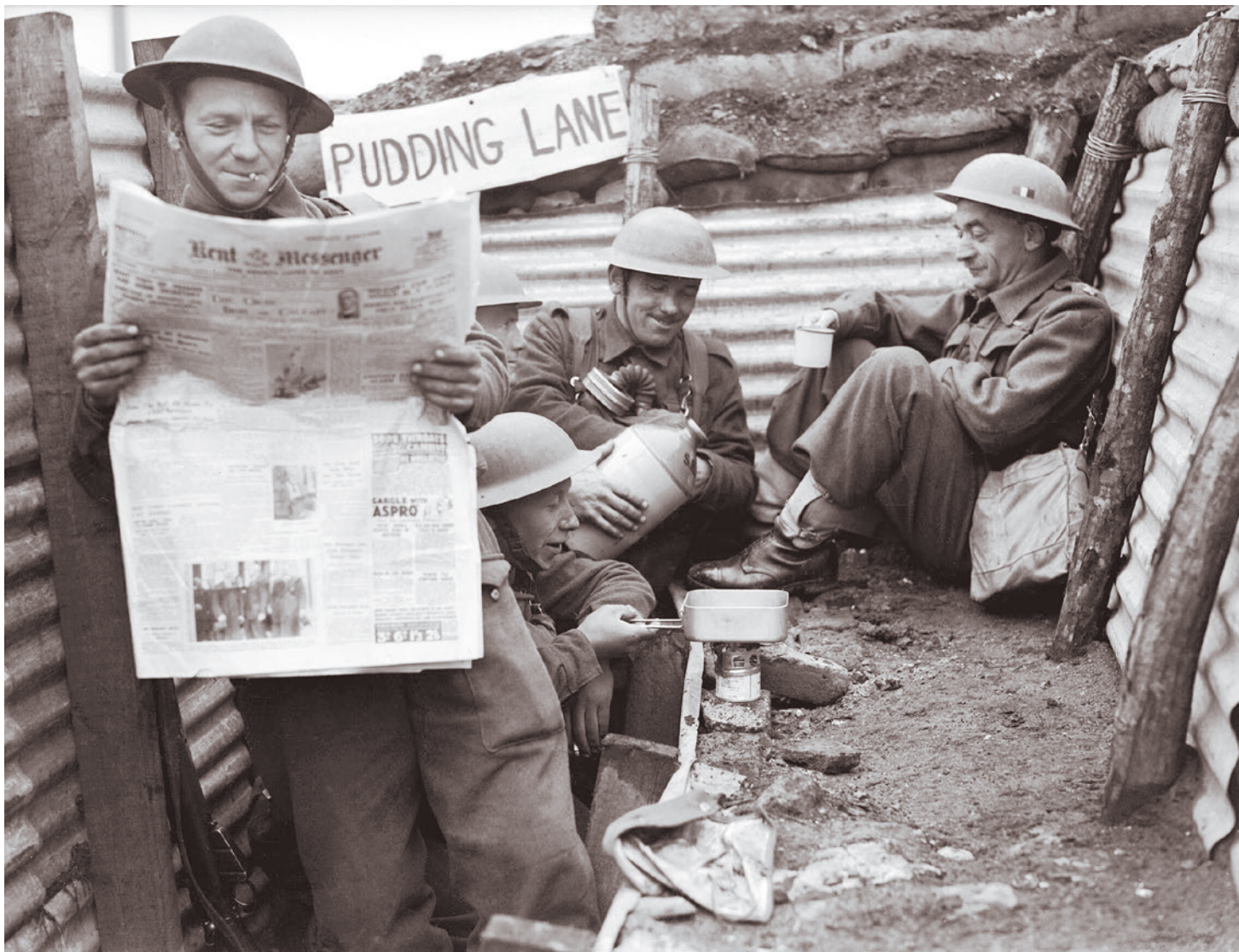
Английские солдаты пьют ром в участке траншеи под названием «Пудинг-лейн». Франция, 1940

модернизации, требовавший значительного времени. Главнокомандующий сухопутными войсками Франции генерал Морис Гамелен рапортовал премьер-министру Эдуарду Даладье, что современное вооружение в положенных штатах войска получат не раньше конца 1940 года. Также больших сроков требовало развертывание массовой британской армии, которая смогла бы компенсировать превосходство Германии над Францией в людских ресурсах: британское командование планировало к исходу 1941 года сформировать 55 дивизий. Пока же по состоянию на конец сентября Франция располагала 86 дивизиями, из которых в составе Северо-Восточного фронта находилась 61. Германские же сухопутные войска состояли из 104 дивизий.