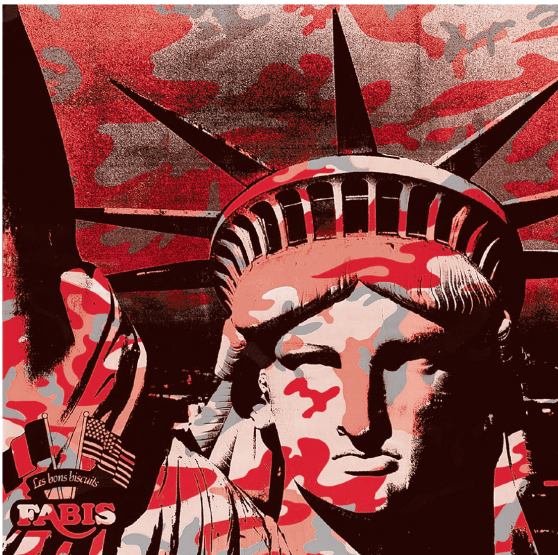
Энди Уорхол. Статуя Свободы. 1986

12 марта 1947 года президент США Гарри Трумэн произнес в Конгрессе речь, в которой определялись принципы будущей внешней политики США. Эта речь, вошедшая в историю как «Доктрина Трумэна», стала одним из первых залпов холодной войны против СССР и растущей «коммунистической угрозы». Советский Союз и новообразованные социалистические страны объявлялись тоталитарными режимами (негласно — аналогичными фашистским), которым должен был противостоять западный демократический мир.