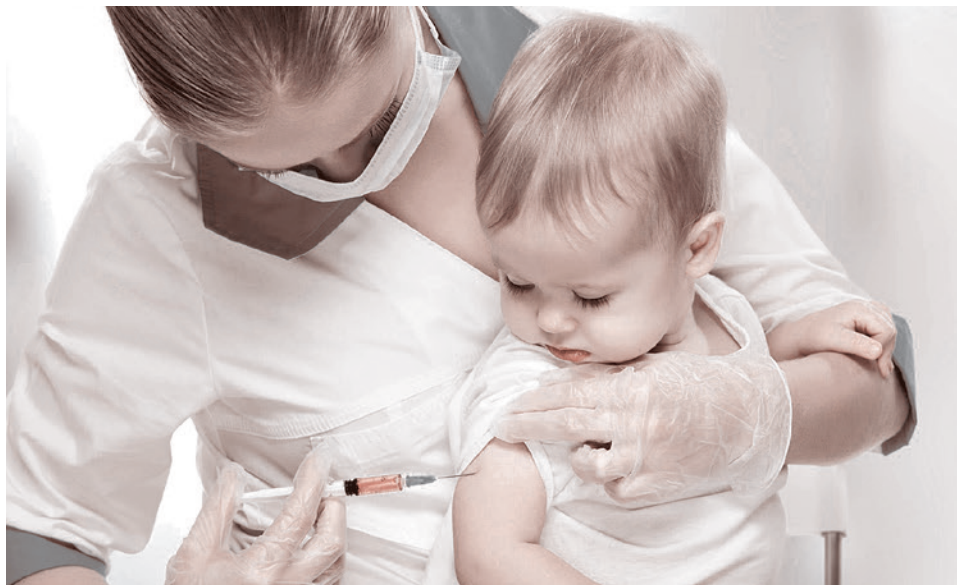
Вакцинация ребенка

В опросе участвовали 500 родителей подростков от 12 до 17 лет из всех округов страны. Из 69% опрошенных 37% однозначно не готовы привить детей от COVID-19, еще 32% скорее не готовы. В основном эти респонденты считают, что вакцина еще недостаточно изучена.