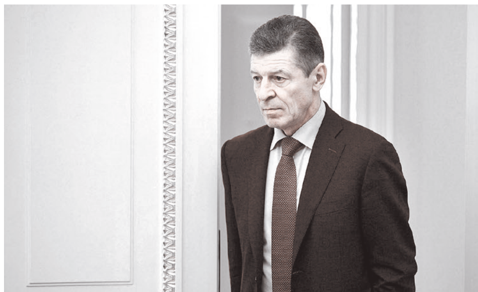
Дмитрий Козак

Россия оказалась слишком зацикленной на теме «Северного потока — 2», а Китай тем временем применяет свою стратегию экономического удушения, медленно устанавливая контроль над ключевыми объектами