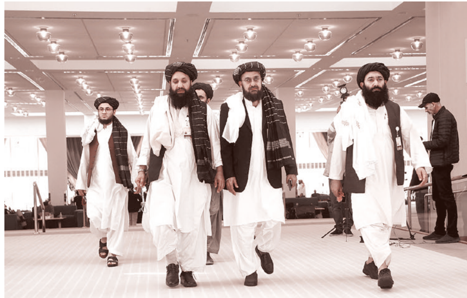
Делегация талибов* прибывает на подписание соглашения с официальными лицами США в Дохе, Катар, 29 февраля 2020 года

И этому служит всё остальное — все эти коронавирусы и так далее. Суть же, конечно, в том, что Китай не остановить, никакими обычными способами его остановить нельзя, а воевать с ним напрямую, в лоб, американцам пока слабо. Это не те люди, это не Байден, и не Блинкен, тут нужны какие-то совсем другие антигерои.