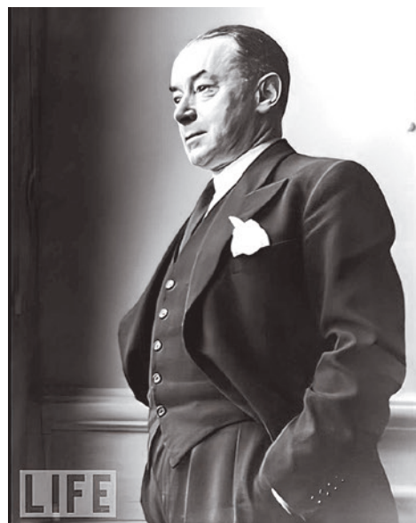
Поль Рейно

на СССР: перехват советских нефтеналивных судов в Черном море, прямой военный удар по Кавказу или разжигание в том же регионе антисоветских восстаний на религиозной либо сепаратистской почве.