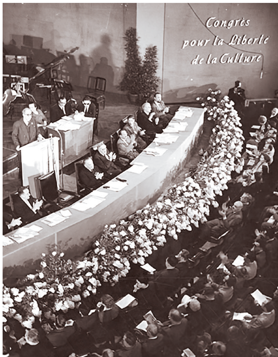
Учредительная конференция КСК. Берлин, 1950