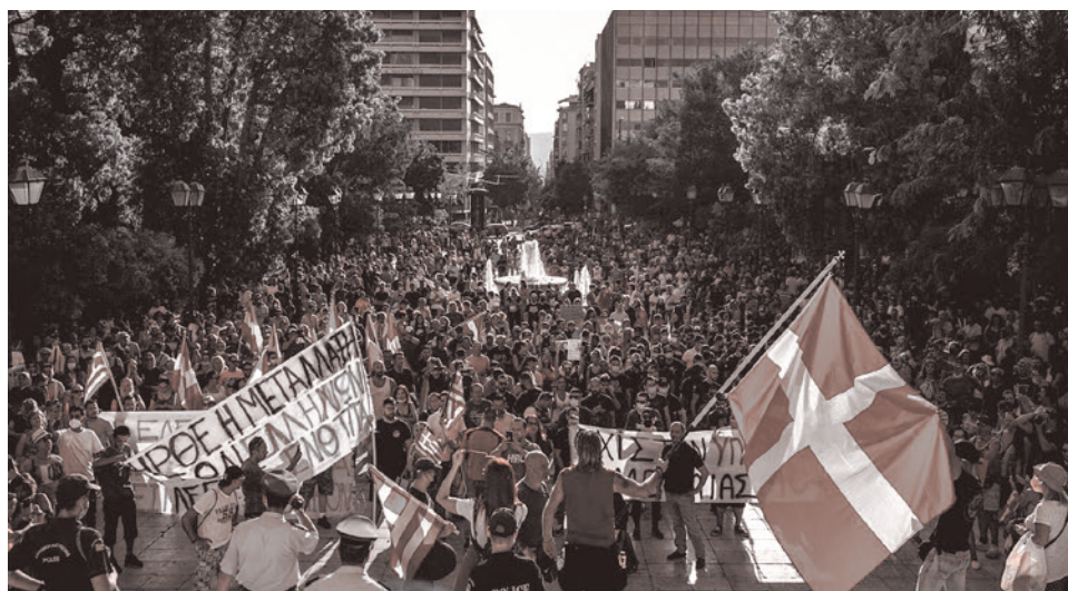
Протест против вакцинации в Греции

В Париже отдельные марши протеста прошли в разных частях города. Демонстрации прошли также в Страсбурге на востоке, Лилле на севере, Монпелье на юге и в других городах. Тысячи людей отклик-