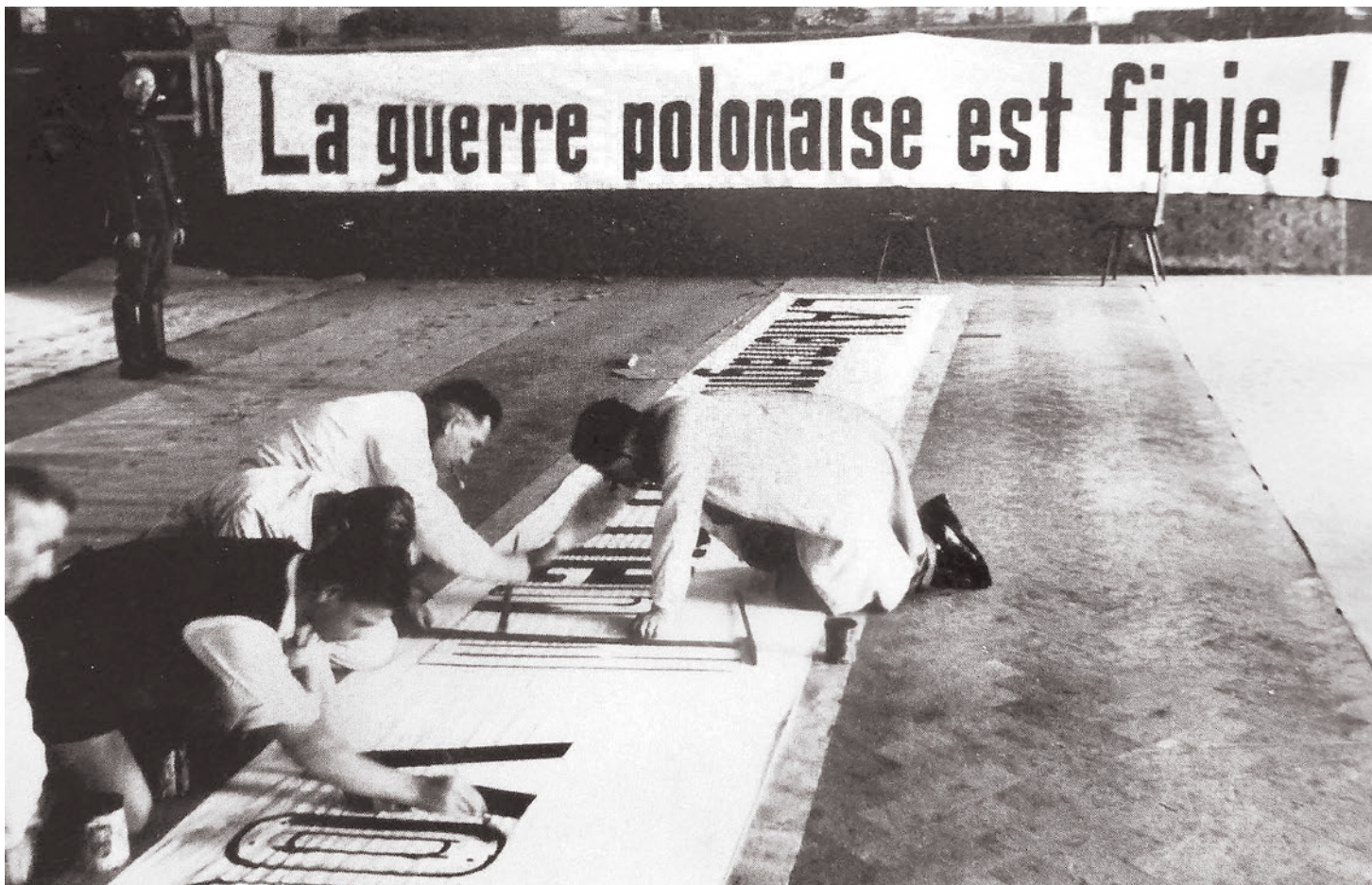
Немцы изготавливают плакаты для французских солдат с надписью на французском: «Польская война закончилась». 1939