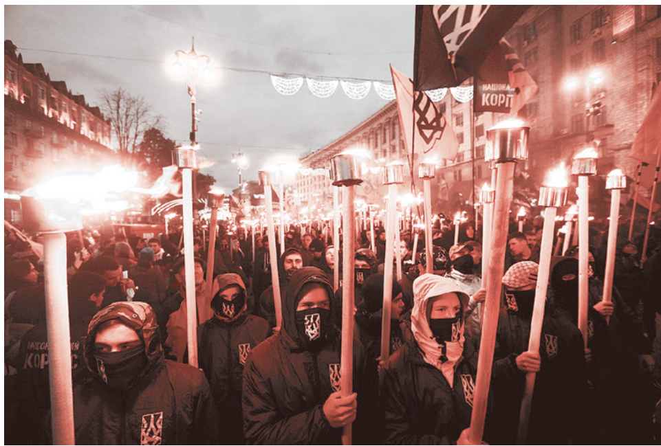
Участники марша националистов в Киеве. 14 октября 2017 года

Помимо всех этих слов и эмоций, которые важны и которые говорят, в чем, в сущности, линия главы государства по отношению к Донбассу и Украине, помимо линии главы государства, конечно, есть еще линии разных кланов. Либеральным кланам что-нибудь хотелось бы конвертировать в улучшение отношений с Америкой, а консервативным кланам хотелось бы чего-нибудь доработать, — но вот линия Путина. Она очень жесткая в вопросе об Украине, очень. И этой жесткостью пронизано всё, что там говорится. И апофеозом для Путина, конечно, является то, что еще и русские там не коренной народ. «Ну, ваще!»