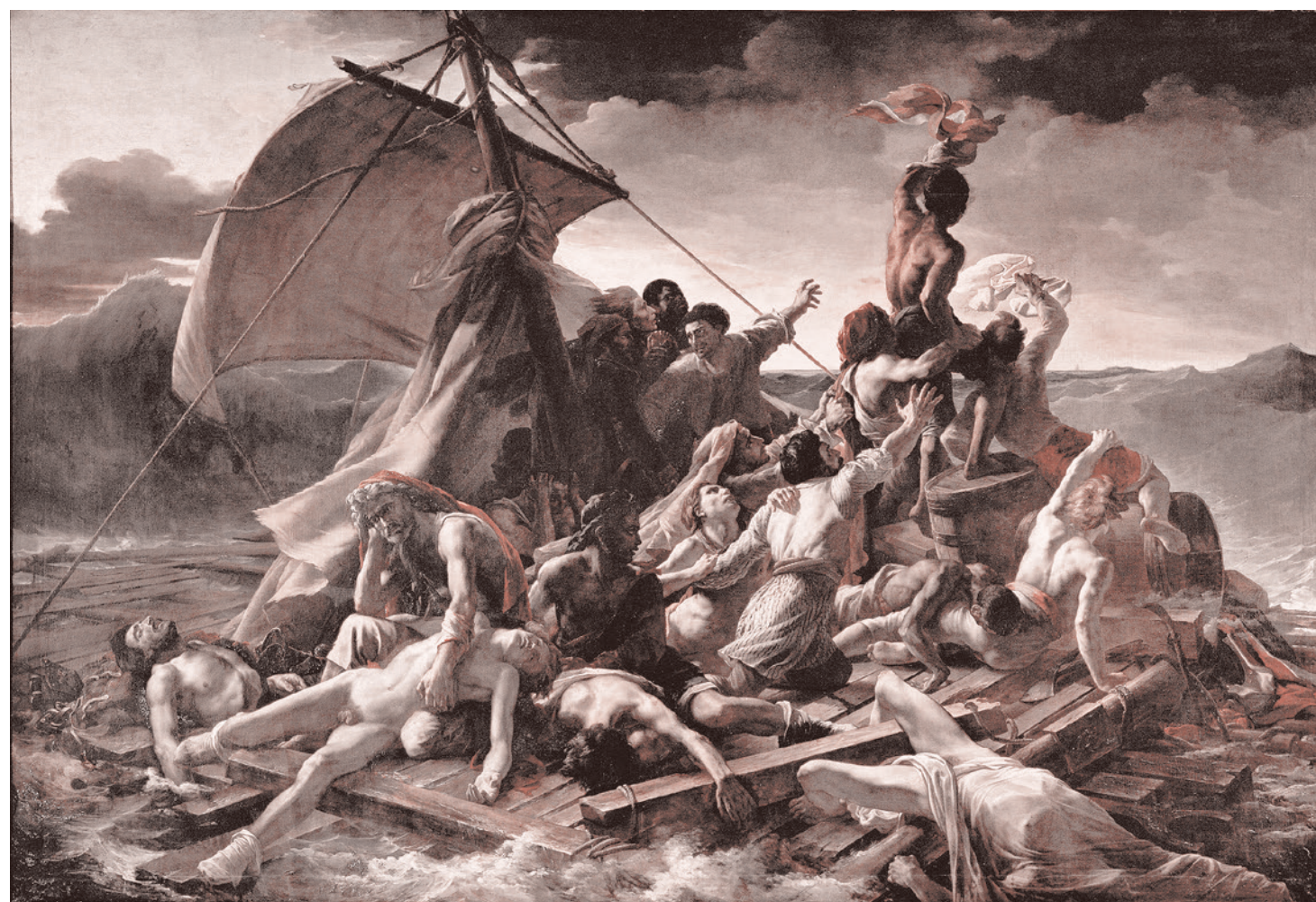
Теодор Жерико. Плот Медузы. 1818–1819

Выдержки из стенограммы передачи «Вечер с Владимиром Соловьевым» от 17 мая 2021 года