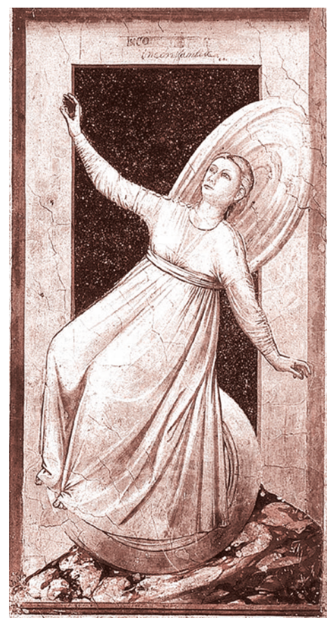
Ажотто. Фреска «Непостоянство» в Капелле дель Арена в Падуе. Ок. 1304–1305

Кстати, Россия почему так ненавидима миром? Я отвечу на этот вопрос в двух словах. Не только потому, что она большая, хотя и это так. Не только потому, что ее восстановление означает, что она снова начнет притягивать к себе кого-то, хотя и это так. Она — другая, она принципиально другая, хотя бы на историческом горизонте, связанном с православием.