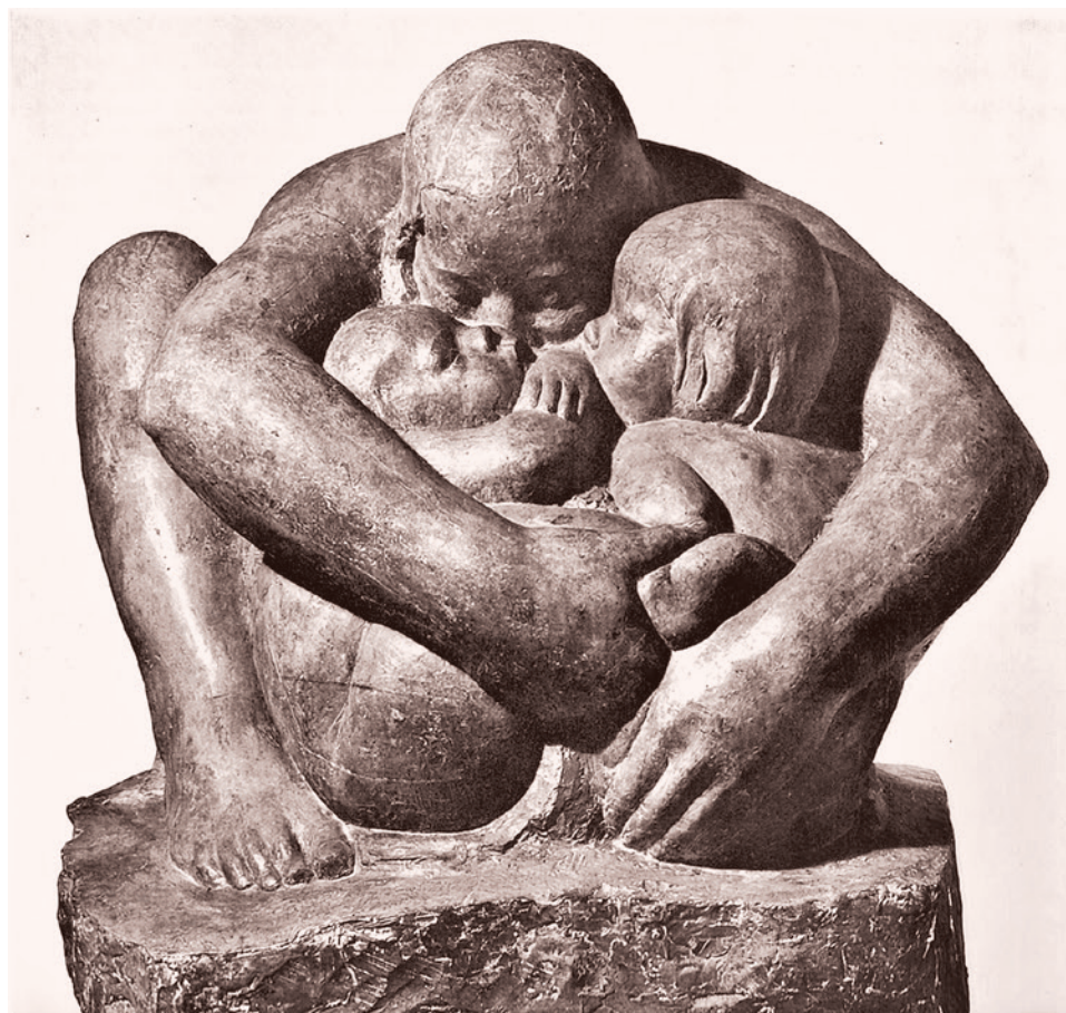
Кете Кольвиц. Мать с близнецами. 1927–1937

Если же речь идет не о чужих, а о «своих» людях — учителях, сотрудниках, самих школьниках, — но психически нездоровых (каковым, очевидно, был и казанский стрелок), то ситуация становится еще сложнее. Если такой «свой» человек захочет совершить массовое убийство, ему трудно будет помешать. Конечно, с помощью средств электронного и иного контроля можно предотвратить попадание в школу огнестрельного и холодного оружия, но