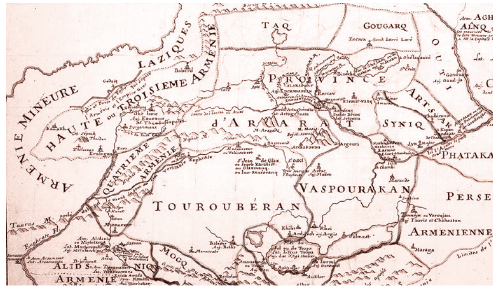
Сюник на карте Армении. Франция, 1788

Для этого у Ирана несколько причин. Первая и основная причина — предполагается (по крайней мере, по утверждениям