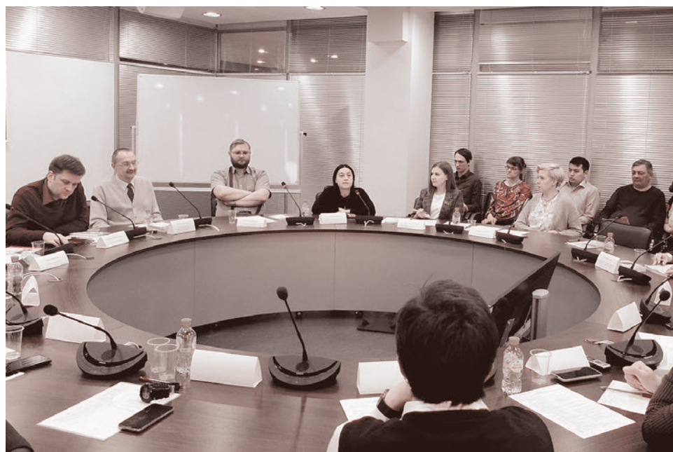
Круглый стол «Целостность русской истории — основа стабильности государства»

В ходе дискуссии прозвучали разные идеи по борьбе с десоветизацией. Напри-