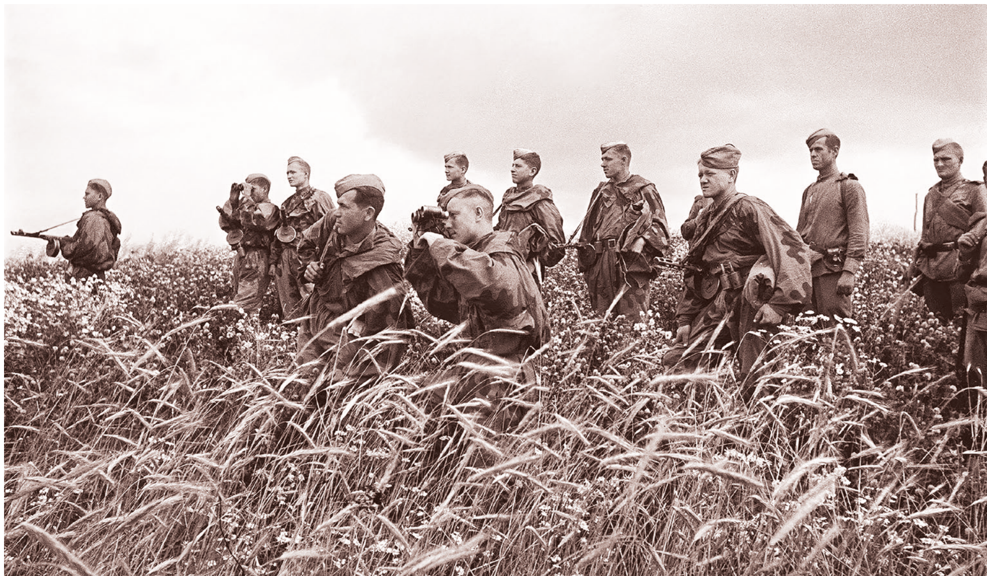
Бойцы РККА (предположительно, из разведгруппы), стоя в поле, наблюдают за ходом боя. 1944