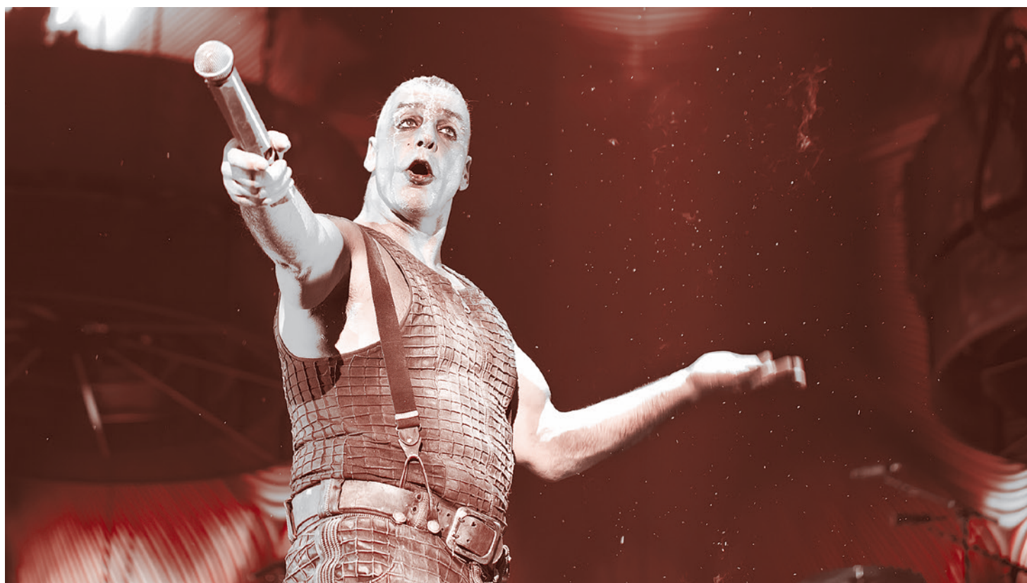
Тиль Линдеманн

«Мы приехали с Востока и выросли социалистами. Раньше мы были либо панками, либо готами. Мы ненавидим нацистов!» — заявили они журналу Roll- ing Stone в апреле 2019 года.