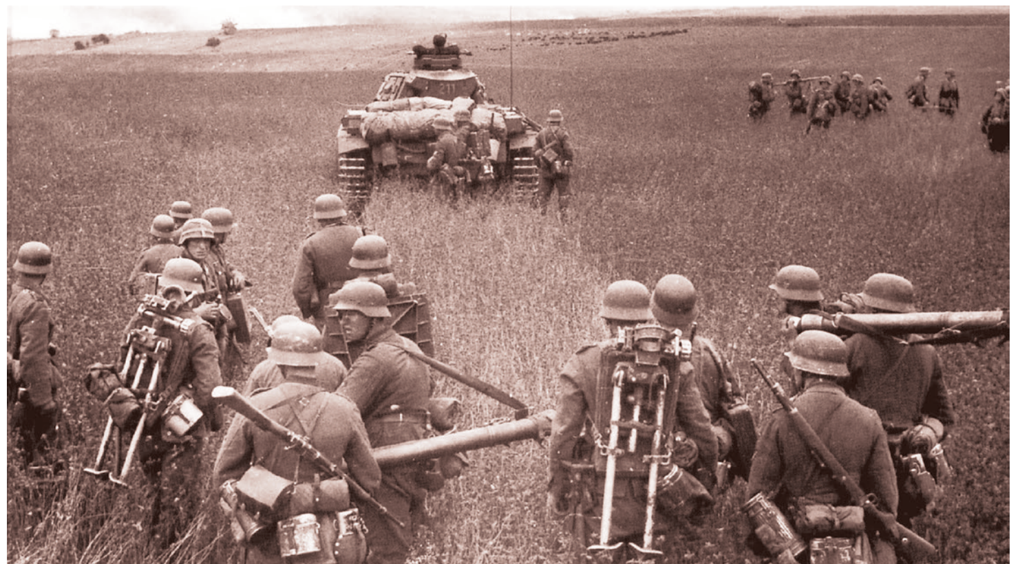
Немецкая пехота в наступлении под прикрытием танков в поле во время операции «Барбаросса». 1941

И вопрос тут не в коронавирусе. Вопрос в бенефициарах. За что воевали в Великой Отечественной войне? Конечно, воевали за свою Родину, за территорию, на которой жили тысячелетиями, за русский дух — там