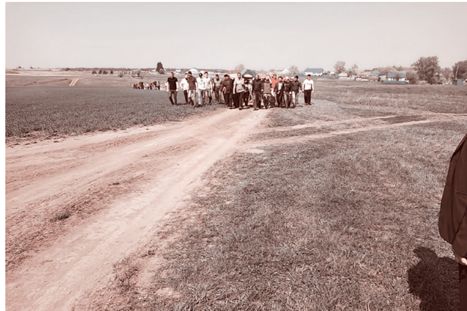
Жители деревни Старый Арыш собрались на похороны 15-летней школьницы, убитой в казанской школе № 175

Есть религиозные люди, которые говорят: «А что поделать, это Апокалипсис». Но у религиозного человека есть в вооружении концепция катехона, которая позволяет сопротивляться Апокалипсису. Поэтому никто не имеет права ссылаться на то, что он религиозен и поэтому не будет сопротивляться приходу врага человечества. Если же религия начнет разводить руками и говорить: «А что поделать, таков уж наш удел», — то эта религия превратится в деструктивную силу. И да не будет так.