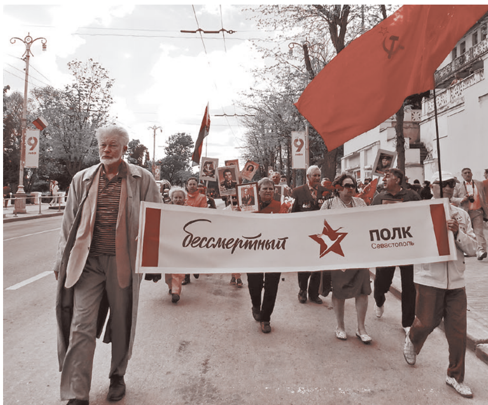
Шествие «Бессмертного полка» в Севастополе, 2021

«В истории Мариуполя рядом с датой 10 сентября 1943-го появилась дата 13 июня 2014-го. И он, и еще много украинских городов на востоке Украины через 76 лет после Второй мировой будут отмечать две даты освобождения», — заявил Зеленский. Помимо этого, Зеленский еще раз заявил, что Украина вернет под свой контроль Крым и Донбасс.