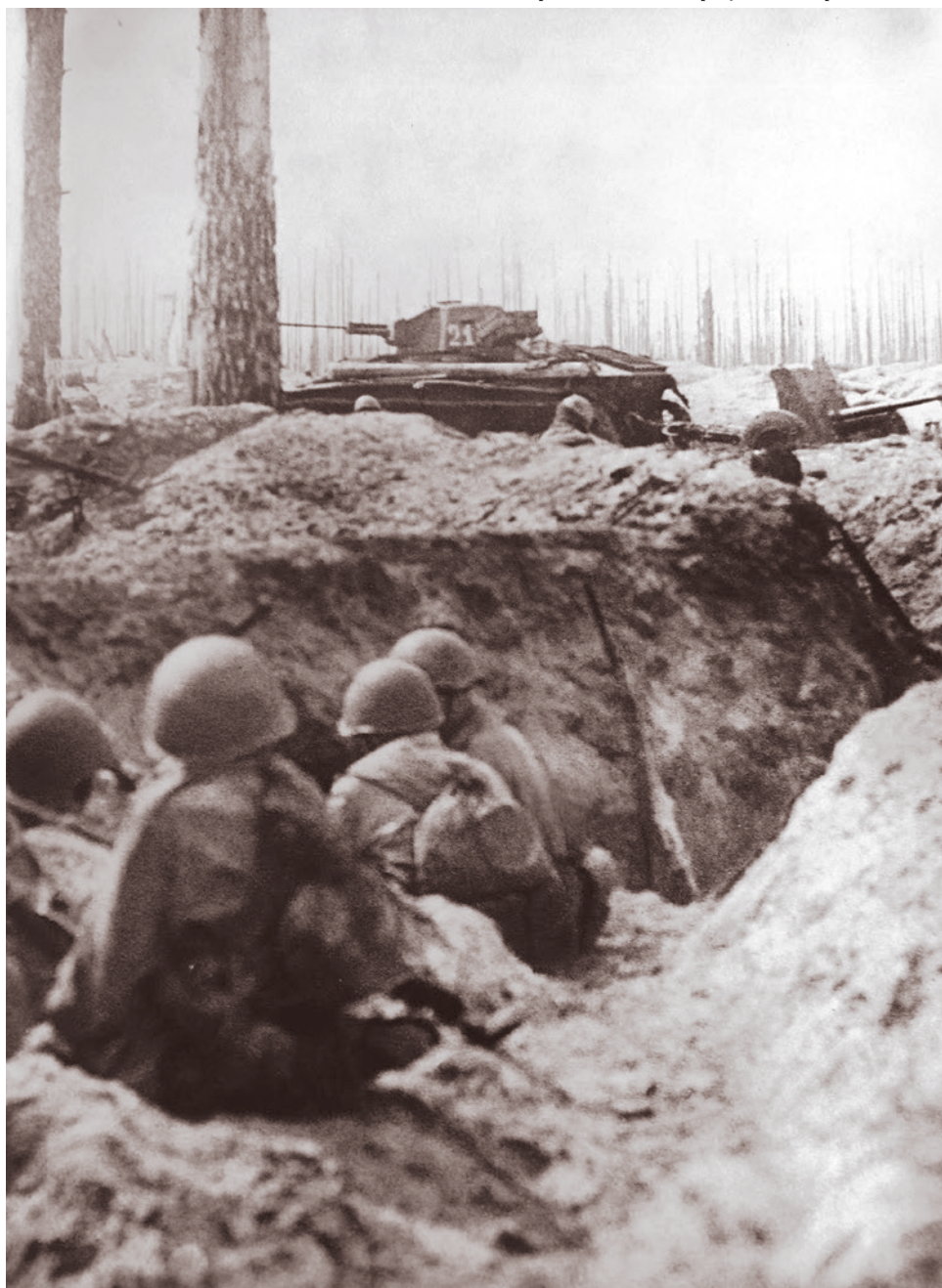
Советский легкий танк Т-60 буксирует 45-мм пушку мимо позиций защитников Невской дубровки. 1943

Ставка усилила войска Говорова и Мерцкова соединениями нового типа — штурмовыми инженерно-саперными бригадами,