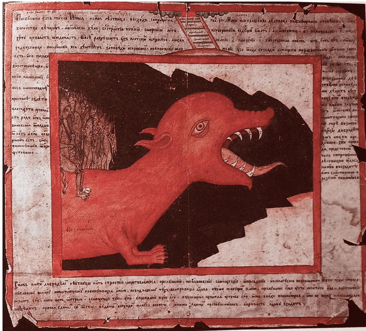
Чудо-юдо. Русская лубочная картинка XIX века

Ильяс Аутов: Пропаганда насилия тотальная, она присутствует сегодня везде. Даже