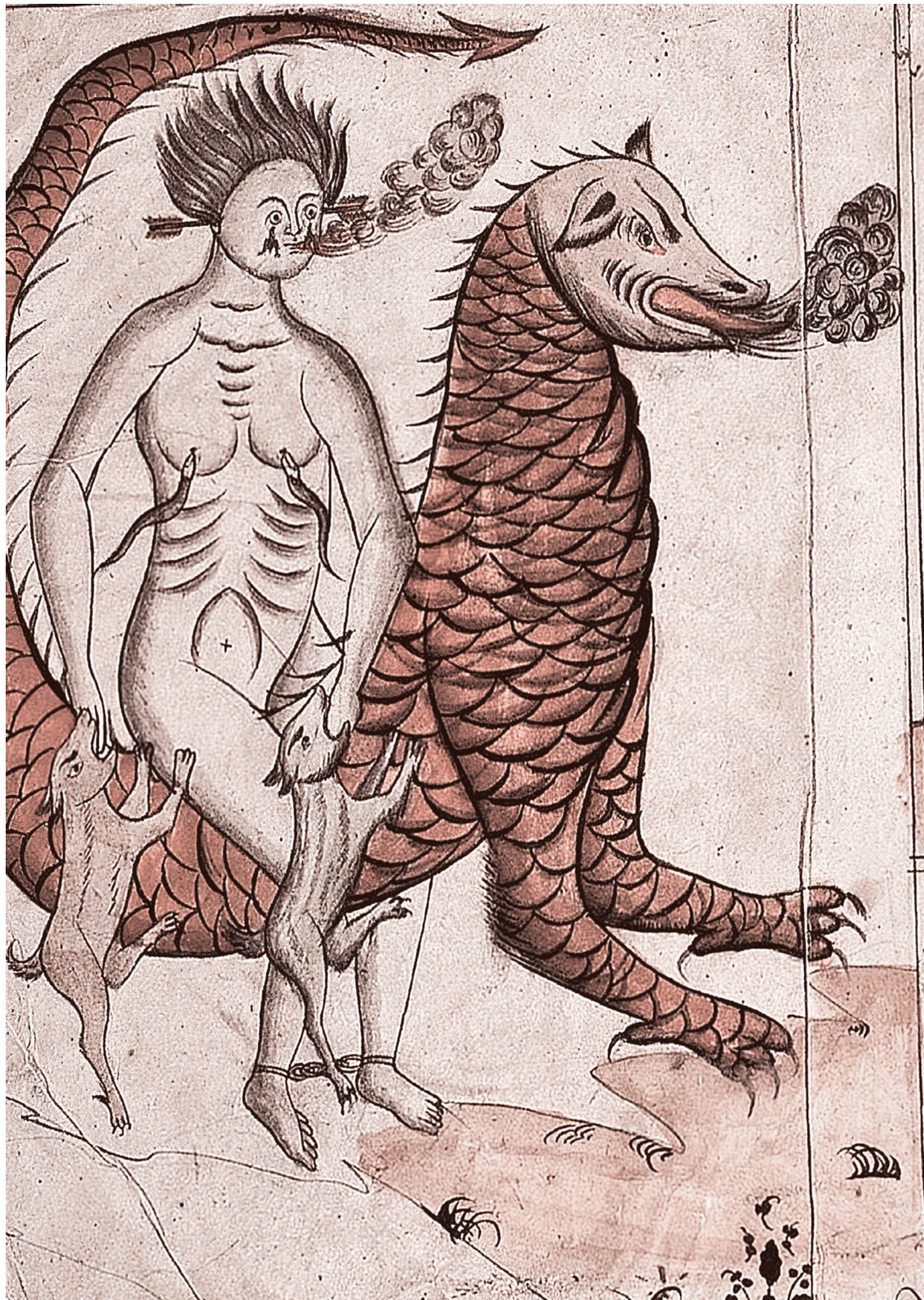
Неизвестный художник. Злой единорог (фрагмент). 1830–1840

Десять лет назад, в момент, когда только формировалось движение «Суть времени», я сказал, что президент России Владимир Владимирович Путин стабилизирует регресс. Он этот регресс, запущенный в постсоветскую эпоху, сдерживает. И это правда. Благодаря этому сдерживанию всё еще не развалилось, и даже есть какие-то приобретения: Крым и так далее. Но когда регресс сдерживают, это значит, что он движется, и он подходит к черте невозврата. За этой чертой исчезнет счастли-