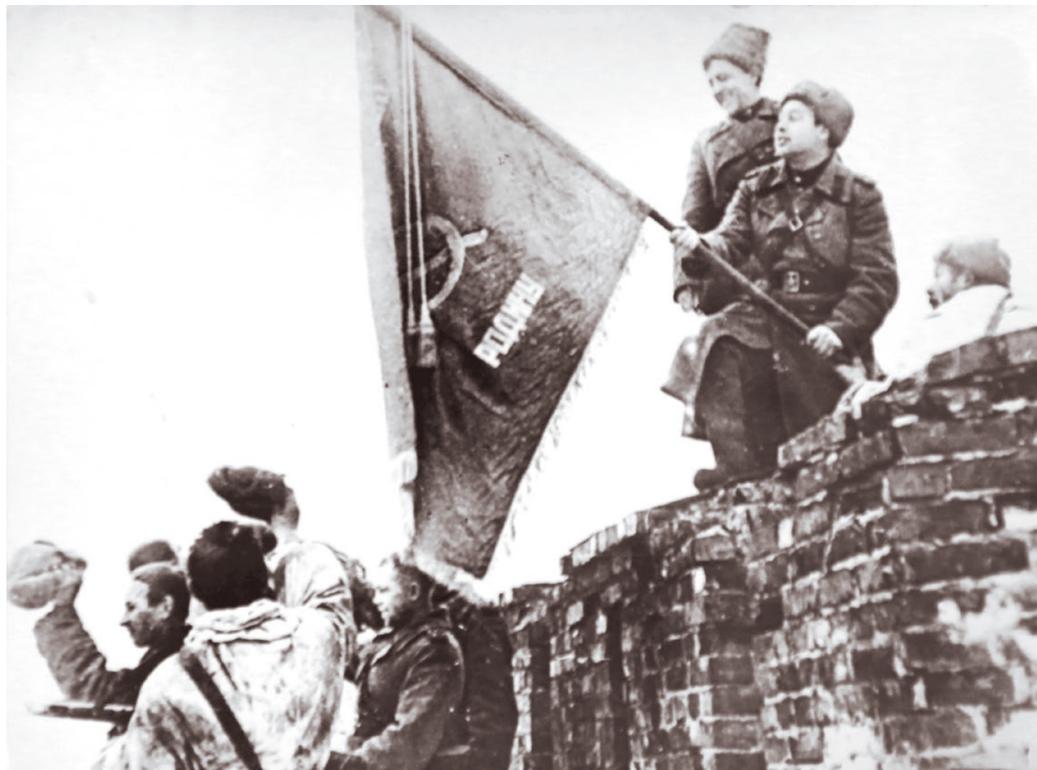
Красноармейцы со знаменем в освобожденном Новгороде. 1944

В ноябре управление 2-й ударной армии во главе с генералом Иваном Федюнинским передислоцировалось под Ораниенбаум, а затем началась переправа и войск армии. Командование Ленинградского фронта и Балтийского флота принимало особые усилия, чтобы скрыть от противника накопление войск и даже