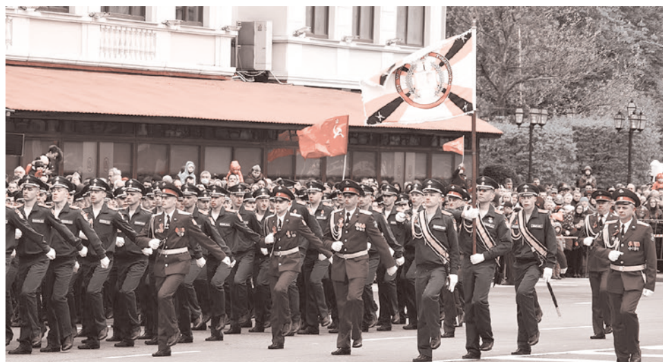
Парад Победы в Донецке, 2021

Военнослужащие и курсанты пешим строем прошли по улице Артема. Вслед за подразделениями внутренних войск, Народной милиции и курсантами военных академий по центральной магистрали проехала тяжелая бронетехника — танки и бронетранспортеры. Сопровождал парад военный оркестр.