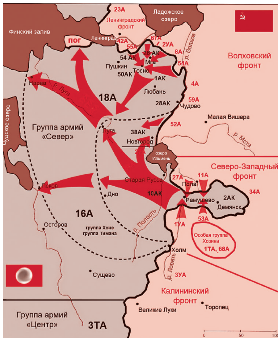
Карта замысла операции «Полярная звезда»

Основная идея готовившейся на лето советской операции состояла в нанесении сходящихся в общем направлении на Мгу ударов. 67-я армия Ленфронта должна была наступать на участке между деревней Арбузово на Неве и Синявинскими высотами, а основные усилия 8-й армии Волховского фронта сосредотачивались вдоль Кировской железной дороги между деревнями Тортолово и Вороново. Конечным рубежом наступления избиралась река Мга. То есть пространственный охват операции изначально планировался весьма скромный.