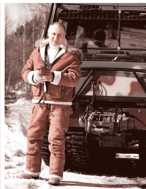
Владимир Путин в поездке в Сибирский федеральный округ

«Хоть они думают, что мы такие же, как они, но мы другие люди — у нас другой генетический и культурно-нравственный код. Но мы умеем отстаивать свои собственные интересы, и мы будем с ними работать, но в тех областях, в которых мы сами заинтересованы,