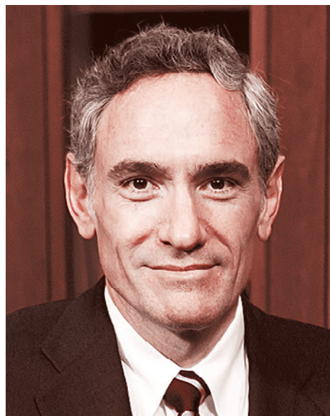
Скотт Атлас

Все политические соображения, которые я рекомендовал президенту, были направлены на сокращение как распространения вируса среди наиболее уязвимых, так и структурного ущерба, наносимого борь-