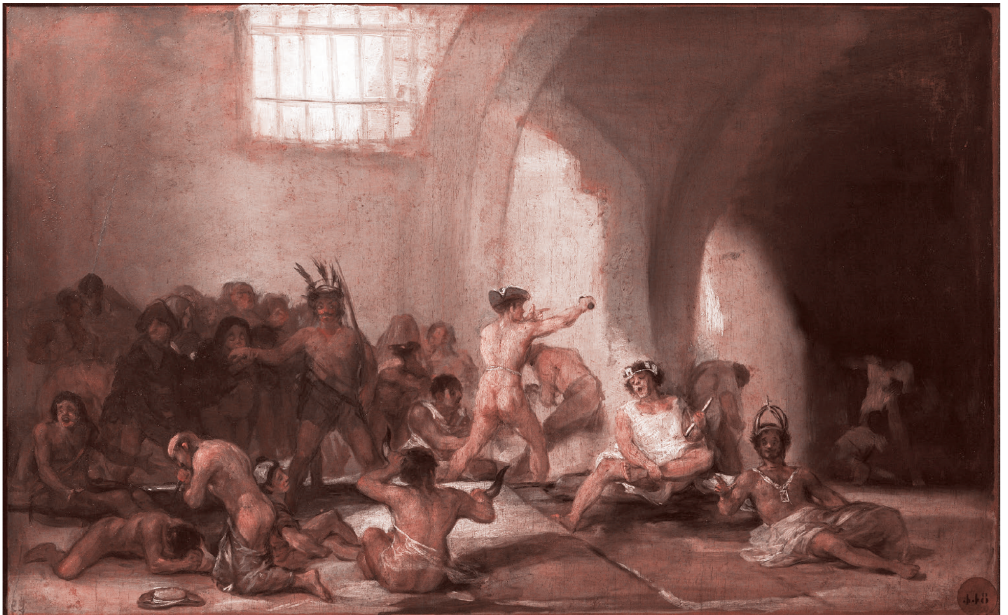
Франсиско Гойя. Дом умалишенных. 1819

Я просто скажу, что с вероятностью, превышающей 90%, Россия вскоре вступит в войну, которая ей будет навязана совокупным Западом. И прежде всего американцами. Что речь будет идти о периферийной войне. Которая, по видимости, будет русско-украинской. Что всё упование граждан на мирное сосуществование России и Запа-