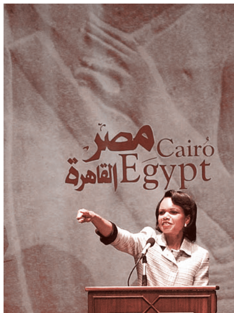
Кондолиза Райс в каирском Американском университете, 2005 г.

В Палестине первые джамааты «Братьев-мусульман»* были созданы в 1935 году Абд аль-Рахманом аль-Банной, братом основателя «Братьев-мусульман»* Хасана аль-Банна. Далее лидером «ихванов»* в подмандатной британской Палестине стал аль-Хадж Амин аль-Хусейни, назначенный британцами (знаковая подробность!!!) Великим муфтием Иерусалима.