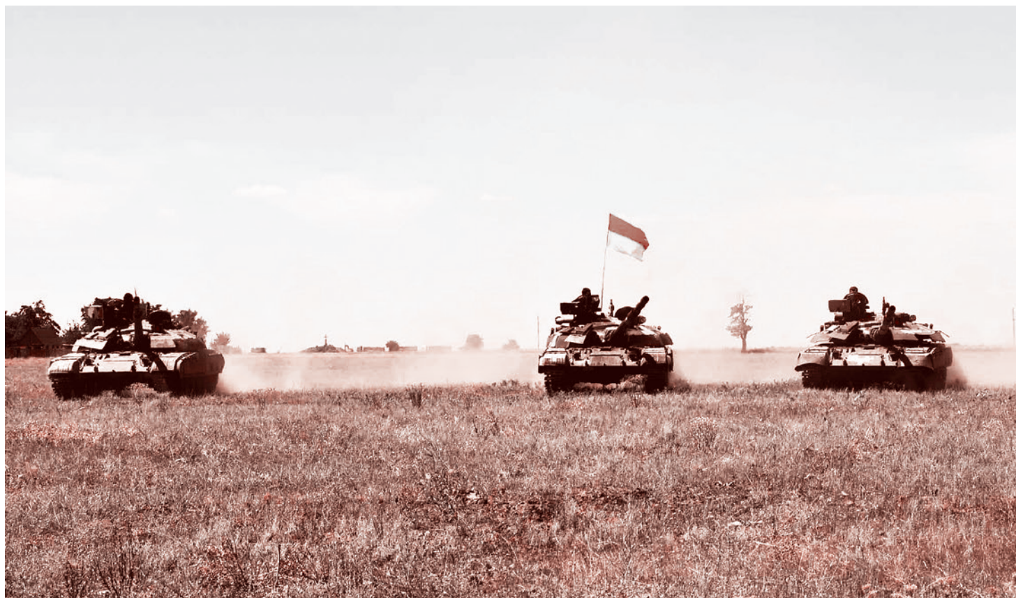
Танки ВСУ

Я убежден, что вероятность серьезных военных столкновений между Россией и бандеровской Украиной резко возросла. И что на сегодняшний день она превышает 90%.