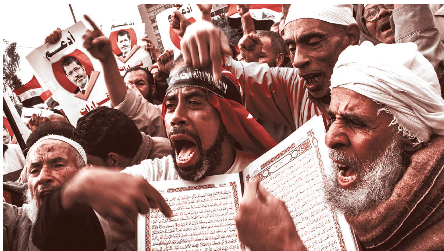
Протесты «Братьев-мусульман»* в Каире 14 декабря 2012 г.

В самом Катаре аль-Кардави, в частности, уже в 1962 году возглавил Катарский институт религиоведения, а в 1977 году принял руководство кафедрой шариата и исламоведения в Университете Катара. Далее аль-Кардави также возглавил размещенный в Дублине «Европейский совет по фетвам и исследованиям» и расположенную в Брюсселе «Международную ассоциацию исламских ученых». Нако-