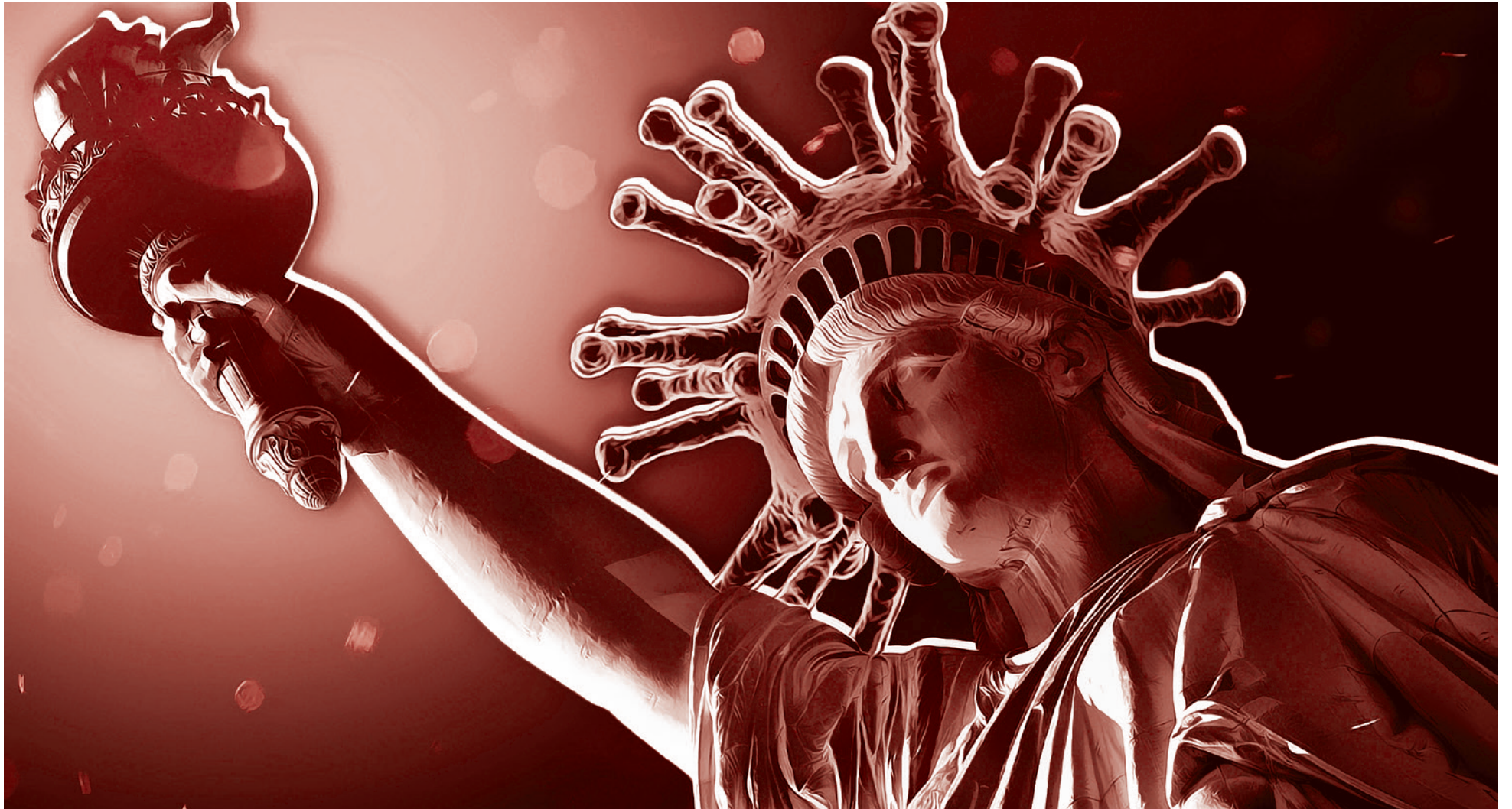
Корона свободы.

7 марта в газете The Stanford Review появилась стенограмма выступления Скотта В. Атласа перед студентами Стэнфордского университета. Выступление было организовано молодежным крылом республиканской партии — «Республиканцами колледжа». Оно затрагивает множество проблем — от мер противодействия коронавирусу и их эффективности до свободы мысли и политизации науки. Отметим также, что это один из немногих голосов в США, звучащий не в унисон с доктором Фаучи и основными СМИ.