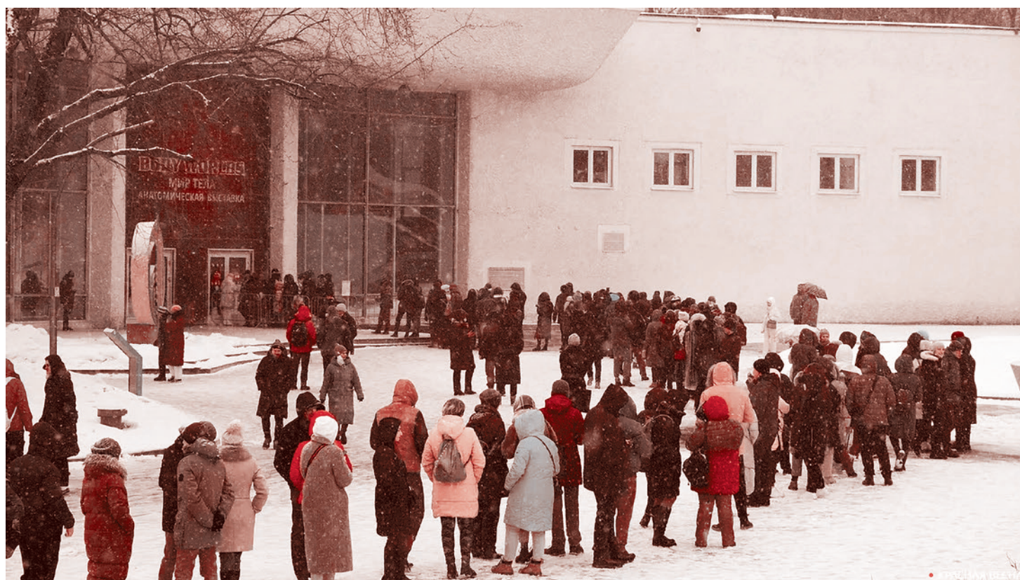
Очередь на выставку «Миры тела». 2021 г.

12 марта на ВДНХ открылась выставка «Миры тела» (Body Worlds), составленная из особым образом подготовленных трупов и их фрагментов. Выставка эта кочует по всему миру уже более четверти века и постоянно вызывает скандалы. Как бы человечество ни поменяло свое отношение к культуре, тема жизни и смерти — особая.