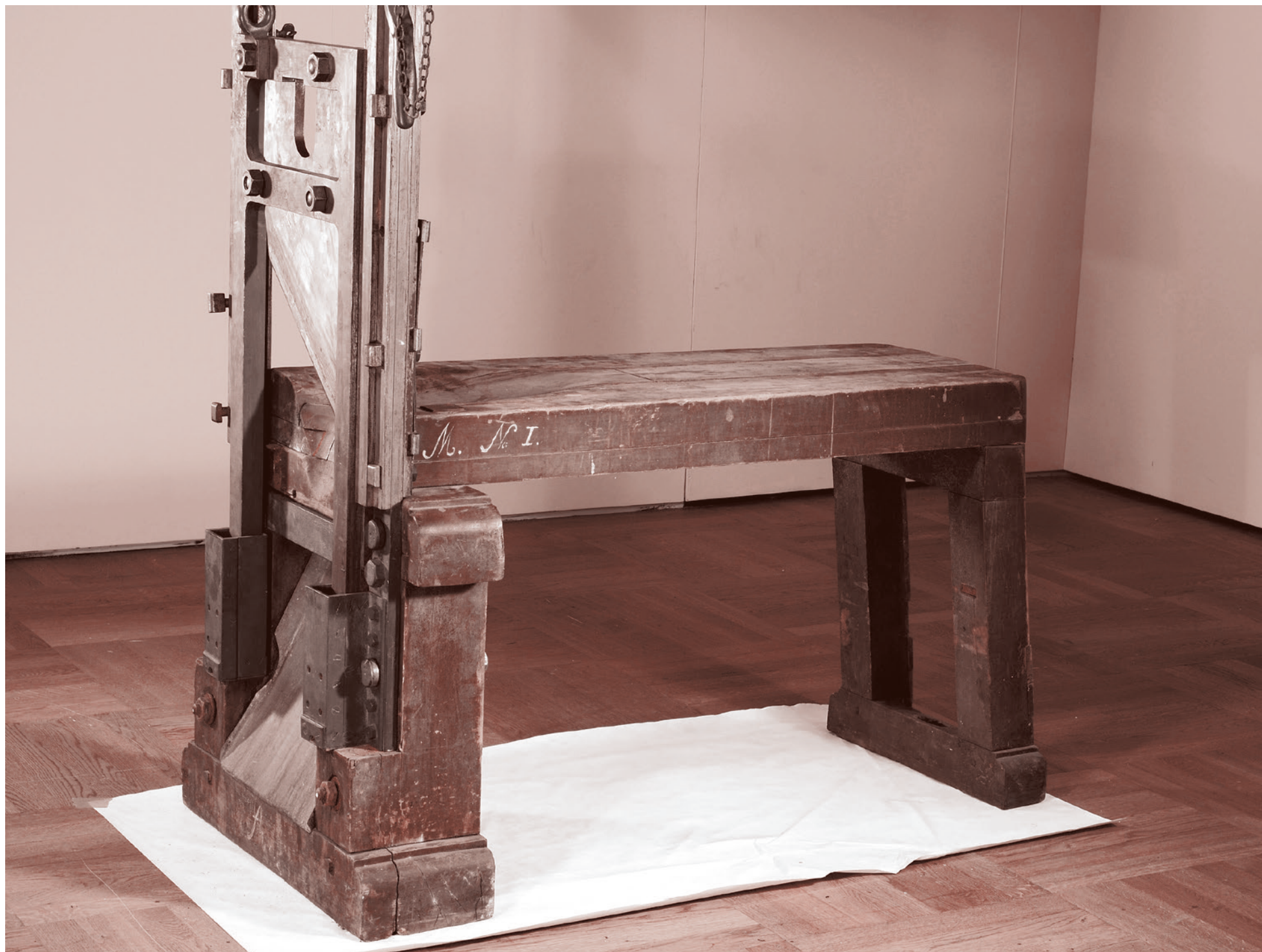
Исторически подлинная гильотина для Софи Шолль

В прошлой статье мы вкратце рассмотрели трагическую историю немецкого антифашистского движения. И увидели несколько причин слабости этого движения. Здесь и некая иллюзорная уверенность в своей правоте немецких коммунистов, и катастрофическая индивидуализированность немецкого общества, и определенная духовная неуверенность интеллектуалов-коммунистов. И много еще чего.