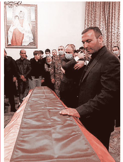
Пашинян принимает участие в похоронах рядового Марата Манукяна 16 октября 2020 г.

• Основная причина вражды между Арменией и Турцией всегда была ясна всем политически подкованным армянам. В планы Турции никогда не входило терпимое отношение к присутствию и существованию на этой территории армянского госу-