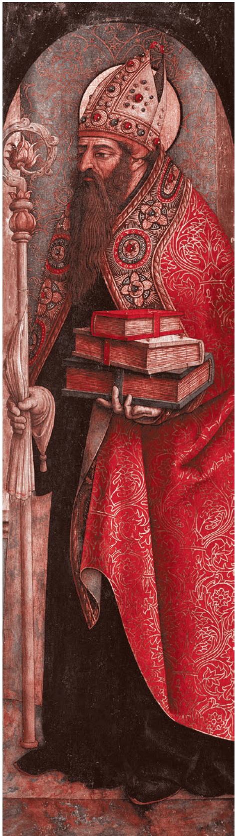
Карло Кривелли. Святой Августин. 1486

Обвинители, написавшие статью в JAMA, заявили: «Атлас оспаривал необходимость ношения масок». Это искажает мои слова. Напротив, мой совет по использованию масок был последовательным и четким — «носите маску, когда вы не можете дистанцироваться от общества», — и он соответствовал опубликованным рекомендациям Всемирной организации здравоохранения в июне: «На улице надевайте маску, если не можете соблюдать физическую дистанцию от других».