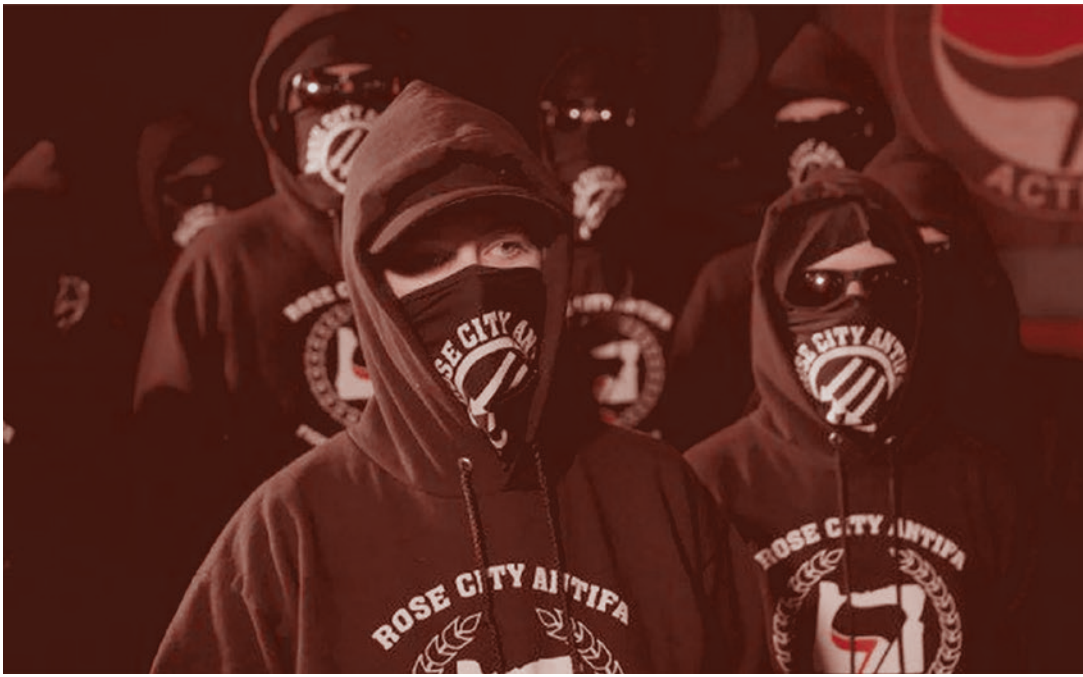
Представители одной из старейших активных групп антифа Rose City Antifa

Кадры выглядели весьма эффектно и запомнились многим. Обе противостоящие стороны смотрелись достаточно пестро, но внутри каждой угадывалось ядро, более организованное и боеспособное. Среди правых наиболее организованно себя вели члены местных неофициальных «ополчений», которых можно было распознать по военной экипировке и штурмовым винтовкам (правда, не применявшимся в ходе столкновений по прямому назначению). Боевое ядро контрпротестующих было одето во всё черное и закрывало свои лица. Малые группы одетых таким образом людей стремительно сближались с правыми и осуществляли быстрые физические нападения — как голыми руками, так и подручными предметами — а затем опять растворялись в толпе.