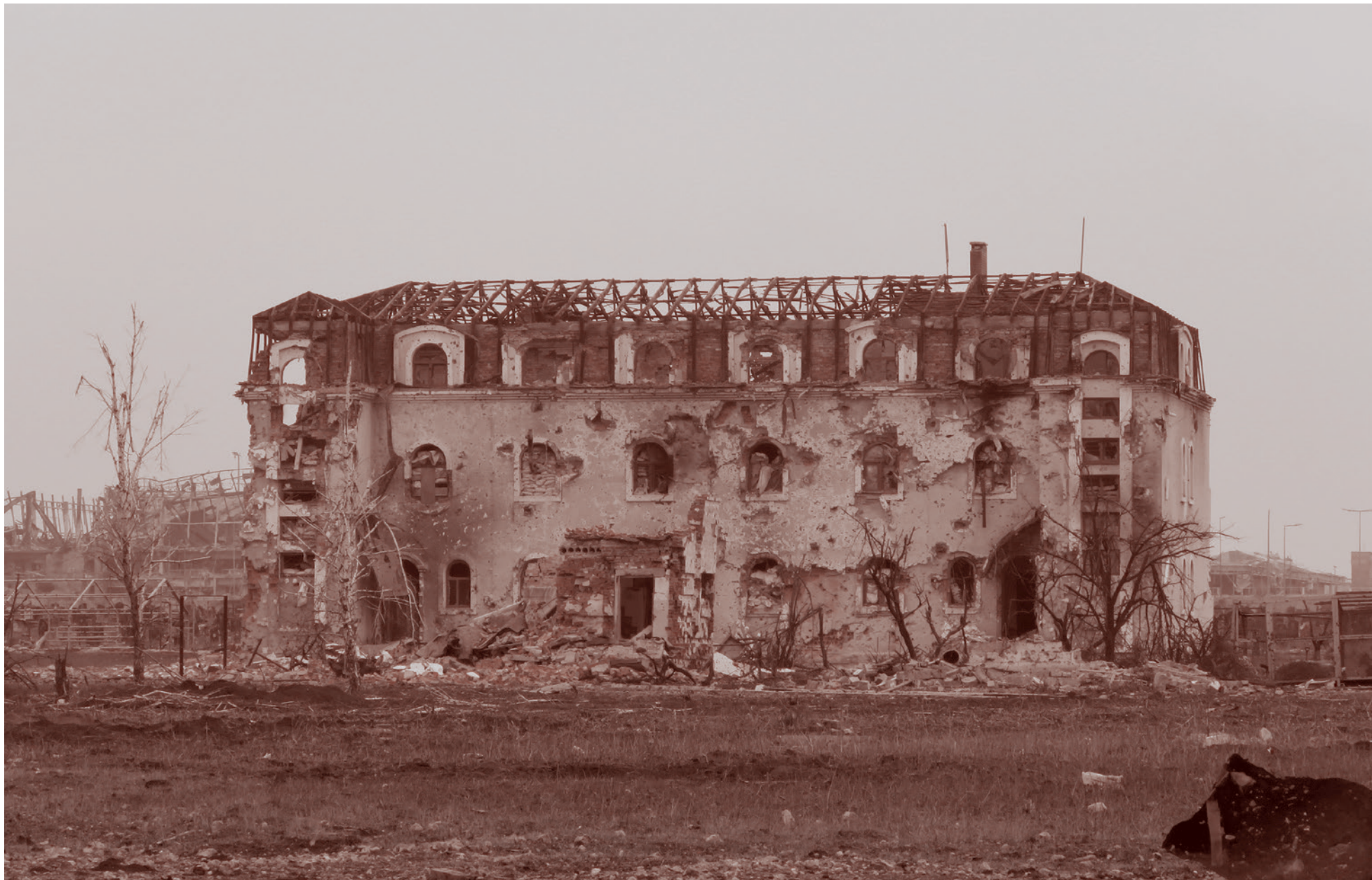
Позиция «Трёшка», Донецкий аэропорт