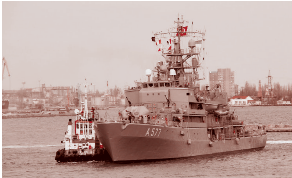
Турецкий флагман Sokullu Mehmet Pasa

Йенс Столтенберг отметил бесспорный прогресс во многих вопросах и сосредоточенность Украины на продолжении реформирования оборонного сектора. Владимир Зеленский добавил, что Украина настроена