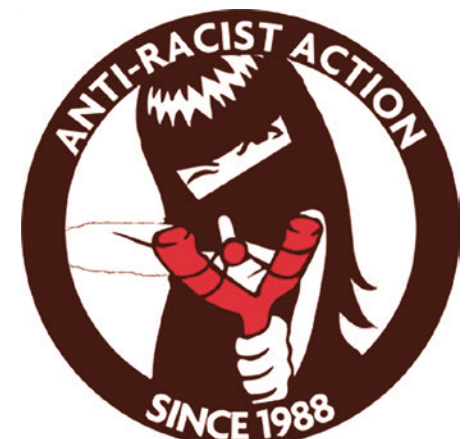
Эмблема Anti-Racist Action

По мере распространения интернета, у ARA появилась и другая характерная тактика — выискивание в сети членов ультраправых групп и дальнейшая публикация их