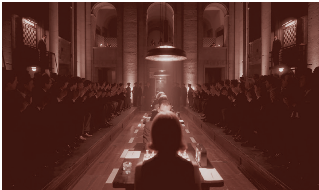
«Обычный турнир по шахматам в СССР». Кадр из сериала «Ход королевы». 2020

Сегодня в США также есть много игроков экстра-класса — Накамура, Со, Домингес, а занимающий вторую строчку мирового шахматного рейтинга Каруана Фабиано даже играл матч на первенство мира с действующим чемпионом Магнусом Карлсеном. Однако тут существует любопытный нюанс — почти все эти игроки являются в США иммигрантами: Со — филиппинец, Накамура — японец, Домингес — кубинец. Конечно,