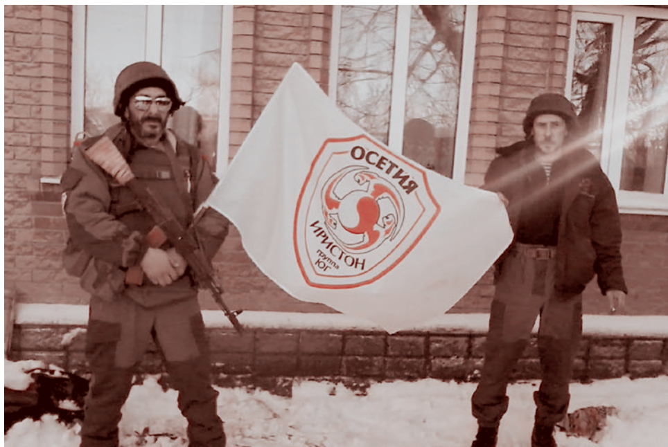
Беко и Белка со знаменем