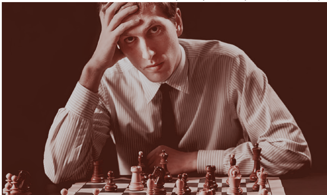
Роберт Джеймс Фишер