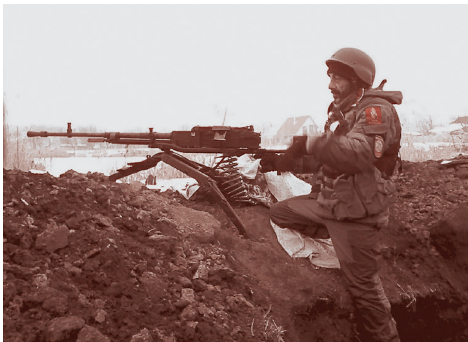
Беко с пулемётом НСВ «Утёс»