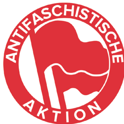
Эмблема немецкой Antifaschistische Aktion

Именно за счет этой тактики современные члены антифа себя считают преемниками левых боевых отрядов, противостоявших штурмовикам Гитлера, Муссолини и их менее успешным последователям в других западных странах в первой половине XX века. Современные апологеты антифа считают, что история прихода к власти фашистов в буржуазно-демократических Италии и Германии доказывает, что в противостоянии фашистским организациям нельзя ограничиваться работой на уважаемом общественно-политическом поле, а что необходимо оказывать силовое противодействие формирующимся фашистским организациям на самом раннем этапе. Основной же ошибкой Antifaschistische Aktion они же называют то, что эта организация сформировалась слишком поздно.