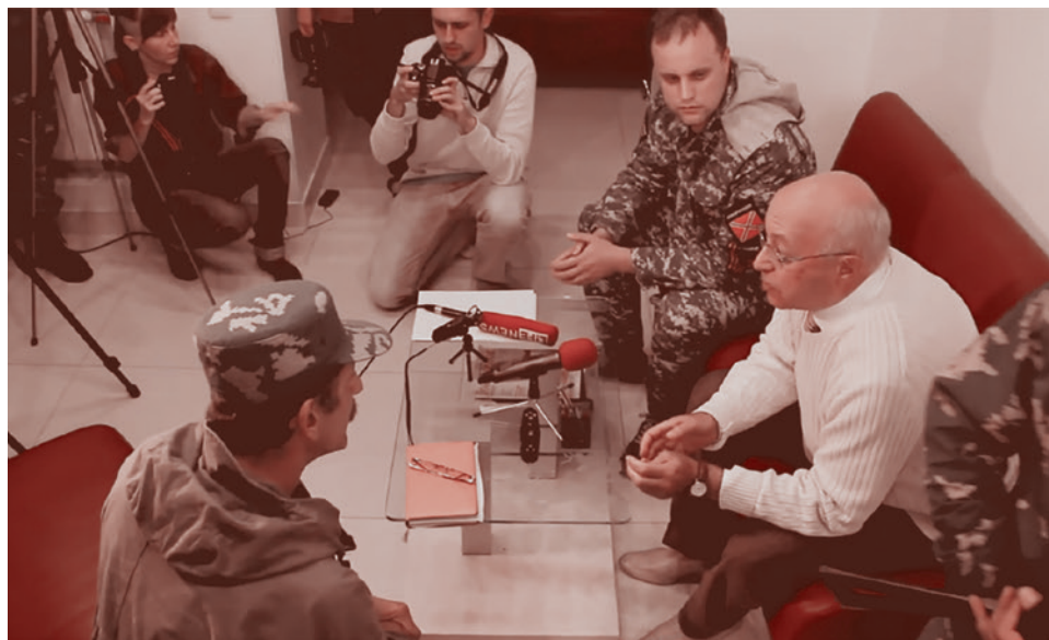
Сергей Кургинян на пресс-конференции в Донецке. 7 июля 2014 года

Но если это очевидно, то назвавшись русским державником и антизападником, разве можно одновременно с этим заигрывать хоть с СС, хоть с Дирлевангером, хоть с вот этим коллаборационизмом разного качества, хоть с прочими сходными вещами? Ведь нельзя же (внимание!), если сохранена хоть какая-то принципиальность! Назвался русским державником —