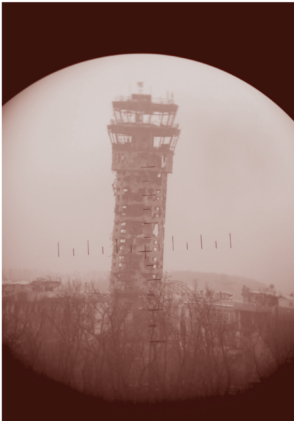
Диспетчерская вышка Донецкого аэропорта (объект «Башня»)