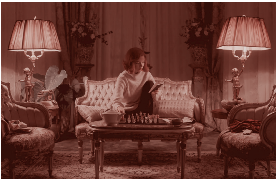
Кадр из сериала «Ход королевы». 2020

Однако задачей нашей статьи является даже не столько критика очередной антироссийской западной кинопродукции, сколько желание перевести разговор на родную почву и задать вопрос отечествен-