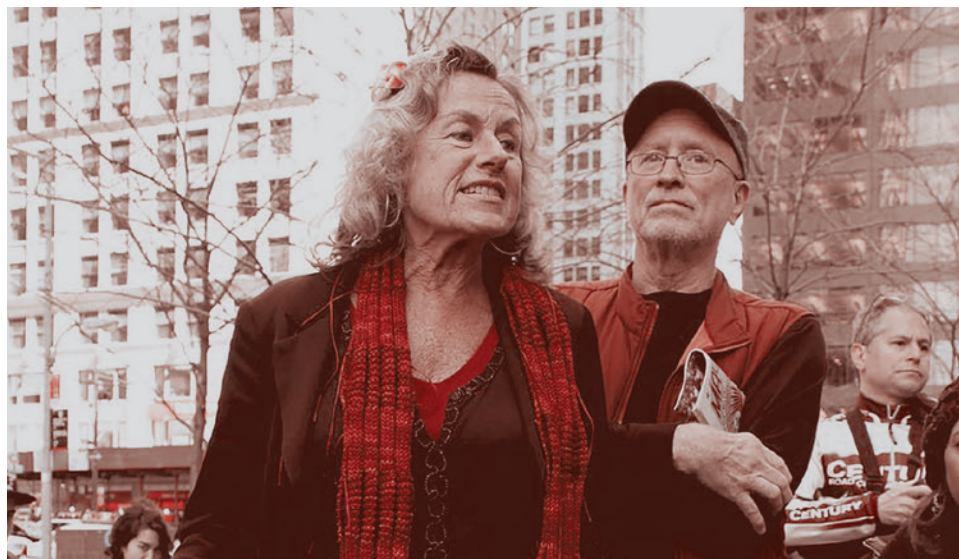
Основатели группы «синоптики» Бернгард Дорн и Билл Эйерс

В США существует несколько сетей, стремящихся координировать антифа. Крупнейшая из них — выросшая из ARA Torch Antifa Network. Сеть собирает ежегодные конференции, как до них делала ARA. Там выступают в том числе и приглашенные гости. Например, на конференции ARA в 2011 году выступали бывшие основатели