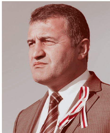
Президент Южной Осетии Анатолий Бибилов

В таких случаях всё всегда обстоит иначе — проще, конкретнее и грубее. Так как же именно всё обстоит?