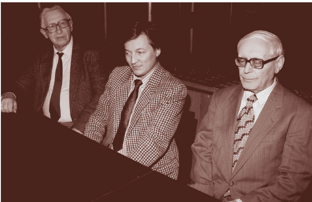
Советские чемпионы мира по шахматам Михаил Ботвинник, Анатолий Карпов, Василий Смыслов

ным деятелям кино. Да, в последние годы у нас появилось несколько фильмов на спортивную тематику (в частности, активно рекламируемый «Стрельцов»), показывающих сильные человеческие характеры и бурные спортивные эмоции. Но почти все они рассказывают об игровых видах спорта или о тех, девизом которых является «быстрее, выше, сильнее!», — по-видимому, киноавторы убеждены, что лишь это привлекает зрителя.