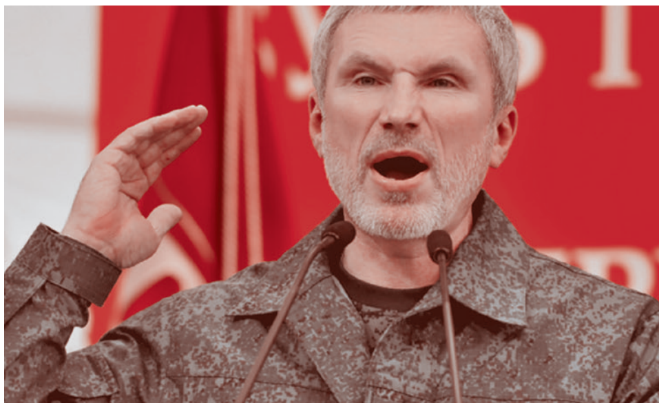
Председатель партии «Родина» Алексей Журавлев

«Ужасно русский» Лебедь прочнейшим образом взаимодействовал с Шамилем Ба-