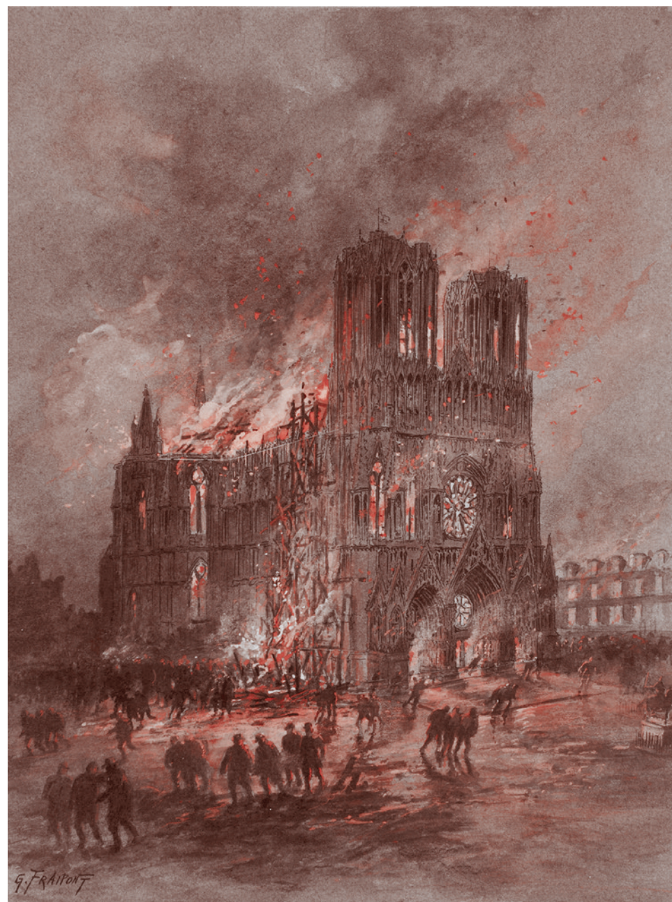
Гюстав Фремон. Горящий Реймский собор. 1915

Но, во-первых, речь шла об определенной доле этого лукавства, а не о стопроцентном лукавстве.