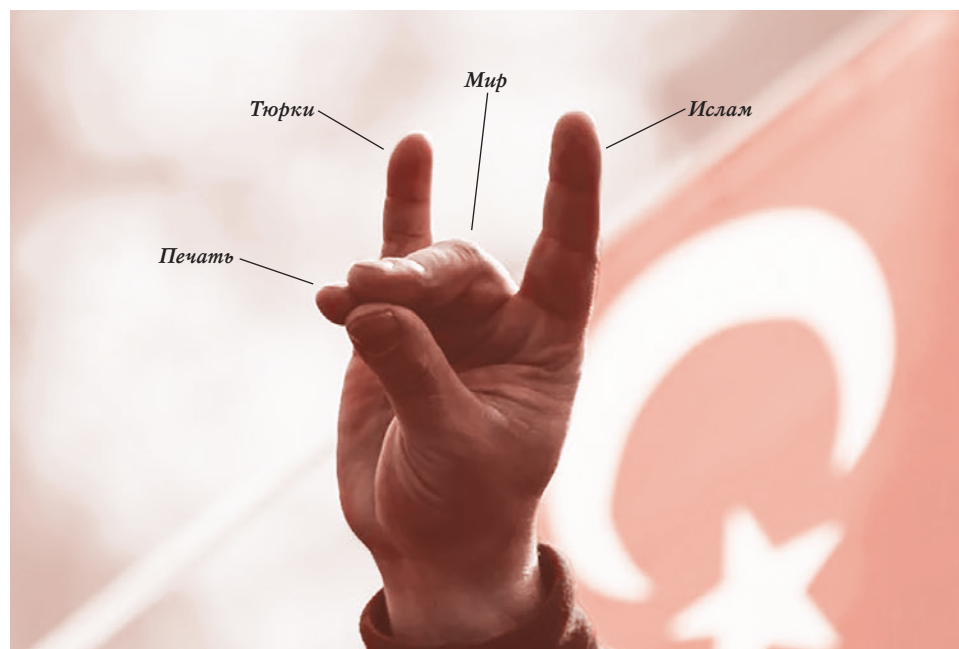
Символизм знака «Серых волков»

Однако уже через четыре месяца Тюркеш получает скандальную репутацию радикала-националиста, но, главное, начинает активно мешать политике КНЕ, решительно протестуя против плана военных обеспечить мирный переход к гражданскому правлению. Тюркеша исключают из