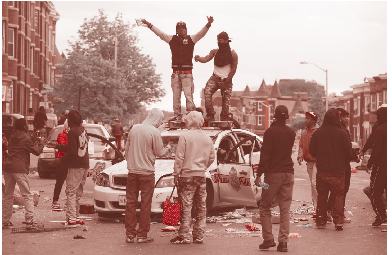
Протестующая молодежь в г. Балтимор, Мэриленд, США. 27 апреля 2015 г.

Я упомянул этот факт, а чиновники от образования ответили, что у нас теперь ввели квоты на наказания по расовому признаку. Что они чернокожих наказывают чаще, но нужно соблюдать соотношение между наказаниями по отношению к чернокожим и к белым детям. Поэтому им нужно было найти белого ученика, чтобы его наказать и тем самым выполнить план. И я понял, что проиграл.