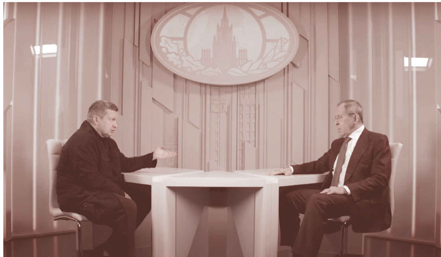
Владимир Соловьев берёт интервью у Сергея Лаврова

«Исходим из того, что мы готовы. В случае если еще раз увидим (как уже почувствовали не единожды), что в каких-то областях накладываются санкции, создающие риски для нашей