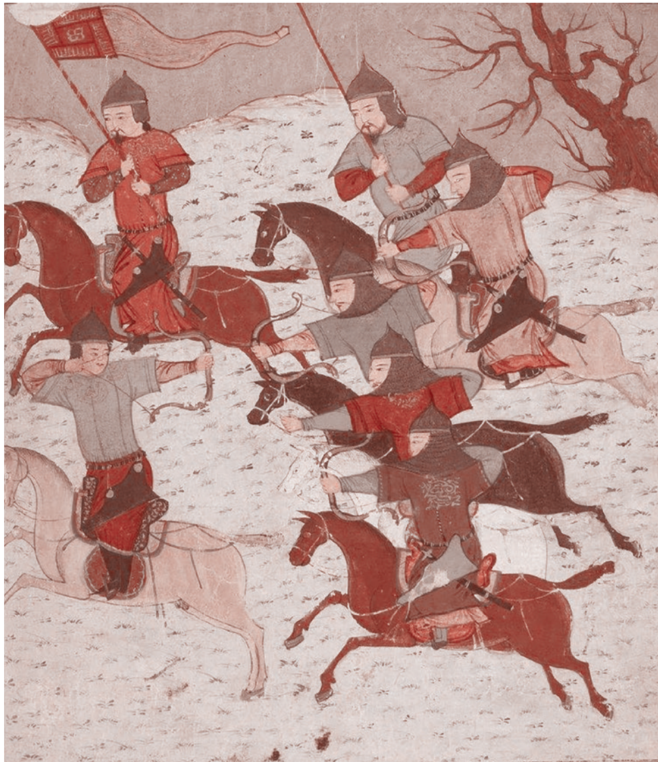
Монгольские конные лучники. Иллюстрация из Джамии ат-таварих Рашид ад-Дина. XIV век

А в 1959 году Турция предоставила НАТО (реально — США) право и возможность разместить на своей территории ядерные ракеты средней дальности «Юпитер», непосредственно угрожающие ключевым промышленным центрам и агломерациям СССР, включая Москву. Именно это, подчеркнем, вызвало необходимость