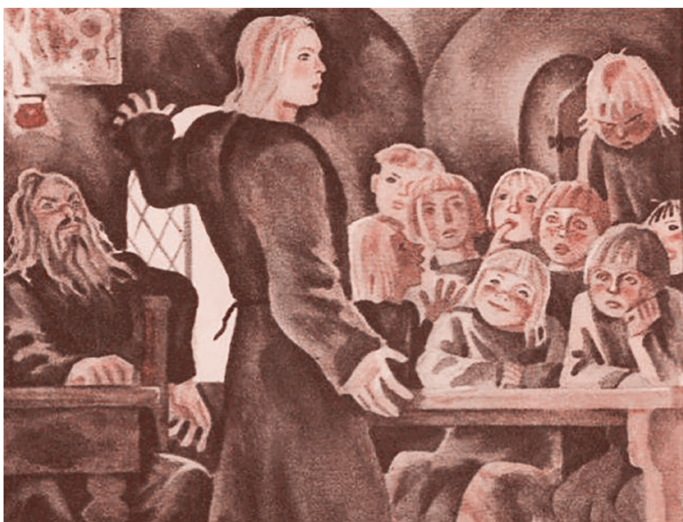
В. В. Перцов. Иллюстрация к книге «Михайло Ломоносов»