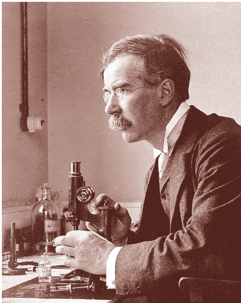
Сэр Алмрот Эдвард Райт

Боковыми цепями Эрлих назвал рецепторы, находящиеся на поверхности клеток. Не имея современных возможностей в сфере исследования с помощью электронных микроскопов, Эрлих умозри-