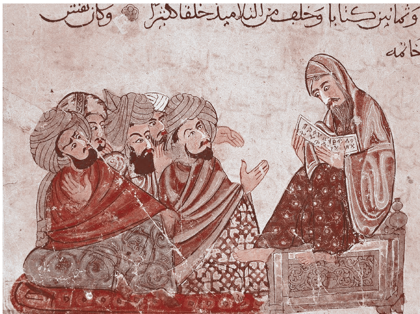
Сократ обсуждает философию с учениками. Миниатюра. Турция, XIII век