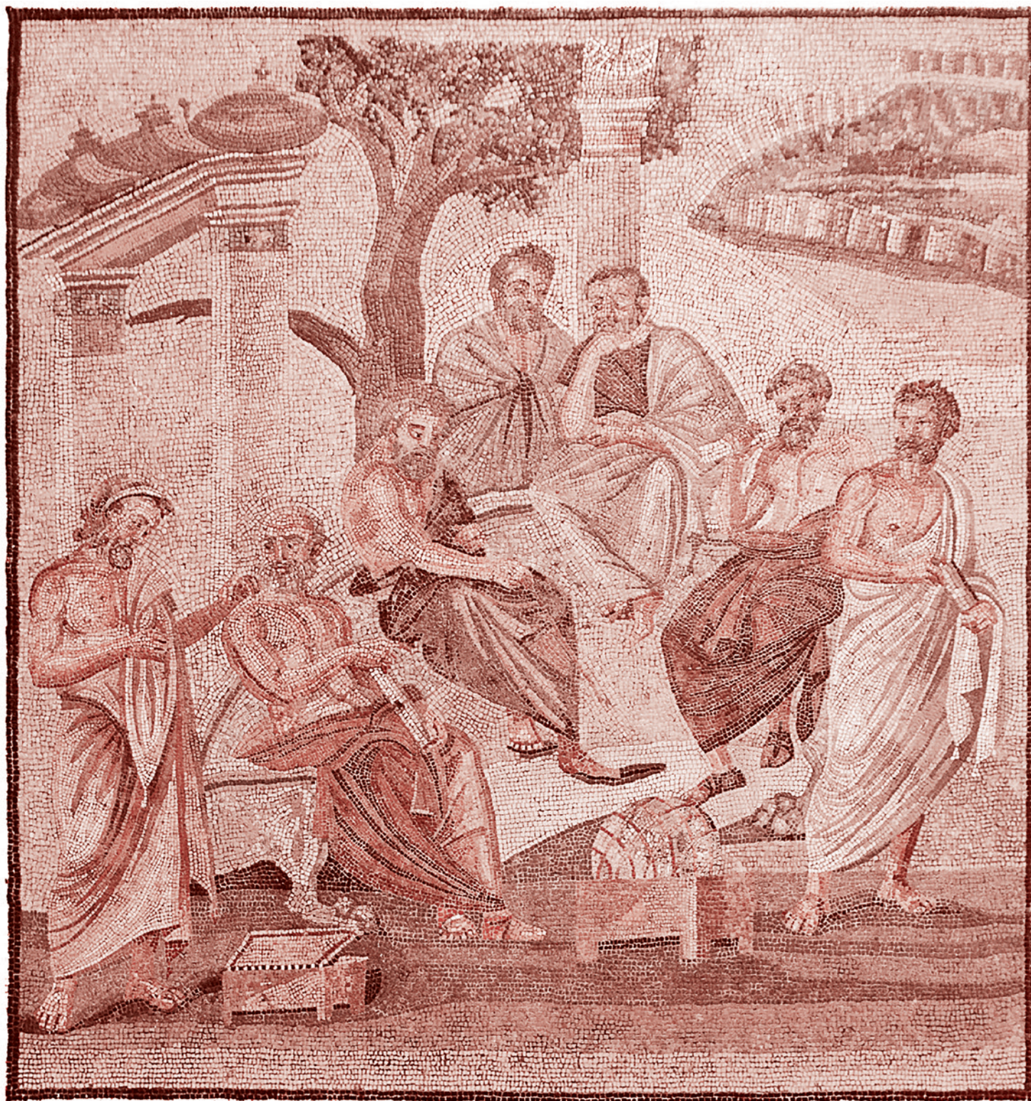
Академия Платона. Римская мозаика из дома Тита Симиния Стефана в Помпеях. I век

А что значит сохранение базовой модели образования при резком изменении