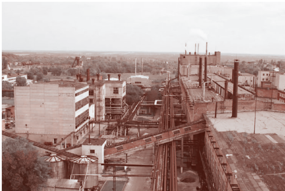
Восточный горно-обогатительный комбинат

В части ассоциации с ЕС Европарламент констатировал, что признает ассоциированный партнерский статус Украины и призывает к расширенному политическому диалогу для продвижения дальнейшей экономической интеграции и гармонизации законодательства.