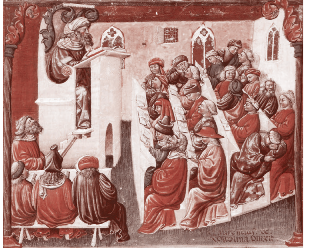
Лекция в средневековом университете. Книжная миниатюра. XIV век

О предельной важности этого общения всё время говорят и сами учителя, и преподаватели.