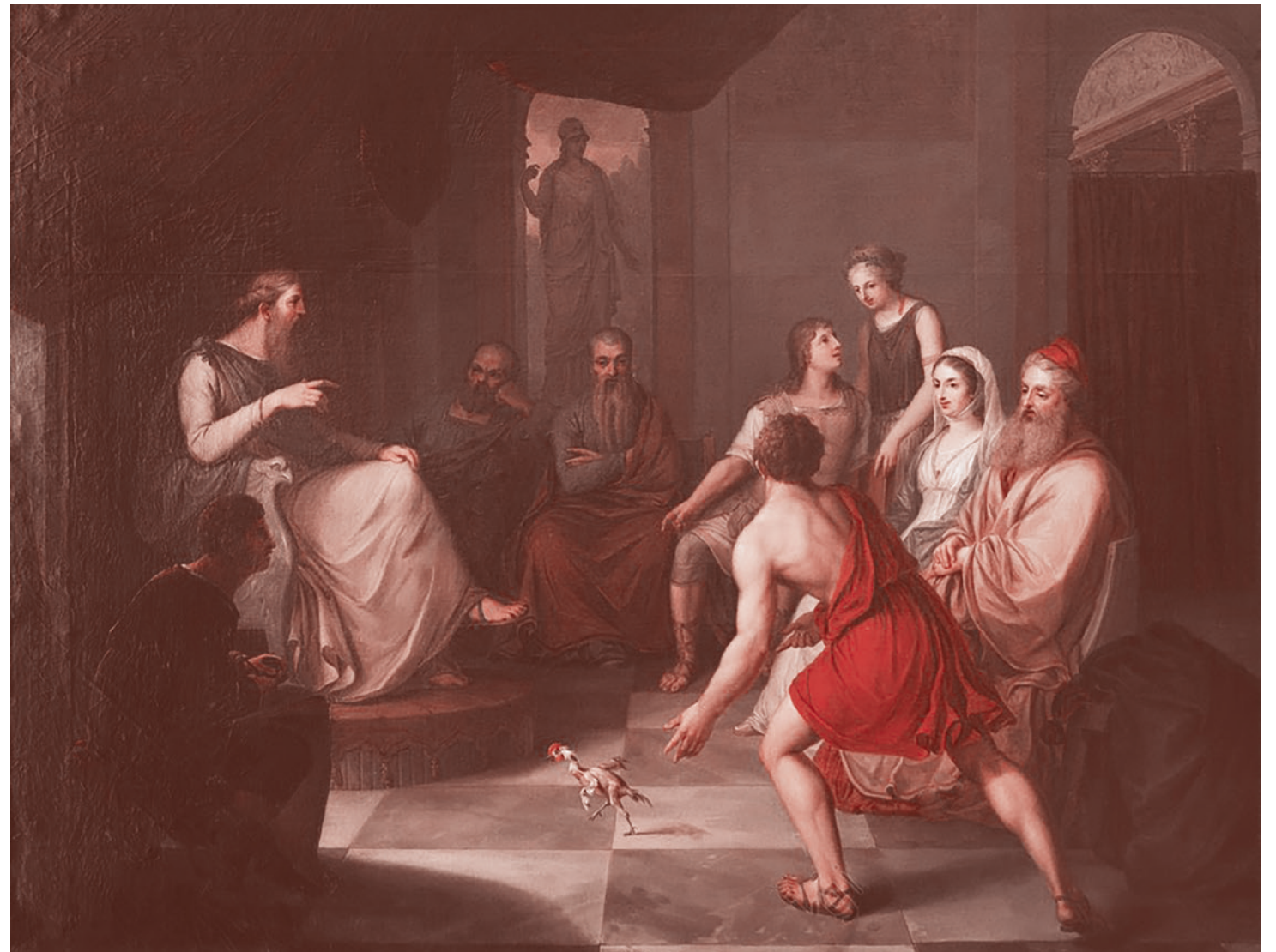
Фридрих Георг Вейч. Школа Платона. 1797

Для начала зададимся вопросом, а кто такой раб? Не с формально-правовой, а с сущностной точки зрения. Известное выражение, автором которого считается римский ученый и писатель Марк Теренций Варрон, гласит: «Теперь я буду говорить, какими орудиями труда обрабатывают-