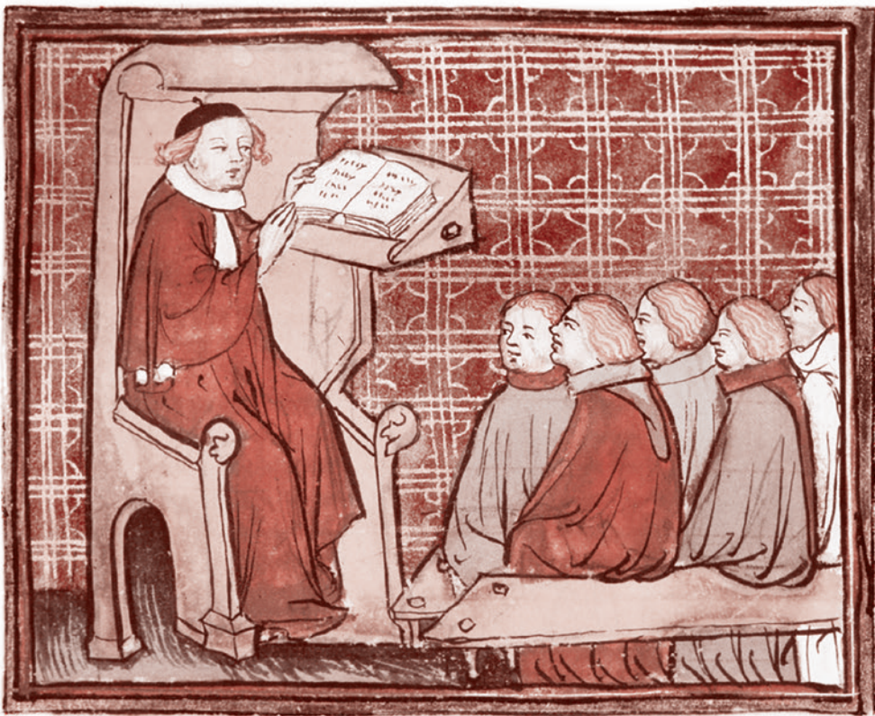
Студенты на лекции. Средневековая миниатюра