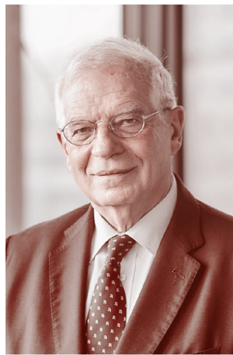
Жозеп Боррель.

Ранее глава МИД Германии Хайко Маас заявил, что министры иностранных дел стран Евросоюза 22 февраля обсудят возможность введения новых санкций против России.