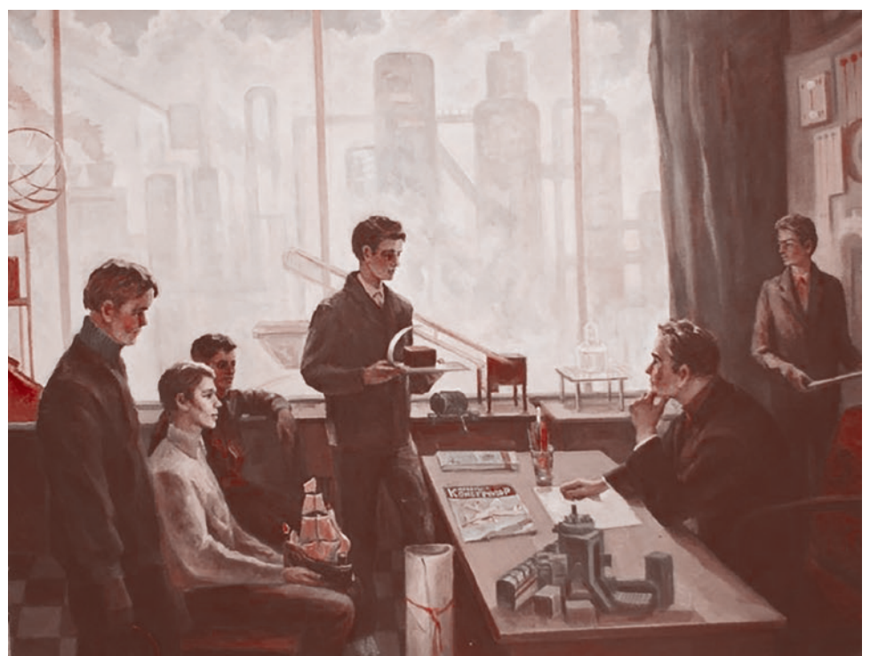
В. Смирнов. Производственное обучение. 1970-е гг.

Газета «Суть времени» зарегистрирована Федеральной службой по надзору в сфере связи, информационных технологий и массовых коммуникаций (Роскомнадзор) Свидетельство ПИ № ФС77-50554 от 9 июля 2012 года