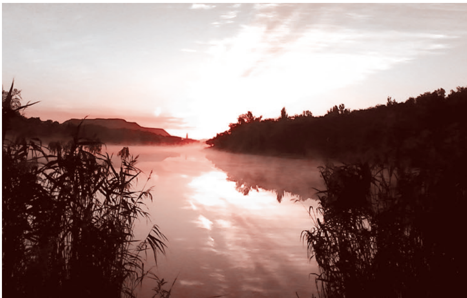
Рассвет над ставком

Бескрайние поля сменяли друг друга, как в калейдоскопе. То мы шли вдоль низкой, вновь выросшей пшеницы, зерна которой можно было растереть в ладонях и есть; ее сменяли высокие и сухие стебли амброзии — пыльца забивала нос и горло, семена цеплялись за одежду, набивались в берцы, за шиворот, под разгрузку; потом тянулись черные, поникшие головой подсолнухи. Всё это создавало впечатление нереального, потустороннего мира, чем война и является.