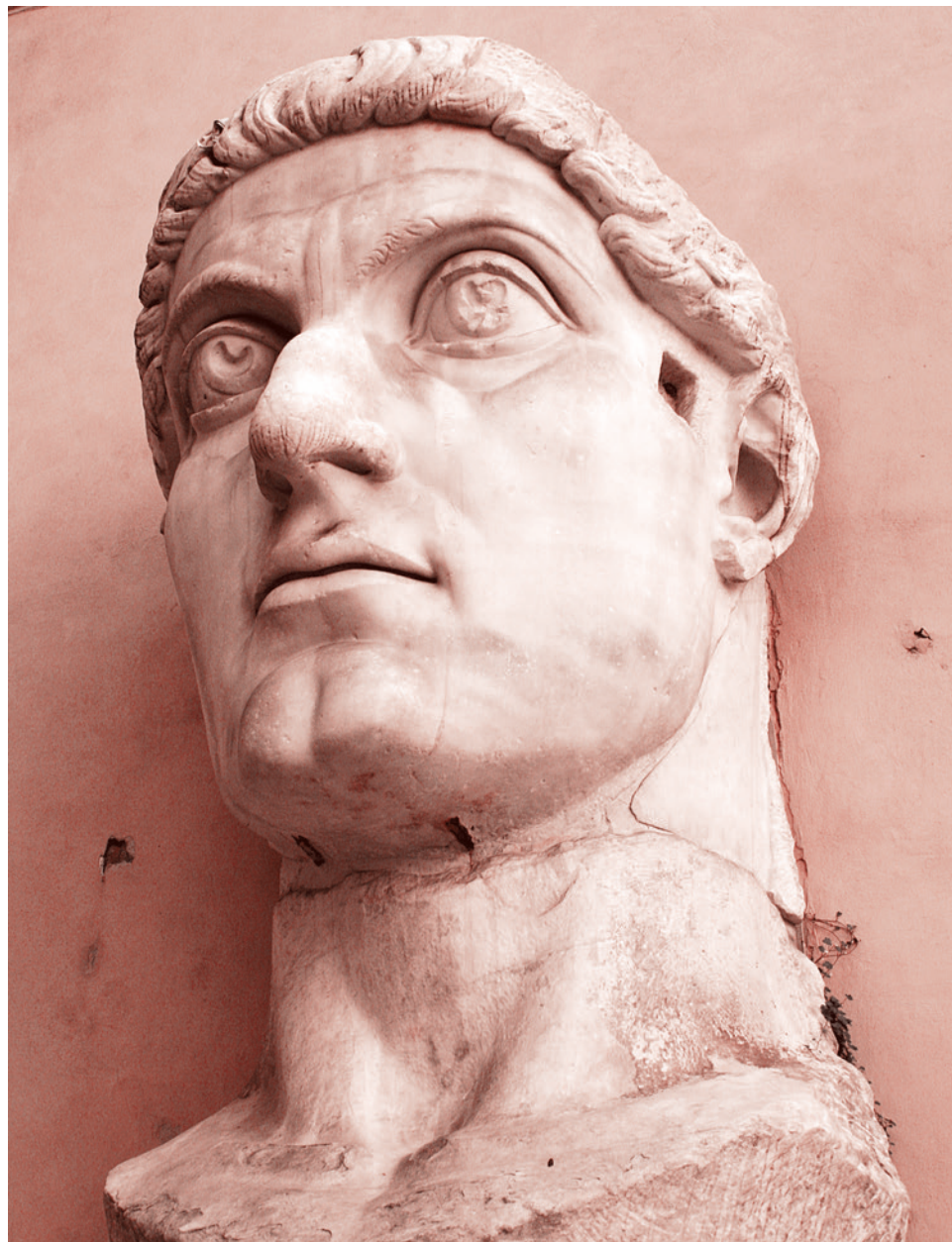
Император Византии Константин I Великий

Кургинян: Или, как говорил Высоцкий: «Но мне туда не надо».