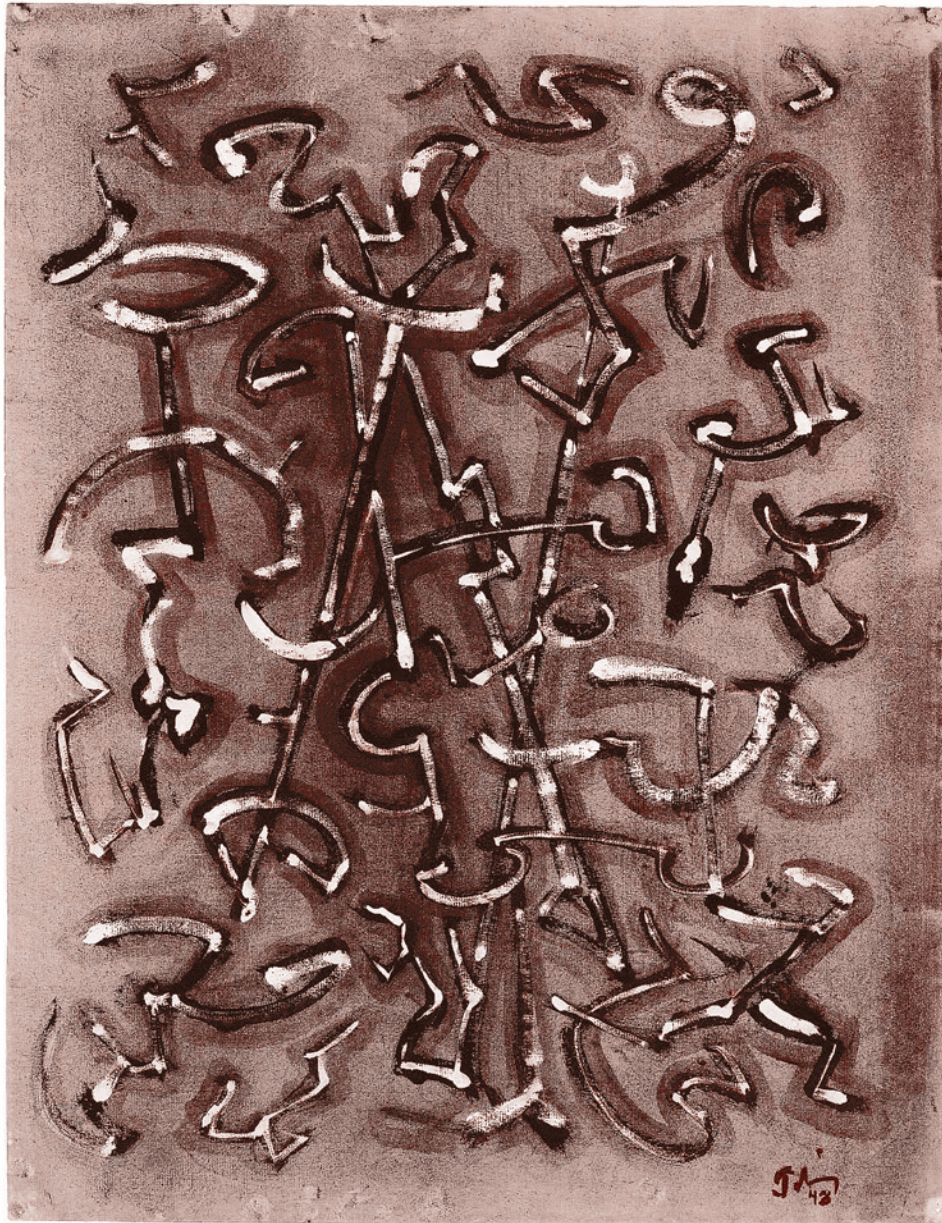
Марк Тоби. Транзит. 1948

Что очень впечатляет лично меня — это как все вызовы, маркирующие Транзит, собрались дружно и вместе. Ну, казалось бы, почему не может быть вызова, связанного с «меньшинствами», самого по себе? Притом что не было бы проблем с обществом потребления или роботизацией. Наверно, часть из вызовов неявно объединена, и они действительно связаны, если