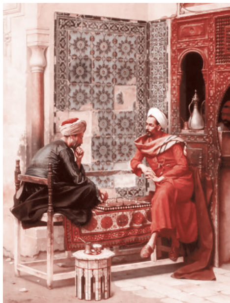
Осман Хамди Бей. Шахматы. Начало XX века

Напомним, в 2017 году четверка стран Персидского залива — Бахрейн, ОАЭ, Египет и Саудовская Аравия — объявила Ката-