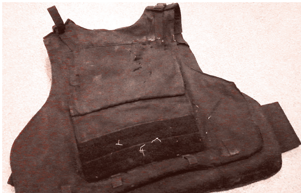
Спасший жизнь бронезилет