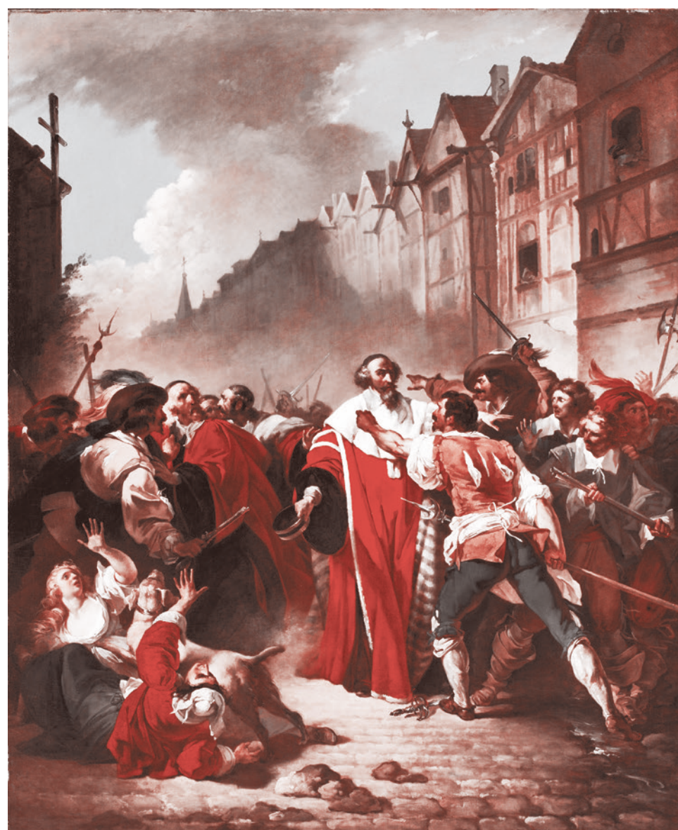
Франсуа Андре Винсент. Президент Моле, схваченный по- встанцами во времена Фронды. 1778–1779