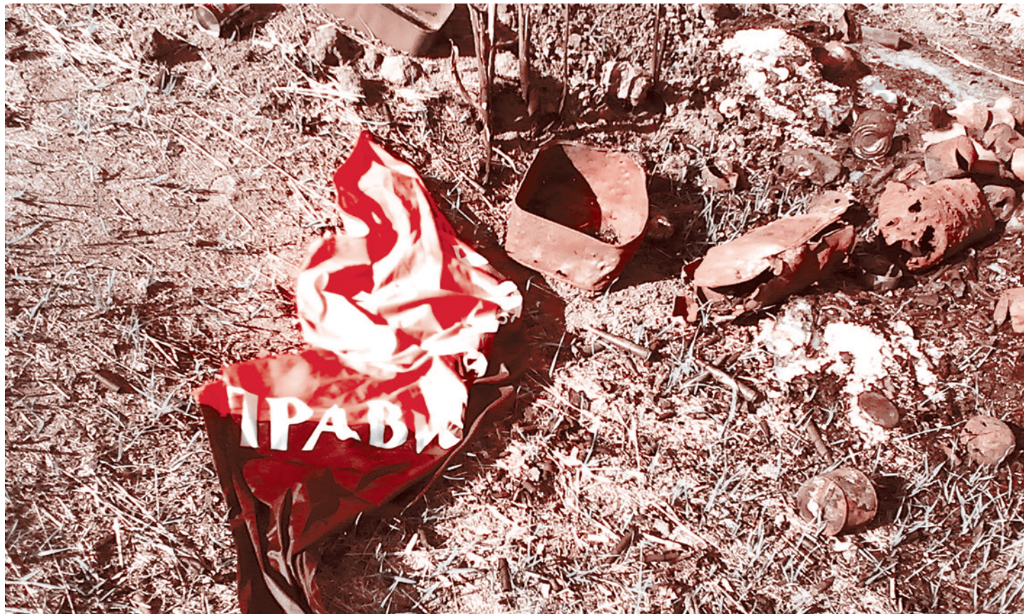
Брошенный среди укреплений противника флаг «Правого сектора» (экстремистская организация, деятельность которой запрещена в РФ)

Наступил октябрь, еще сухой и солнечный, но по утрам уже ложился иней, а над ставком клубился пар, поднимаясь к небу под первыми лучами. Мы уже две не-