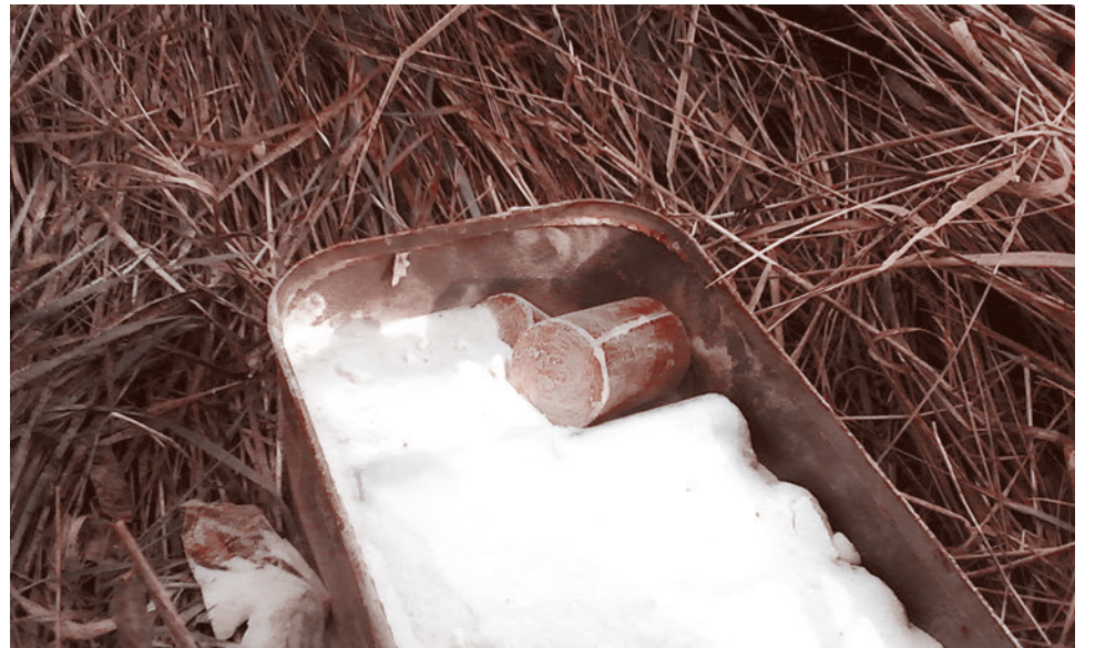
Она же, самодельная мина — цинк из-под патронов, начиненный гексогеном