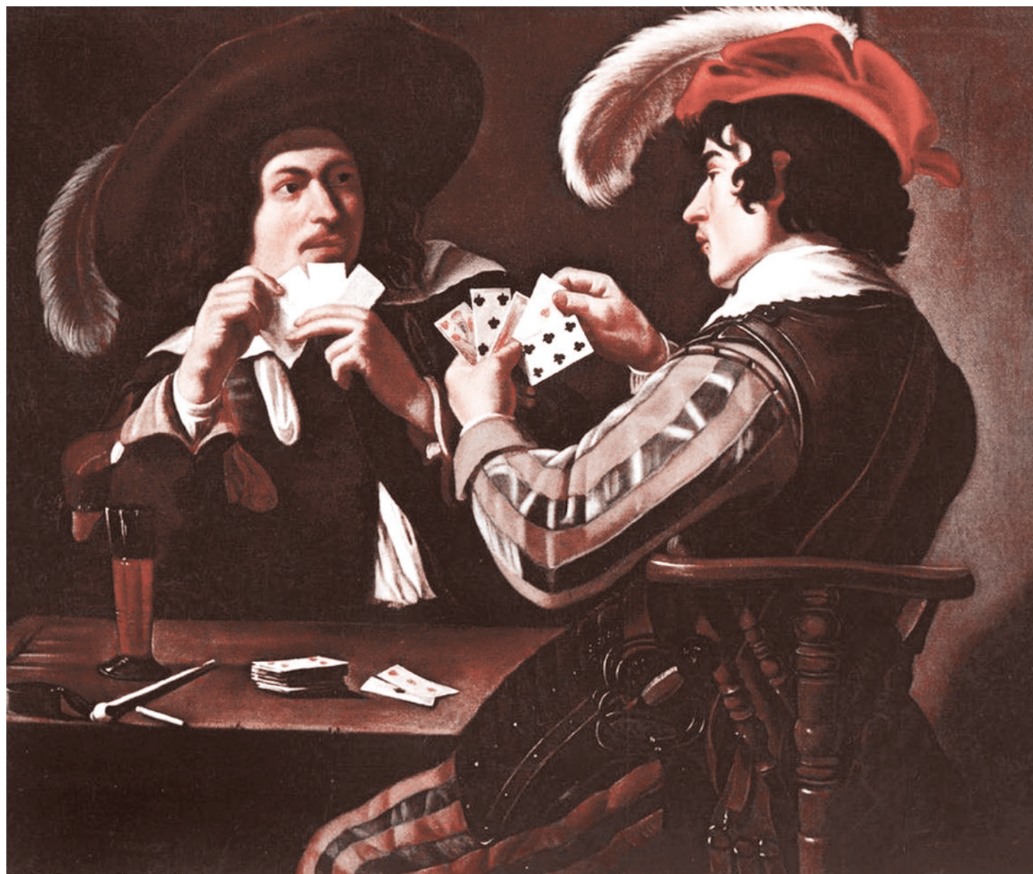
Теодор Ромбоутс. Картежники. 1630

12 января встревожилась и Италия. Глава МИД Италии Луиджи Ди Майо назначил бывшего посла страны в Алжире Паскуале Феррару специальным посланником в Ливии. Ди Майо заявил, что «он бу-