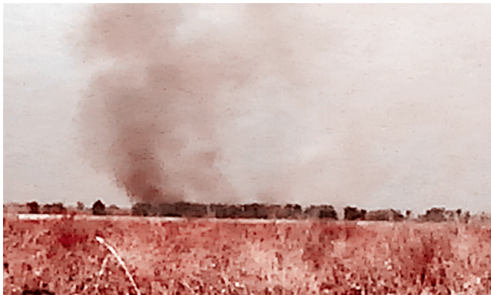
Попытки «укров» поджечь траву, чтобы достать раненого