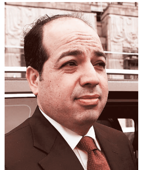
А. Майтыг в Москве

28 января в Москву прибыл «с рабочим визитом» глава МИД Восточного правительства Ливии Абдель Хади Хувейдж. На встрече с зам. министра иностранных дел России Михаилом Богдановым Хувейдж передал ему послание от спикера палаты представителей Ливии Агилы Салеа. Подробности документа не разглашаются. Кроме того, Хувейдж обсудил с Богдановым развитие двустороннего сотрудничества, в том числе приглашение компаниям РФ принять участие в экономических проектах на востоке Ливии, а также (и это, видимо, главное) согласование с Москвой ряда инициатив Бенгази по формированию в Ливии единого временного правительства.