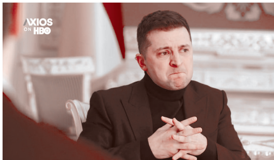
Владимир Зеленский в интервью телеканалу HBO

Черноморский флот приступил к слежению за действиями эсминца «Портер» ВМС США. Как сообщили в Национальном центре управления обороной РФ, аме-