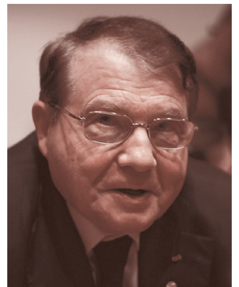
Люк Монтанье в 2008 году

Мне могут сказать, что я сгущаю краски. И мне самому хотелось бы так думать. Но давайте обсудим, что происходит в реальности. Вот прямо в той очевидной реальности, которую мы все лицезреем.