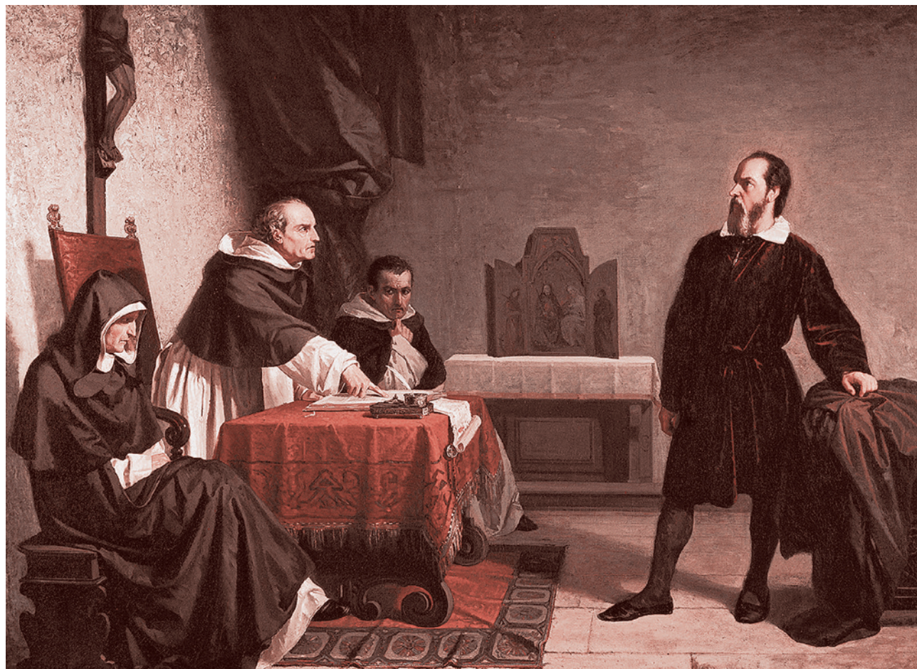
Кристиано Банти. Галилей перед Инквизицией. 1857

Свобода — это очень коварное понятие. Выдающийся французский писатель и общественный деятель Антуан де Сент-Экзюпери утверждал, что освободить человека надо от чего-то и для чего-то, то есть надо соединить такое освобождение от неких оков, мешающих человеку двигаться куда угодно, со способностью человека определять, куда он идет («камо грядеши»). Если человек лишен этой способности, этого компаса, этого ориентира, этой самой способности к целеполаганию, то для чего его освобождать, спрашивает Экзюпери? И захочет ли он такого освобождения? Может, напротив, он захочет, чтобы ему вернули оковы (о чем, кстати, и говорит Великий инквизитор)?