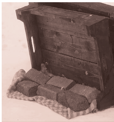
Кадр из фильма «Блокадный дневник» (фрагмент). 2020

От города возникают двойные ощущения: с одной стороны, автор попытался изобразить детали быта жителей осажденного Ленинграда, с другой же — сам город выглядит несколько сюрреалистично. Дома оказываются обледелеными и покрытыми многометровыми сосульками — это при том, что Ленинград постоянно подвергает-