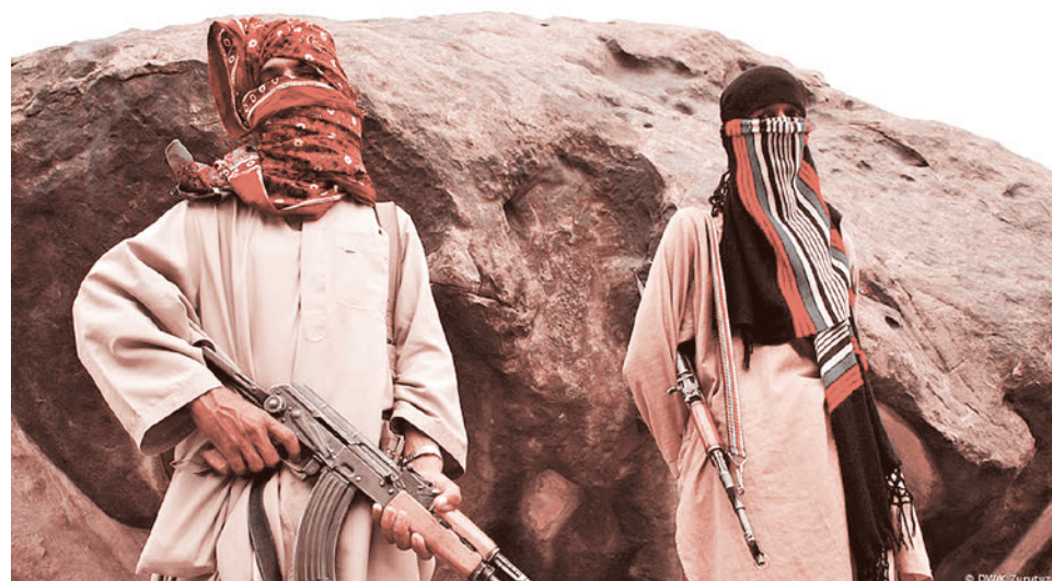
Боевики в Пакистане

Сейчас Ирану нужно увидеть следующий реальный факт. Региону больше чем когда-либо требуются мир, спокойствие, стабильность. Тюркский мир обладает жизненно важным значением для реализации интересов Ирана как прикаспийской страны в среднем и нижнем коридоре. Более того, если Иран желает создать противовес США и Израилю, то может добиться этого путем укрепления своих энергетических, транспортных, логистических сетей в регионе. И если он так чувствительно относится к вопросу своей территориальной целостности, что его задевает стихотворение, то он должен рассматривать сотрудничество Турции