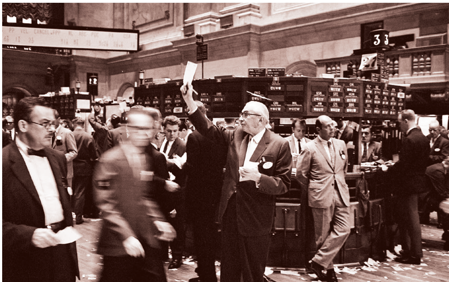
Нью-Йоркская фондовая биржа. 1963

Когда в мире утвердившегося ультрамонокapитализма основной проблемой стала фактическая невозможность для «низов» отстаивать свои права, когда стали сомнительными и демократический путь борьбы, и путь «борьбы» — в сердце финансовой цивилизации, на Уолл-стрит, вдруг случилось то, чего никто не ждал.