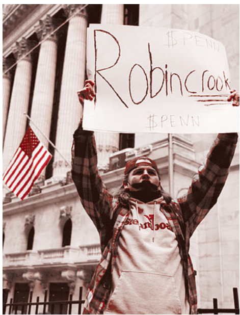
Протестующий перед зданием Уолл-стрит с плакатом «Robinhood» («Робин-мошенник»). 28 января 2021 года.

«Это за тебя, отец!» — написал другой участник форума. Он вспомнил коллапс рынка жилья в 2008 году, и как семья и все родственники потеряли дома, а отец начал спиваться. А в это время акулы Уолл-стрит пили шампанское и подсчитывали прибыль. «Это все деньги, которые у меня есть. Но я предпочту потерять их, чем дать им то, что они хотят, чтобы разрушить меня. Потеря денег нисколько меня не трогает, поскольку я не особенно их ценю. Я готов всё сжечь, лишь бы насолить им».