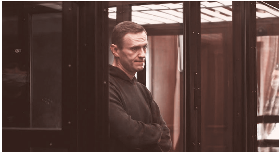
Навальный в зале Симоновского суда. 2 февраля 2021 года

В эфире телеканала «Дождь» Мария Захарова заявила, что сотрудник по-