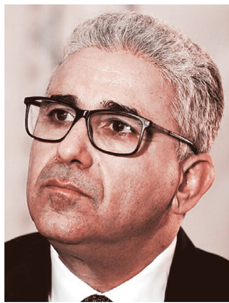
Фатхи Башага