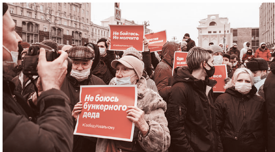
Сторонники Навального на митинге 23 января

Но одним предчувствием — или, если хотите, догадкой — я поделиться должен. Это касается грядущего мироустройства. Заключается она в том, что разница между условными модернистами и условными архаистами — не политическая и даже не идеологическая, а антропологическая. С этим нельзя ничего сделать — существуют разные породы людей, как и разные породы собак, и никакими уговорами нельзя превратить охотничью собаку в левретку,