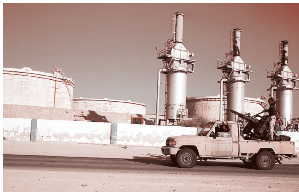
Вооруженные люди захватили нефтяное месторождение на юго-западе Ливии, контролируемое армией Хафтара

11 декабря канал Libya 24 сообщил, что глава ПНС Ливии Фаиз Саррадж использует разногласия в правительстве и в правлении Центробанка Ливии, а также конфликт между ливийской Национальной нефтяной корпорацией НОС и ЦБ, чтобы попытаться сместить с должности главу Центробанка Сиддика аль-Кабир и за счет этого получить контроль за валютными доходами от экспорта ливийской нефти.