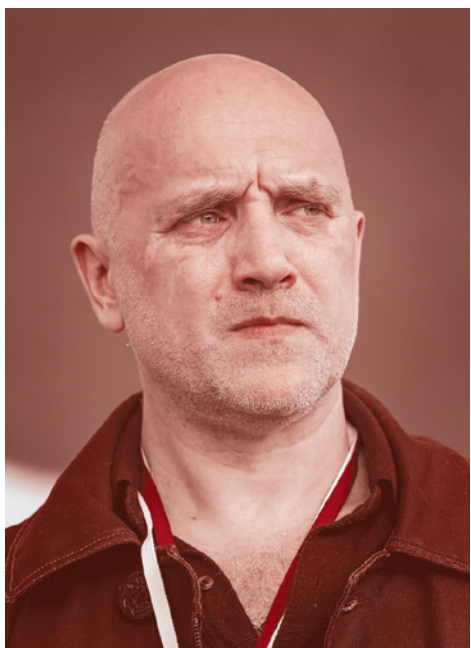
Захар Прилепин

С кем и как объединять «Справедливую Россию», с октября 2020 г. партийцы обсуждали с АП, говорит один из участников переговоров. По словам собеседника, Миронов был сторонником присоединения «Родины» и Партии пенсионеров за социальную справедливость, «но их ему не отдали»: «Пенсионеры сами по себе ценны — работают на отъеме голосов у КПРФ, да и самих справедливоссов». «Родина» же, по сути, оказалась единственной партией со льготой для участия в думских выборах, которая может забирать голоса у ЛДПР благодаря радикальной риторике, говорит этот собеседник.