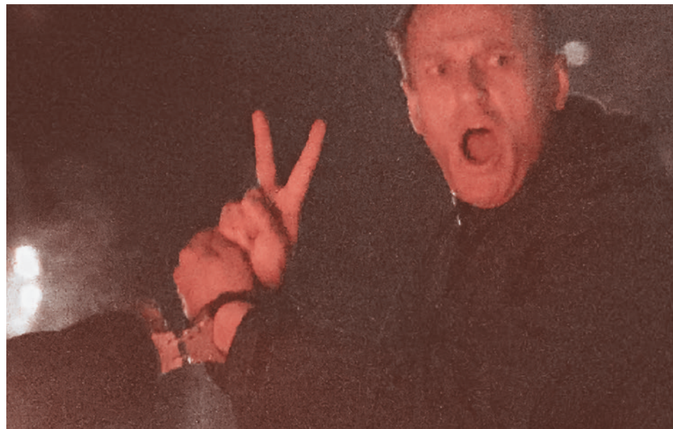
Алексей Навальный во время задержания в аэропорту. 17 января 2021 г.

Европарламент потребует от ЕС остановить строительство «Северного потока — 2» и ввести санк-