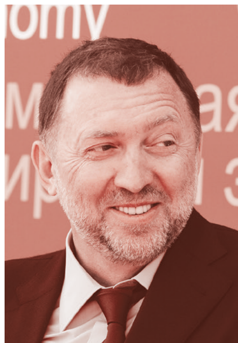
Олег Дерипаска

Отдельный вопрос, состоятся ли выборы в сентябре, и что будет сразу после них, учитывая ту бурную протестную деятельность, которую мы наблюдаем в связи с возвращением из Германии Алексея Навального?