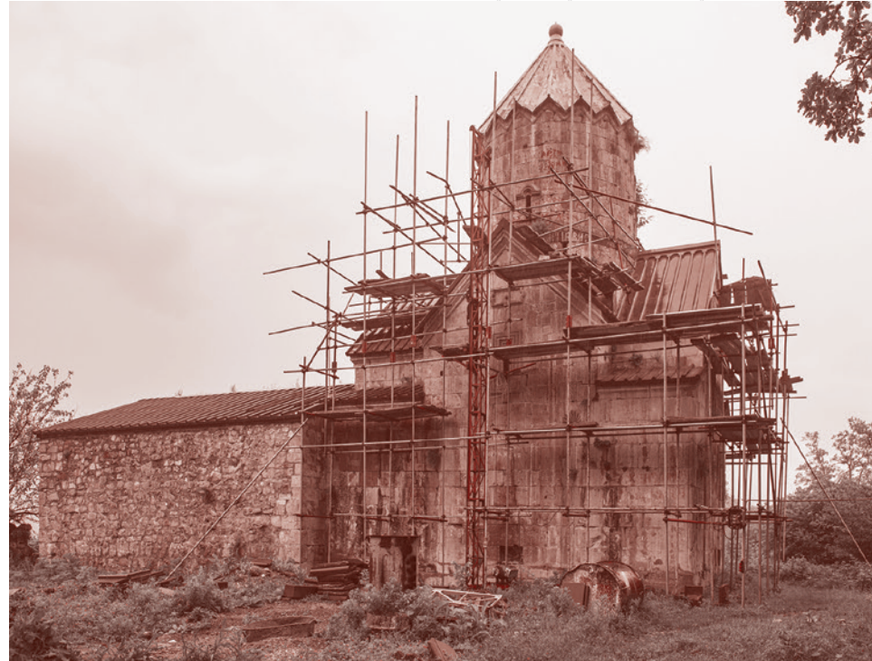
Монастырь Гтчаванк (Гтич). Построен в XIII в.

Потому что там ведь как было? Там были церкви XII–XIII веков, как, например, Гандзасар, Гтич, один из храмов Дадиванка этого времени. Потом был некий перерыв, связанный с серьезным исламским давлением на этот регион. И потом еще в XVII–XVIII и в начале XIX века было построено довольно много церквей, но очень скромного статуса, даже не из тесаного камня. Там хватало сил только, может быть, порталы сделать в тесаном камне. Это такие крестьянского вида, сложенные из булыжного камня на растворе крепкие базилики, иногда с маленькой колоколенкой. И их десятки, их в Гадрутском районе очень много. И по их поводу я в очень большой тревоге, не говоря уже про археологические объекты.