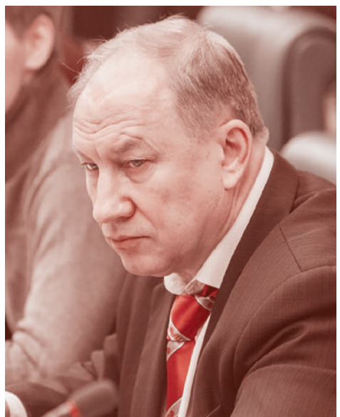
Валерий Рашикин

«Мы видим, что московская организация, во главе которой стоит Рашикин (КПРФ), приняла поддержку Алексея Навального во время «умного голосования».