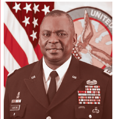
Ллойд Остин

По его мнению, действия России в Черном море и восточной части Средиземного моря предпринимаются для того, чтобы дестабилизировать Украину и Грузию, а также бросить вызов операциям США и их союзников. Он считает, что «силы США и НАТО в Черном море и восточном Средиземноморье являются ключевым фактором сдерживания российской агрессии». Остин также