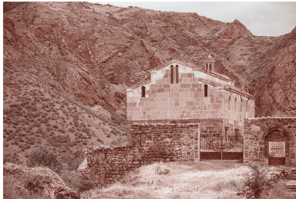
Монастырь Цицернаванк. Построен в IV–VI вв. н. э.

Но есть еще масса не настолько заметных памятников, которые, скорее всего, просто погибнут.