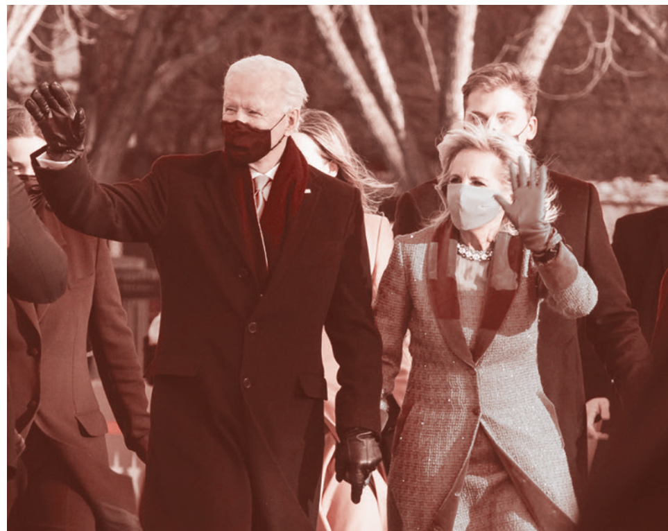
Джо Байден во время инаугурации вместе со своей супругой. 20 января 2021 г.

Администрация Байдена наделит Совет по национальной безопасности новой задачей борьбы с «экстремизмом», заявила пресс-секретарь Белого дома Джен Паски.