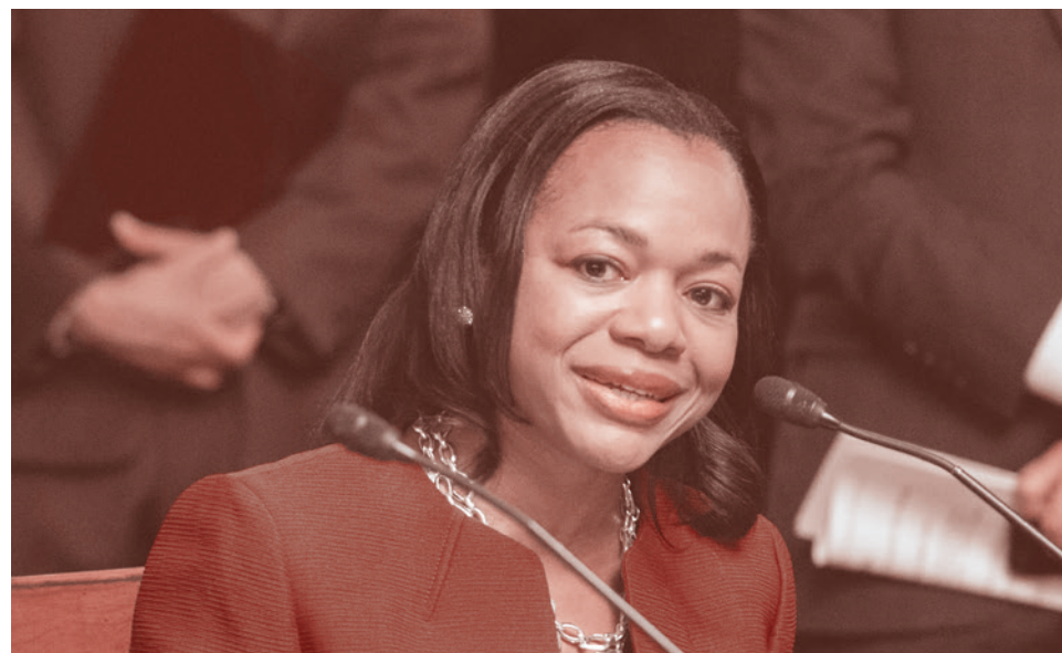
Кристен Кларк писала в 1994 году о превосходстве чернокожих

Кургинян: Спасибо большое всем. Спасибо.