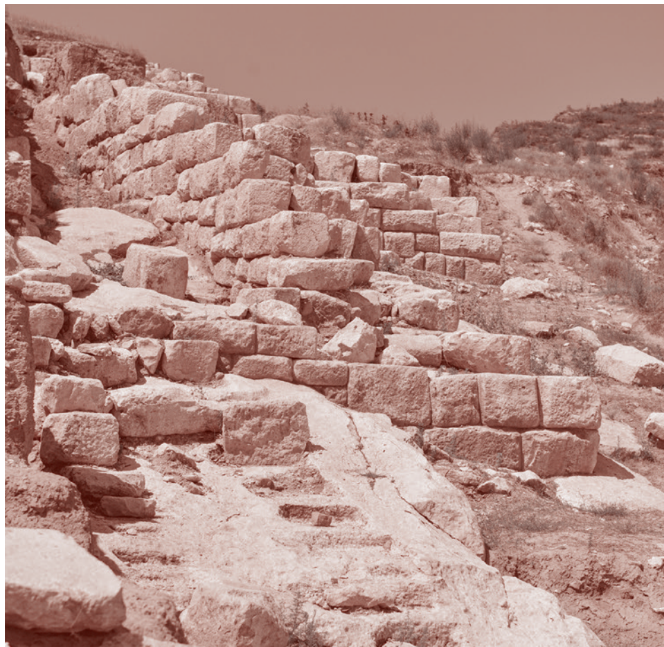
Остатки Тигранакерта — одного из четырех городов Великой Армении. Основан в I в. до н.э.

Еще пример. Бесконечные бодания, причем довольно упорные, существовали между армянскими и грузинскими истори-