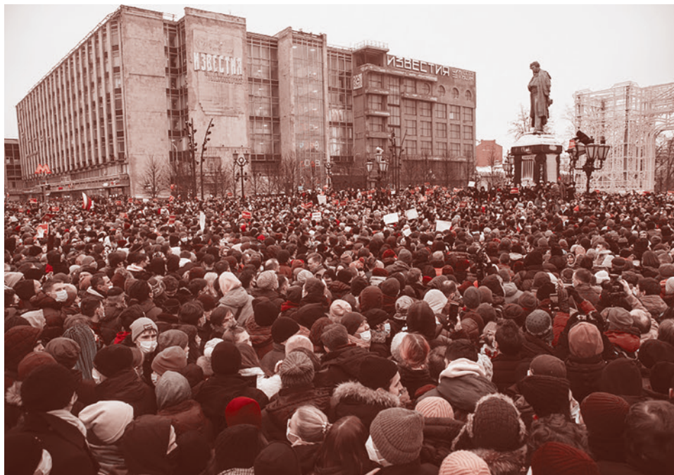
Митинг в поддержку Алексея Навального в Москве. 23 января 2021 г.

МИД России раскритиковал действия посольства США, поместившего на сайте информацию о несогласованных массовых акциях, которые могут пройти 23 января в российских городах.