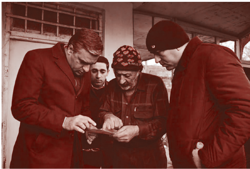
Часть дома у жителя Шурнуха оказалась на территории Азербайджана

Мы хорошо помним о начале в 2015 году военной операции в Сирии для борьбы с терроризмом на «дальних подступах», но вот сегодня мы видим, что подоб-