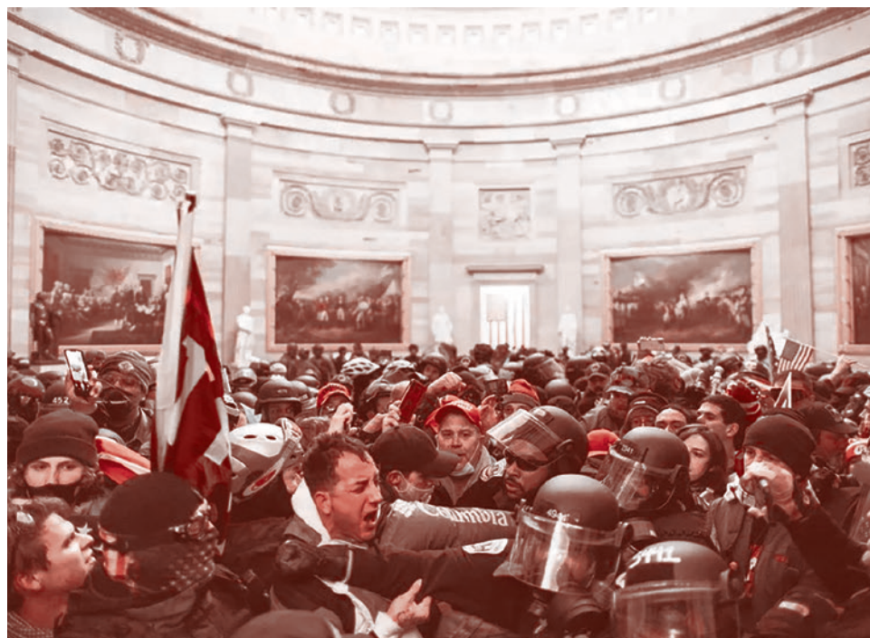
Драка демонстрантов с полицией в Капитолии, США. 6 января 2021 г.