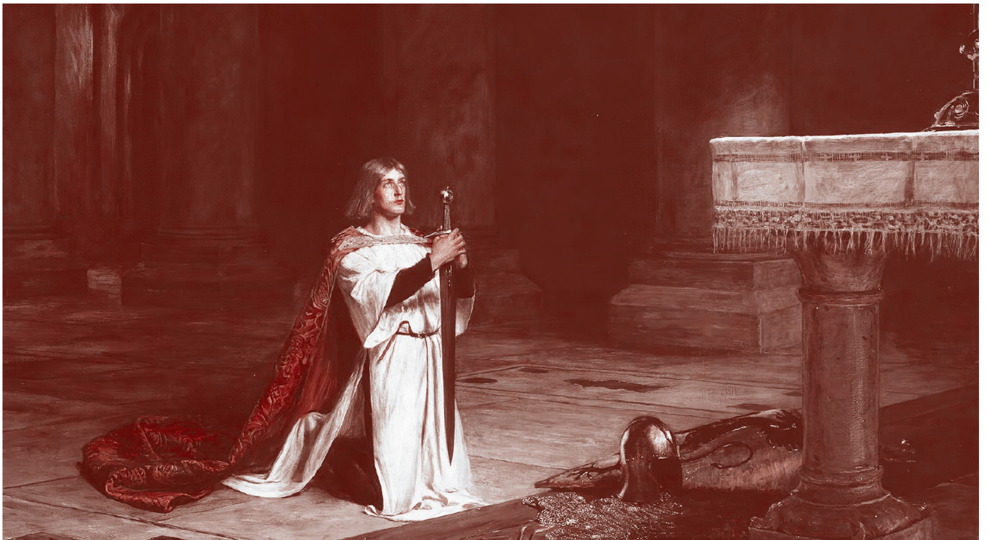
Джон Петти. Бдение (The Vigil). XIX век.

Это войны так называемых элитных групп, которые сначала всех этих самонадеянных олигархов зачистили или упаковали нужным образом, а потом стали разбираться друг с другом, потому что