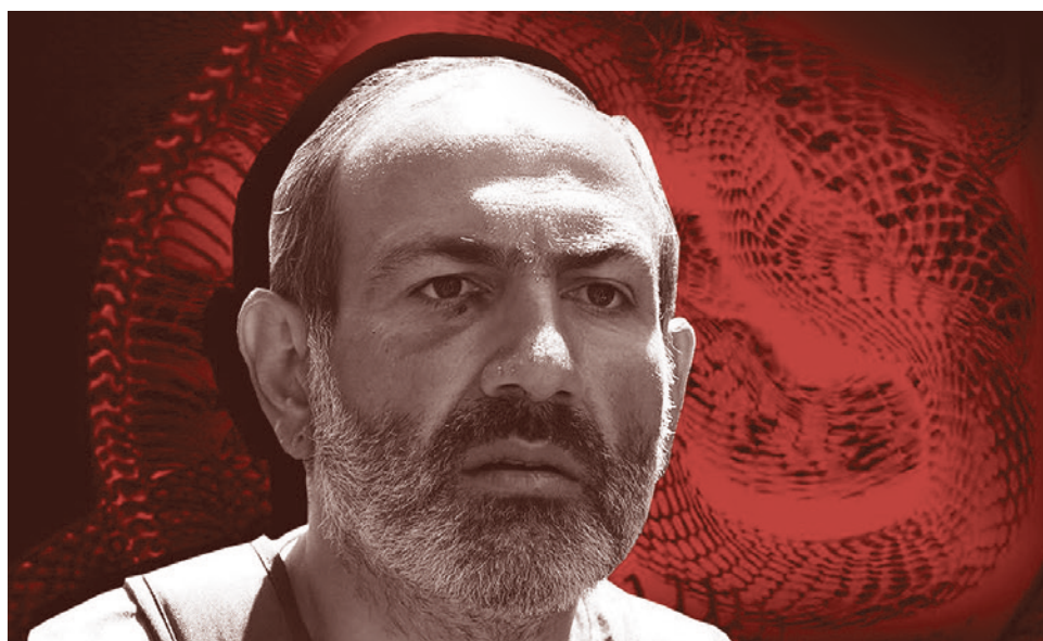
Премьер-министр Армении Никол Пашинян.