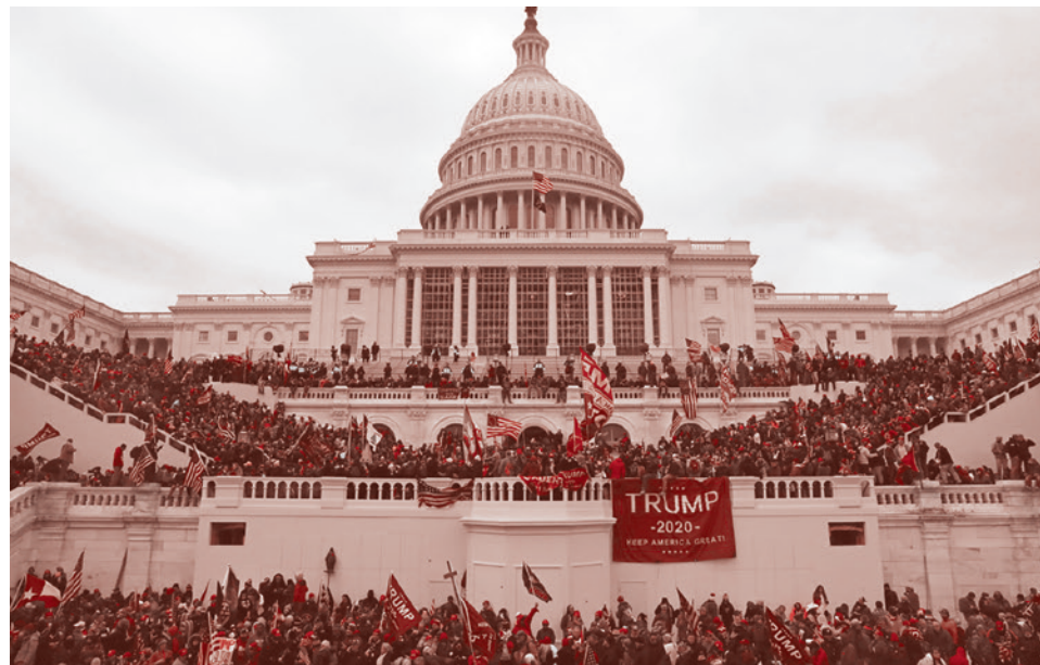
Сторонники Трампа у здания Капитолия. Вашингтон, США. 6 января 2021 г.

«Мы никогда не сдадимся, мы никогда не признаем поражения. Этого не про-