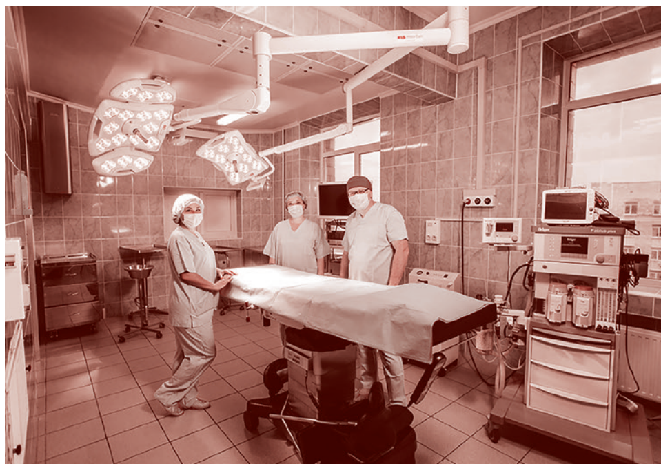
Операционная в ГКБ им. Демикова

Заявлялось многократно, что особая опасность новой коронавирусной инфекции состоит в том, что больных, которым нужна кислородная поддержка, негде лечить. Что нет достаточного количества инфекционных больниц, поэтому надо