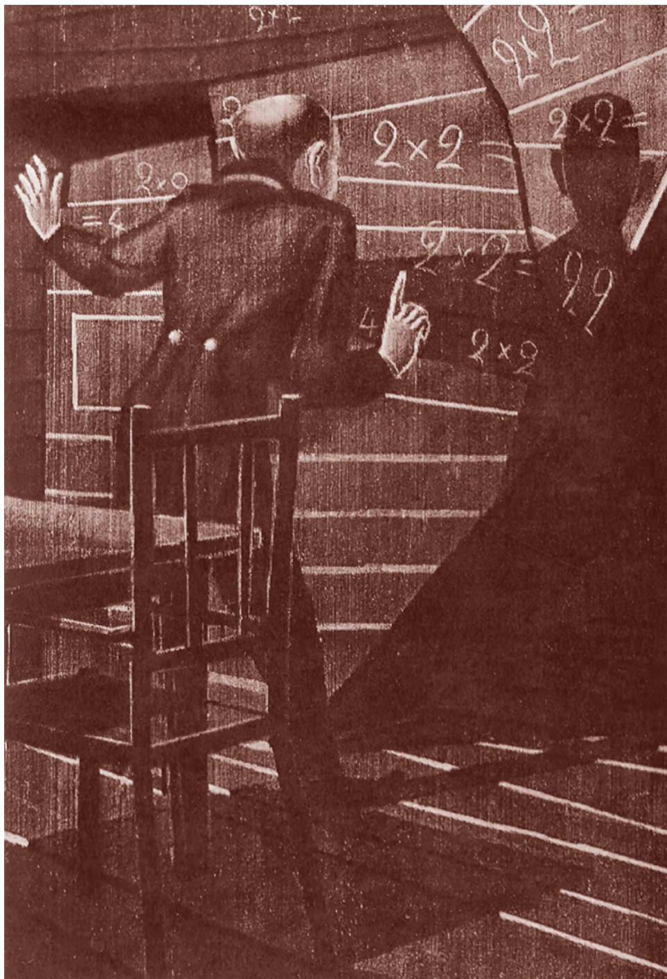
Александр Алексеев. Иллюстрация к повести Ф.М. Достоевского «Записки из подполья». 1967 г.

В разговоре Ивана Карамазова с чертом, в другом произведении, черт говорит: «Скучища неприличнейшая...»