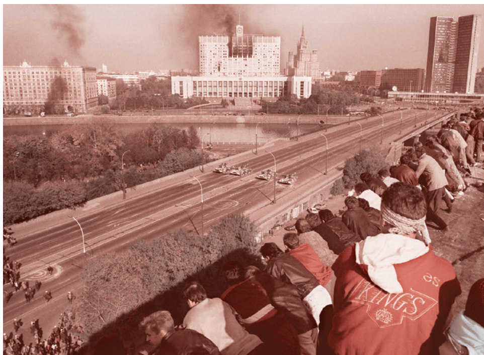
Расстрел Белого дома. Октябрь 1993 г.