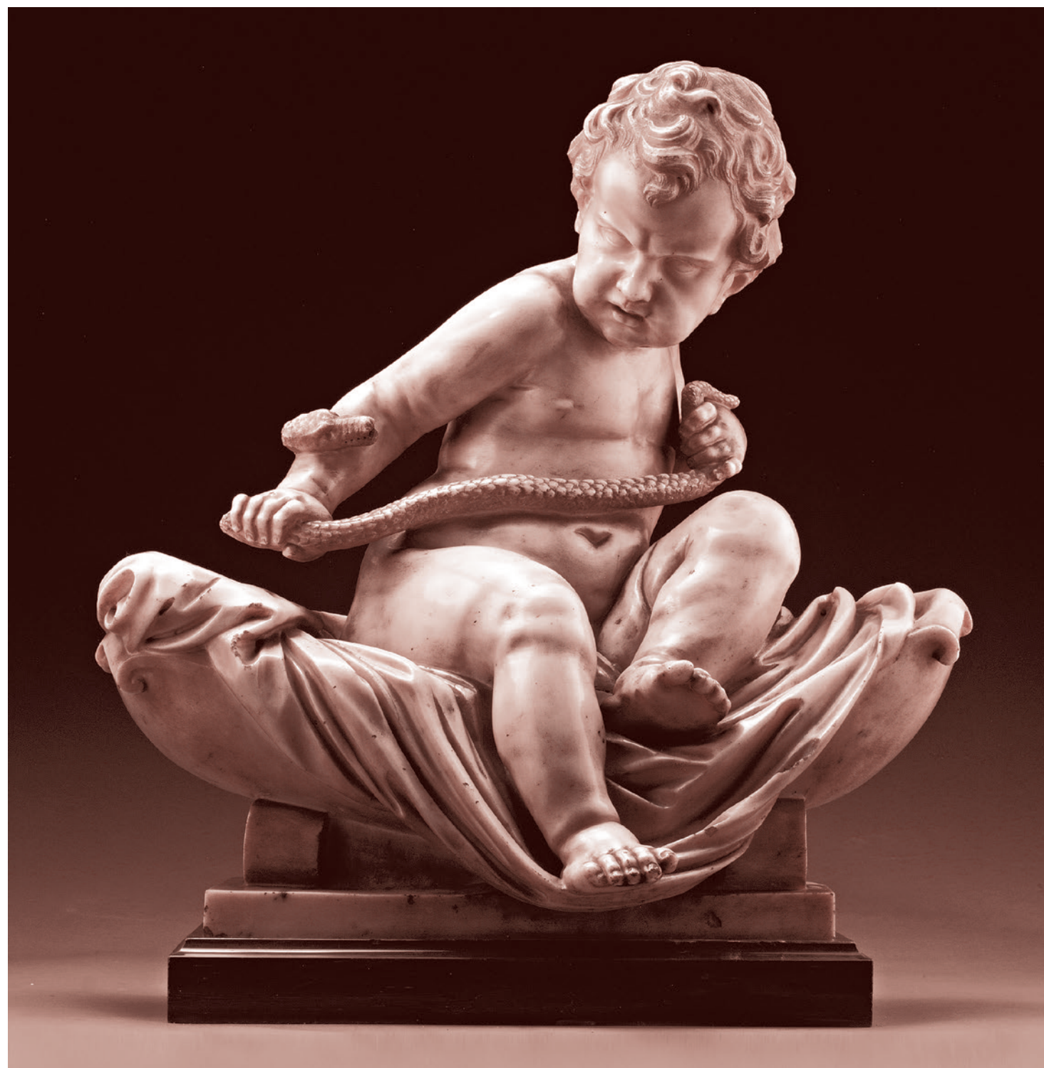
Младенец Геракл сражается со змеей. Италия. XVIII в.