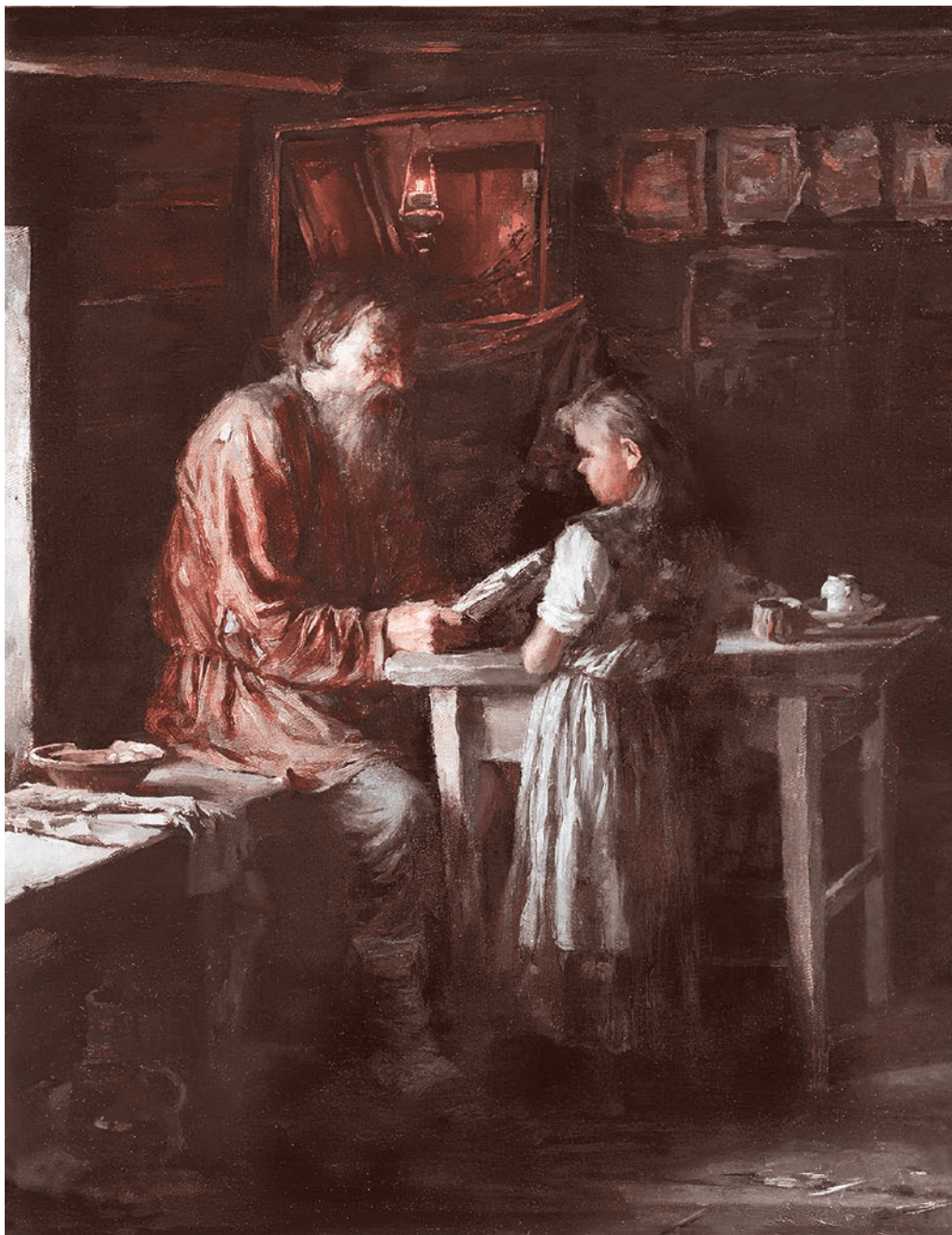
Василий Максимов. Единственный учитель. 1880-е гг.