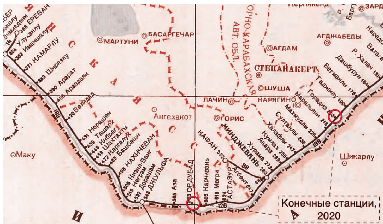
Конечные станции на Закавказской ж/д имени А.П.Берия со стороны Нахичевани и Баку по состоянию на 2020 г.

С началом первой карабахской войны сообщение по этому участку дороги прекратилось. Вскоре под контроль Нагорного Карабаха перешли районы между НКАО и иранской границей — Кубатлинский, Зангеланский, Джебраильский и треть