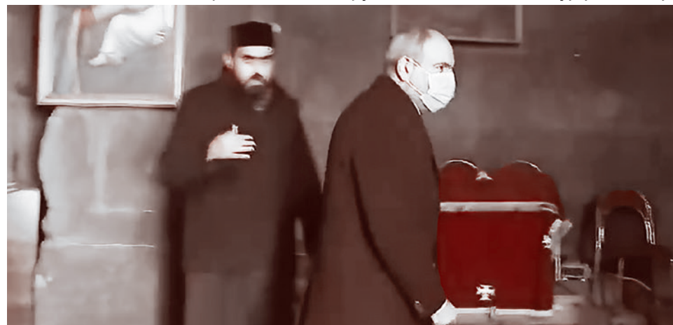
... и просит его уйти. 21 декабря 2020 г. (Кадр из видео: youtube.com)

Утром 21 декабря премьер-министр Армении совершил поездку в Сюникскую область Армении, в которой процесс демаркации уже привел к транспортной блокаде некоторых деревень, многие населенные пункты оказались в непосредственной зоне обстрела со стороны азербайджанских позиций. Все это вызвало протесты населения и призывы жителей и глав общин к отставке премьер-министра.