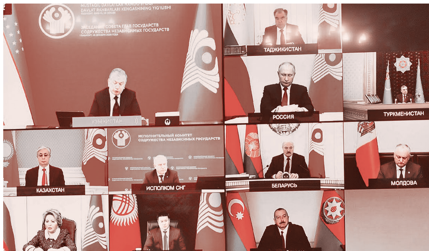
Встреча глав стран СНГ. 18 декабря 2020 г.

И. Алиев: Азербайджан одержал победу над страной-оккупантом, которая долгие годы удерживала под оккупацией значительные территории нашей земли, международно признанные территории. В результате войны, по нашим данным, более 80% потенциала вооруженных сил Армении было уничтожено. Для Азербайджана — это война Отечественная, освободительная, для Армении — это война захватническая, оккупационная... Начиная с 2019 года армянское руководство