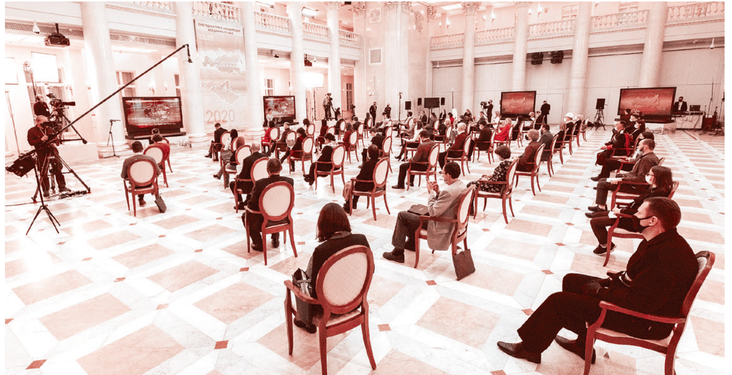
Журналисты на пресс-конференции Владимира Путина. 17 декабря 2020 г.

У нас на данный момент времени падение ВВП — 3,6%. Это меньше, чем практически во всех ведущих странах Европы, Евросоюза, меньше, чем в Соединенных Штатах Америки. Уровень безработицы у нас был в начале года 4,7%, сейчас, как вы знаете, он вырос до 6,3%. 70% российского бюджета уже формируется не за счет нефтегазовых доходов. Это значит, что мы не в полной мере, но все-таки начинаем слезать с так называемой нефтегазовой иглы. И если кому-то хочется представлять нас до сих пор бензозаправкой, то это уже не имеет под собой реальных оснований.