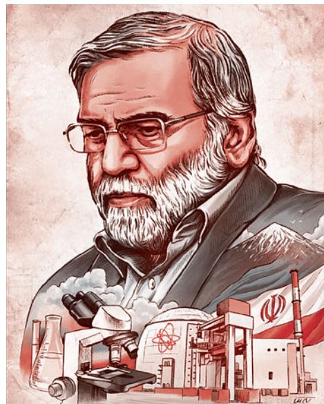
Мохсен ФахризADE. 2020

Экс-директор ЦРУ (2013–2017), главный советник президента Обамы по борьбе с терроризмом Джон Бреннан осудил убийство