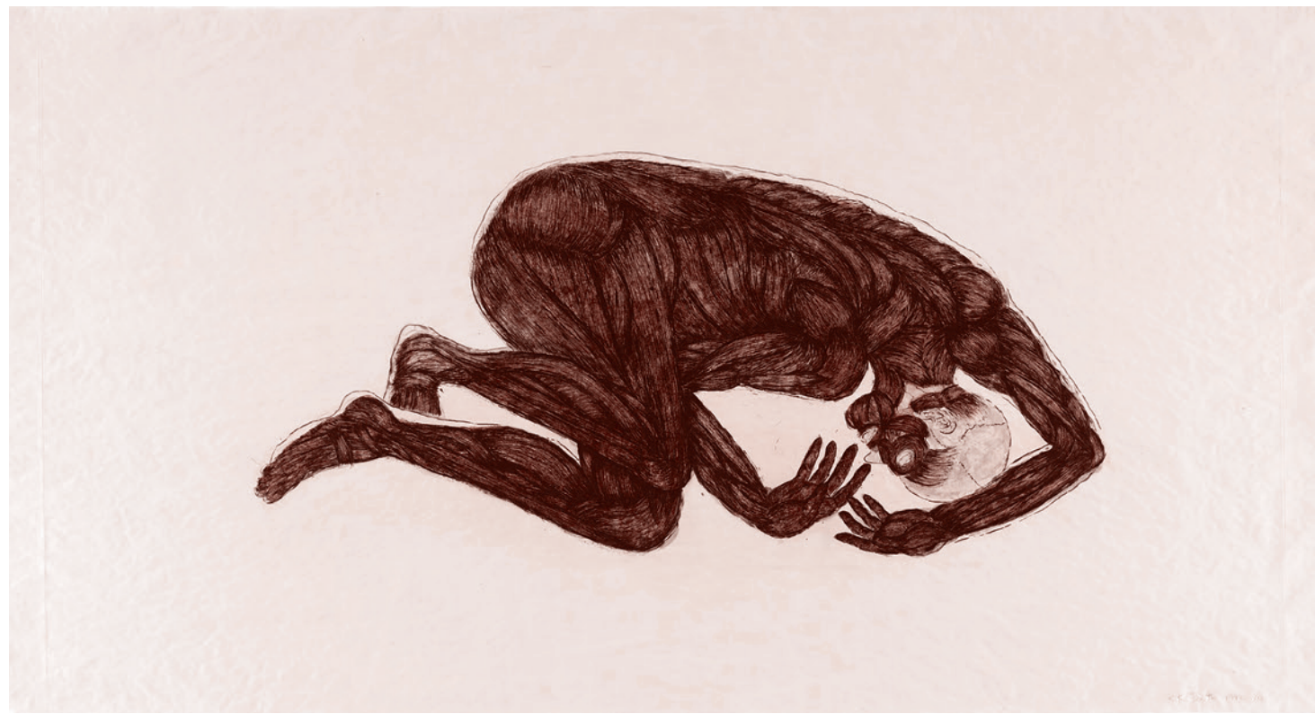
Кики Смит. Сон. 1992

Итак, негатив № 1, встроенный в систему современного здравоохранения и жизни в целом, — это приверженность определенной узкой группы антигуманистических (очень цепких, умных и образованных мерзавцев, кардинальным образом влияющих на научные, производственные и иные тенденции, они же глобальный тренд) тому, что можно именовать моде-