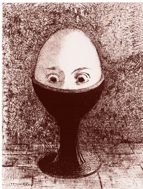
Одильон Редон. Яйцо. 1885

Но вернемся к вопросу о приоритетах в законодательстве. 1 июля 2020 года граждане Российской Федерации проголосовали за поправки к Конституции РФ, в которых, среди прочего, прописано, что браком является союз между мужчиной и женщиной и что международные договоры не должны противоречить Конституции РФ. Дополнения в ст. 79 Конституции Российской Федерации оговаривают недопустимость исполнения в стране решений межгосударственных органов, противоречащих Конституции России, утверждается приоритет национальной Конституции РФ. И нравятся ли эти поправки руководству кафедры педагогики и психологии семейного образования или нет, но они уже внесены в Конституцию РФ. И являются теперь законом, на который придется ори-