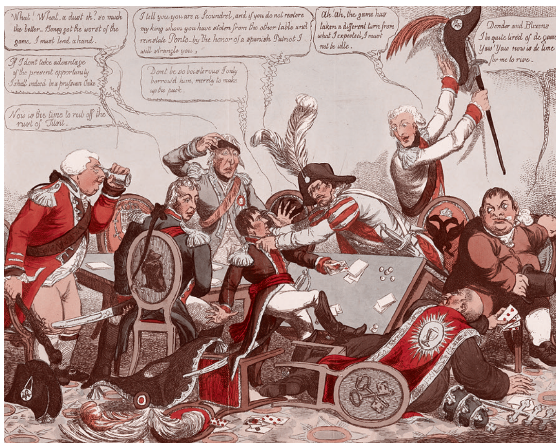
Чарльз Уильямс. Политическая кадрили. Конец игры. 1808