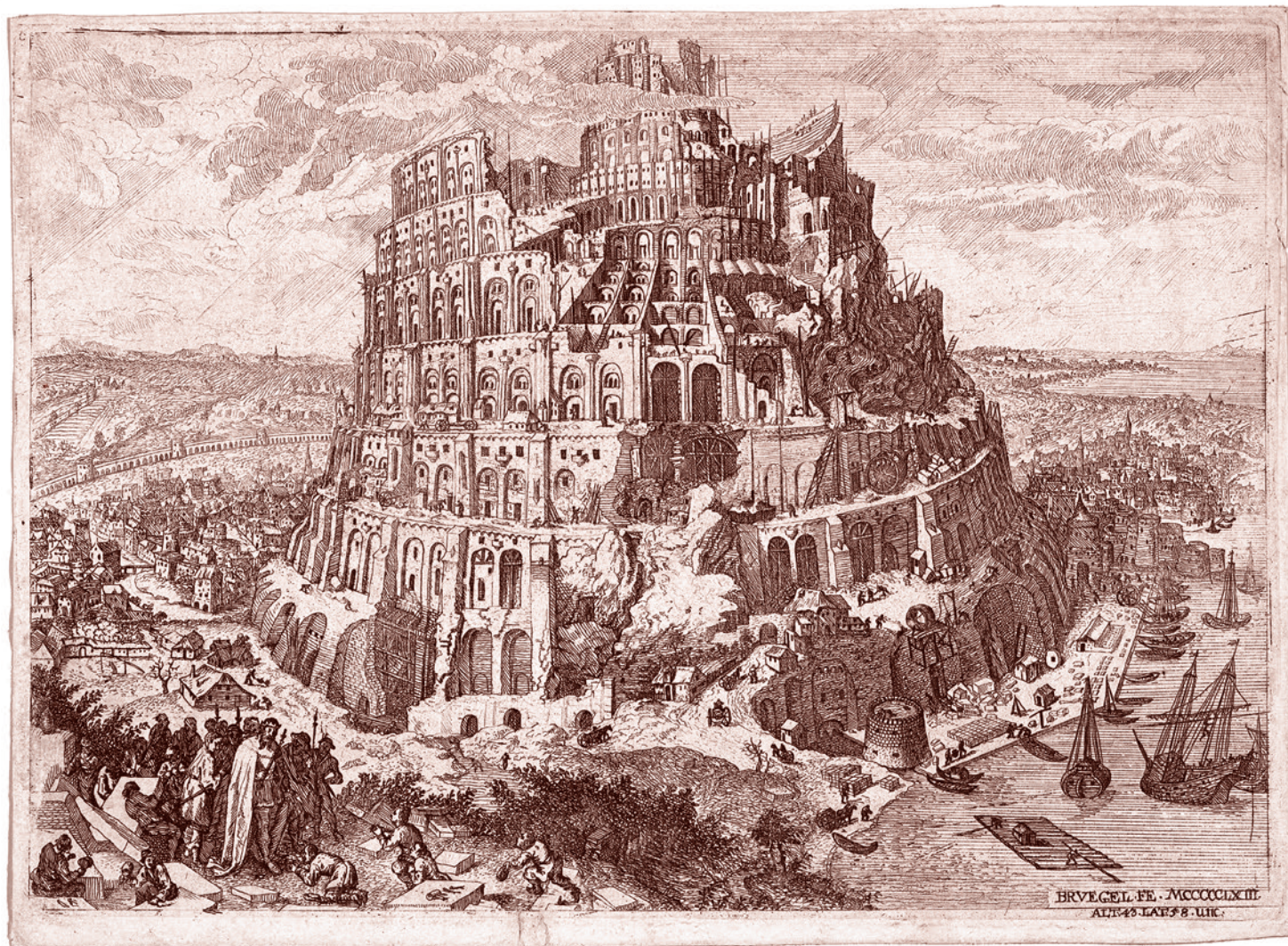
Антон Йозеф фон Преннер. Вавилонская башня

27 ноября Федеральное государственное бюджетное учреждение высшего образования «Московский педагогический государственный университет» провело научно-практический международный круглый стол «Россия и Италия: профилактика семейного и детского неблагополучия в психолого-педагогической деятельности специалистов». Что ж, дело интересное, видимо, полезное, подумала я, имея кое-какой опыт столкновения с подобными проблемами в Испании, и пополнила ряды онлайн-зрителей.