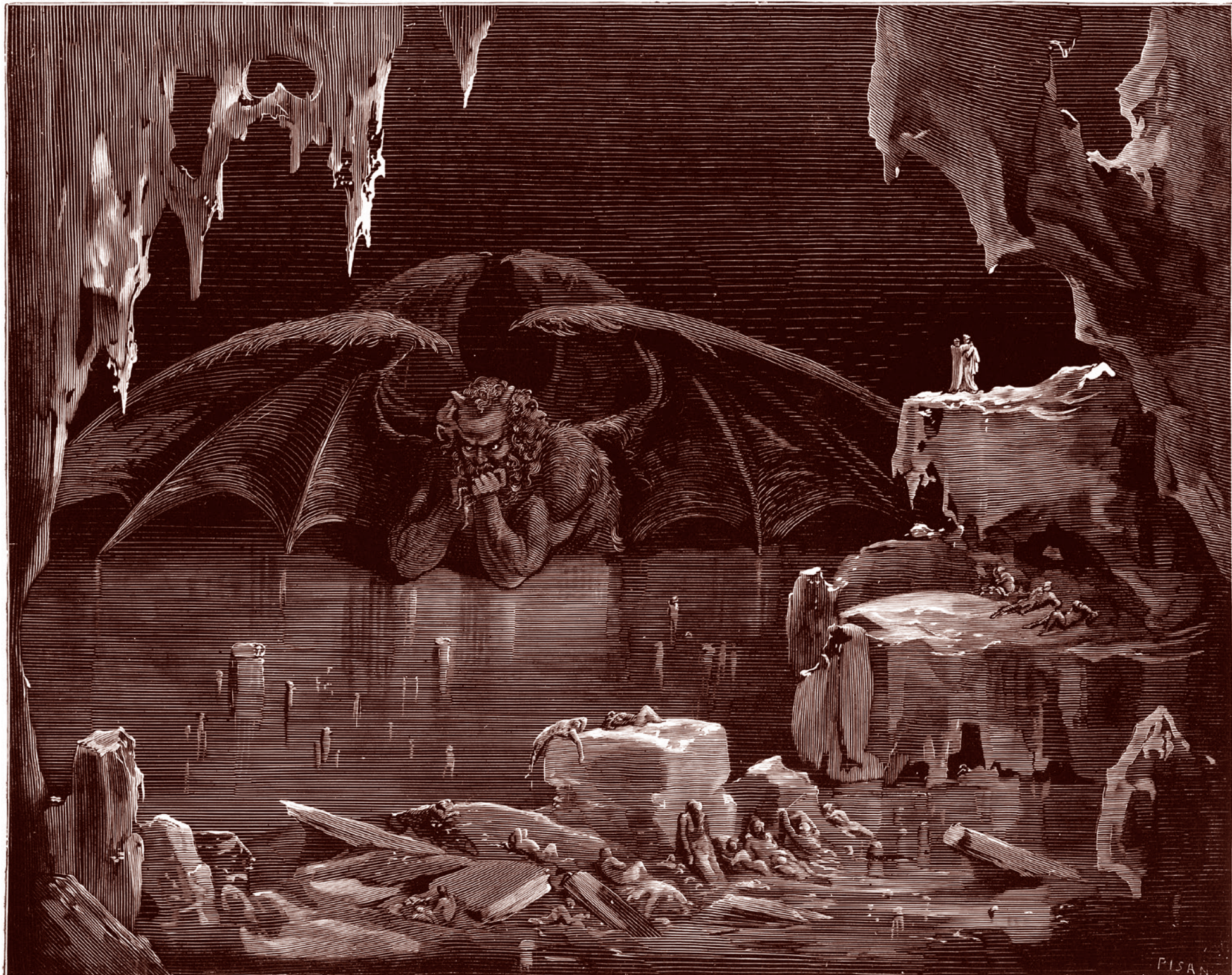
Гюстав Доре. Иллюстрация к песне XXXIV «Ада» Данте Алигьери. Сатана, наполовину вмерзший в лед, в центре девятого круга (круг предателей). 1861–1868 гг.

Я понимаю задачу Владимира Владимировича Путина, который должен выступать как посредник и является главой государства. А я вот являюсь никем, совершенно безответственным человеком. Поэтому я позволю себе сказать, что человек, которого сейчас показали, — абсолютный предатель. И это показала ситуация.