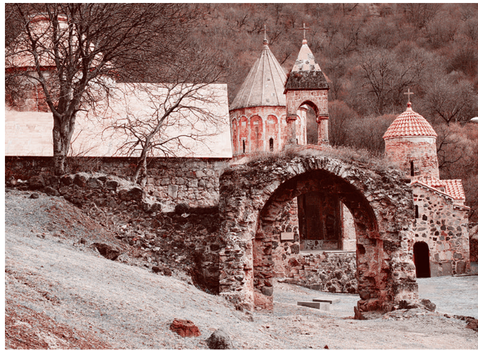
Монастырь Дадиванк, Армения

Газета «Суть времени» зарегистрирована Федеральной службой по надзору в сфере связи, информационных технологий и массовых коммуникаций (Роскомнадзор) Свидетельство ПИ № ФС77-50554 от 9 июля 2012 года