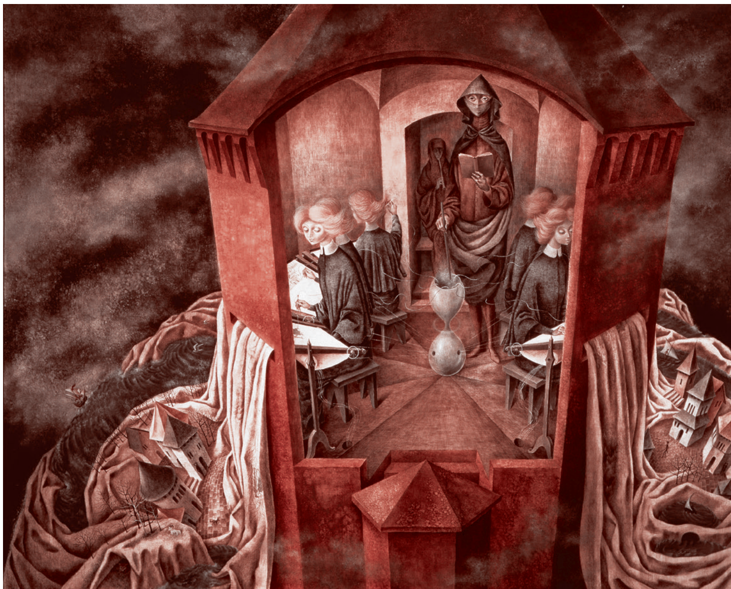
Ремедиос Варо. Вышивание мантии Земли. 1961

«Вам это может показаться таким как бы злоецизм, странным будущим, но надо понимать, что, к сожалению, это реальность. Вот давайте грубо взглянем на мир, как устроен мир? Мир устроен был очень просто: некая элита всегда пыталась весь остальной мир поставить себе на службу. Сначала был рабовладельческий строй, потом был феодальный, потом был капитализм в том или ином виде фактически, но каждый раз это заканчивалось сменой формации. Почему? Потому что люди, которых элита пыталась превратить в обслугу, этого не хотели по двум причинам: они, во-первых, были биологически такими же людьми, как те, кто их хотел превратить