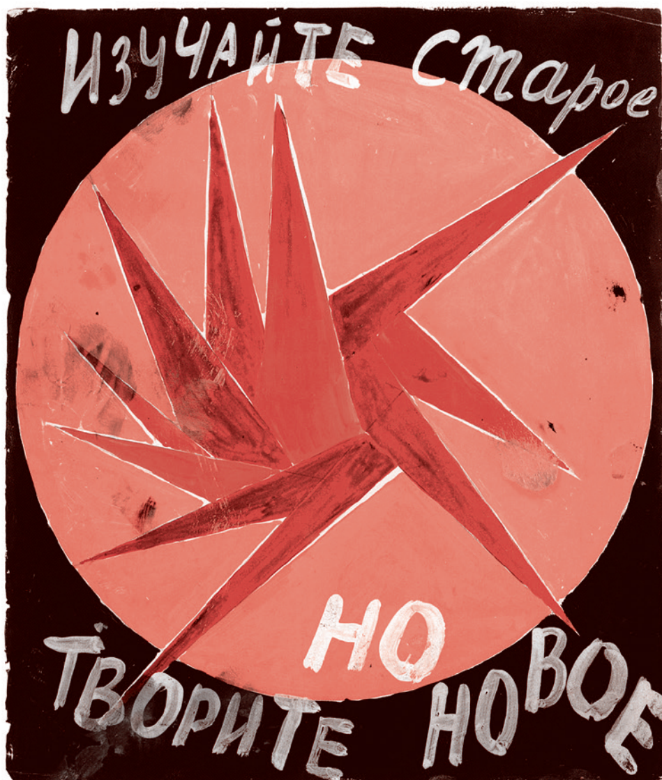
Варвара Степанова. Изучайте старое, но творите новое. 1919

Многие знания (по поводу болезни, дракона etc.) даруют не только скорбь, но и шанс на избавление от гибели. Да, этот шанс мал. Да, для того чтобы его использовать, нужны действия, которые не просто подымут тебя с дивана, а буквально вывернут наизнанку. Потому что эти действия очень сложны, трудозатратны, болезненны. Потому что успех их не гарантирован, а для того чтобы их совершить, нужно распротиться с последней возможностью вкусить домашнего тепла напоследок, насладиться любимой музыкой или чем-нибудь еще... незатейливыми любовными утехами, семейным счастьем, сладким сном, наконец. Этим сном-то ведь труднее всего пожертвовать, сказав: «Ну пожрет дракон... все мы смертны...» Ан нет — иди в гору, пройди по шаткому мосту через пропасть, доберись до Кошечей иглы и так далее. Тебе это говорят, а ты точно знаешь, что и пяти шагов в гору не сделаешь, а уж с шаткого моста наверняка упадешь. То есть всех последних