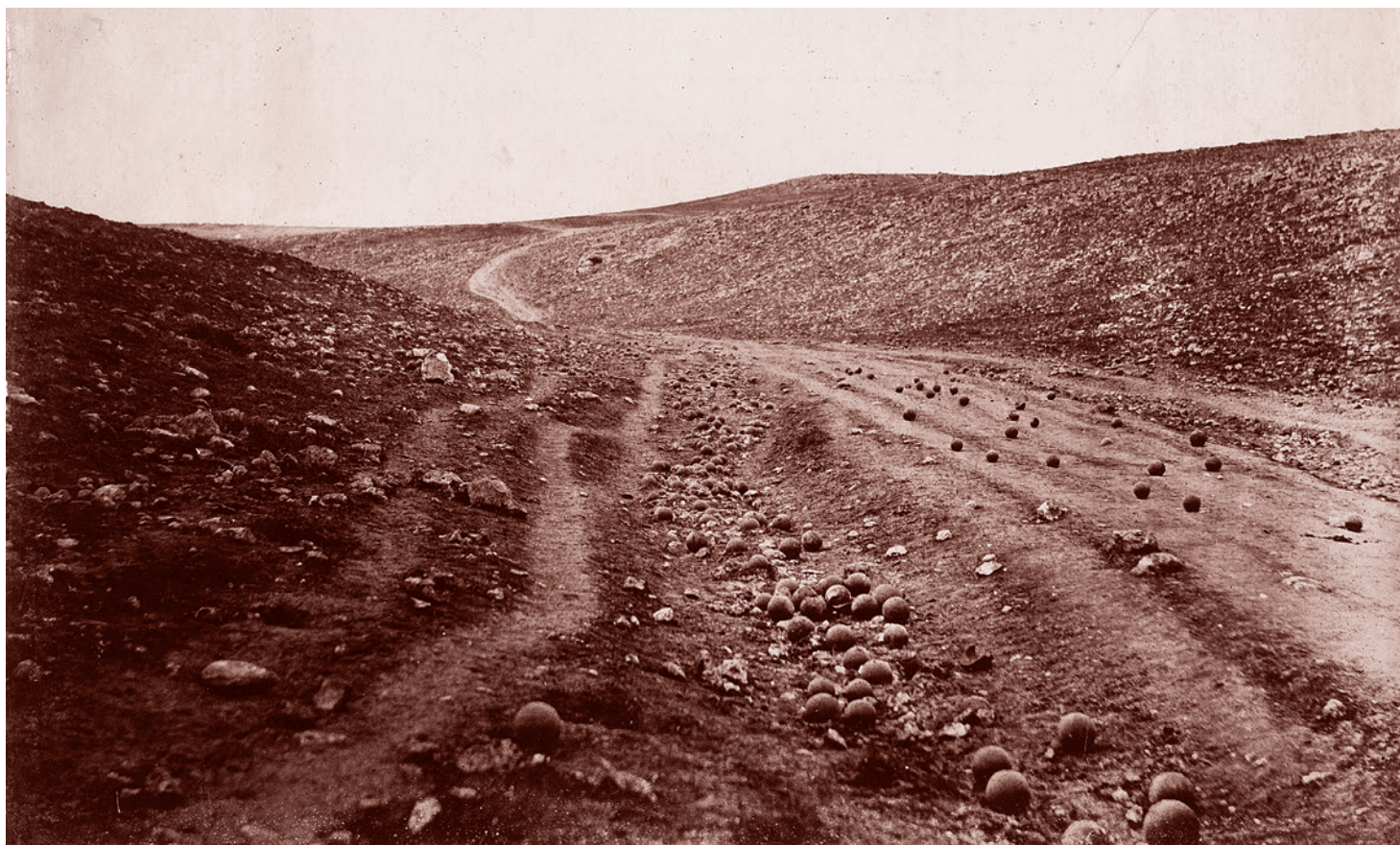
Роджер Фентон. «Долина тени смерти» — фотография Крымской войны. Грунтовая дорога, усыпанная пушечными ядрами. 23 апреля 1855 г.

7 октября, на следующий день после заявления Кулебы, президент Украины Владимир Зеленский посетил Лондон, где подписал ряд важных документов в рамках учреждаемого стратегического партнерства между Украиной и Великобританией. Чета Зеленских была принята принцем Уильямом с супругой и премьер-министром страны Борисом Джонсоном. А дальше произошло нечто странное. Зеленский отдельно встретился с главой