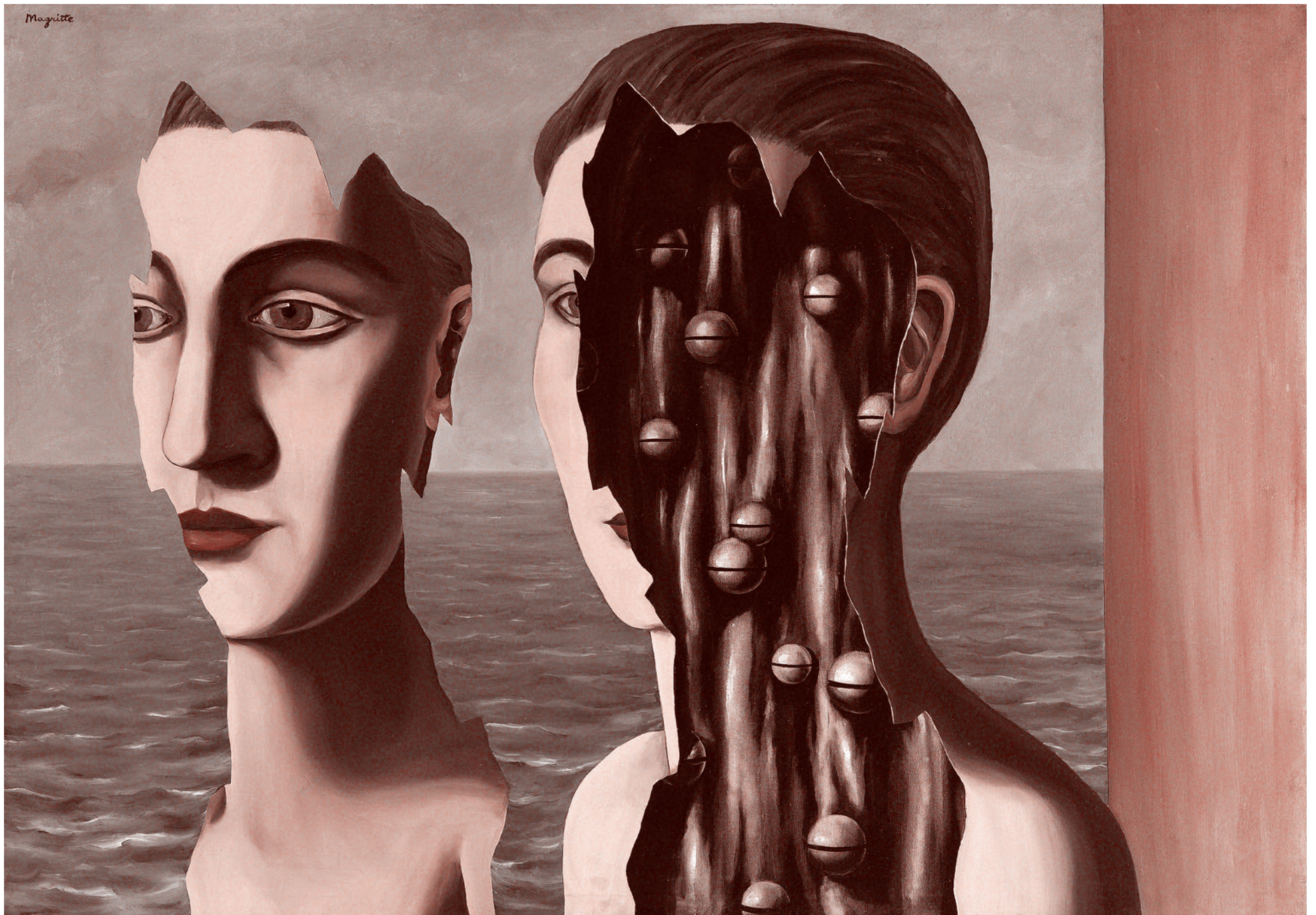
Рене Магритт. Двойной секрет. 1927