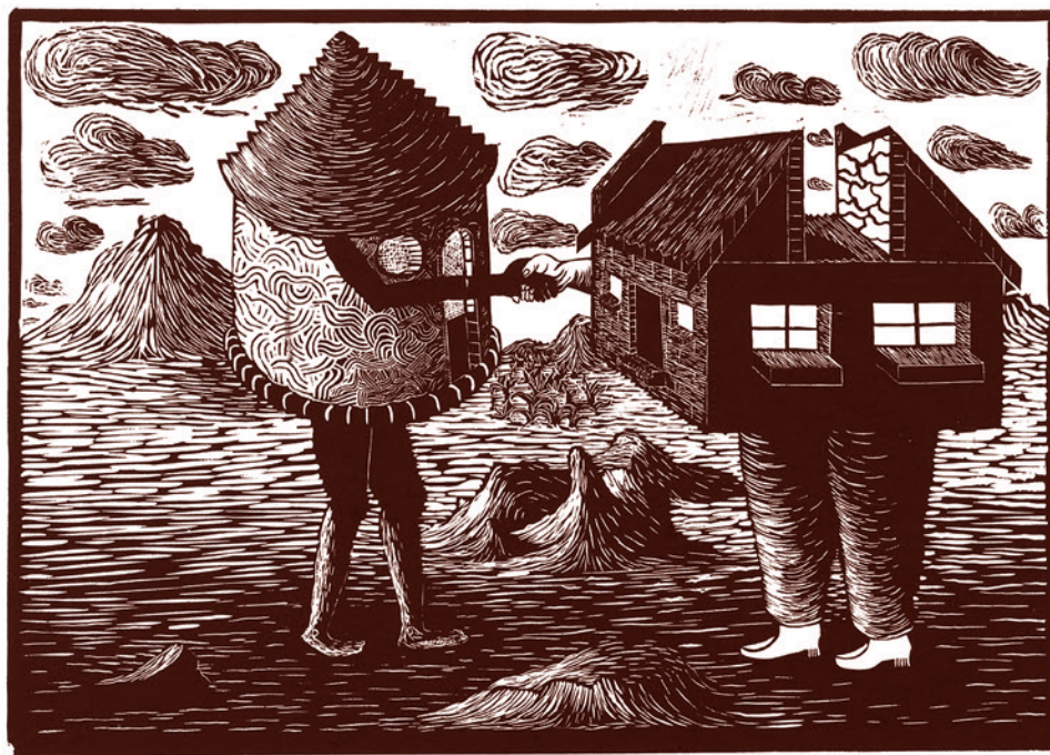
Сандил Годже. Встреча двух культур. 1993

«Что не так у Макрона с исламом и мусульманами? То, что глава государства так относится к миллионам мусульман в своей стране, — это в первую очередь потеря контроля над разумом. Он нуждается в лечении своей психики», — сказал Эрдоган во время выступления в городе Кайсери.