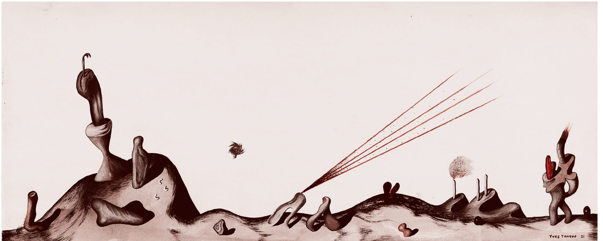
Ив Танги. Без названия. 1931

Если представить мир смыслов и идей как океан, то для принявшего пост-модернистскую веру этот океан высох, а человечество имеет дело с лежащими на солнце камнями и ракушками. В современном мире противостоят друг другу сторонники этого постмодернистского убеждения и те, кто считает, что океан еще не высох и нырять в него все-таки можно.