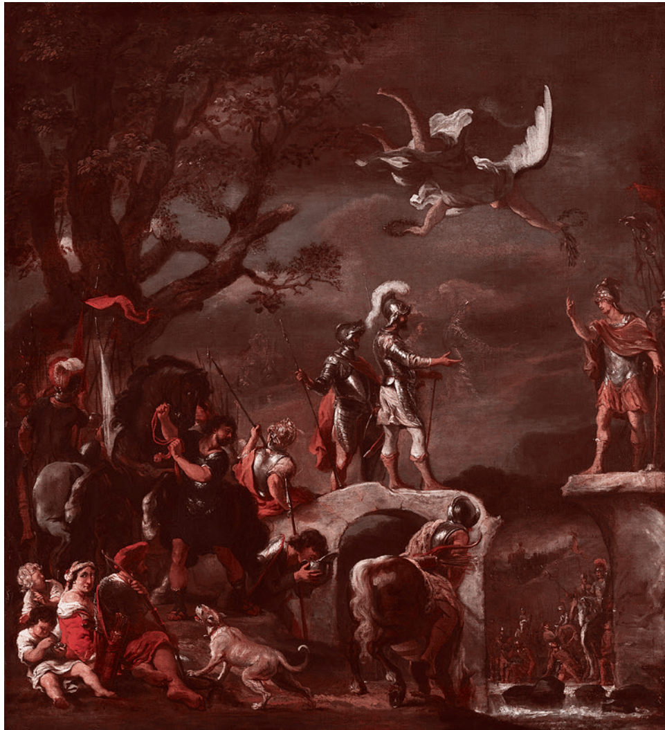
Фердинанд Бол. Переговоры между Клавдием Цивилисом и Квинтом Петилиусом Церелисом на разрушенном мосту. 1658–1662

Все предыдущие заварухи как в Карабахе, так и непосредственно на армяно-азербайджанской границе, разрешались