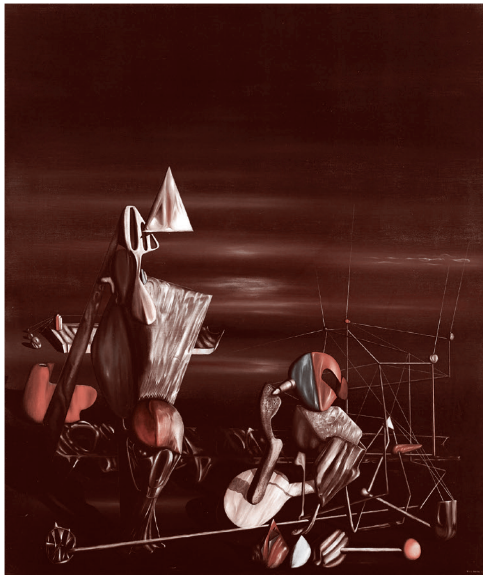
Иб Танги. Медленно на север. 1942

А поскольку пока что достаточно откровенная заявка на нечто подобное, она же CRISPR-Cas9, наталкивается на сопротивление со стороны авторитетных общественных групп и государственных органов, понимающих, что хорошо, когда ты применяешь этот CRISPR, но плохо, когда его применяют против тебя, то силы, ориентированные на создание генно-модифицированного человечества, использующие Гейтса в виде катализатора своих замыслов, делают ставку и на CRISPR-Cas9 (10, 11, 12, 13 и так далее) как на откровенное средство создания этого самого генно-модифицированного человечества, и на нечто, являющееся чуть более завуалированным