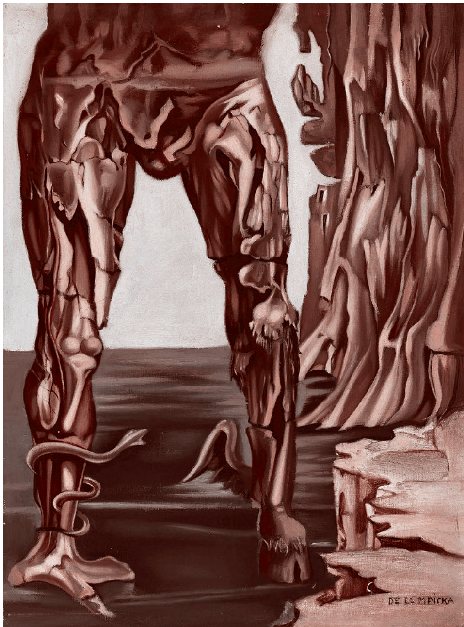
Тамара де Лемпицка. Город камней 1. 1947

Moderna влачила жалкое существование до того, как в нее вдруг не стала вкладывать