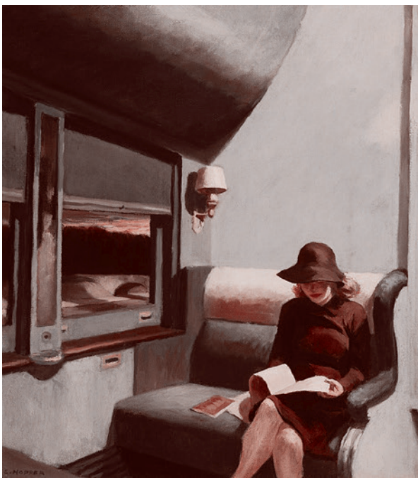
Эдвард Хопер. Купе С, вагон 293. 1938

Если ковид — это трансформирующее событие, то речь идет о событии, которое кто-то создает. Этот кто-то и есть субъект расчеловечивания. А ну как в итоге окажется, что он напрямую связан с теми эзотерическими манипуляциями, которые я обсуждал в цикле «Судьба гуманизма в XXI столетии»? Ведь уже почти очевидно, что это именно так. И скоро это станет совсем очевидно.