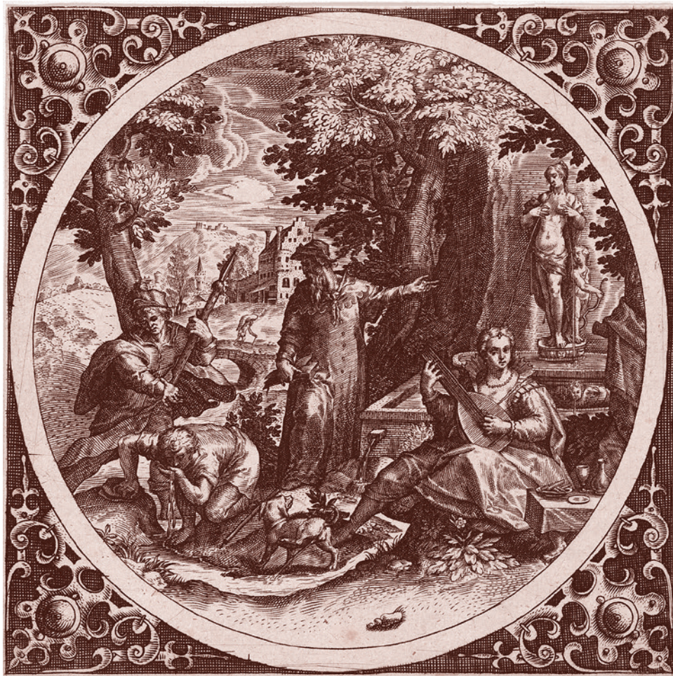
Теодор де Брай. Сцена с предупреждением о венерической болезни. 1580–1600