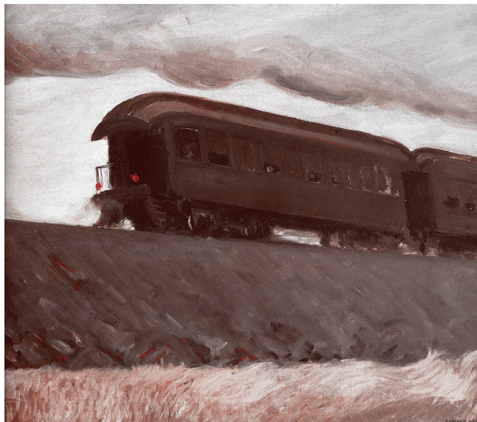
Эдвард Хоттер. Железнодорожный состав. 1908

Мир корчится в коронавирусных судорогах. Эти судороги уже явным образом перестают носить сугубо медицинский характер. Они оказывают существенное влияние на всю многообразную повседневность. Которая и сама-то по себе достаточно отвратительна (что хорошего в так называемом потребительском обществе?), но из которой теперь вдобавок начинают изымать под предлогом коронавируса всё ее остаточное человеческое содержание.