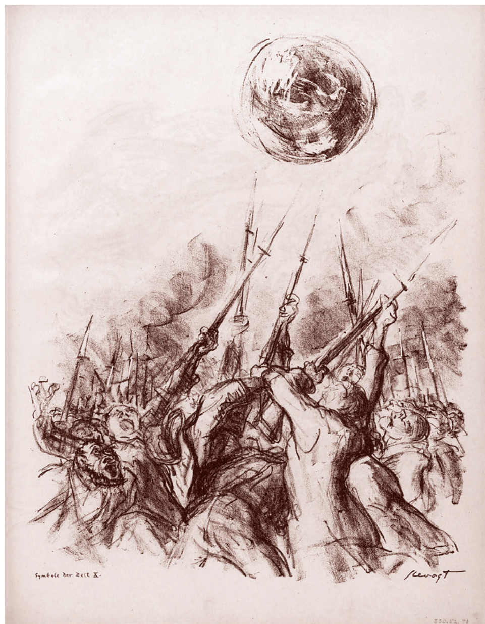
Макс Слефогт. Признаки времени X, из журнала Der Bildermann. Декабрь 1916 г.

«Данный шаг, сделанный в соответствии с духом и буквой договоренности от 17 октября и Московских договорен-