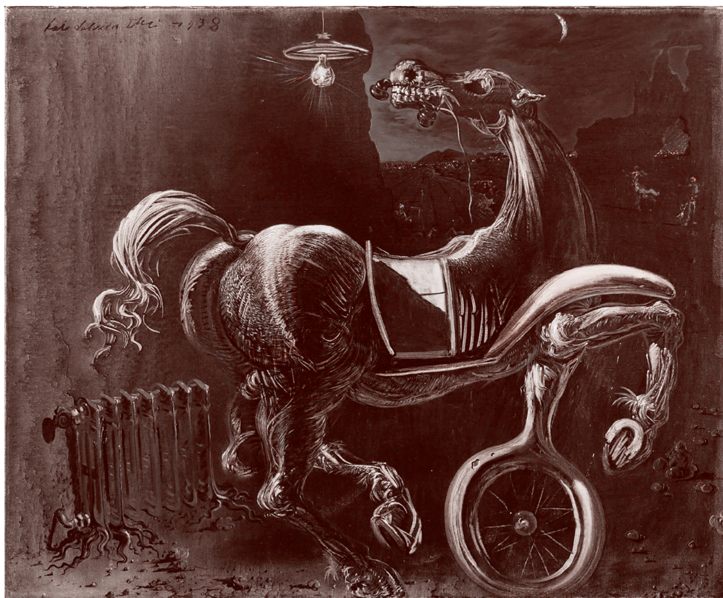
Сальвадор Дали. Обломки автомобиля, порождающего слепую лошадь, кусающую телефон. 1938

Отметим, что Associated Press, несмотря на свою внефракционность, как и многие другие СМИ в США, сейчас работает против Дональда Трампа.