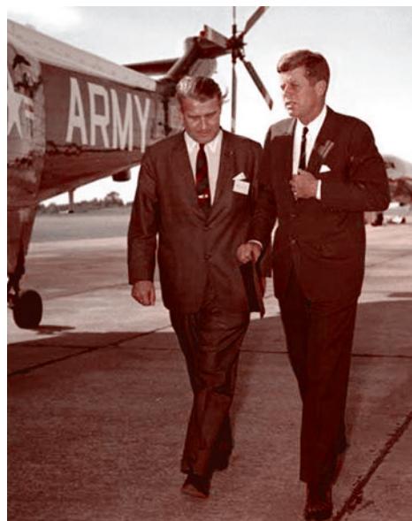
Джон Фицджеральд Кеннеди (справа) и Вернер фон Браун. Алабама, 1963