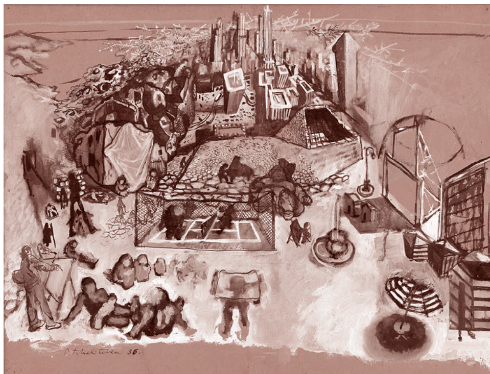
Павел Челищев. Эскиз к «Феномену». 1936

Может быть, я сейчас скажу шаблонно, но есть пирамида Маслоу — иерархия наших жизненных потребностей. В основании — укрытие и вода с едой. А на более высоких уровнях — уже эмоциональные потребности. Люди иногда думают, что самое важное — это чтобы мы все друг