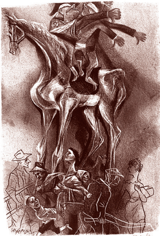
Уильям Гроенер. Диктатура, из Каприччио. 1953–1957

То есть он ставит над Зевсом судьбу. Однако здесь есть нюанс. Хоть Прометей и утверждает, что владыка Олимпа не уйдет от предназначенной ему судьбы, в другой части произведения он изрекает: