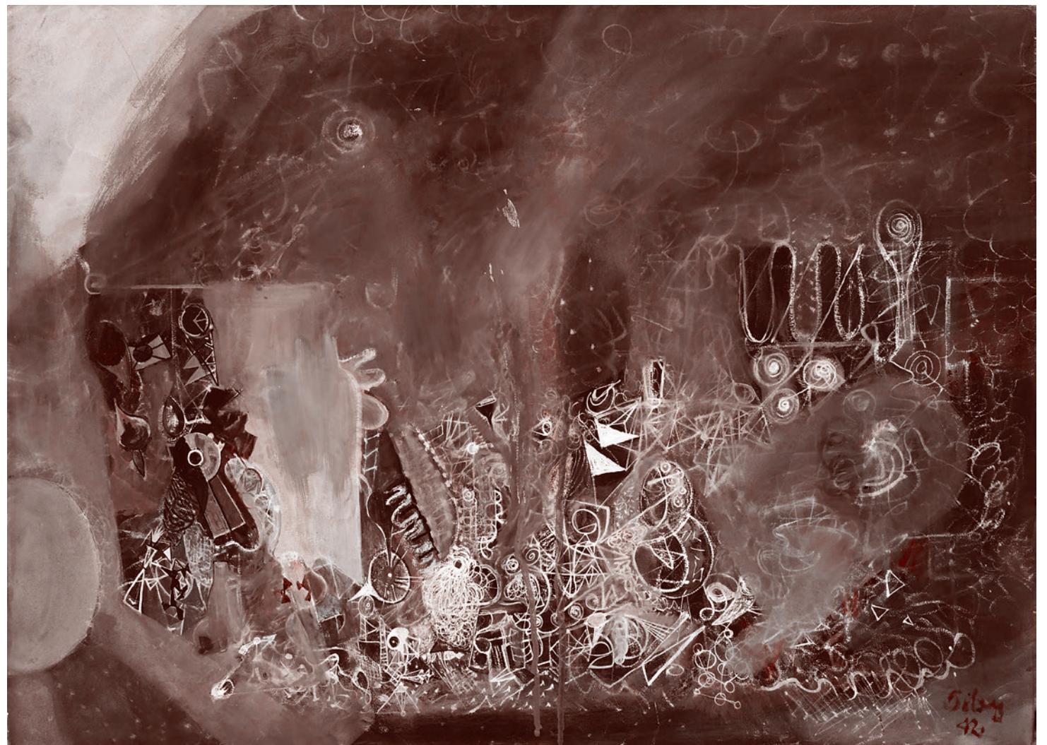
Марк Тоби. Пустота, пожирающая эпоху гаджетов. 1942

Но чаще, как, например, в 32-й и 18-й школах, на дистанционку отправляют в субботу, называя этот день проектным или консультативным. Сразу вспоминается, как ликвидацию школ заменили на оптимизацию, но с тем же самым конечным результатом. При этом всячески подчеркивалось, что школы не закрывают, а лишь оптимизируют.