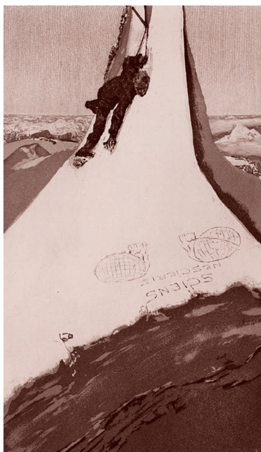
Макс Клиггер. Философ. 1885

Журналист, берущий интервью у Левитта, сообщает также: «Профессор Левитт в настоящее время проанализировал данные из 78 стран, в которых было зарегистрировано более 50 случаев коронавируса. Его исследования доказали, что заражение вирусом никогда не достигнет экспоненциального роста, который одновременно предсказывали исследователи из Имперского колледжа».