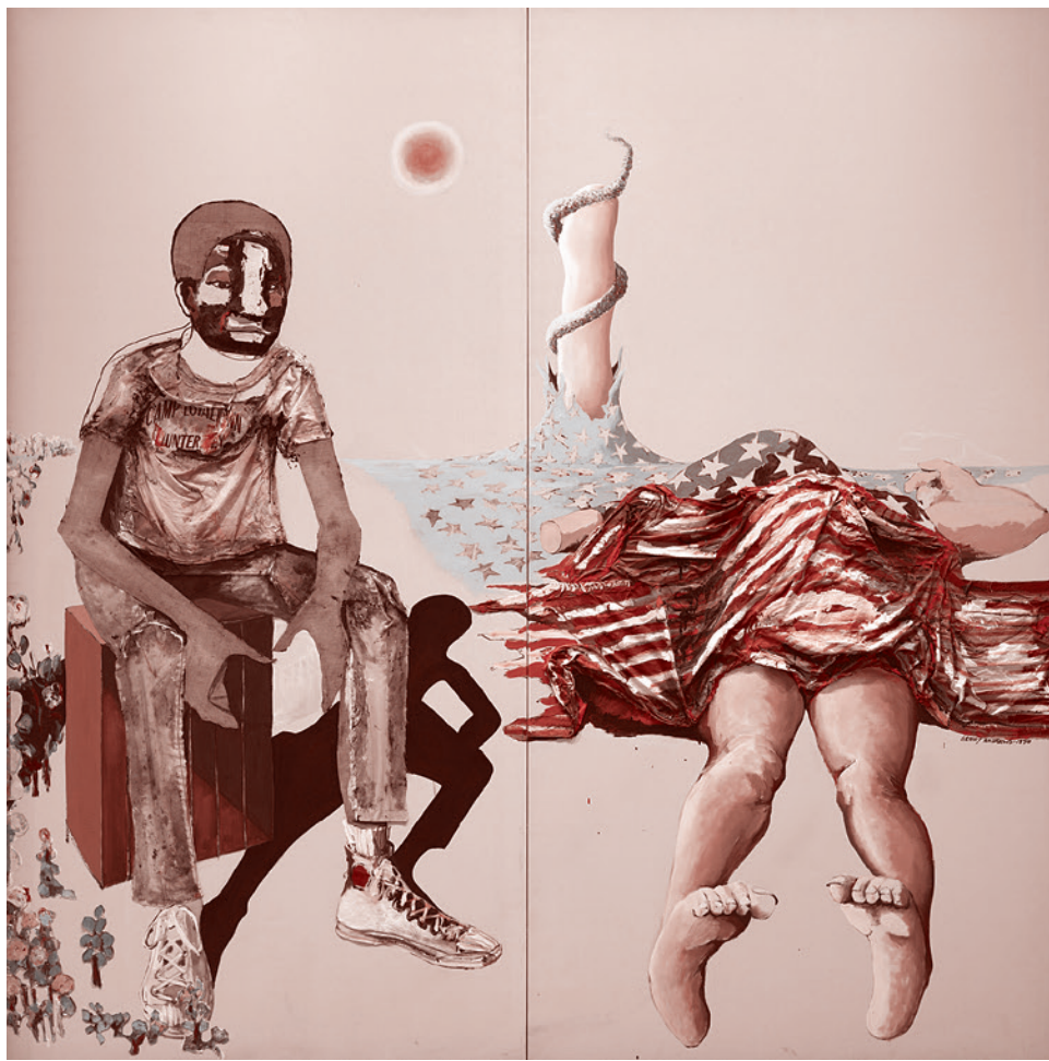
Бенни Эндрюс. Больше никаких игр. 1970

Патрис Каллорс также занимается правами ЛГБТ и была активисткой движения по отмене тюрем. Важной школой общественно-политической работы Каллорс было движение за сохранение общественного транспорта в Лос-Анджелесе, или «Союз пассажиров автобусов» (Bus Riders Union — BRU). Именно занимаясь в BRU, Каллорс познакомилась с человеком, ко-