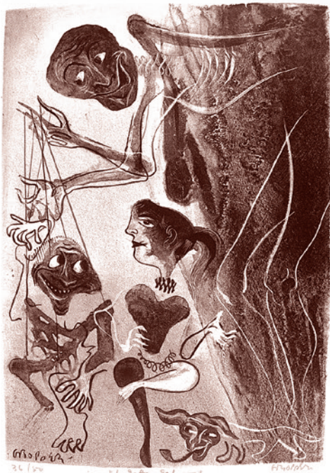
Уильям Гротер. У меня есть девочка, из Каприччио. 1953–1957

По словам главы МИД РФ, Тихановская и другие оппозиционеры должны осознавать, что ими манипулируют, их натравливают на Россию.