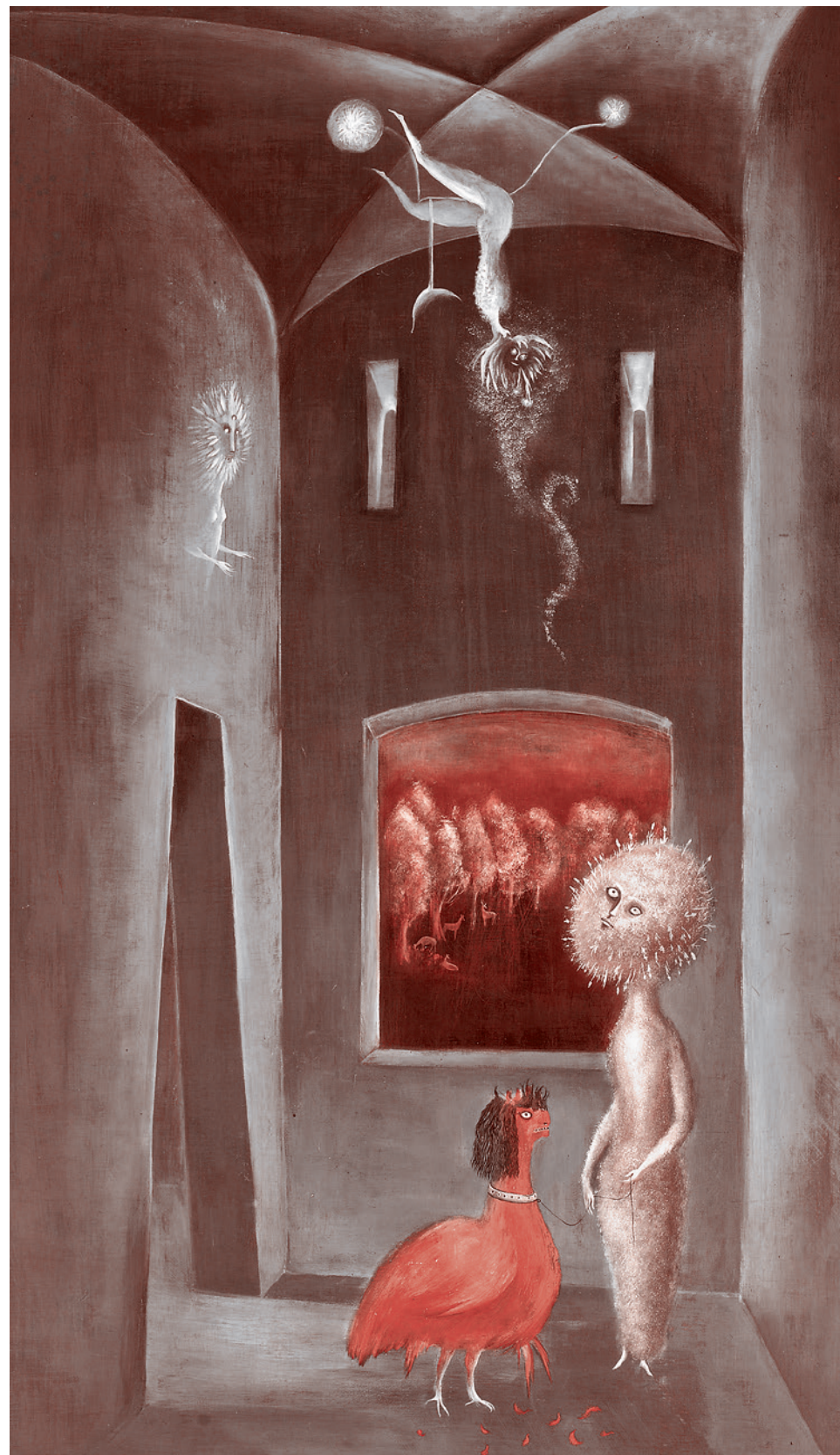
Леонора Каррингтон. Курица сводной сестры. 1952

Во всем невнятном (а история с ковидом, согласитесь, весьма невнятна) при желании можно увидеть и чью-то злую волю, и чей-то корыстный интерес, и чью-то заботу о благе страждущих. И всегда те, кто по роду деятельности ответствен за некие невнятные действия типа ковидных или антиковидных, будут говорить, что они это сделали ради блага страждущих, а их противники будут говорить, что они сделали это по глупости, корысти ради или даже для реализации какого-то злого умысла. Борьба за то, как именно должны быть представлены те или иные невнятные действия, является основным содержанием любой политической борьбы. И ее сейчас ведут все, на всем земном шаре. В Соединенных Штатах в особенности, у нас тоже.