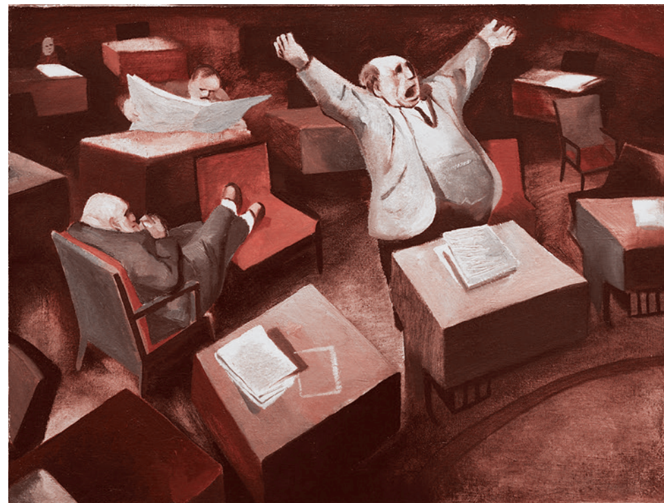
Уильям Гроппер. Сенат. 1935

К сожалению, господин Трамп опять-таки ничего не сказал по поводу того, откуда он знает, сколько было бы потерь без принятия тех мер, которые ему теперь приходится именовать высокоэффективными — у него предвыборная обязаловка.