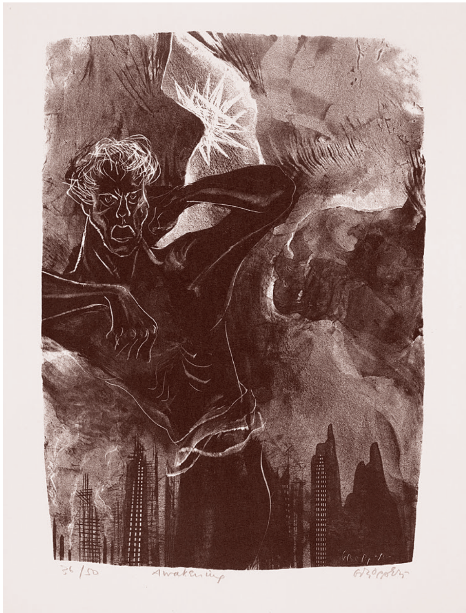
Уильям Гроенер. Пробуждение, из Капфиччио. 1953–1957

Герой пытается перенести эту свечу, но раз за разом она гаснет. Когда свеча гаснет, герой начинает свой путь с начала.