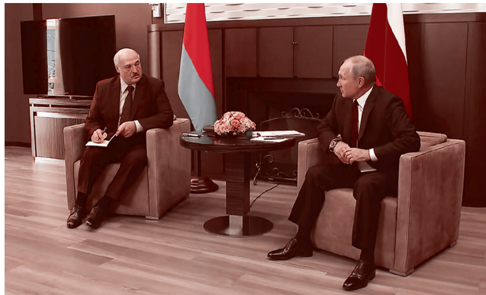
Встреча Владимира Путина с президентом Республики Беларусь Александром Лукашенко