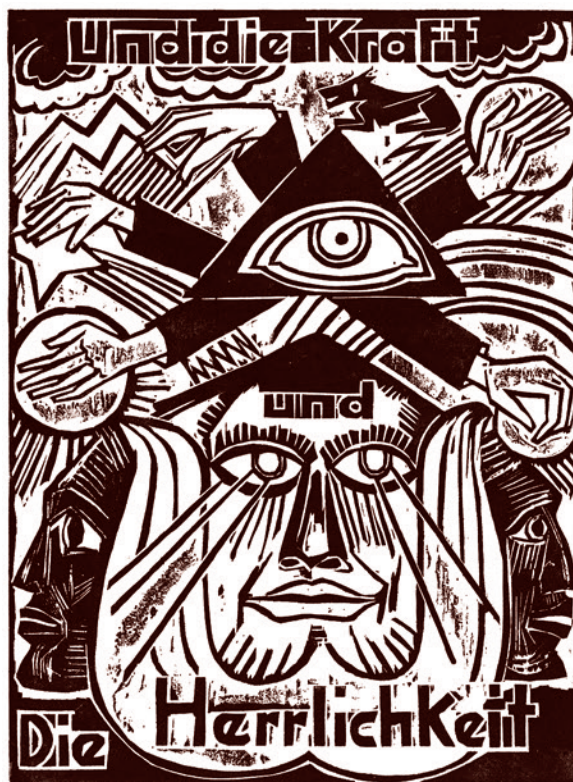
Макс Пехштейн. И сила / u / слава. 1921

А вот что утверждают нынешние неоконсерваторы по поводу американского права на мировое господство. Фукуяма-то отошел от неоконсерваторов. Может, он на них клеветает?