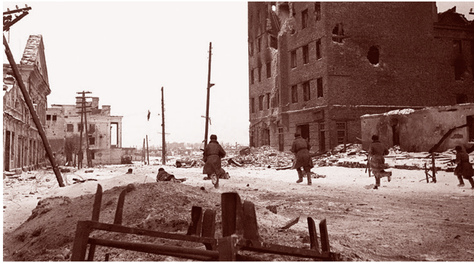
Владимир Гребнев. Красноармейцы бегут по улице Карла Либкнехта (ныне улица Некрасова, слева — дом № 6-1) во время боев за освобождение города Великие Луки. 7 января 1943 г.

Именно «Марс» чаще всего называют вспомогательной операцией, призванной отвлечь силы и внимание противника от действий РККА под Сталинградом, а кон-