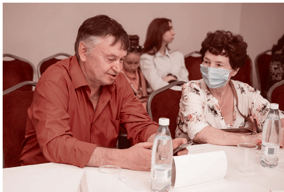
Круглый стол «Цифровая образовательная среда в школе: спасение или угроза?»