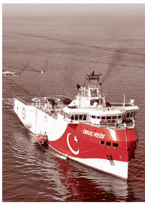
Турецкое сейсморазведочное судно Oruç Reis

16 августа состоялся телефонный разговор между Трампом и Эрдоганом «с целью изучения способов разрядить напряженность в Ливии и привести к политическому урегулированию». А 17 августа в Анкаре посол США в Ливии Ричард Норланд в интервью турецким СМИ заявил, что «военное вмешательство Турции помешало командующему Ливийской