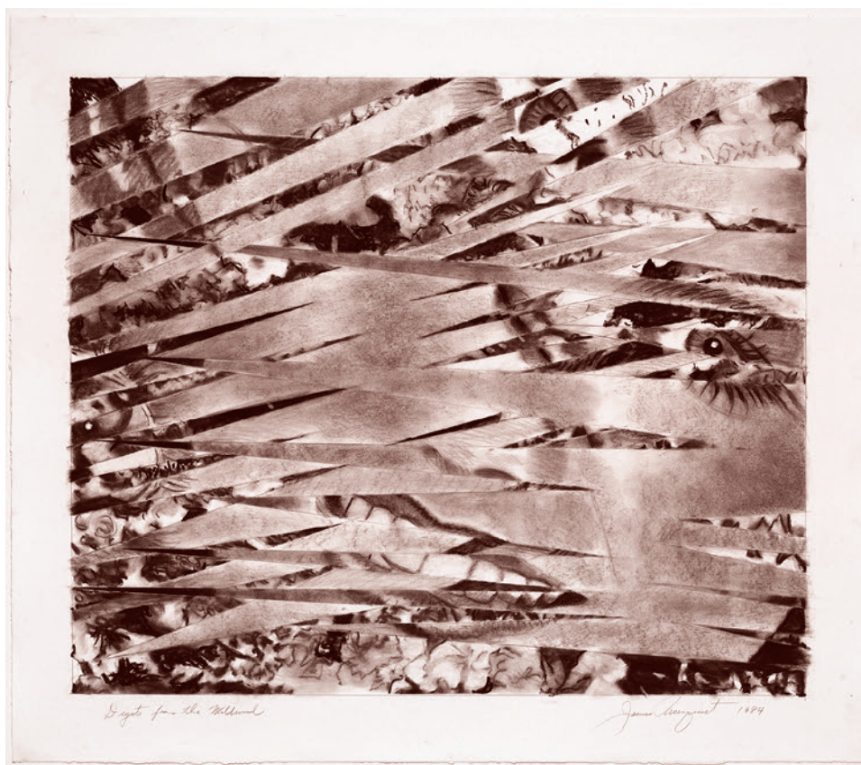
Джеймс Розенквист. Цифры (пальцы?) из дикого леса (Digits from the Wildwood). 1984