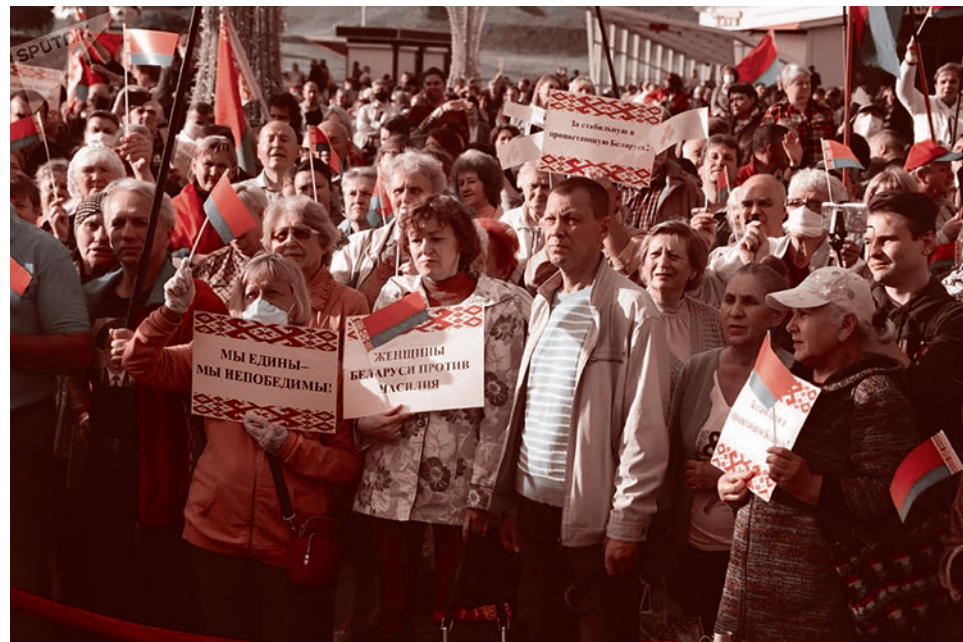
Участницы акции «Женщины за единство и мир». 27 августа 2020 г.

Примерно в 16:20 женская колонна двинулась вдоль проспекта Независимости. Девушки, скандируя «Я гуляю!», направились в сторону Октябрьской площади, но дороге им преградили силовики. После этого протестующие развернулись в сторону площади Якуба Коласа.