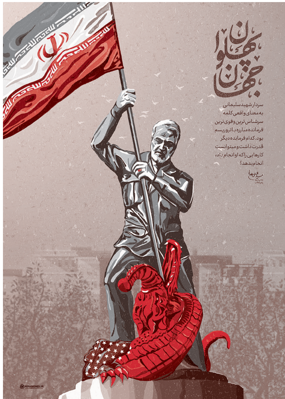
Касем Сулеймани убивает крокодила (США) флагом Ирана

Рамсфелд и Кинг беседуют долго, обсуждая разные темы. В том числе и ту, которая нас интересует.