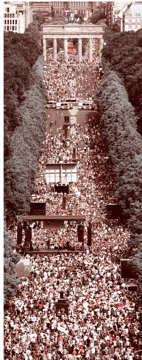
Акция протеста в Берлине против мер по борьбе с коронавирусом 29 августа 2020 г.

По данным полиции, шествие собрало более 17 тыс. человек. Большинство участников шествия нарушают дистанцию в 1,5 м и ходят без защитных масок. В полиции отметили, что в городе проходит пять манифестаций по разным поводам: против расизма, фашизма и теорий заговора.