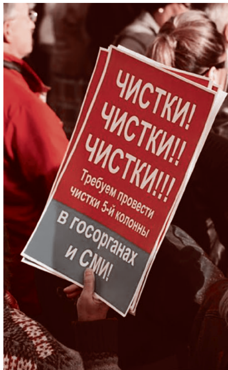
На митинге в поддержку Лукашенко. 27 августа 2020 г.

После этого Колесникова обратилась к собравшимся: «У нас спокойная прогулка по городу, не поддавайтесь на провокации. Отойдите, пожалуйста, на 10 метров от ограждения». После этого собравшиеся медленно отступили.