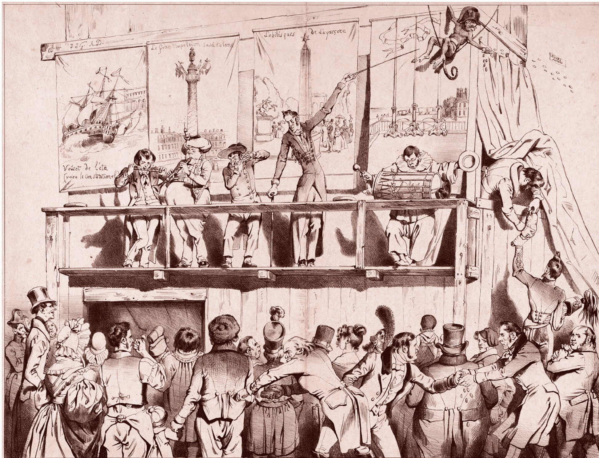
Дж. Дж. Гранвилль. Дзыньк-Дзыньк! Бум-бум-бум!!! Шоу великих политических акробатов. Август 1833 г.

рушений. Среди них организация митинга и создание помех движению транспорта. Общая сумма назначенных ей штрафов составляет 50 тысяч рублей.