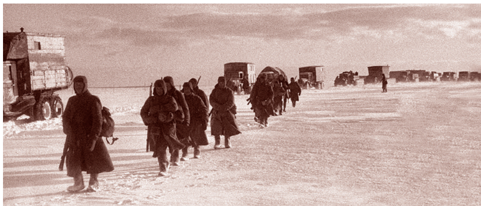
А. Кричевский. Пешие красноармейцы и грузовики на марше под Ржевом

Что ж, оттолкнемся от этого — завершение боевых действий под Ржевом однозначно связано с исчезновением (спрямлением) Ржевского выступа. Следовательно, данное положение позволяет трактовать Ржевскую битву как противостояние именно на Ржевском выступе.