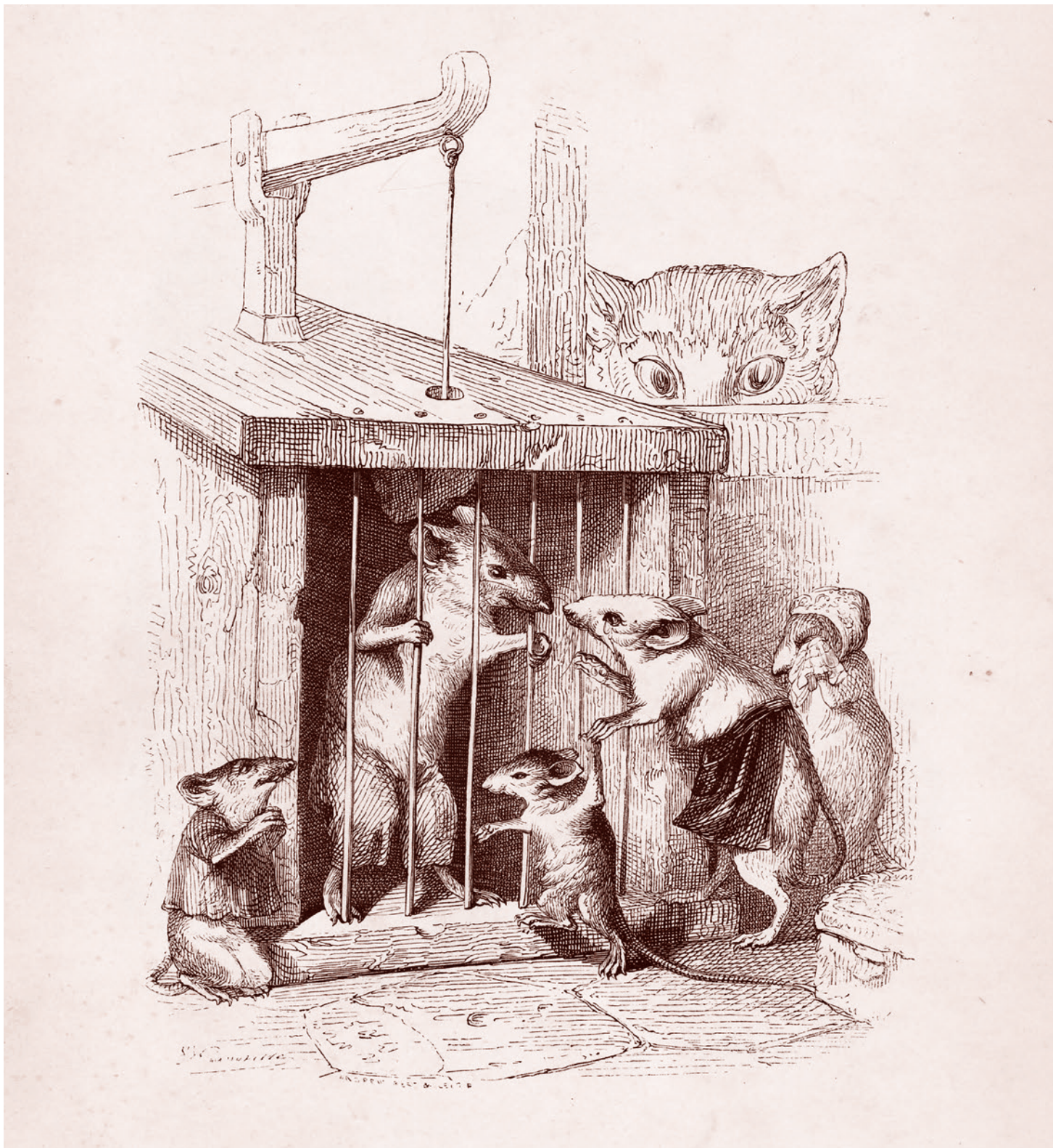
Дж. Дж. Гранвилль. «Он говорит нам: не плачь, действуй!» Из сцен частной и общественной жизни животных. Ок. 1837–1847 гг.