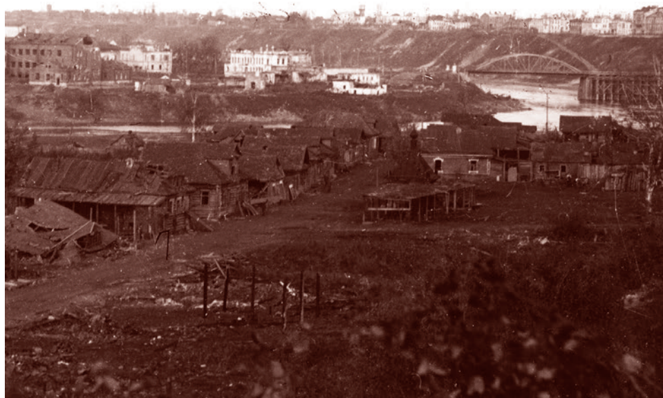
Вид оккупированного Ржева. Август 1942 г.

ской власти странным. Вряд ли можно было найти во всем Союзе человека, не слышавшего или не читавшего стихотворение Александра Твардовского «Я убит подо Ржевом» — одно из самых пронзительных во всей поэзии о Великой Отечественной. Да и повести бывшей переводчицы штаба 30-й армии Елены Ржевской (настоящая фамилия — Каган) печатались. И даже в самом официозе из официозов — 12-томнике «История Второй мировой войны 1939–1945 годов», в 5-м томе, в главе «Наступление советских войск в районе Ржева и Воронежа в 1942 году», вполне подробно рассказывается о Первой Ржевско-Сычевской операции.