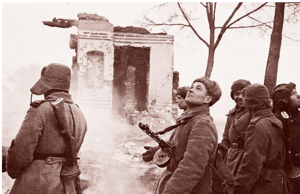
Ольга Игнатович. Автоматчики Калининского фронта в освобожденном от захватчиков Ржеве. Март 1943 г.

Такая трактовка задает вполне отчетливые временные, территориальные и смысловые рамки, притом не противоречит истории. При всех отличиях планов операций и обстановки у боевых действий под Ржевом явно прослеживается единый вектор: мы видим с советской стороны последовательные попытки ликвидации Ржевского выступа, а с германской стороны отчаянные усилия по его удержанию.