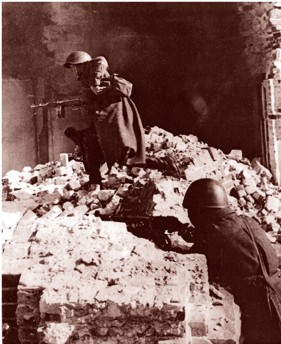
Красноармейцы в уличном бою во Ржеве. Март 1943 г.