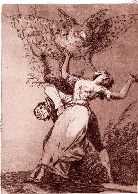
Франсиско Гойя. Офорт № 75 из «Капричос»: Нет никого, кто нас развяжет (No hay quien nos desate). 1799

К середине XX столетия эта форма жизни начала настолько активно воздействовать на всю окружающую экосистему, что неоднократно становилась потенциальной прямой угрозой существованию всякой