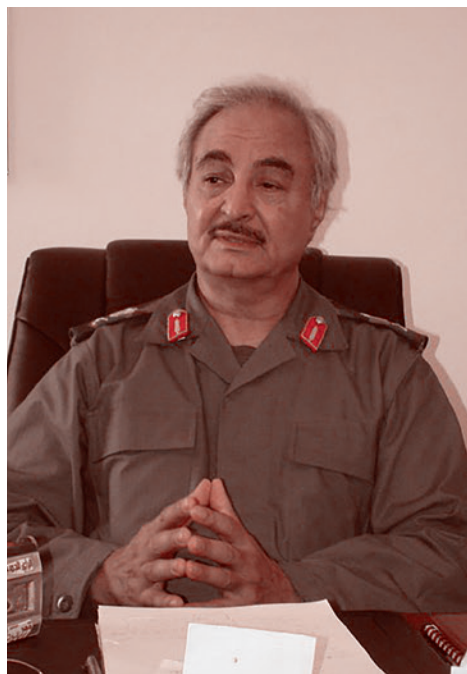
Халифа Хафтар. 2011

А 1 июня аль-Халик сообщил, что ливийские племена полностью передали контроль над нефтяными месторождениями и портами парламенту на востоке страны и Ливийской национальной армии (ЛНА) во главе с маршалом Халифой Хафтаром. Аль-Халик напомнил, что племена блокировали эти объекты во избежание использования нефтяных доходов «для финансирования терроризма и вооруженных группировок, когда ливийские средства растрачиваются на поставки оружия и переброску наемников, убивающих ливийцев... необходимо открытие банковского счета для поступлений от нефтя-