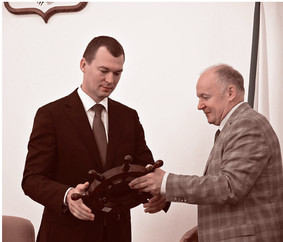
Григорий Куранов, заместитель полпреда Президента Российской Федерации в ДФО, вручает штурвал Михаилу Дегтяреву. 21 июля 2020 г.

«Вводим, коллеги, персональную ответственность. Объект не сдан, хоть один рубль ушел в федеральный бюджет — растаемся. Так будем рабо-