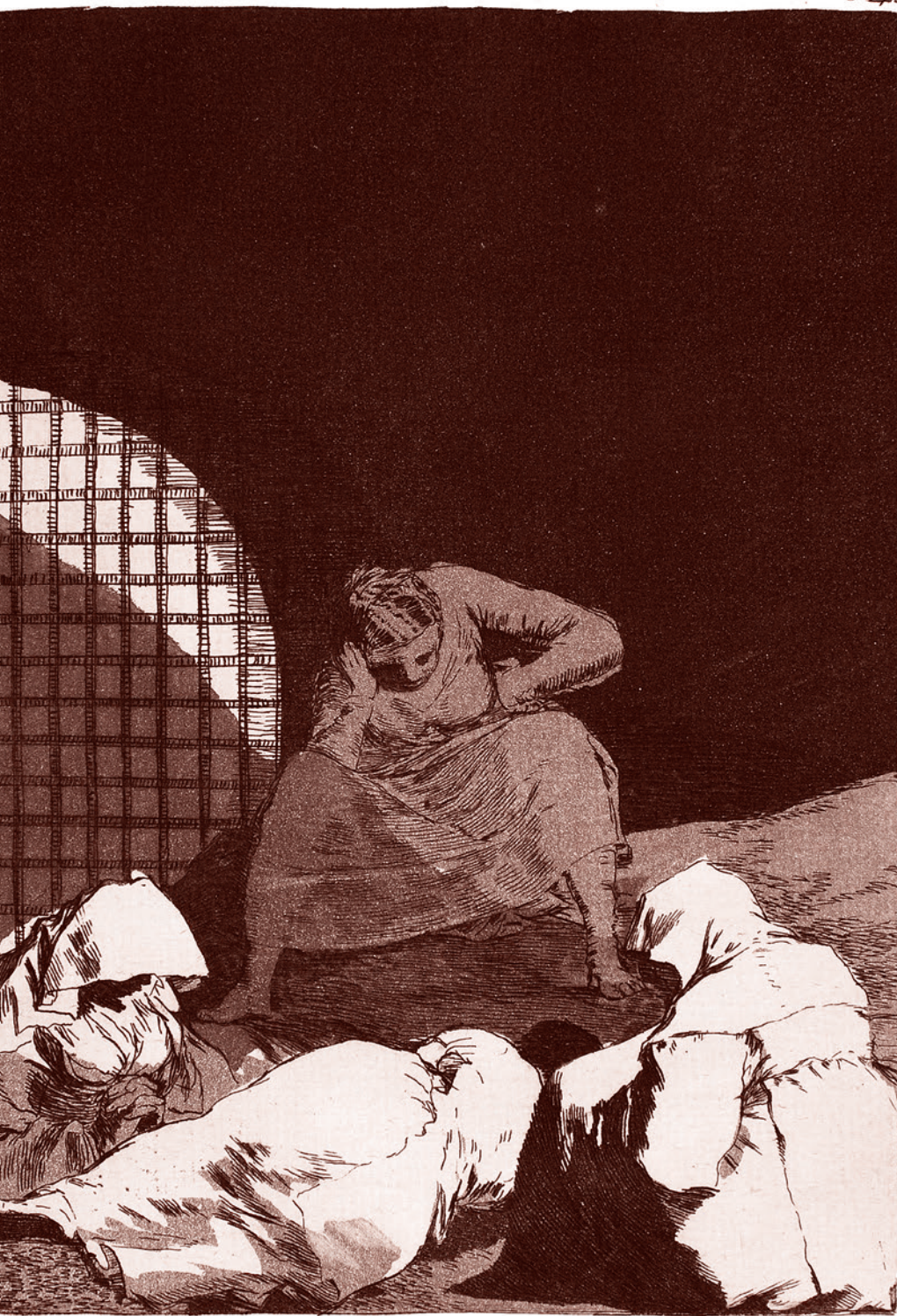
Франсиско Гойя. Офорт № 34 из «Капричос»: Сон одолевает их. 1799

Но поющие эту песню вслед за Гребенщиковым люди (впрочем, как и сам певец) — сами являются предателями. Они предали своих великих предков, которые погибли в Великой Отечественной войне, спасая свою Родину и мир от фашизма. Поющие эту песню отказались от их завое-