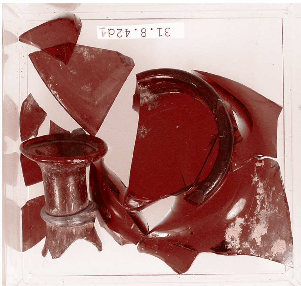
Стеклянные фрагменты из Ливийской пустыни. IV век.

Ему удалось организовать в Чаде другой военный переворот, свергший став-