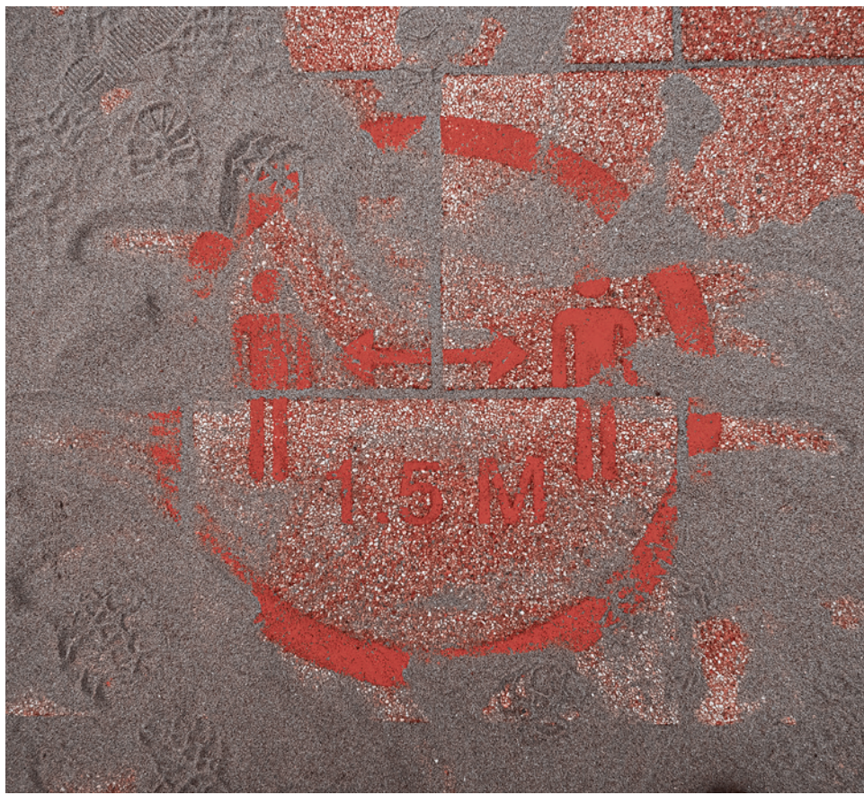
Держи дистанцию. Июнь 2020 г.

Согласно сценарию, диагноз, поставленный местными врачами, подтверждают специалисты расположенного в Атланте Центра контроля и предотвращения эпидемий. Выясняется, что чикагцы подверглись