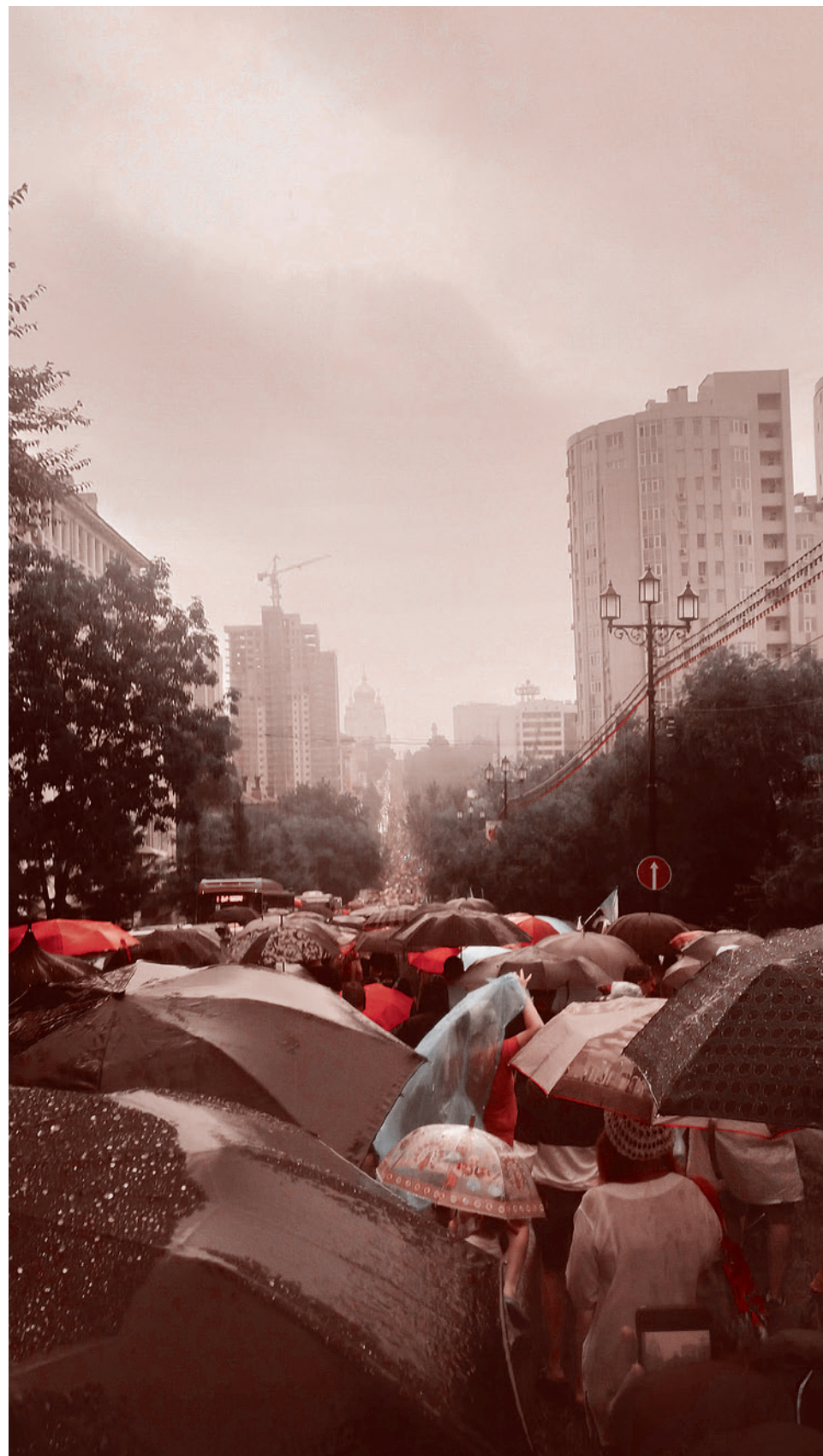
Протесты в Хабаровске. 1 августа 2020 г.

«Есть два варианта, как мы можем тут действовать в рамках закона. Первый — попросить депутатов краевой думы внести изменения в устав региона об упразднении должности губернатора. Тогда Дегтярев останется без работы. И второй вариант — я не склонен