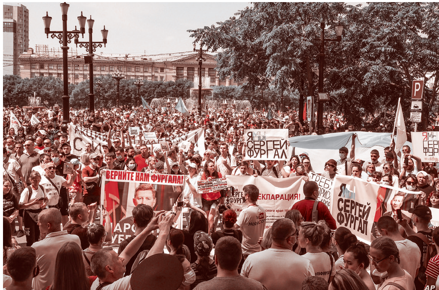
Хабаровск. 18 июля 2020 г.

На фоне общей успокоительной риторики как со стороны самого Фургала, так и со стороны тех, кто его навещает, заметно несколько странностей. Во-первых, это дополнительные эпизоды в деле об убийствах, которые инкриминируются бывшему губернатору. Не является ли это своеобразной реакцией на протестные действия в регионе? Во-вторых, со стороны Следственного комитета мы слышим все те же заявления о «неопровержимых доказательствах» в деле Фургала и вновь без каких-либо подробностей, что, мягко говоря, не придает власти дополнительной убедительности. Учитывая резонанс этого дела, отсутствие должного освещения всей ситуации со стороны властей заведомо ставит их в менее выгодное положение по сравнению с профургальскими рупорами, чье мнение звучит из каждого оппозиционного «утюга». Не менее странно выглядит сбор средств на адвоката родственниками Фургала, учитывая экономические возможности его супруги, на 25% владеющей заводом «Амурсталь».