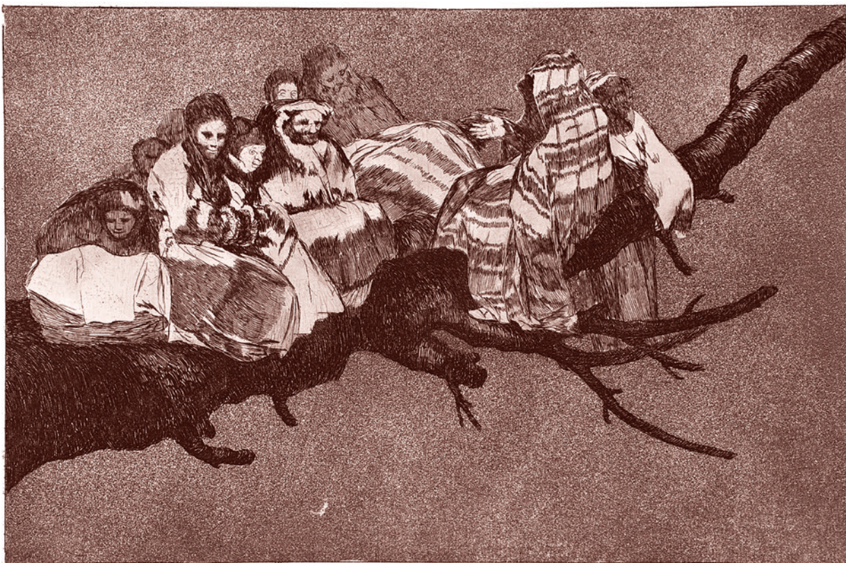
Франсиско Гойя. Офорт № 3 из «Диспаратес»: Неленая глупость. Ок. 1816–1823 (опубликовано в 1864)