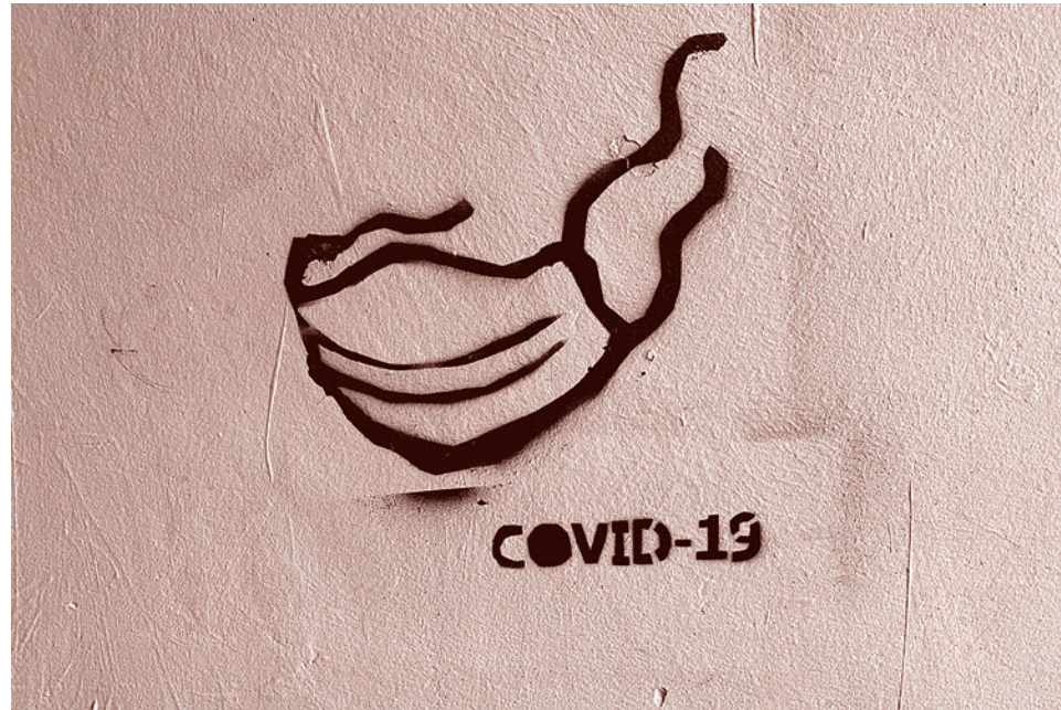
Ковидное граффити в Варшаве, Польша. Март 2020 г.

В результате успешного (как утверждается) сдерживания коронавирусной инфекции можно маневрировать медицинскими организациями, перепрофилированным коечным фондом, оборудованием, частично восстанавливать оказание медицинской помощи онкологическим больным, тоже неотложной.