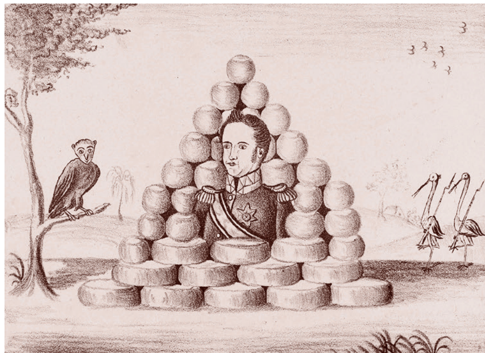
Король в сыре. 1830