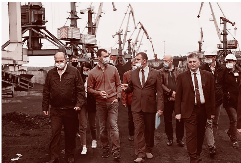
Михаил Дегтярев в Ванинском порту. 26 июля 2020 г.

районы края также заканчиваются не конкретными предложениями по их решению, а откровениями о новых впечатлениях врио.