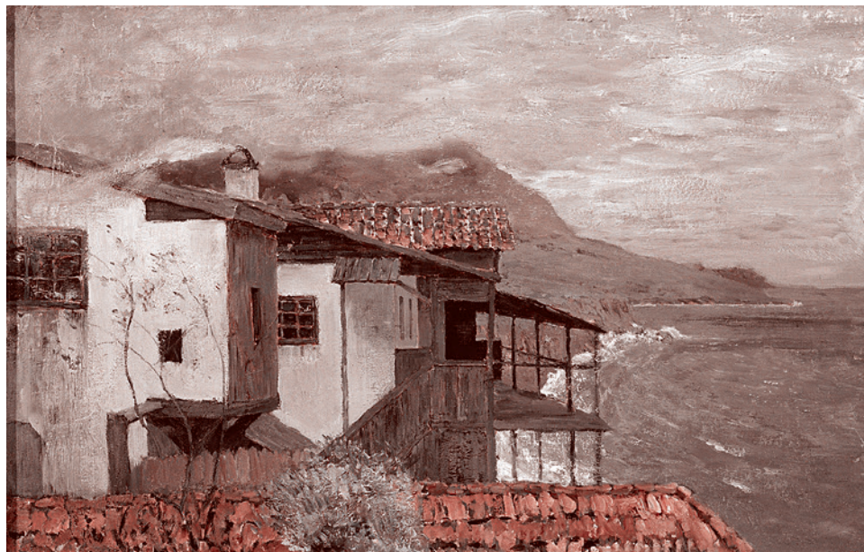
Исаак Ильич Левитан. У берега моря. Крым. 1886

Депутатов от партии Порошенко беспокоит решение о переносе сроков проведения в Киеве заседания Парламентской ассамблеи (ПА) НАТО из-за пандемии, а также то, что «президент подписывает Годовую национальную программу сотрудничества под эгидой комиссии Украина — НАТО на 2020 год [лишь] в конце мая».