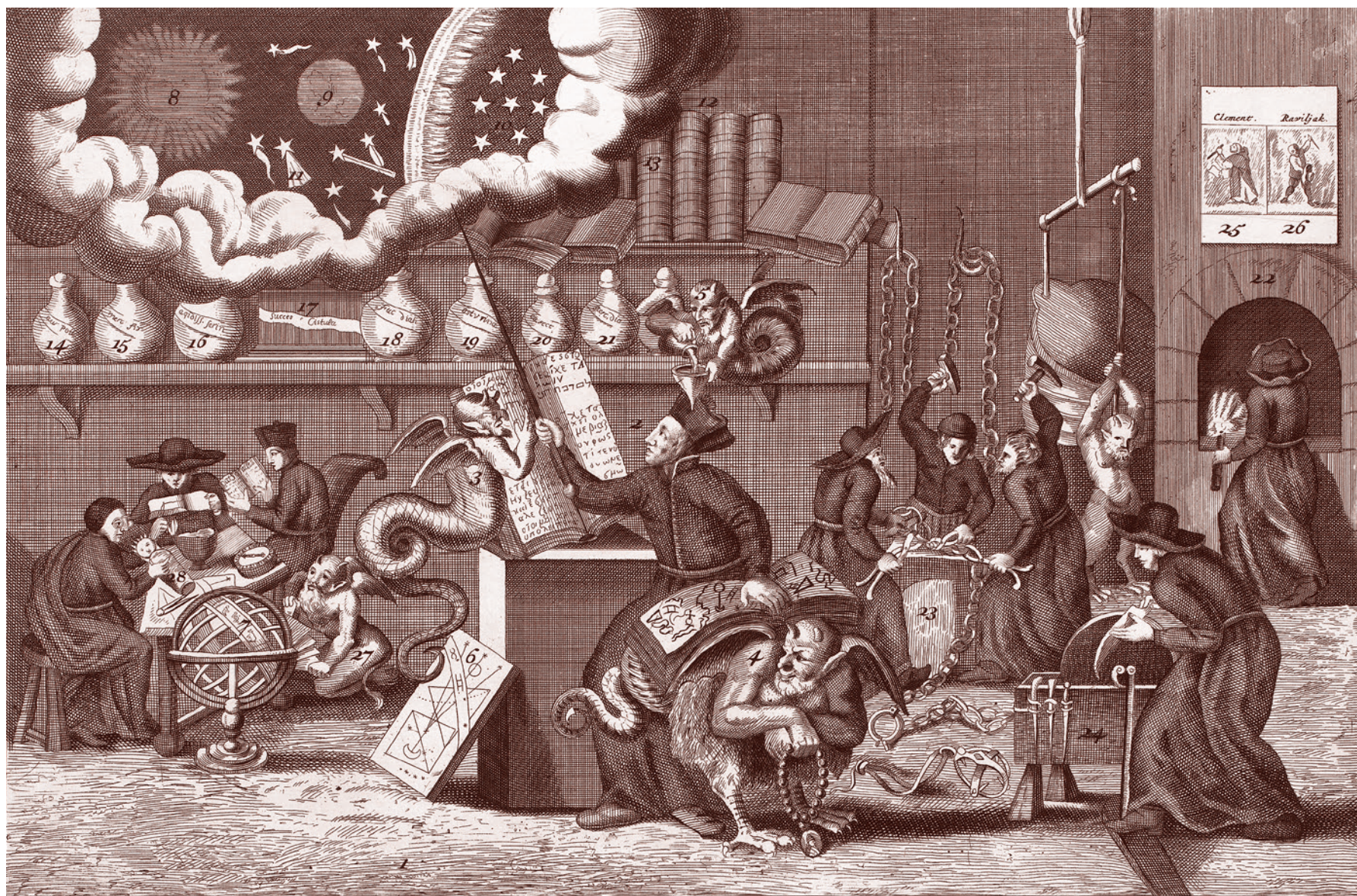
Пол ван Сомер II (притискивается). Карикатура о дьявольском искусстве отца Петерса (Эдварда Петре), который вместе с католиками и бесами занят работой в алхимической лаборатории. 1689

вотчат и превращаются в кровавые, бесформенные массы. Некоторые из этих лихорадок убивают до 90 процентов тех, кто ими заразился, и они могут передаваться при тесном контакте с биологическими жидкостями, возможно, даже при чихании.