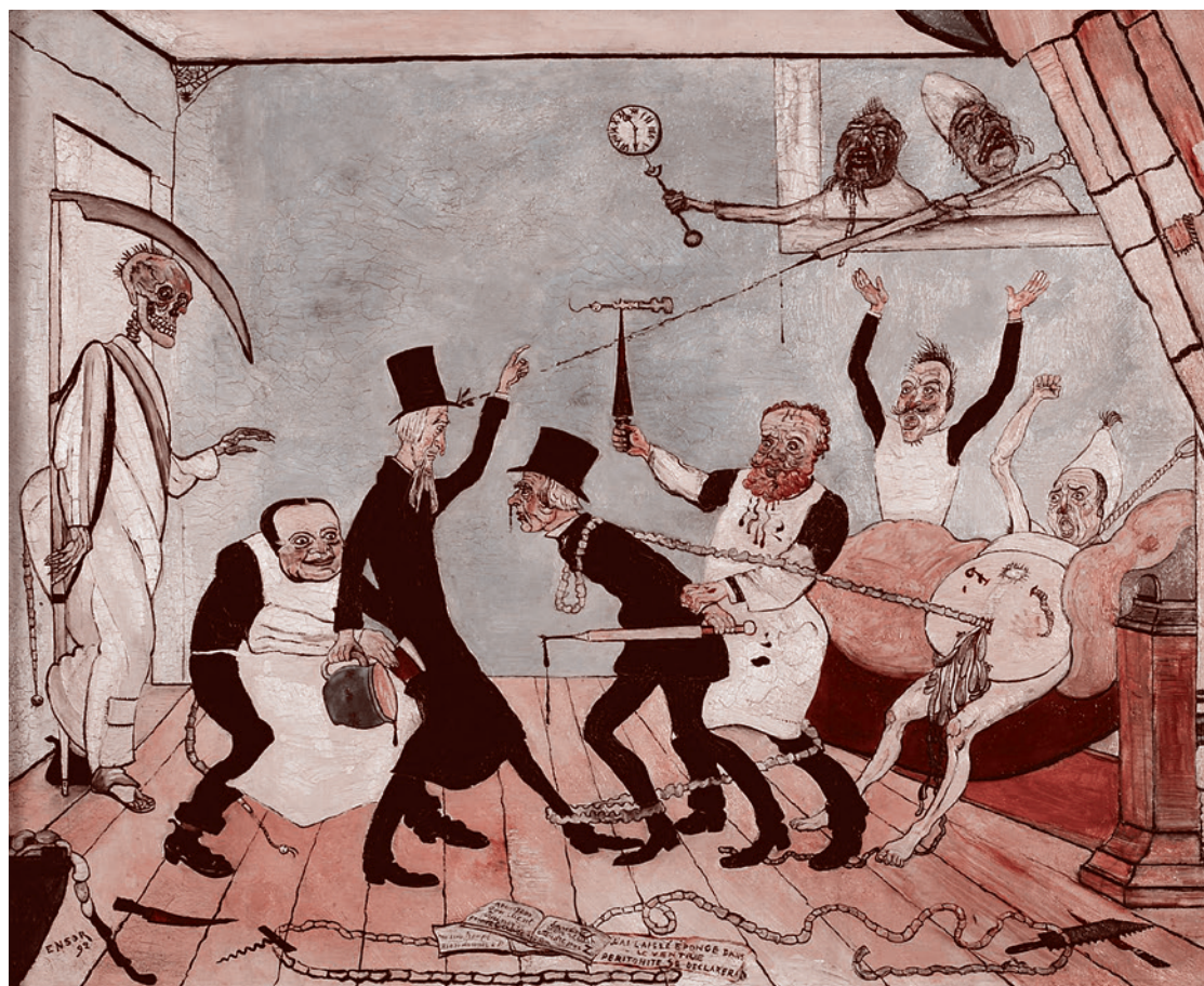
Джеймс Энсор. Плохие врачи. 1892

Тем не менее врач-ученый, который проводил экскурсию, был начисто лишен подобного рода апломба, по крайней мере, внешне. Экскурсовод встретил нас очень доброжелательно, провел в свой кабинет, выдал чистую красивую форму из стопроцентного хлопка и стал показывать новый медицинский центр. По всему было видно, что и само учреждение ему очень нравится, и работать в этом центре также очень нравится. Он как бы говорил нам: «Моя мечта осуществилась, я наконец-то стал заниматься самой настоящей, а не абы какой медициной! Это счастье!»