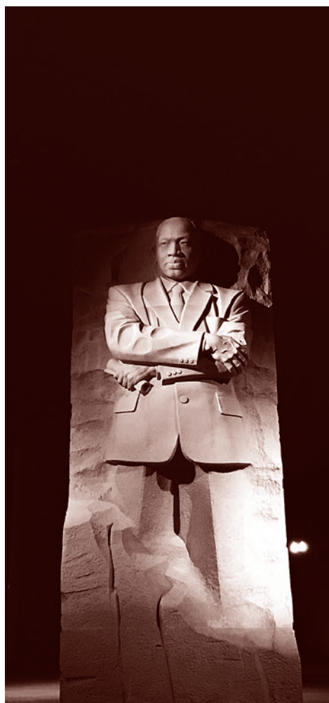
Памятник Мартину Лютеру Кингу-младшему.