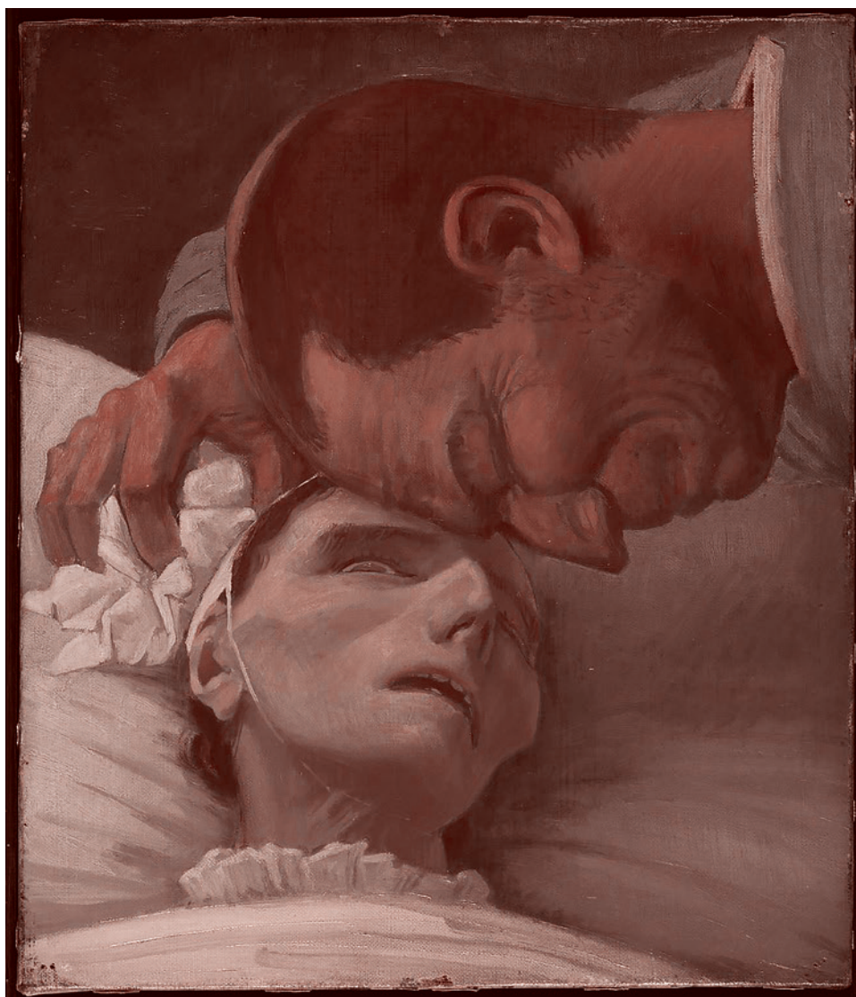
Генри Лэмб. Смерть крестьянина. 1911

Число зарегистрированных как безработные в службах занятости — 2 млн че-