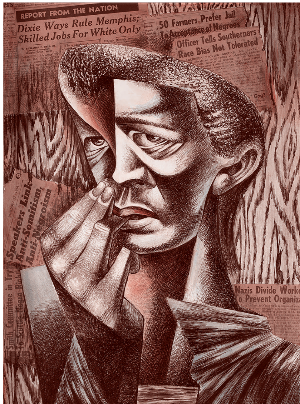
Чарльз Уайт. Заголовки. 1944

В ответ на попавшую в сеть запись убийства полицейским в г. Миннеаполисе чернокожего подозреваемого Джорджа