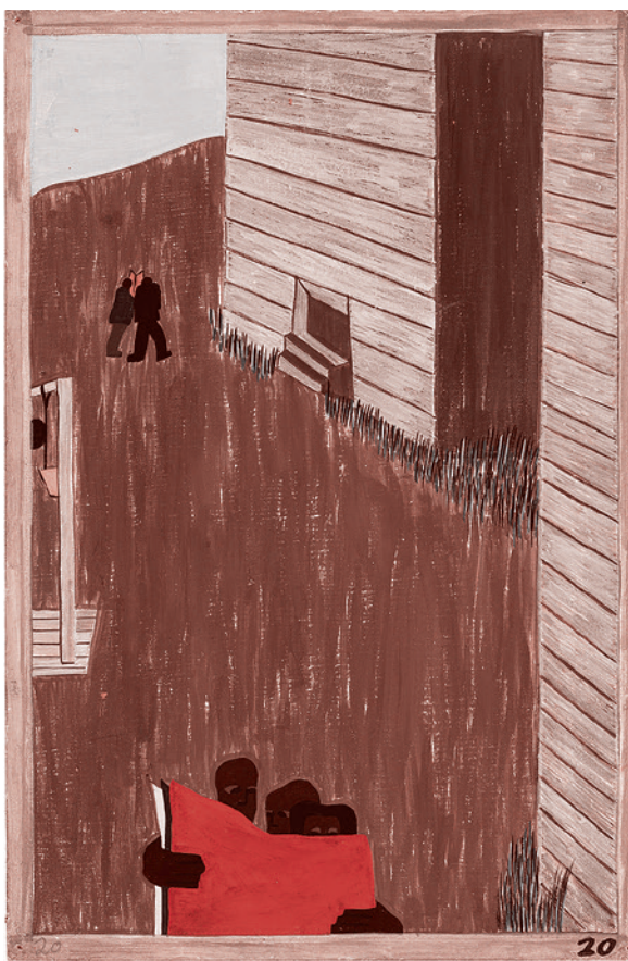
Джейкоб Лоуренс. №20 из серии «Миграция»: Во многих районах черная пресса читалась с большим интересом. Это воодушевляло движение. 1940–1941

Общение наше шло параллельно с общением. Причем инициатором этого обще-