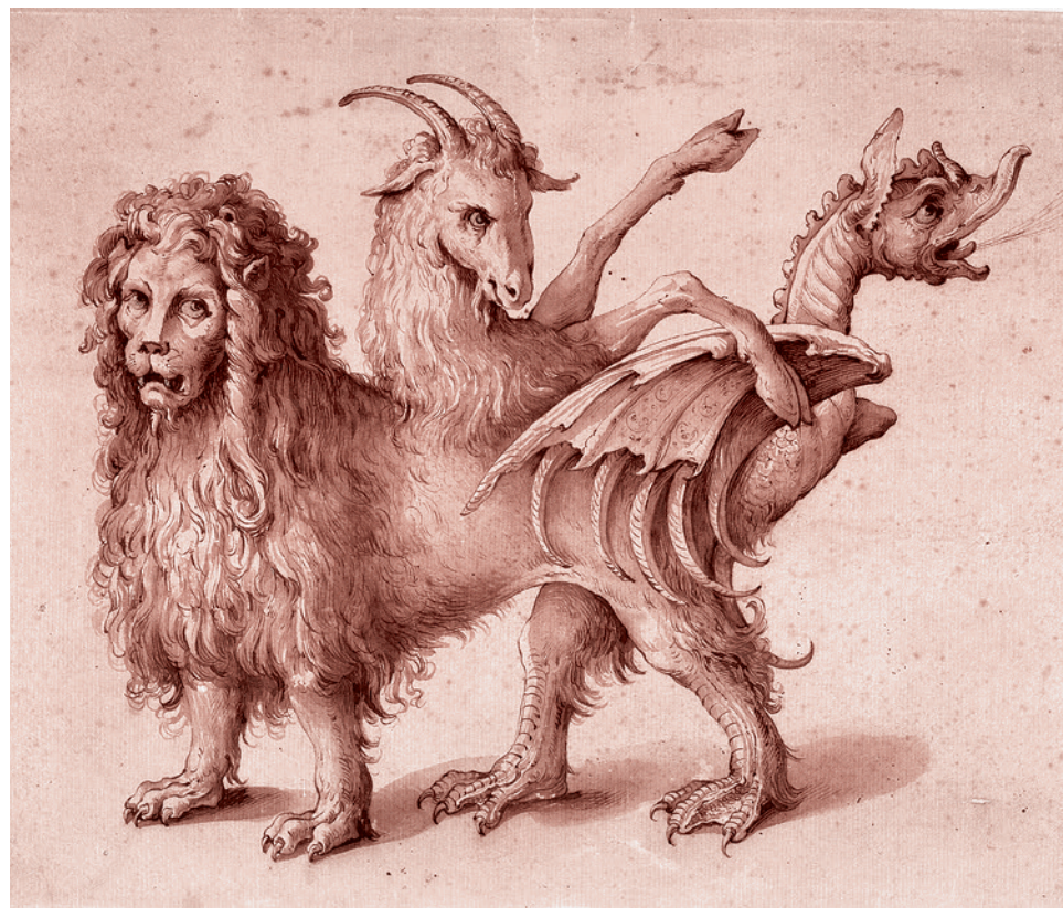
Якопо Лигоцци. Химера. 1590–1610

2015 год. Не 2019-й, не 2018-й, не 2017-й, не 2016-й — 2015-й! То, что я сейчас читаю, четыре с лишним года назад было опубликовано — задолго до того, как началась эпопея с коронавирусом.