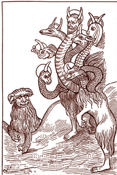
Чарльз Фихот. Химера. 1894