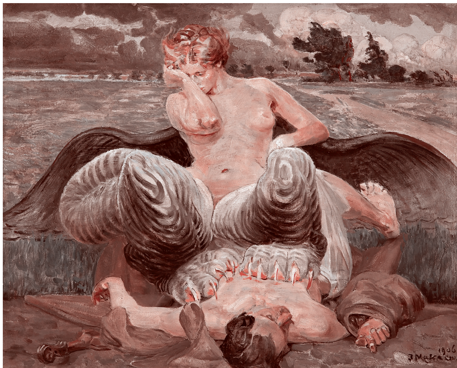
Яцек Мальчевский. Художник и Химера. 1906

Но еще более знаковое место — Джорджтаунский университет. Редфилд окончил в 1973 году Колледж искусств и наук при Джорджтаунском университе-