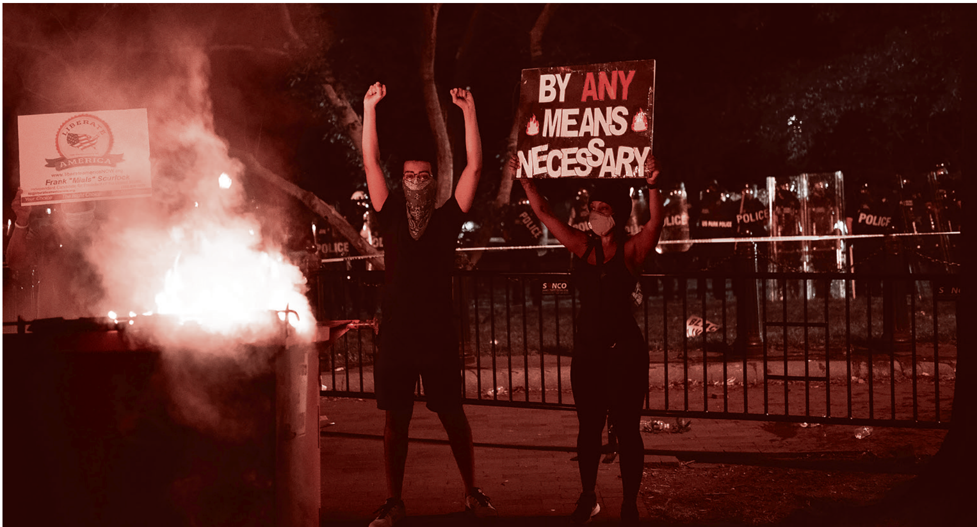
Протесты в Вашингтоне. 30 мая 2020 г.