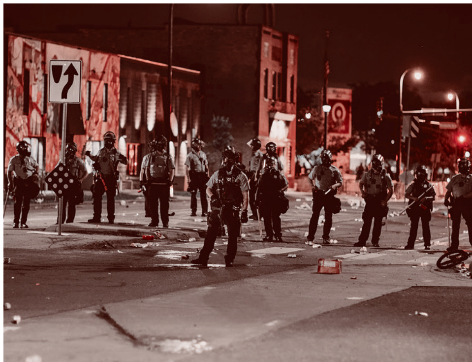
Полиция в Миннеаполисе. 28 мая 2020 г.

Трамп же не смог обеспечить лояльность даже ключевых чиновников министерского уровня, о чем свидетельствует непрекращающийся «кадровый пасьянс» со снятием и назначением госсекретарей, министров обороны, советников по национальной безопасности, глав аппарата Белого дома. Таким образом, Трамп оказался заложником того самого «глубинного государства», в поход против которого обещал отправиться в 2016 году.