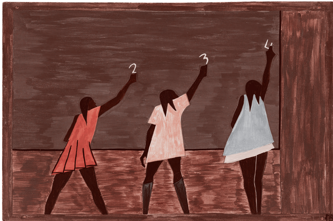
Джейкоб Лоуренс. №58 из серии «Миграция»: На севере у афро-американцев было больше возможностей для образования. 1940–1941

Студенты-юристы Дальневосточного федерального университета (г. Владивосток) должны будут заплатить более 210 тысяч рублей за год. На юрфаке Тихоокеанского государственного университета (г. Хабаровск) стоимость обучения составляет почти 170 тысяч рублей.