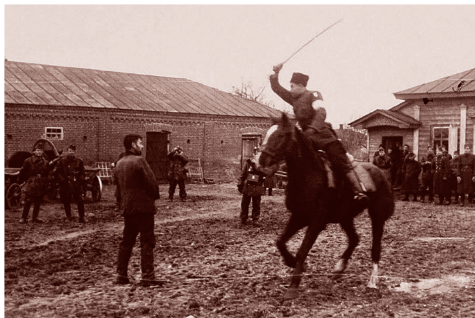
Казак-полицей рубит шашкой пленных советских партизан. Украина. Осень 1941 г.