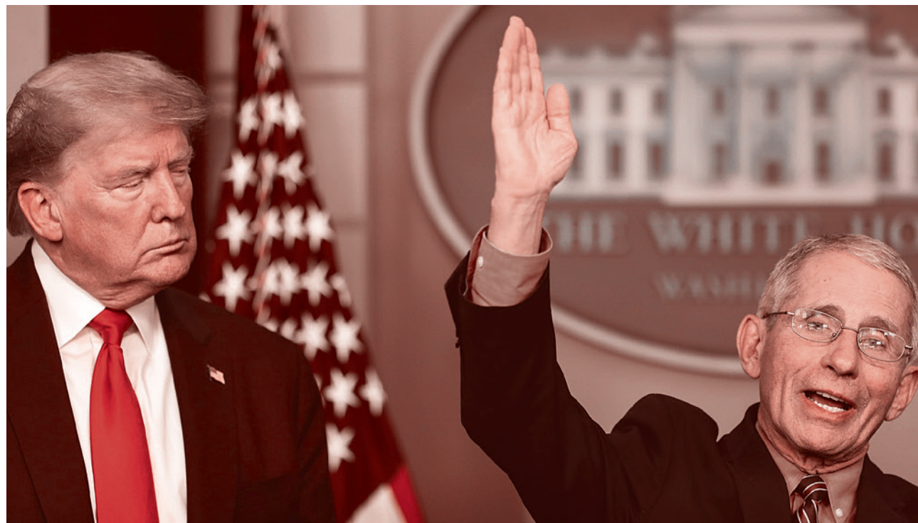
Дональд Трамп и Энтони Фаучи

1 апреля 2020 года The Nation сообщает, что Пентагон предупредил Трампа об опасности пандемии еще в 2017 году. Цитирую The Nation : «Наиболее вероятной и значительной угрозой представляется респираторное заболевание, особенно но-