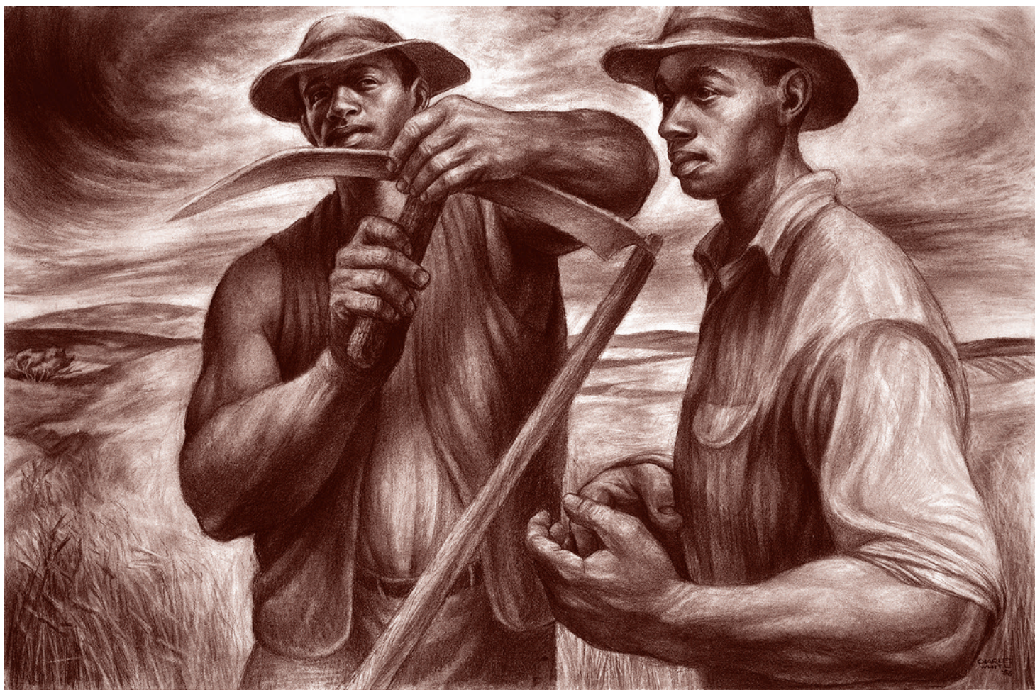
Чарльз Уайт. Разговор за уборкой урожая. 1953

То, что потом назвали «длинным, жарким летом 1967 года», было очень похоже на то, что происходит сейчас. Тогда эпицентром волнений стал город Детройт,