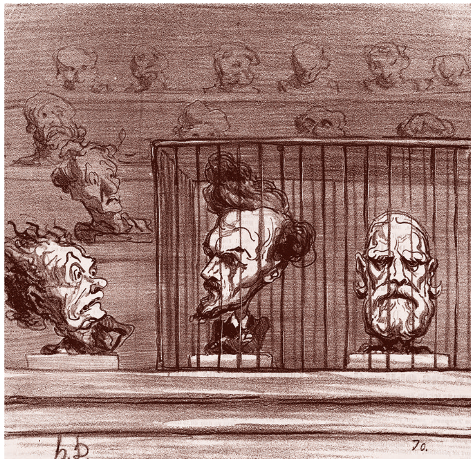
Оноре Домье. Предложение новой политической системы для лучшей изоляции реакционеров. 1870

16 апреля 2020 года «Известия» сообщают, что отрасли российской экономики, сильнее всего пострадавшие от ситуации с коронавирусом, могут потерять 17,9 трлн руб., а 15,5 млн человек могут потерять работу. Именно к этому выводу пришли, как сообщают «Известия», аналитики Национального рейтингового агентства.