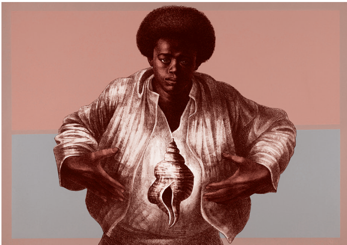
Чарльз Уайт. Звук тишины. 1978