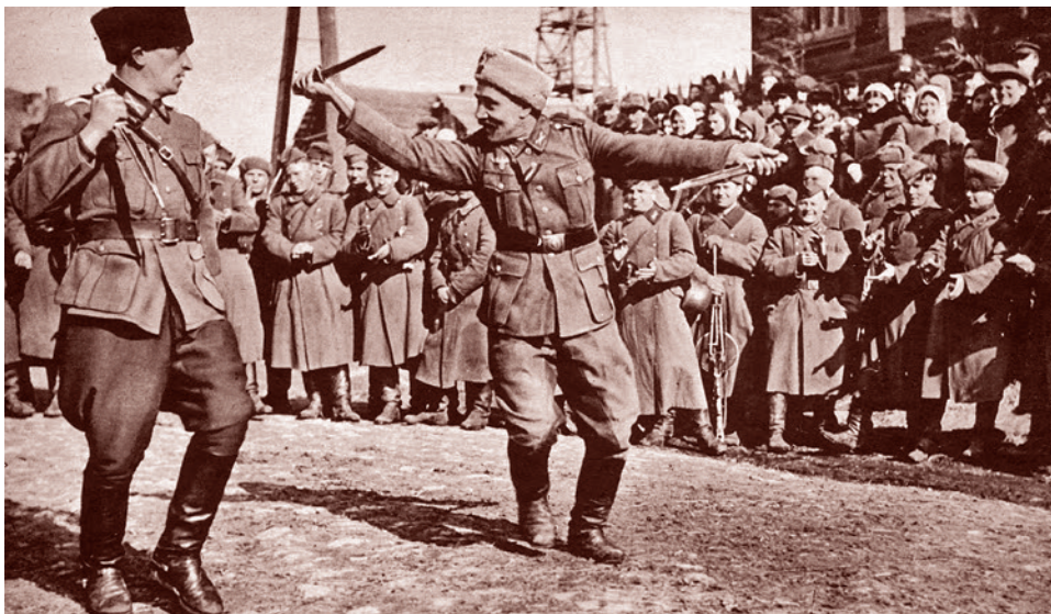
Казаки из 5-го донского полка вермахта танцуют для немецкого корреспондента. 1943