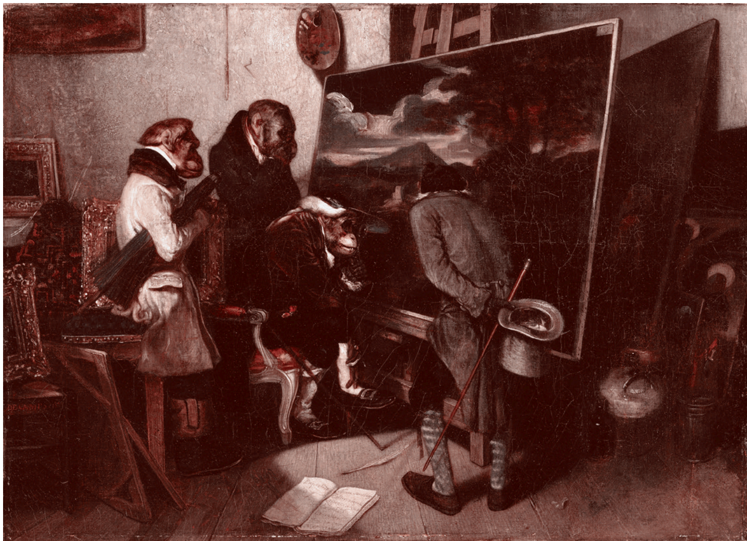
Александр-Габриэль Декам. Эксперты. 1837

Как говорится, скоро сказка сказывается, да не скоро дело делается. Но по прошествии трех недель посылка все-таки была отправлена в нуждающуюся Ита-