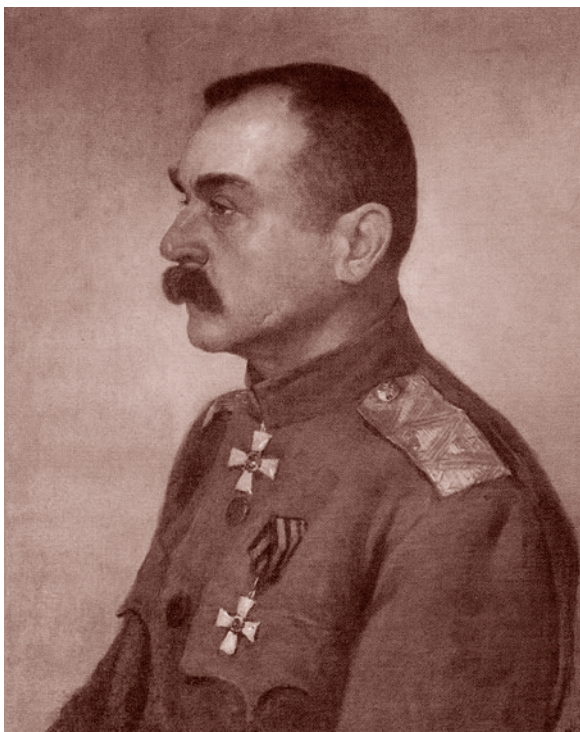
М. Б. Греков. Портрет А. М. Каледина. 1918

При этом в эмиграции казачество вовсе не представляло собой некую монолитную в структурном или хотя бы в мировоззренческом плане общность. Конечно, симпатизантов установившемуся в России строю среди них не было, однако и рьяными ненавистниками являлись далеко не все. У многих казаков-эмигрантов время и силы почти целиком уходили на встраивание в зарубежную жизнь и обеспечение себя и своих семей, а потому они вообще оказались вне политических процессов — пережившие мировую войну государства часто и для своих-то граждан были весьма неудобными, а уж тем более для эмигрантов.