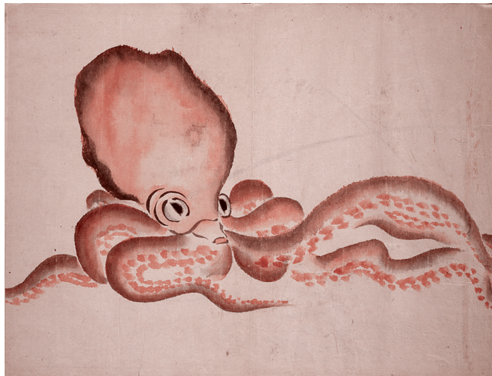
Ринсай Окубо. Эскиз осьминога. 1870

— Простой пример. Современные цифровые пропуска уже породили конфликт