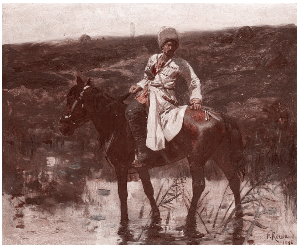
Франц Рубо. Казак

При этом следует понимать, что Советская Россия 1918 года — это не СССР