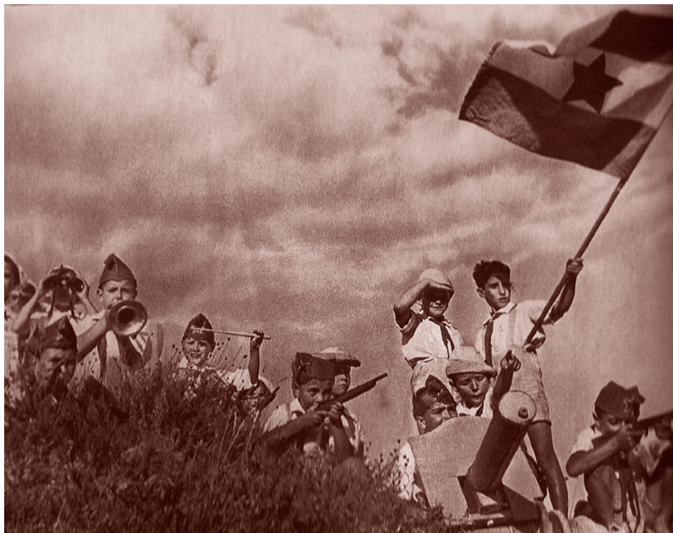
Испанские дети в «Артеке»

Неруда вспоминает, чем были наполнены будни Мадрида осенью 1936 года, когда к городу все ближе подступала линия фронта. Он описывает, как по городу ходили анархисты, «платты и бородачты,