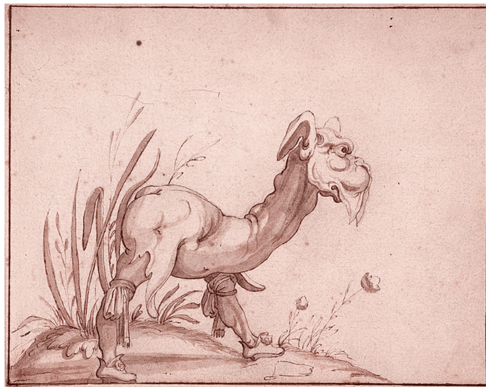
Аренд ван Болтен. Фантастическое создание. Конец XVI—начало XVII вв.

После публикации Капуто дал короткий комментарий журналистам CNN по поводу своих публикаций. «Честная игра, приятель. Мне всё равно. Это не имеет значения для меня», — приводит его слова издание. По утверждению Капуто, свои сообщения он стирает ежемесячно, потому что они «сводят людей с ума». Свои заявления он объяснил тем, что «защищал президента [США]». Он также отметил, что теперь служит народу Америки и его сообщения в Twitter будут другими.