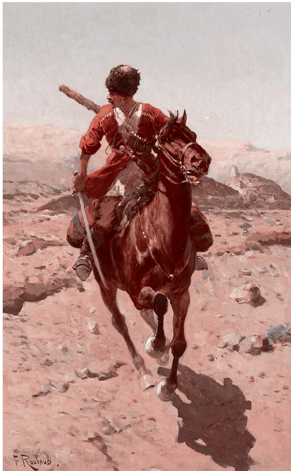
Франц Рубо. Казак, скачущий на коне