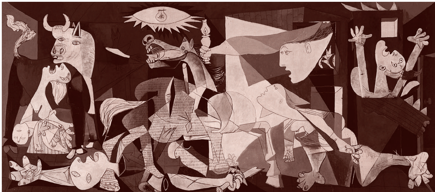
Пабло Пикассо. Герника. 1937

На родине советские испанцы сталкивались с самыми разными сложностями. Прежде всего, справедливыми оказались опасения, что люди, приехавшие из СССР, будут подвергаться допросам и преследованиям. Многие из репатриантов рассказы-