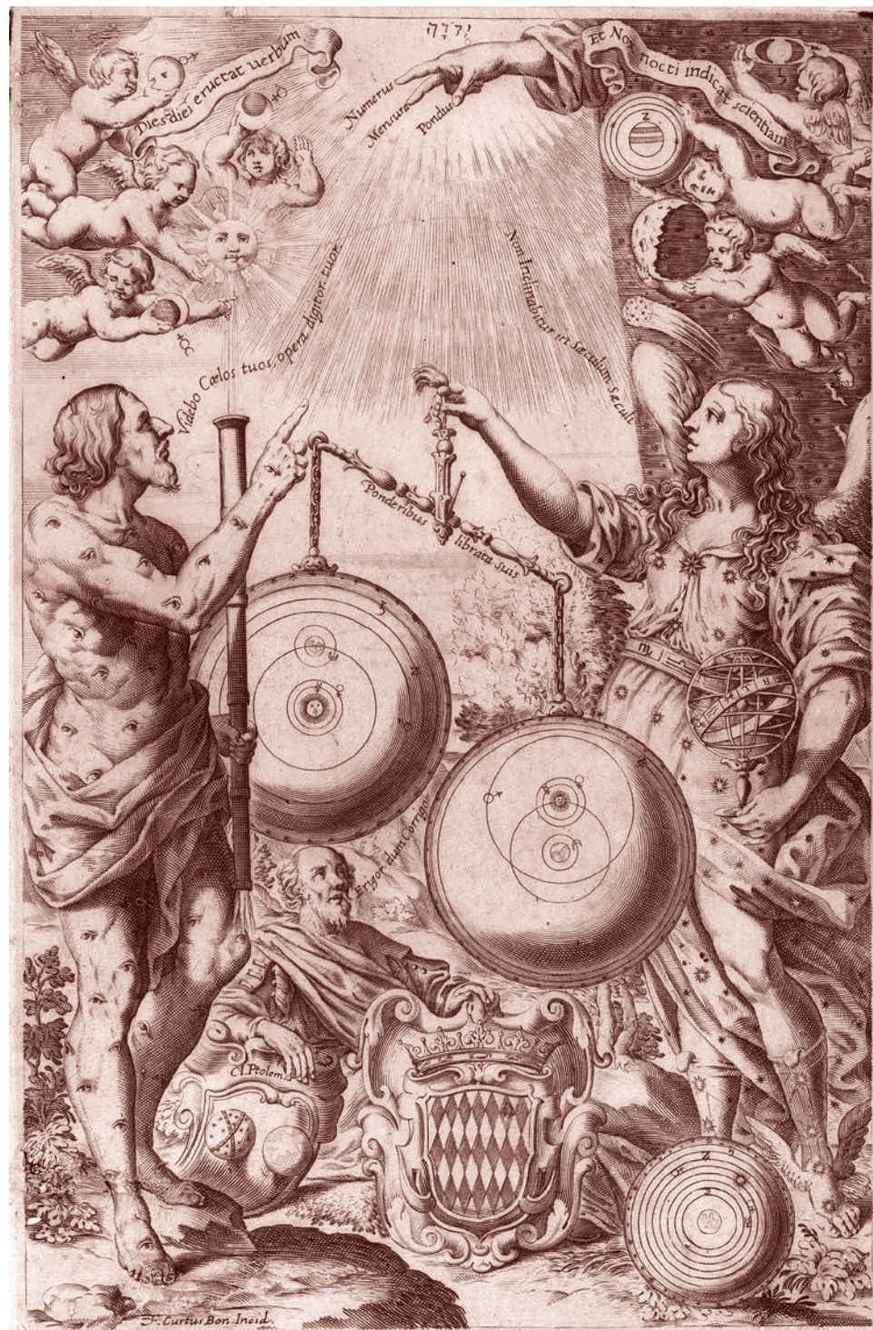
Франческо Курти. Фронтиспис «Нового Альмагеста». Мифические фигуры взвешивают астрономические теории. 1651

Угроза установления особого тоталитаризма, превращающего человека в марионетку элиты робота, несомненно, существует. Тут речь идет о ключевой угрозе — об угрозе технодегуманизации человечества, рода человеческого как такового. Но это же чем-то порождено! Если человек не обладает священной суверенной сущностью, как бы она ни называлась: родовой сущностью Маркса или искрой божьей — то почему бы не закрутить наночипы, используя новые технологические возможности? И тут что евгеника, что так называемый mind control (то есть контроль над сознанием), что обычный тоталитаризм, что какие-нибудь еще модификации информационного контроля, электронного контроля, электронного концлагеря и так далее. Тут всё едино. И обязательно нужно бить тревогу по поводу всего, что знаменуют собой подобные перекосы. И нужно окорачивать не тех, кто этого боится, а тех, кто движется в эту сторону и вызывает этот страх. И надо всегда помнить, что такое окорачивание когда-то осуществил Нюрнбергский трибунал, притом что осужденные этим трибуналом мерзавцы — многие из них — говорили о своем