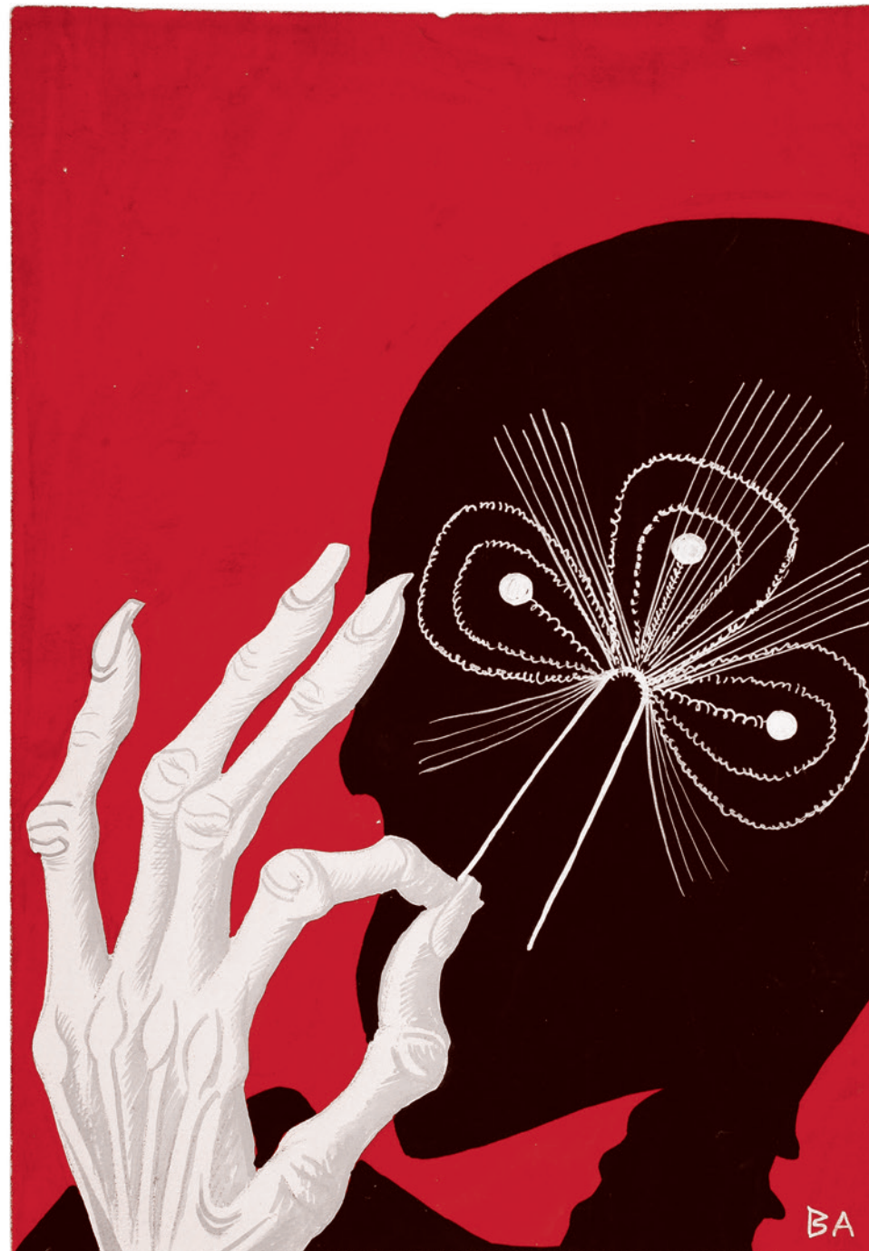
Борис Арзыбашев. Иллюстрация для книги

С тех пор была «тишь-гладь да божья благодать», и никто не говорил ничего плохого в адрес Китая: «Хорошая страна, вместе с ней делим мировое производство, вместе с ней как-то существуем».