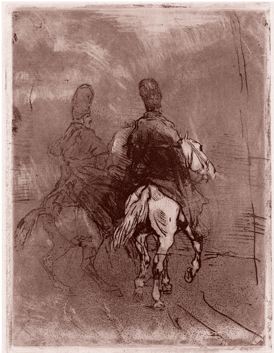
Джон Льюис Браун. Конные казаки. XIX в.

Вспомнить хотя бы весьма краткую историю Бугского войска, ведущего свое происхождение от турецкого конного полка из османских подданных православного вероисповедания. В 1775 году этот полк перешел на русскую службу и был поселен на Южном Буге на правах казачьего. В 1797 году полк расформировали, а его воинов перевели