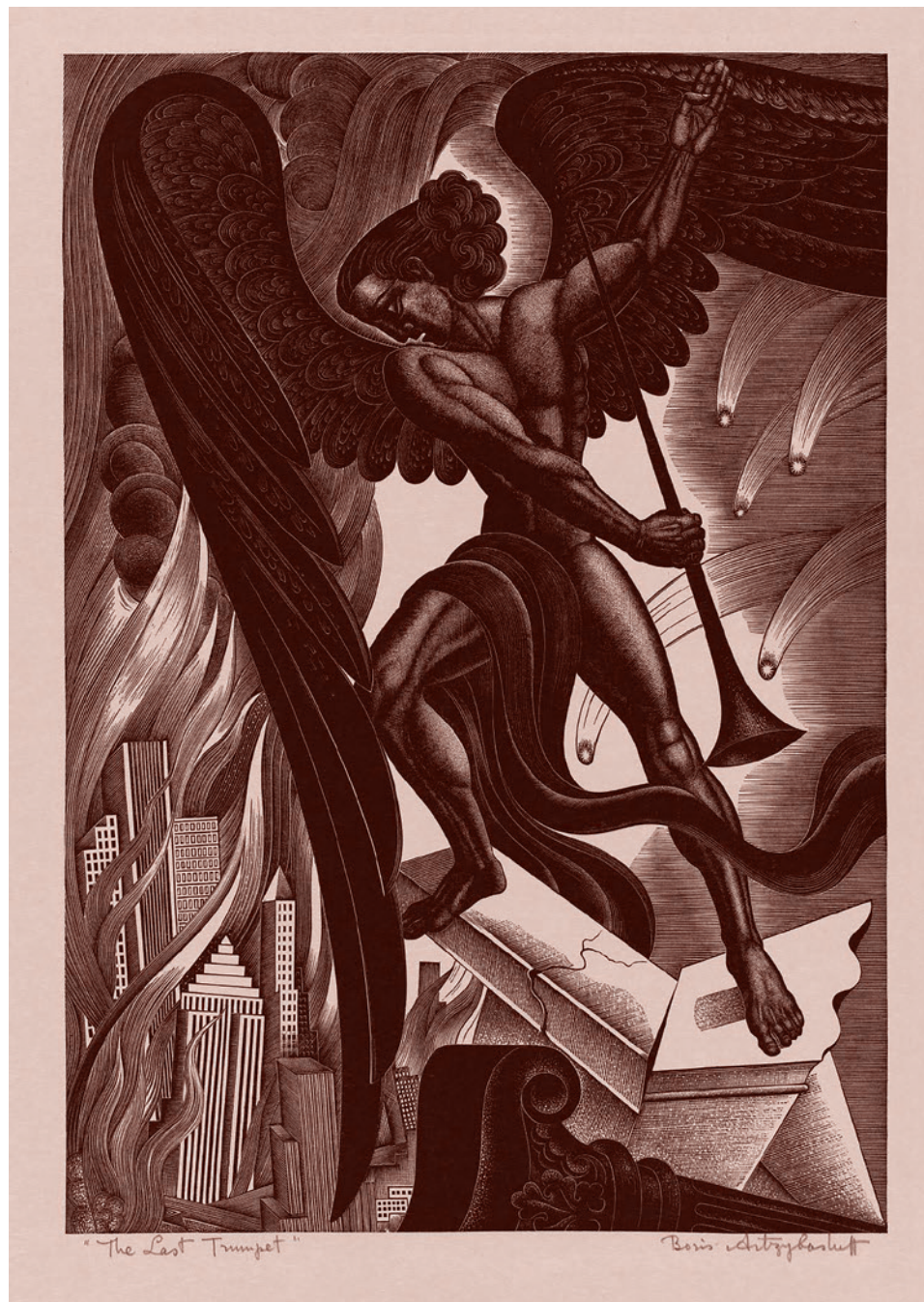
Борис Артыбашев. Последняя труба. 1937

Дальше. Во-первых, я вообще никого ни в чем не обвиняю. Просто потому, что у меня есть недостаток информации. И я