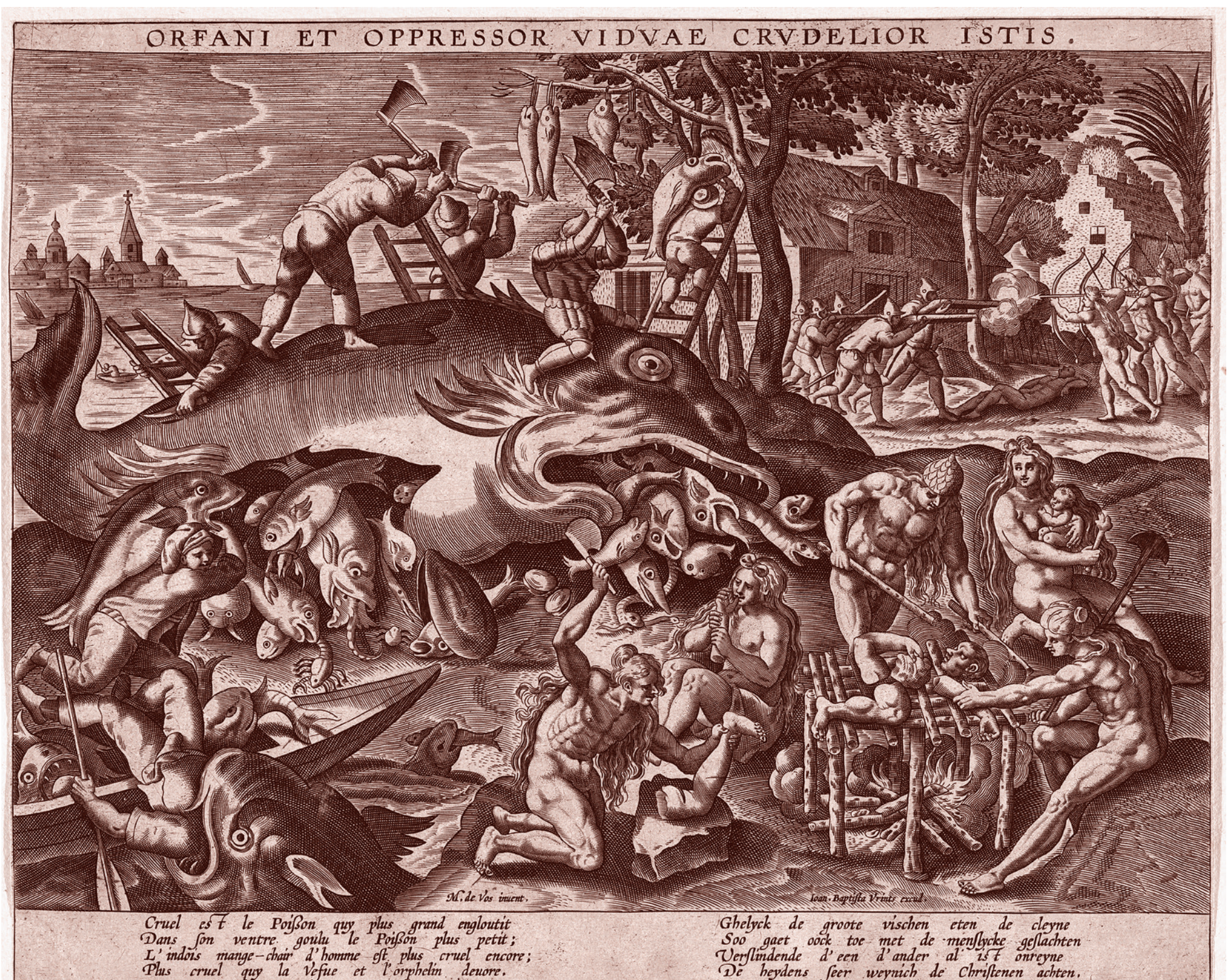
Аноним, Нидерланды. Большие рыбы едят маленьких. Конец XVI в.