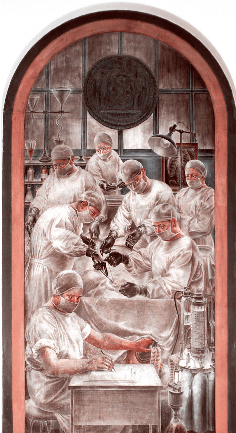
Фреска из Гарлемского госпиталя

Он напоминает, что плата за пользование здравоохранением была введена