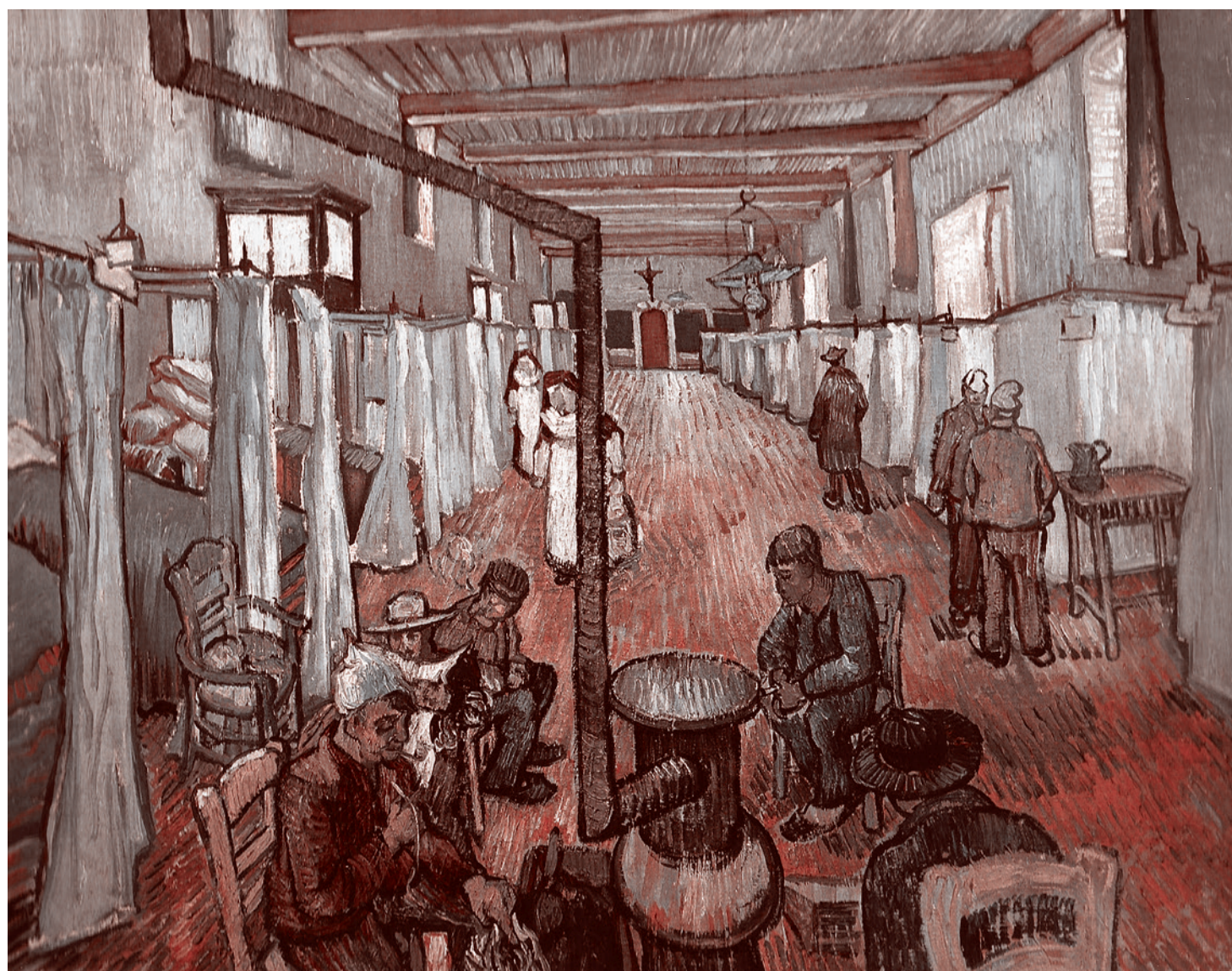
Винсент Ван Гог. Палата больницы в Арле. 1889

Центры для оказания высокотехнологической помощи (или, как модно стало выражаться — услуг) переделываются в поповых как бы в инфекционные. Именно «как бы!» Поскольку такие центры никогда не были рассчитаны на прием и уж тем более на лечение инфекционных больных. Вот и приходится врачам и медсестрам