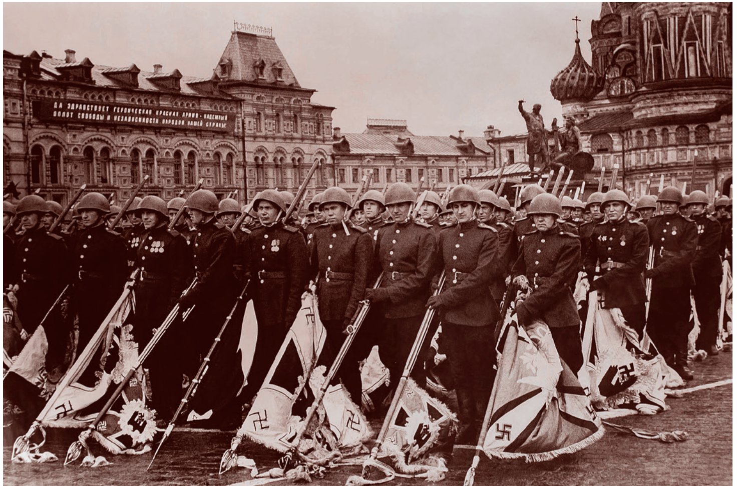
Михаил Трахман. Парад Победы. Советские солдаты с поверженными штандартами гитлеровских войск. 24 июня 1945 г.