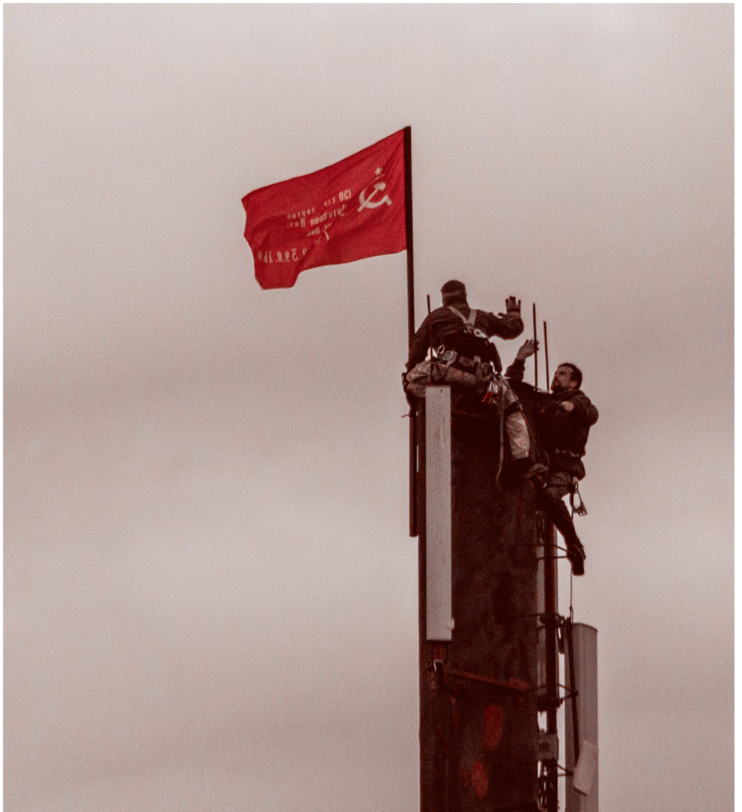
Члены Александровской коммуны «Суть времени» устанавливают копию Знамени Победы на фабричной трубе в честь 75-летия Победы. 9 мая 2020 г.