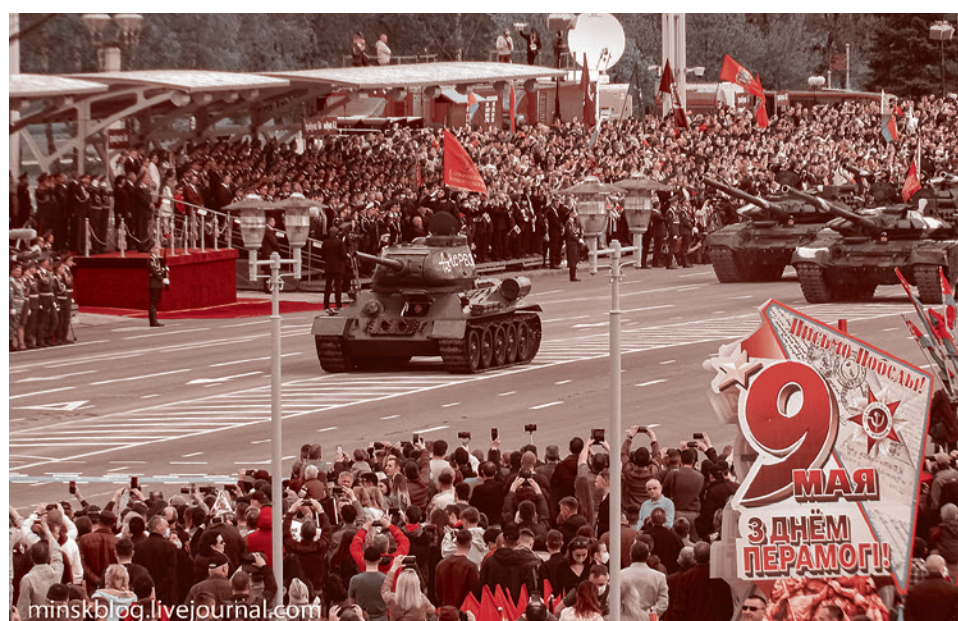
Парад в Минске, посвященный 75-летию Победы в Великой Отечественной войне