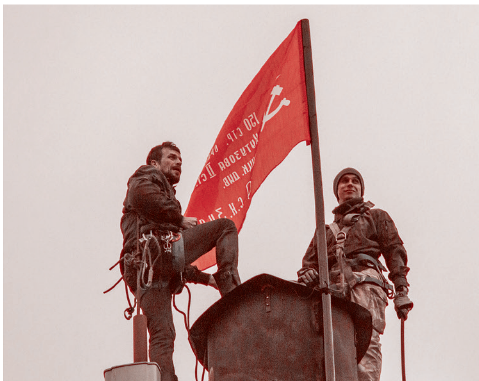
Члены Александровской коммуны «Суть времени» и копия Знамени Победы, установленная на фабричной трубе в честь 75-летия Победы. 9 мая 2020 г.

Автоколонна с реконструкцией событий Великой Отечественной войны, а также авиапарад над Екатеринбургом являются заслугой Центрального военного округа, заявил губернатор Свердловской области Евгений Куйвашев в Instagram. «Хочу отметить, что из свердловского бюджета никаких дополнительных денег на эти мероприятия не выделяется, их полностью организует Центральный военный округ», — сообщил Куйвашев. Несмотря на «режим самоизоляции», зрителями автопробега и парада авиации стали тысячи людей в центре Екатеринбурга.