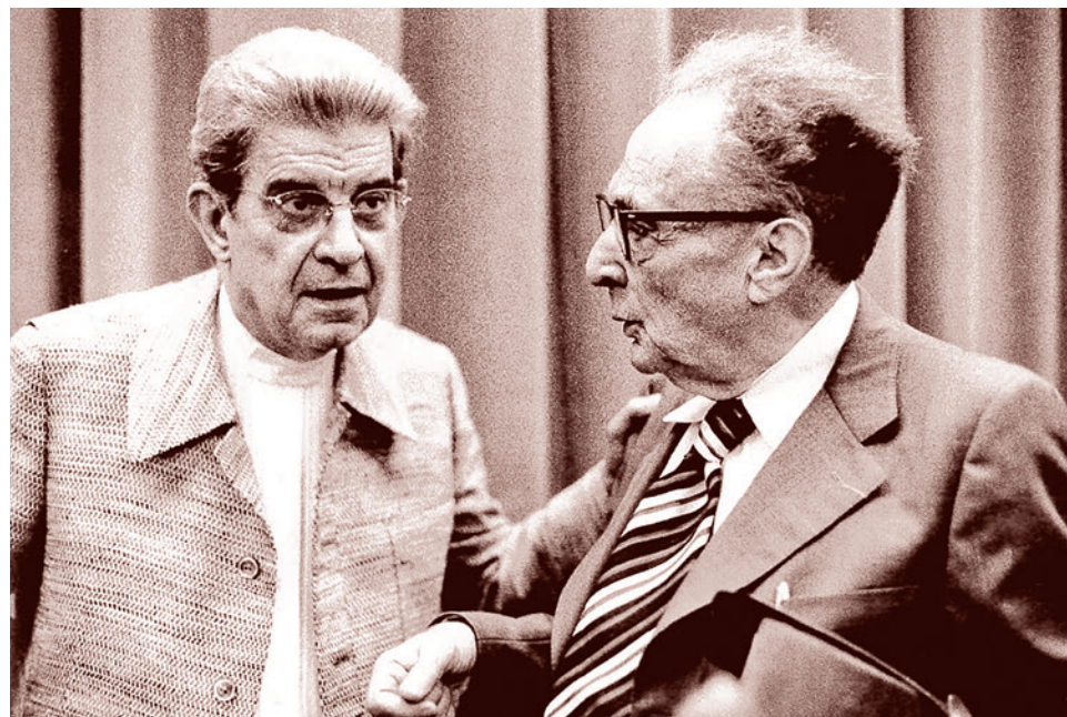
Жак Лакан и Роман Якобсон в Милане. 1974

Внутри моего исследования, на его финальном этапе, очевидным образом зреет резкий поворот от кибернетических, лирико-физических и прочих частностей к чему-то общему и крайне масштабному. Причем настолько общему и крайне масштабному, что и коронавирус — всего лишь значимая, но достаточно мелкая частность.