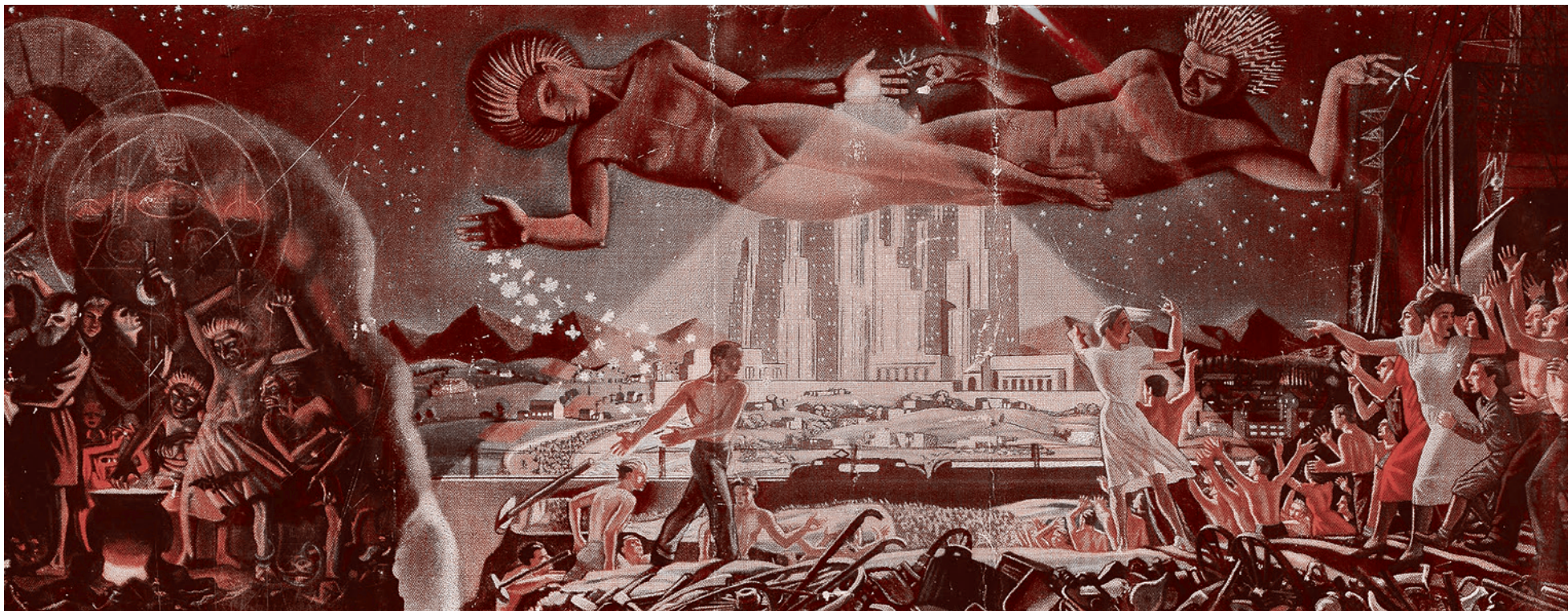
Роквелл Кент. Фреска для General Electric. 1939

Примечательно, что Эренбург не сказал ни слова по поводу причин, побудивших его стать зачинщиком далеко идущей дискуссии по поводу физиков и лириков. А также по поводу того, как зовут эту причину, и где именно она обитает. Мемуары Эренбурга «Люди, годы, жизнь» — один из ярчайших образцов сокрытия всего, что составляет содержание человеческой жизни, выдаваемого за чуть ли не исповедь. Конечно, есть и другие яркие образцы.