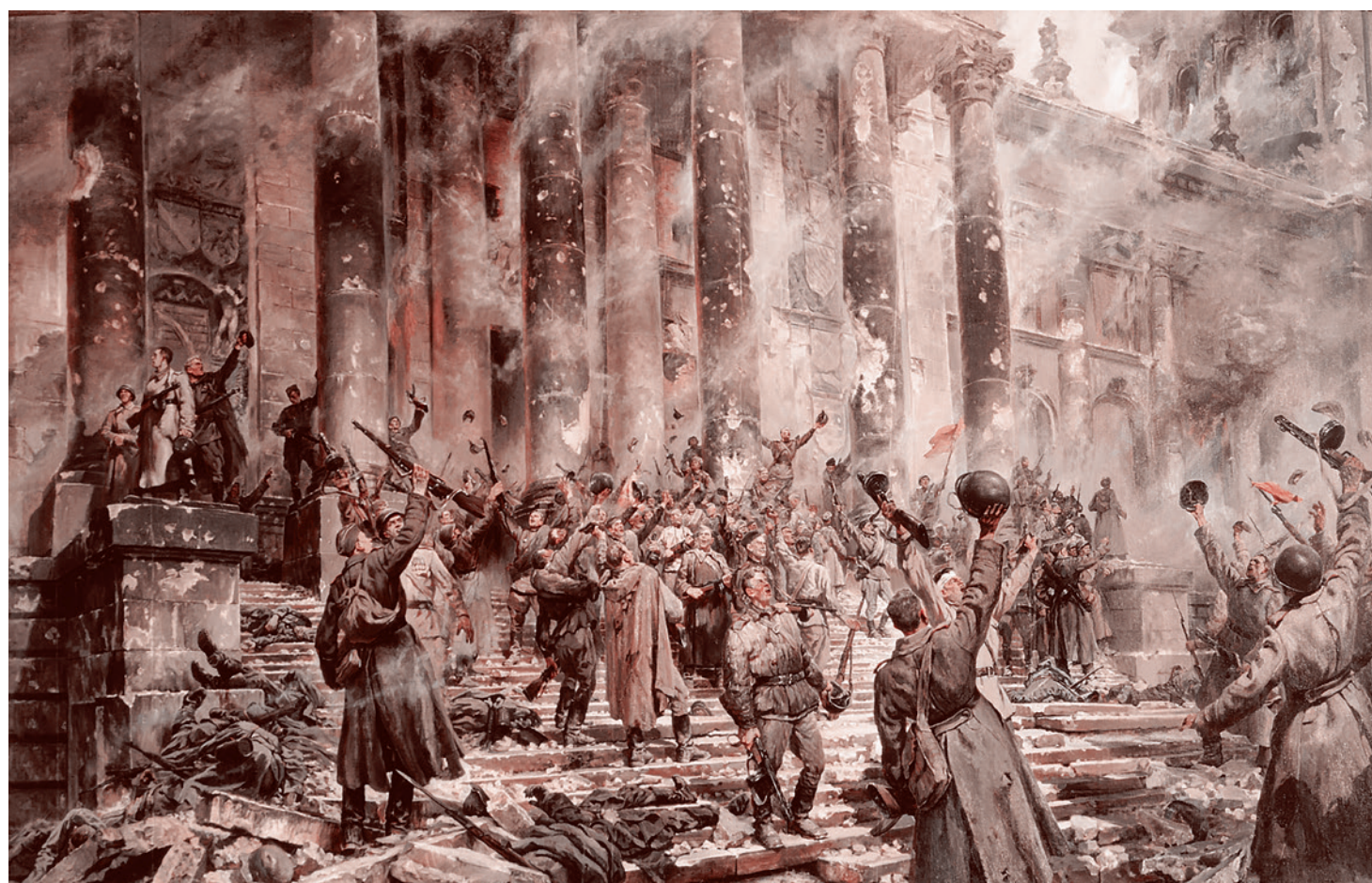
Пётр Кривоногов. Победа. 1948

Для салюта задействовали 90 единиц техники, он продлился 10 минут. Небо над городом осветили более 10 тысяч фейерверочных выстрелов. Из артиллерийских