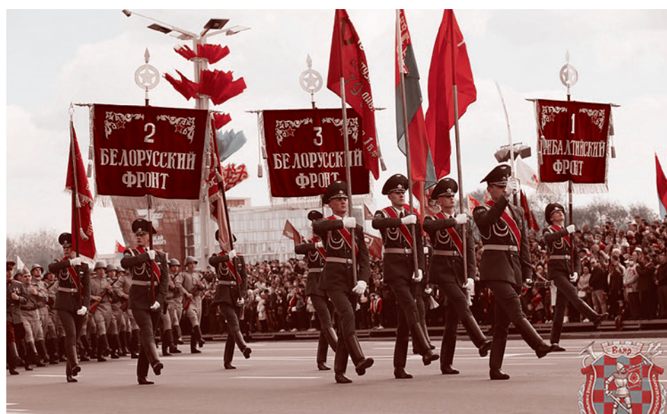
Парад в Минске, посвященный 75-летию Победы в Великой Отечественной войне