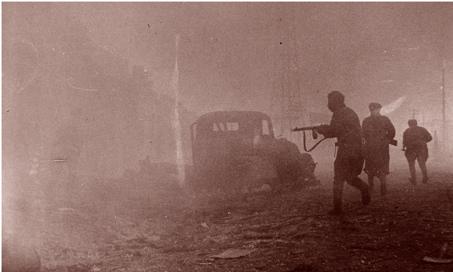
Михаил Савин. Красноармейцы у разбитого грузовика на улице Кенигсберга во время боев за город. Апрель 1945 г.

Время, когда мы безостановочно отступали — да, с боями, с постоянным сопротивлением, непрерывными контратаками, но отступали — было временем национального унижения.