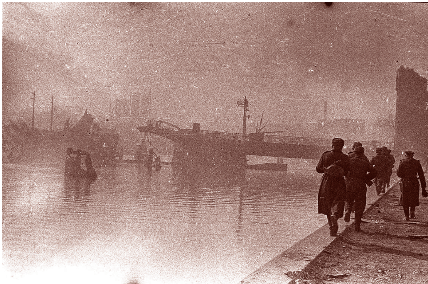
Михаил Савин. Советские бойцы идут по набережной разрушенного Кенигсберга. 9 апреля 1945 г.

Не с точки зрения важных, но все же лишь рациональных объяснений, что врага надо добивать в его логове (это, кстати, всегда было частью военной доктрины русских еще со времен Святослава), что необ-