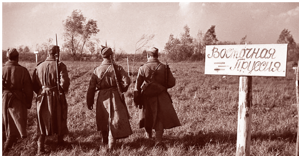
Михаил Савин. Красноармейцы на границе Восточной Пруссии. Октябрь-ноябрь 1944 г.

ходимо было создать буфер из дружественных стран, чтобы успеть подготовиться к нападению, что надо было ликвидировать плацдармы, откуда это нападение могло быть осуществлено (типа той же Восточной Пруссии, о которой мы рассказали).