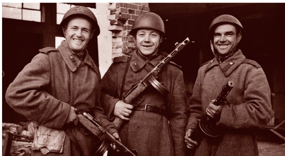
Групповой снимок красноармейцев-автоматчиков во взятом Кенигсберге. Апрель 1945 г.

Ведь именно идея сплотила многонациональный народ так, что даже изощренные гитлеровские специалисты не смогли создать массовую «пятую колонну», чтобы разобщить людей и уничтожить страну изнутри. Этот феномен западные историки так и не смогли объяснить.