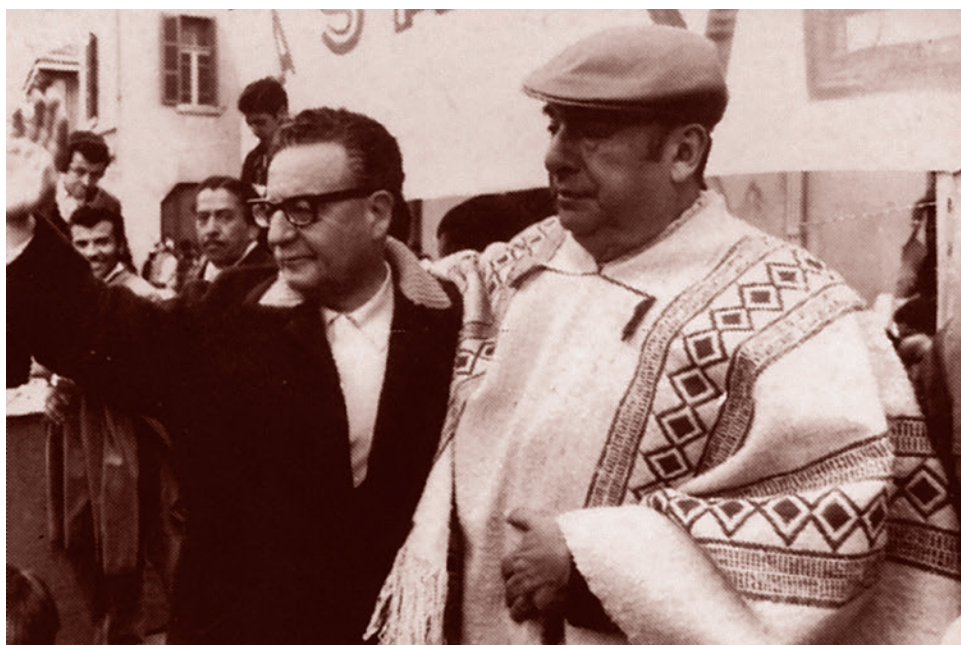
Сальвадор Альенде и Пабло Неруда

Искусство стремились свести к музею, в котором знатоки могут любоваться музифицированными формами, оторванными от жизни (правые в Чили назывались «момии», то есть мумии). Балерина Джоан Хара вспоминает, что труппа Национального балета, в которой она работала, разделалась на тех, кто хотел танцевать только классические постановки, и тех, кто интересовался современным танцем. Последние стремились также к участию в политической, социальной жизни. Уход же в чистое классическое искусство стал демонстрацией нежелания заниматься «сиюминутными» политическими вопросами, это был сознательный уход от жизни в оторванную от всего профессиональную сферу. Джоан отмечает: «Я ушла из Национального балета, поглощавшего много времени и все больше стремившегося к академизму».