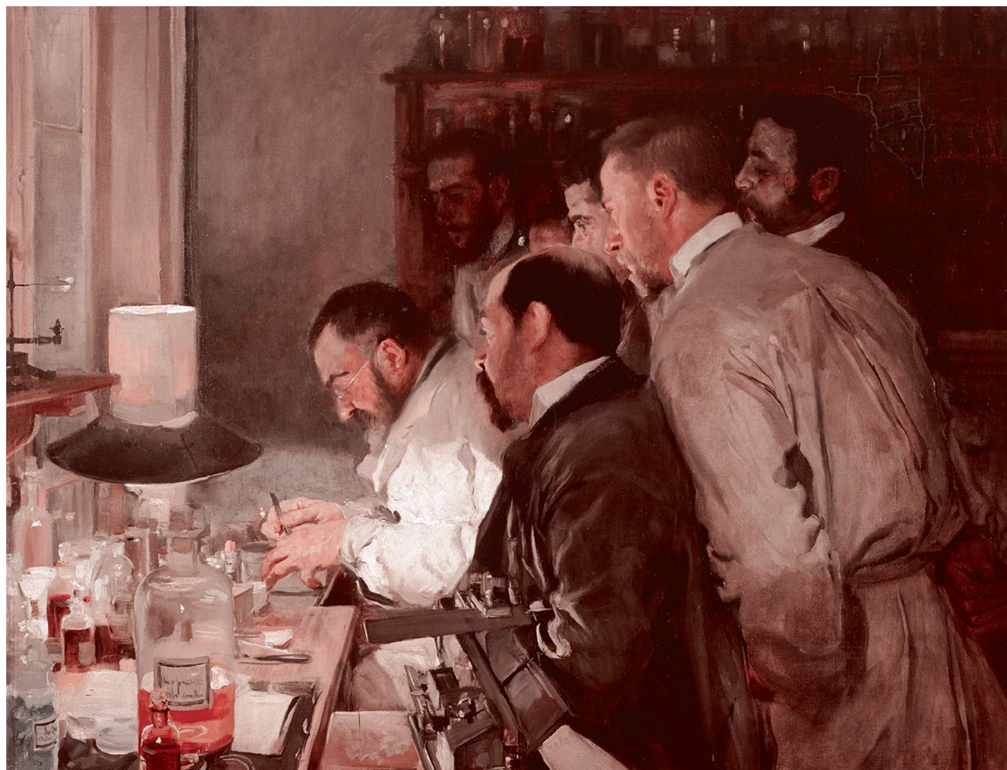
Хоакин Соролья. Исследование. 1897

Далее. С одной стороны, говорится, что мы не можем занять все томографы в стране больными с подозрением на COVID-19, потому что есть и другие больные — онколо-