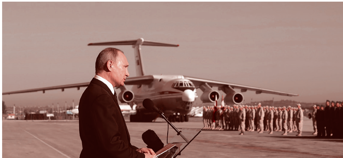
Владимир Путин во время посещения авиабазы Хмеймим в Сирии. 17 декабря 2017 г.

Да и сам экспорт исламистских боевиков из Идлиба в Ливию по планам Эрдога-