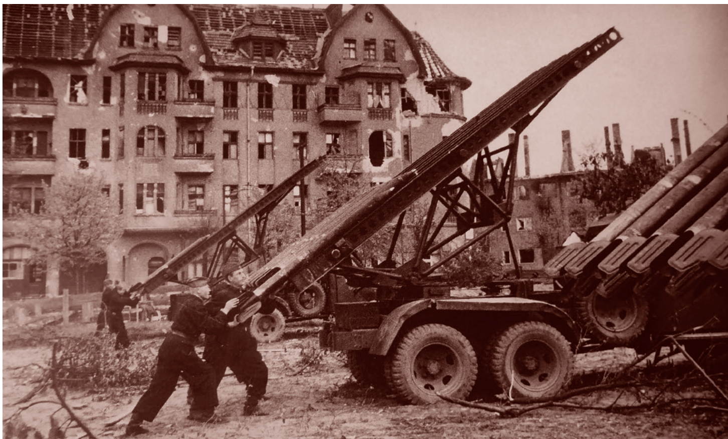
Марк Редькин. Советские артиллеристы готовят к залпу реактивный миномет БМ-13 «Катюша» во время боев в Берлине. 29 апреля 1945 г.

Впрочем, не отставал от него и Жуков. 20 апреля он вдруг обнаружил, что части 1-го Украинского фронта продвигаются успешно, чем его войска, и могут войти