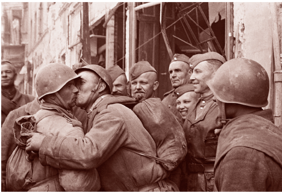
Георгий Капустянский. Земляки — бойцы РККА обнимаются, встретившись в Берлине. Май 1945 г.

Итак, 16 апреля, в 5 часов утра, еще до рассвета, артподготовку начал 1-й Белорусский фронт. Более 10 тысяч стволов 25 минут смешивали с землей первую линию обороны противника, затем удар был перенесен в глубину. Включив 140 мощных прожекторов для ослепления и деморализации противника, пехота и танки ударной группировки двинулись в наступление. Войскам фронта двое суток пришлось последовательно прорывать глубоко эшелонированную оборону. К исходу 17 апреля самый сложный участок, Зееловские высоты, были взяты, а 19 апреля была прорвана третья полоса одерского рубежа обороны. Перед глазами наших солдат был Берлин.