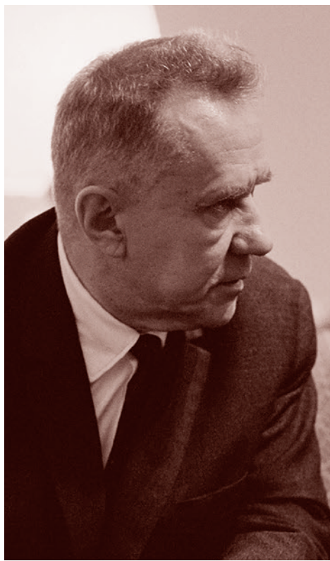
Алексей Николаевич Косыгин

В биографии Алексея Николаевича Косыгина есть непримечательный, но, как мне представляется, важный сюжет. Он касается того, что в 1951 году Алексей Николаевич, будучи уже очень крупным советским политическим деятелем, возглавлял комиссию, рассматривавшую, казалось бы, крайне мелкий вопрос — о роспуске физико-технического факультета МГУ (ФТФ