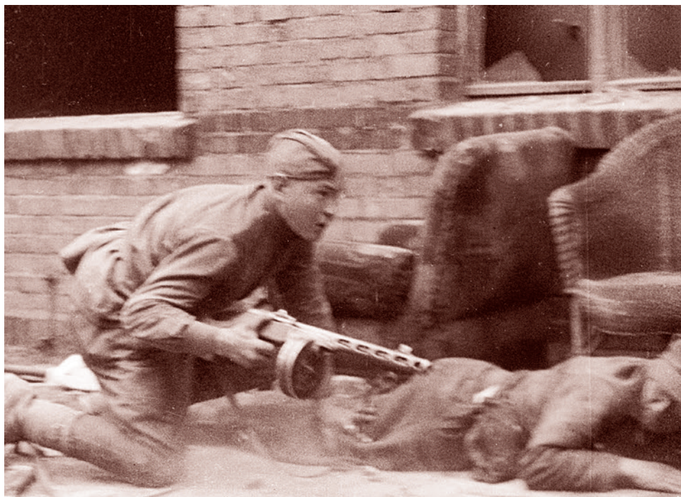
Автоматчик РККА во время боя в Берлине. Май 1945 г.

в город первыми. Тогда Жуков отдает командующему 2-й танковой армией С. Богданову приказ: