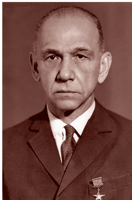
Анатолий Алексеевич Дородницын