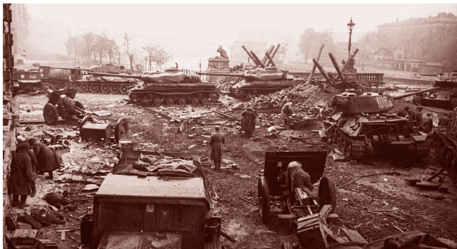
Владимир Гребнев. Советские танки и другая техника у моста Мольотке через Шпрее в районе Рейхстага. Апрель 1945 г.