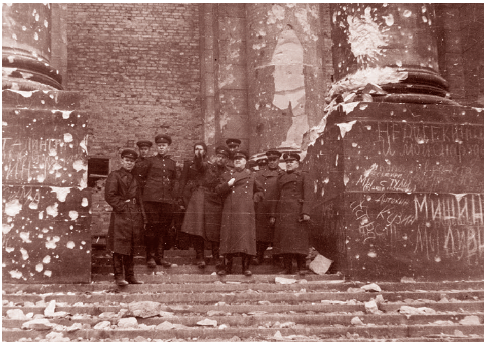
Виктор Темин. Командующий 1-м Белорусским фронтом маршал Георгий Константинович Жуков (1896—1974) с группой офицеров на ступенях Рейхстага. 3 мая 1945 г.