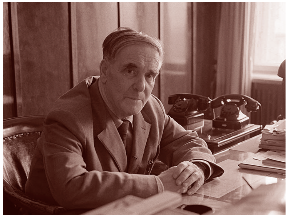
Петр Леонидович Капица

Хрущев всё это прекрасно понимал. Ему нравилась сложность отношений между Капицей и Сталиным. Но даже Хрущев, который ценил эту сложность и ее политические последствия (можно было отчасти опереться на Капицу в том, что касалось антисталинизма), не всё понимал в деятельности Капицы. В его воспоминаниях есть такие строки по поводу неокончательности позиции Капицы в вопросах обороны: «Мне трудно было понять, как советский человек, видевший страдания нашего народа, которые принесла гитлеровская война, может так мыслить. Мы прилагали все усилия к тому, чтобы не повторилась война, всё делали для подъема экономики, науки, культуры. Понятно, что без науки оборонную