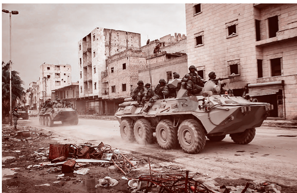
Работа сапёров Международного противоминного центра Министерства обороны России в Алеппо (Сирия). 2016

В середине октября 2019 года правительственная САА взяла под свой контроль города Манбидж, Кобани, Эт-Табка, Эр-Ракка и их окрестности, а также мосты через Евфрат, две гидроэлектростанции и большие участки стратегического шоссе М4. А 22 октября на переговорах в Сочи Путин и Эрдоган договорились о новых «зонах влияния» Сирии и Турции вдоль границы и прекращении операции «Источник мира».