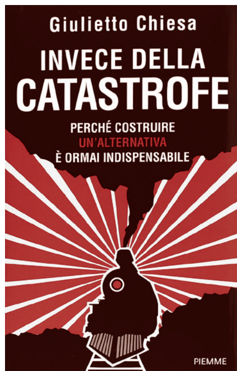
Обложка книги Джульетто Кьезы «Что вместо катастрофы?»

Корни нашего сотрудничества по противодействию активизации неонацистских движений и глорификации пособников нацистов уходят в тот же 2009 год, когда Джульетто Кьеза лично наблюдал в Риге 16 марта шествие бывших легионеров СС и потом опубликовал в Италии большую статью о чествовании нацистских приешпешников в одной из европейских столиц. Наша последняя конференция с участием Джульетто состоялась 15 марта этого года. Мы общались с Джульетто из Риги через Skype, обсуждали проблему роста неонацистских движений в Европе. Тогда