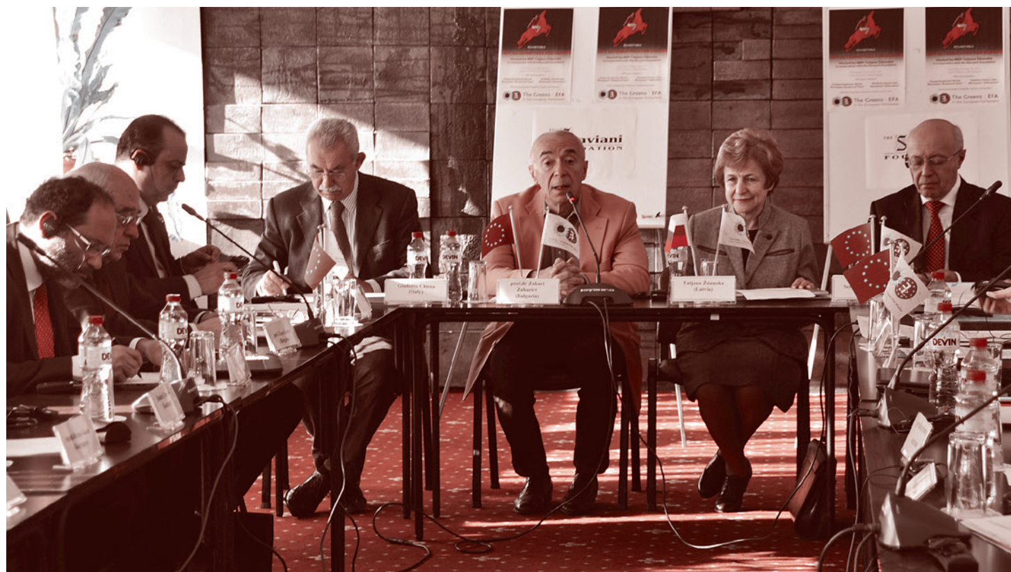
Заседание клуба «София»

Необходим системный пересмотр функционирования общественного бытия. Новые приоритеты, характеризующиеся гораздо более высокой моралью, должны заменить доминирующую и неконтролируемую власть рынка. Философия, основанная на конкуренции, попирающей общественную мораль, должна уступить место системе, основанной на социальной справедливости и мире.