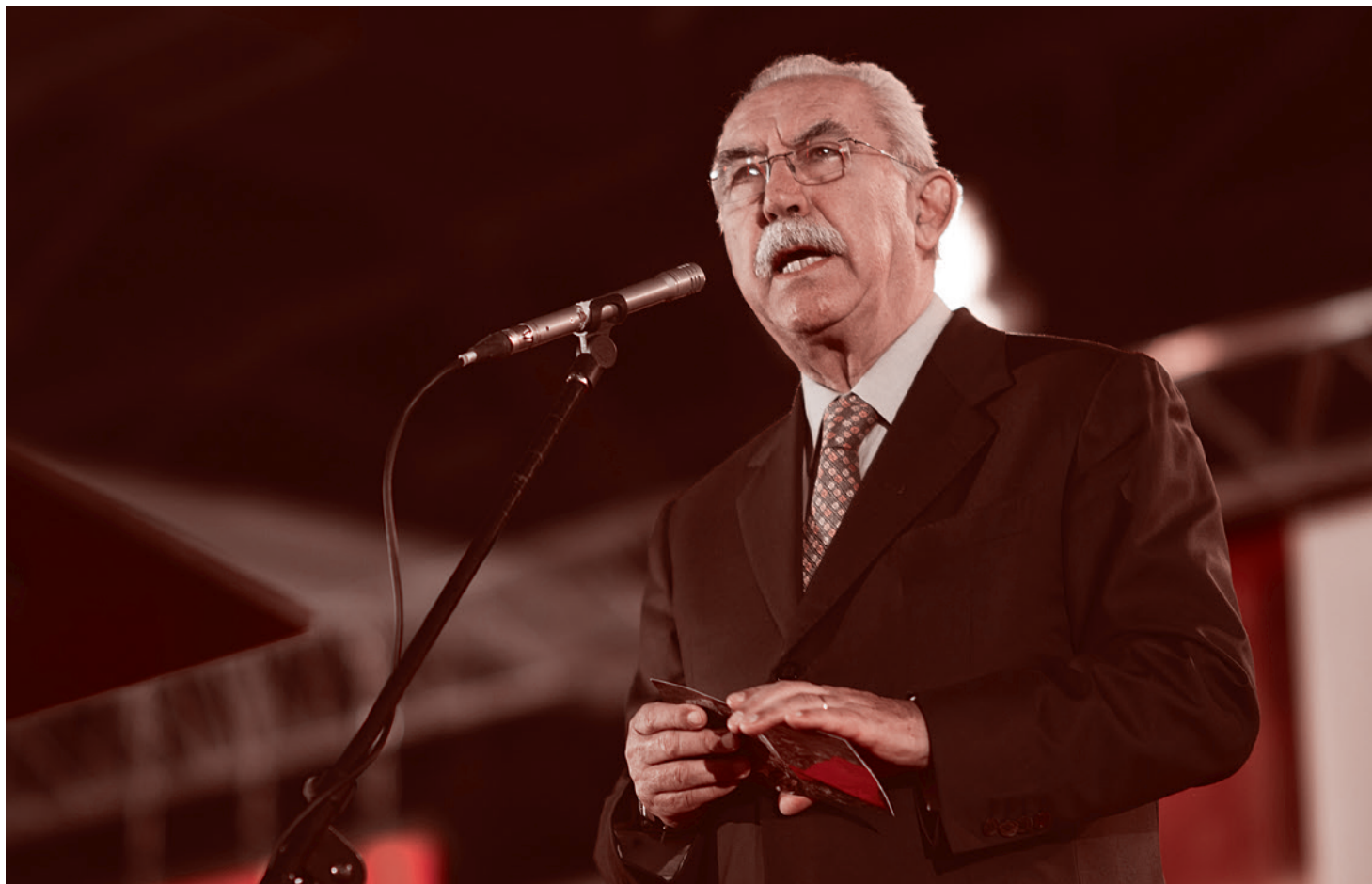
Джульетто Кьеза выступает на Торжественном заседании актива «Суть времени», посвященном 100-летию Великой Октябрьской социалистической революции в Москве. 7 ноября 2017 г.

Хотя считается, что охлаждение отношений между Россией и Евросоюзом началось после мюнхенской речи Владимира Путина в 2007 году, мы этот холодный ветер чувствовали гораздо раньше. Помню, как при обсуждении бесланской трагедии в сентябре 2004 года меня возмутило, что многие депутаты, произнеся стандартные слова соболезнования родным и близким погибших детей, тут же переходили к проблемам Чечни, утверждая, что у террористов есть обоснованные мотивы. Но такие речи и есть то, ради чего затеваются кровавые события. Мы либо осуждаем террористический акт, либо копаемся в его мотивах. Об этом говорил Джульетто, о том же говорила и я в своих выступлениях в парламенте.