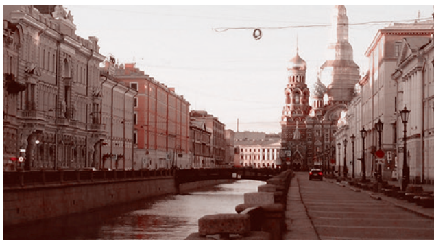
Санкт-Петербург. Пустая набережная канала Грибоедова