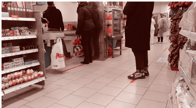
Разметка в магазине для социальной дистанции