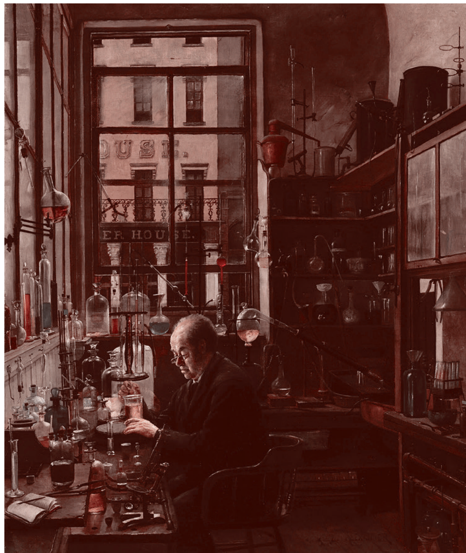
Генри Александр. В лаборатории. Ок. 1885–1987 гг.

Нет более острой глобальной проблемы, чем проблема правомочности эксперимента над отдельными людьми и человеческим обществом в целом. В сущности, именно ответ, который человечество даст на этот вопрос, решит судьбу гуманизма в XXI и последующих столетиях.