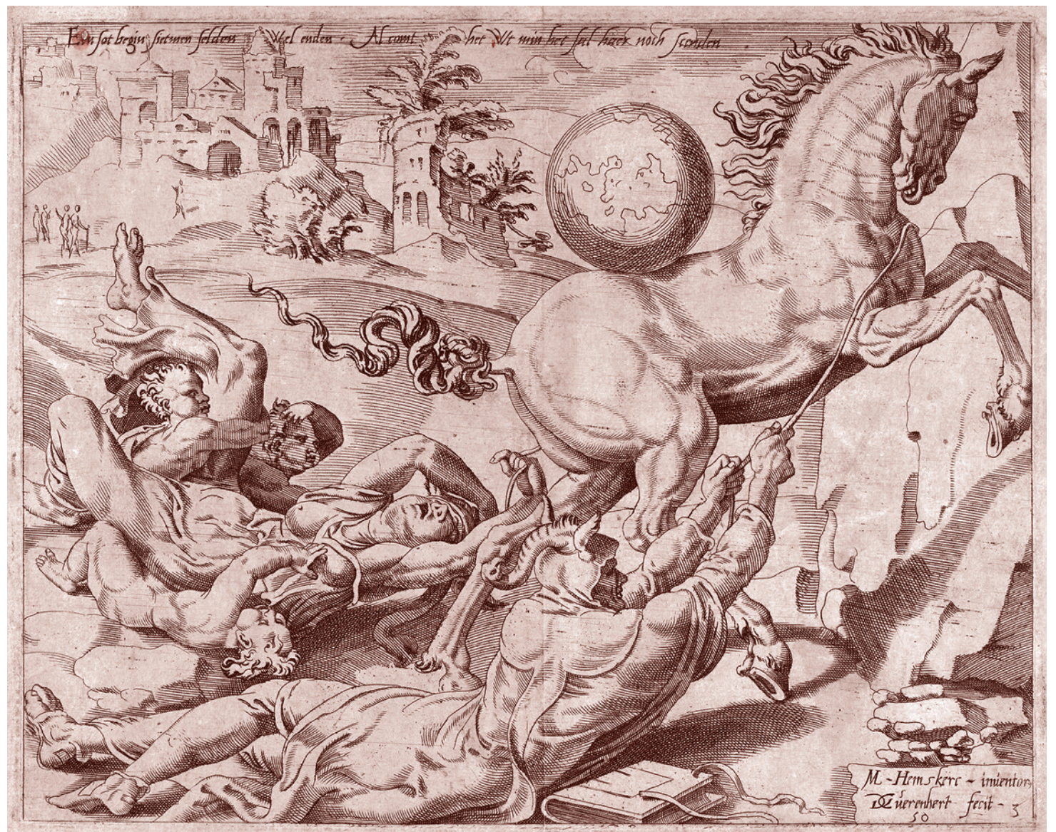
Дирк Коорнерт Волькертсен. Мир уносит прочь Знание и Любовь. Необузданный Мир, лист 3. 1550

И, во-вторых, никогда не посещали Университета марксизма-ленинизма (УМЛ), в котором преподавание велось без отрыва от производства, в который направлялись в том числе по рекомендации парткомов, а также комитетов комсомола, и где изучалась история КПСС, политическая экономия, диалектический материализм, исторический материализм, а также научный коммунизм.