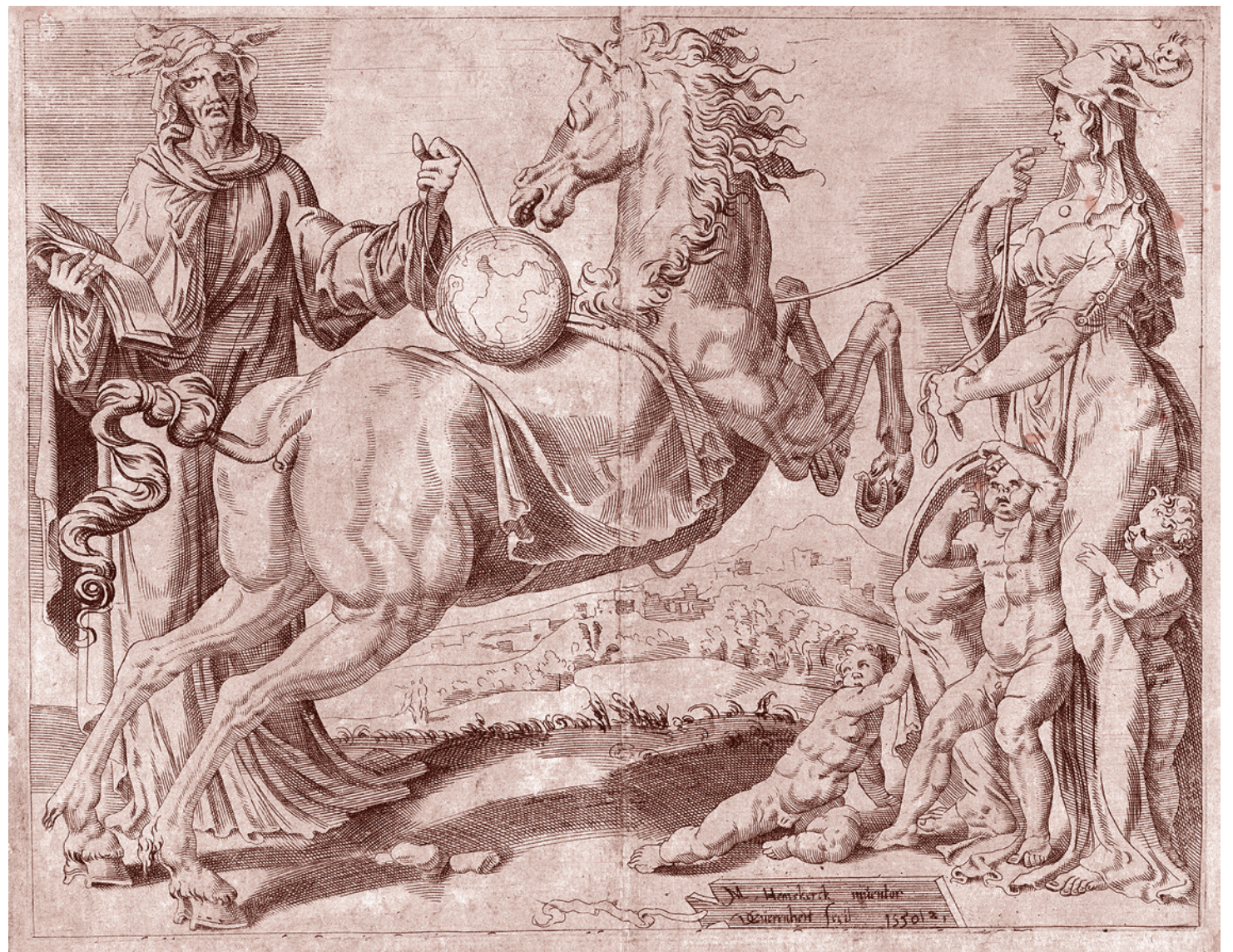
Дирк Коорнегерт Волькертсен. Глупое Знание и глупая Любовь пытаются обуздать Мир. Из Необузданного Мира, лист 2. 1550

Во-первых, нужно было, чтобы разум всё более утверждался в своей абсолютности даже на сугубо теоретическом уровне — как философском, так и научном.