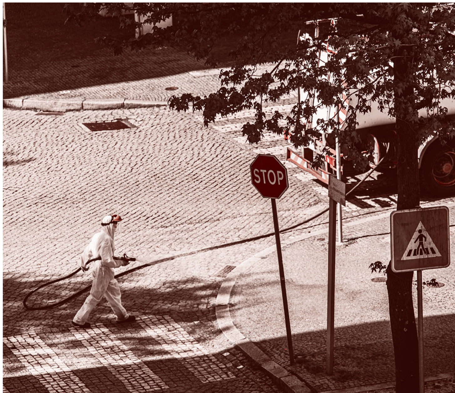
Обработка улиц, Мая, Португалия. Апрель 2020 г.