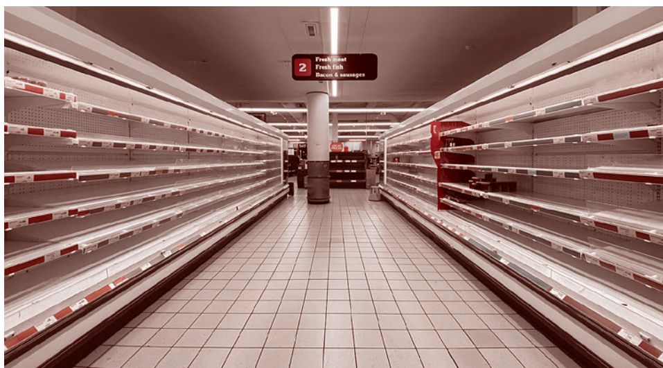
Пустые полки в супермаркете в Лондоне. (Фото — John Cameron). Март 2020 г.

Решение Федеральной резервной системы США обрушить учетную ставку до нуля (0–0,25%) лишь усугубило мрачные прогнозы. Но еще большую панику на глобальных рынках вызвало беспрецедентное обрушение ключевого промышленного индекса американского фондового рынка Доу Джонс за три дня с 29,5 тыс. до 18,6 тыс. (!!!) Чуть вернуло оптимизм на рынки (подняв Доу-Джонс на 3 тыс. пунктов) опять-таки беспрецедентное решение американских законодателей развернуть масштабнейшую программу «аварийного спасения» экономики США.