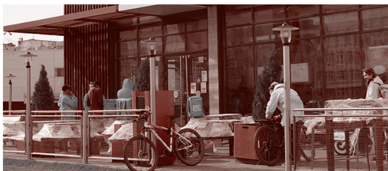
Казань. Курьеры около «Макдоналдса»