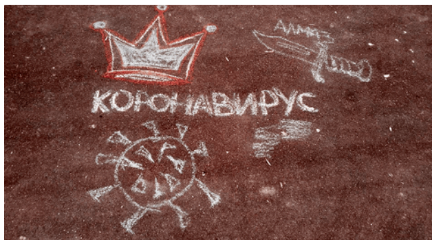
Пос. Знамя Октября, Новая Москва. Коронавирус на асфальте