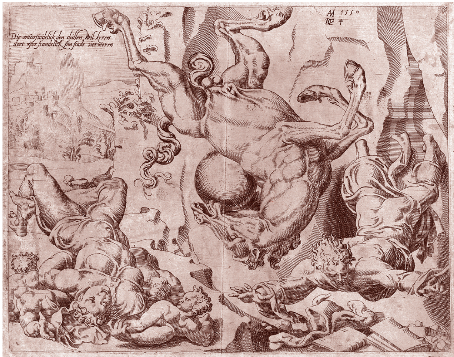
Дирк Коорнеерт Волькертен. Мир гибнет вместе с Любовью и Знанием. Необузданный Мир, лист 4. 1550

Но у меня были сокурсники, посещавшие это заведение. Все они стали яркими антисоветчиками. И кое-кто из них хотел расправиться со мной как с защитником «совка» в эпоху разгрома так называемого ГКЧП.