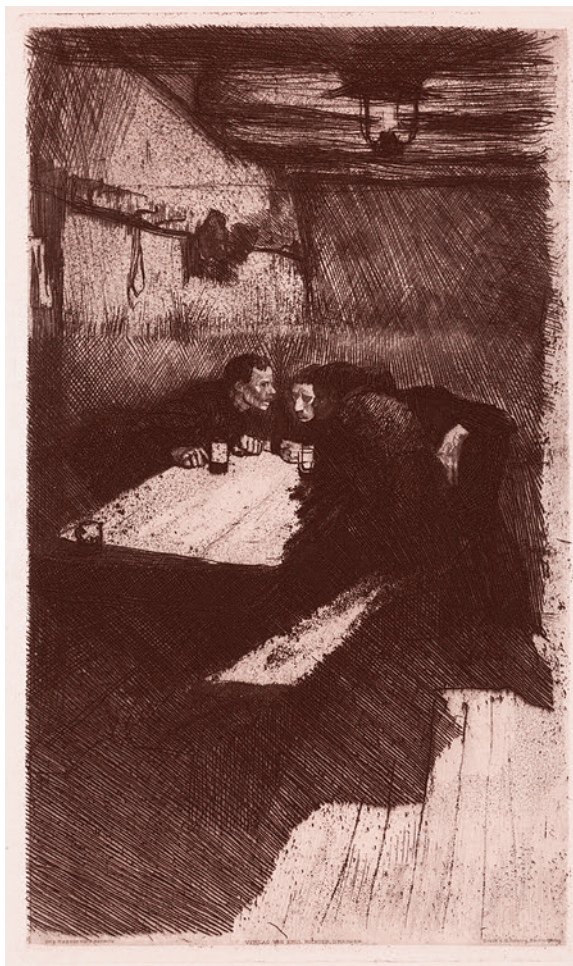
Кете Кольвиц. Собрание. 1895

6. Выступавшим на оппозиционном форуме правозащитникам и экологам из России было выгодно представить преобладающее большинство протестов в нашей стране, часть которых имела строго социальную направленность, как политические акции против нынешней власти. В том числе и для того, чтобы получить от зарубежных соратников больше помощи и поддержки разного рода (политической, информационной, финансовой).