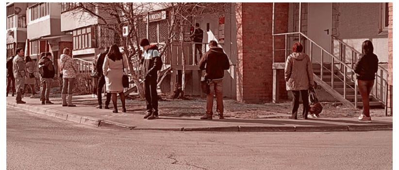
Тольятти. Очередь на почту