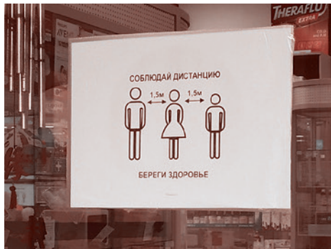
Новосибирск. Объявление в аптеке