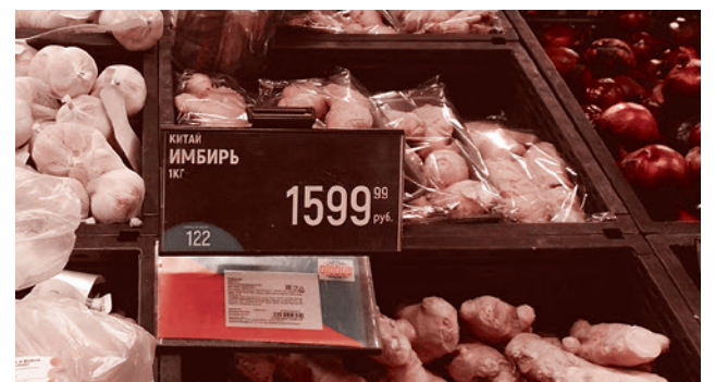
Щёлково, Московская область. Цены на имбирь 5 апреля 2020 г.

Газета «Суть времени» зарегистрирована Федеральной службой по надзору в сфере связи, информационных технологий и массовых коммуникаций (Роскомнадзор) Свидетельство ПИ № ФС77-50554 от 9 июля 2012 года