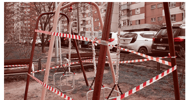
Губкин. Двор в центре города