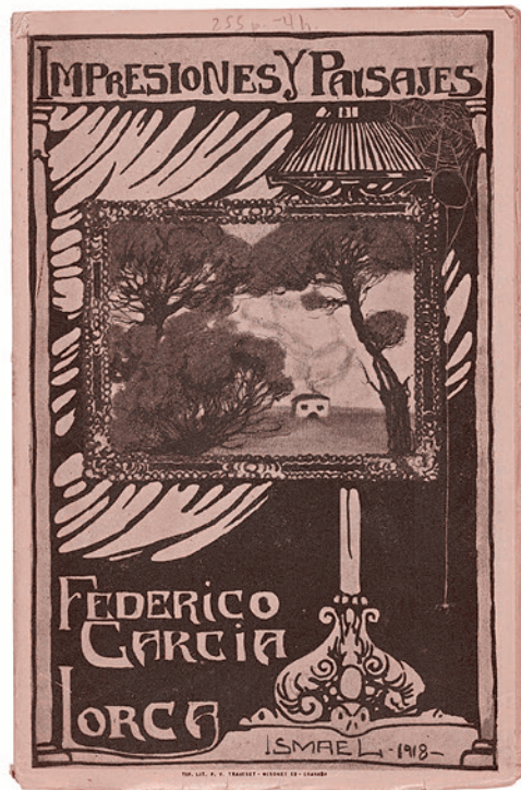
Обложка сборника путевых заметок Лорки об Испании «Впечатления и пейзажи». 1918

«Ла Баррака» вызывала нескрываемое раздражение у правых сил. Прежде всего — намерением приобщать