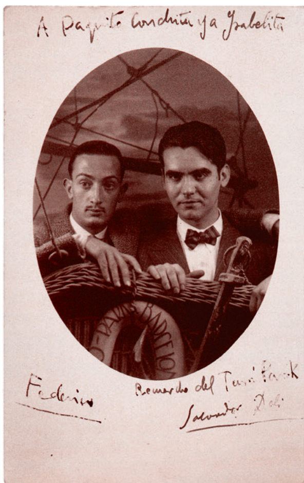
Сальвадор Дали и Федерико Гарсиа Лорка. Туро Парк, Барселона. 1925

В воззвании сказано: «Не каждый в отдельности, а как коллективные выразители воли испанской интеллигенции мы подтверждаем нашу приверженность Народному фронту, ибо считаем, что свободу следует уважать, что уровень жизни наших граждан должен стать более высоким, а культуре надлежит проникнуть в самые широкие слои народа».