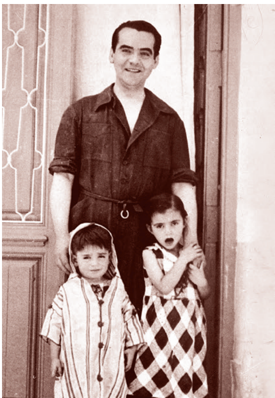
Лорка со своими племянниками. 1935

Нельзя пройти мимо политического аспекта пьес самого Лорка. Так, пьеса «Марьяна Пинеда», написанная им в 1927 году (то есть за несколько лет до провозглашения Республики), с большим трудом попала на мадридскую сцену. Марьяна Пинеда — известная историческая личность, чтимая в Гранаде. Мать двоих детей, она была казнена в 1831 году за участие в заговоре против короля, за то, что вышла замуж с надписью «Свобода, Равенство, Братство». Не выдавшая никого из заговорщиков и казненная, Марьяна Пинеда стала народной героиней.