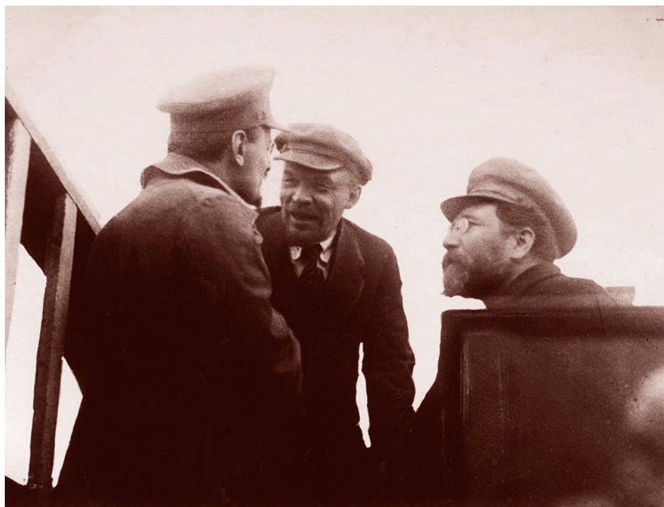
Троцкий, Ленин и Каменев

Вот что конкретно написано Троцким по поводу дореволюционной группы «Распад» в его «Литературе и революции»: