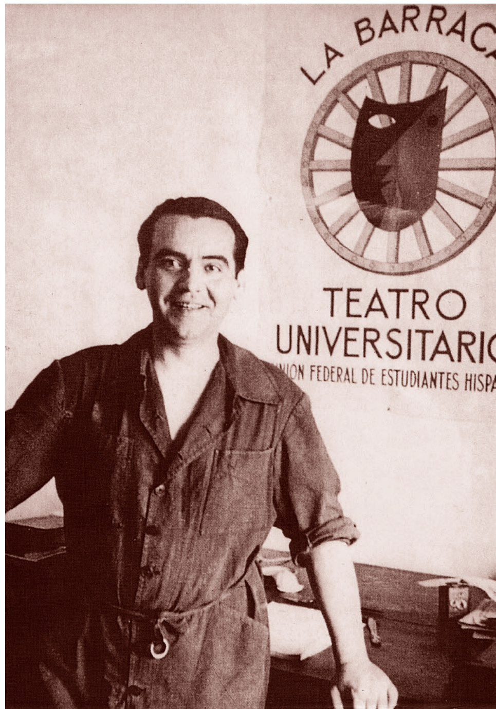
Федерико Гарсиа Лорка

Вот что, к примеру, Дмитрий Быков походя пишет о Лорке в статье, посвященной испанскому поэту Леону Фелипе (декабрь 2019 года, журнал «Дилетант»). «В 1936 году подавляющее большинство «Поколения 1927 года» встало на сторону республики — не потому, что все они были ахти какими республиканцами, у них были разные убеждения, и даже Лорка, которого советское литературоведение упорно делало чуть ли не со-