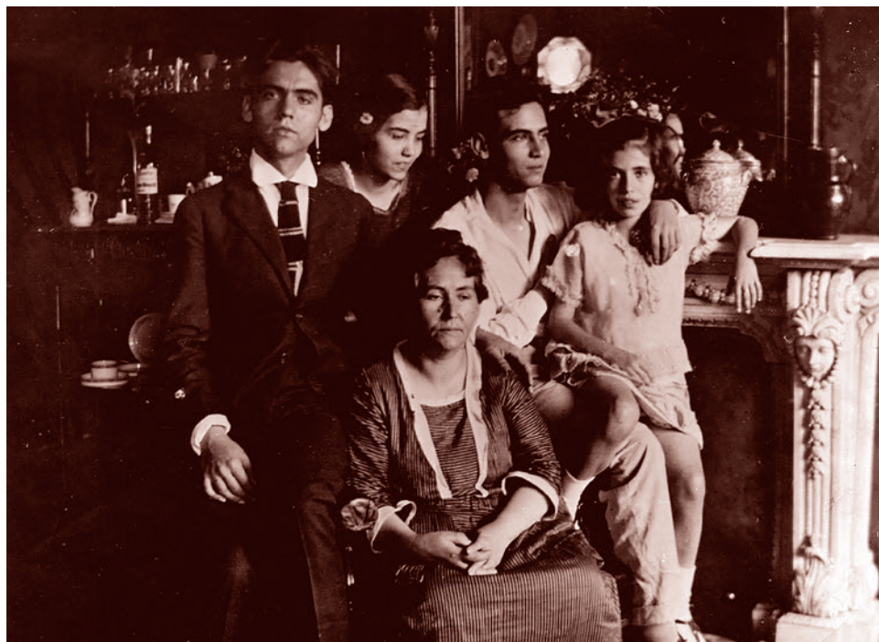
21-летний Федерико Гарсия Лорка, его мать — Висента Лорка, братья — Конча и Франциско, и сестра Изабелита

«Похороны, в детстве привлекавшие белизной гроба, лентами и цветами, ныне заставляют меня в ужасе закрывать