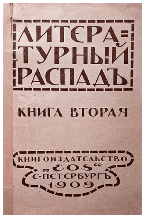
Титульный лист сборника «Литературный распад». 1909

Он был знатоком марксизма, исследователем жизни и деятельности Маркса, автором монографий о Чернышевском, Бакуине, Добролюбове. При этом он не чурался и прямой религиозности. В 1909 году Стеклов принял христианство (и внимание!), приняв его, продолжал печататься в большевистских газетах. Стеклов как большевик подвергался преследованиям при Столыпине уже после того, как он принял христианство. Принятие Стекловым христианства не помешало Ленину поручить Стеклову преподавание в большевистской и сугубо ленинской школе Лонжюмо.