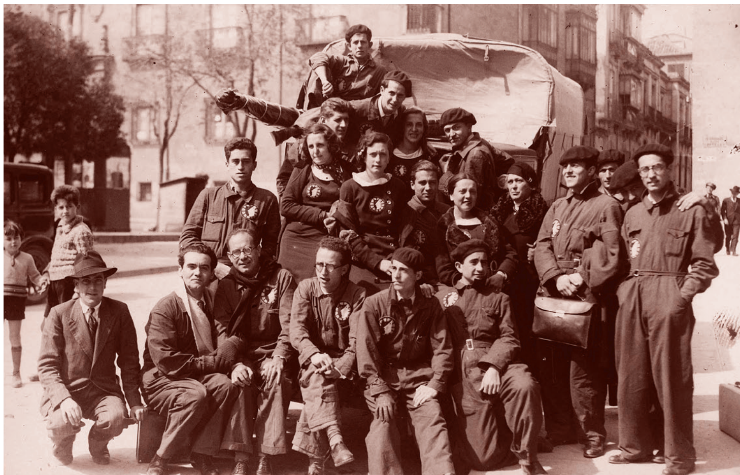
«Ла Баррака». 1933