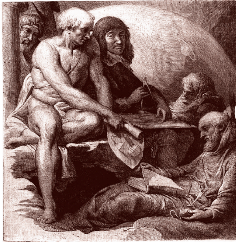
Джеймс Барри. Ученые и философы. Ок. 1804–1805 гг.

То, что выше любого авторитета для физика — Его Величество Эксперимент, нечто подтверждающий и нечто опровергающий по причине того, что это нечто противоречит реальности, обнаруживаемой с помощью эксперимента.