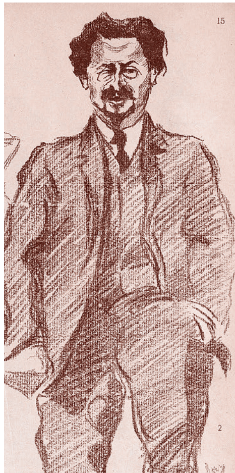
Юрий Арцыбушев. Троцкий. Из альбома «Диктатура пролетариата». 1918