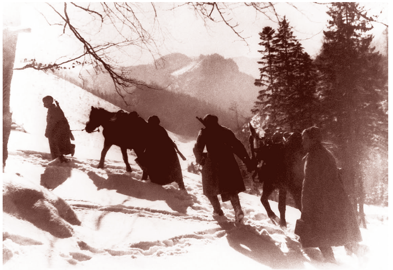
Бойцы Красной Армии на марше через Карпаты. 1944

С августа 1940 года в Словакии развернулось строительство немецких военных