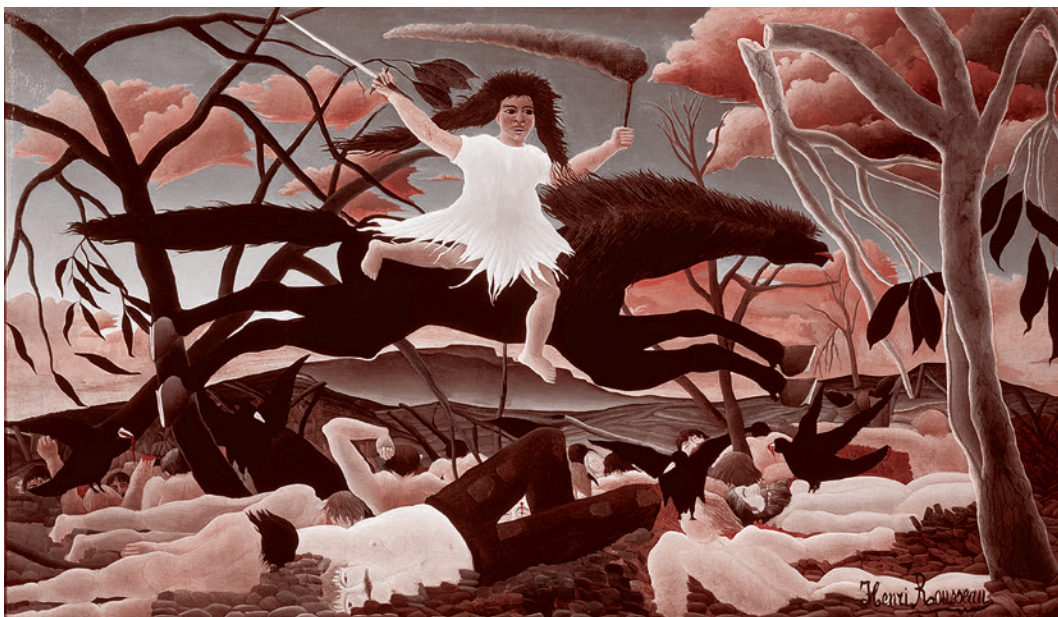
Анри Эмильен Руссо. Война, или дорога раздора. 1894

Автор рассматриваемой нами модели, которая так же правомочна, как и другие,