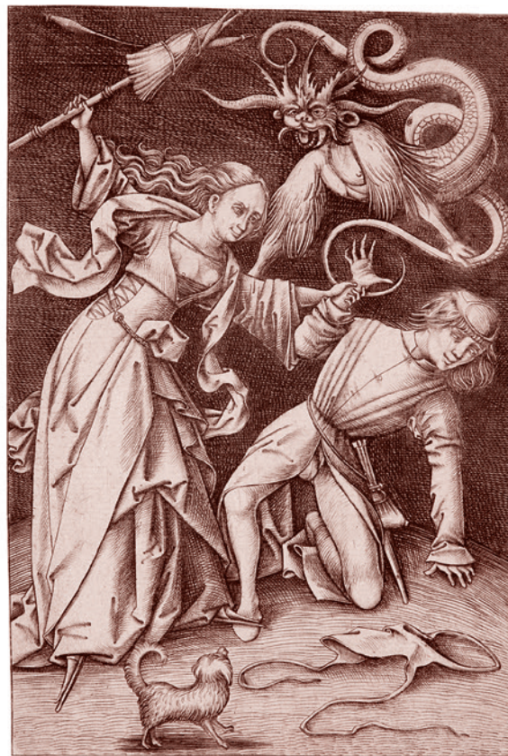
Израэль ван Мекенем. Сердитая жена. Ок. 1495–1503 гг.

Может, авторы инициативы надеялись, что нарисованные синяки подвигнут тех, кто насилие не приемлет, отключить