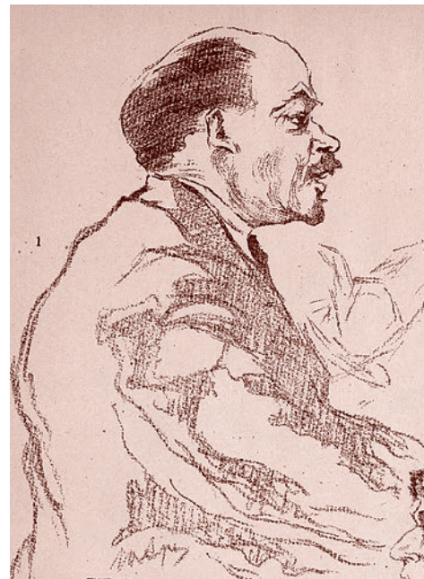
Юрий Арцыбушев. Ленин. Из альбома «Диктатура пролетариата». 1918