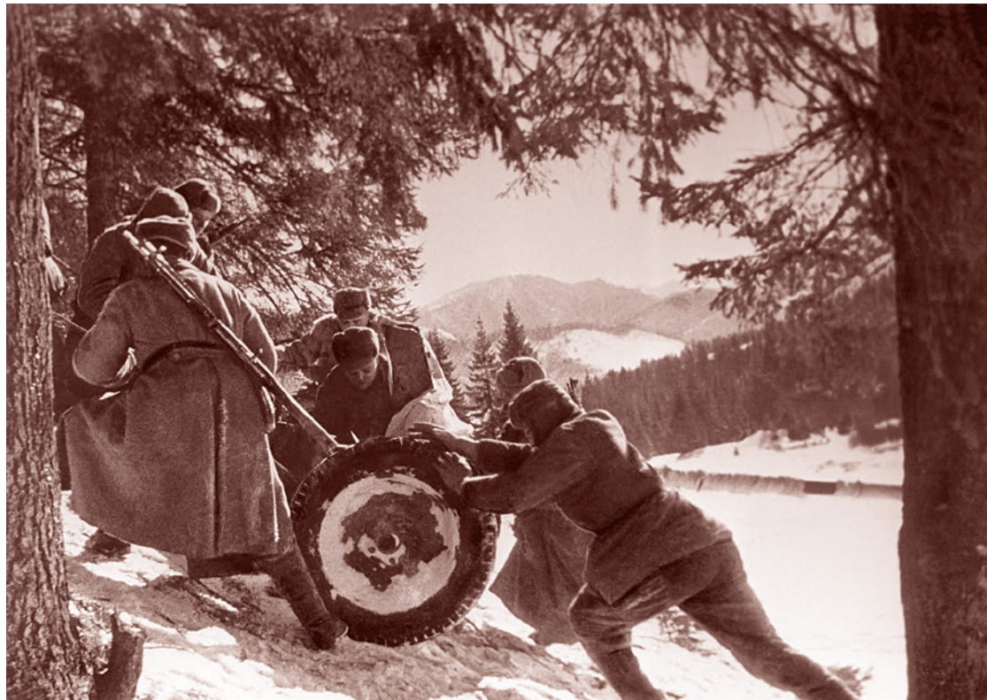
Макс Альперт. Бойцы 4-го Украинского фронта перемещают вверх по склону 45-мм противотанковую пушку образца 1942 г. (М-42) в Карпатских горах. Январь–март 1945