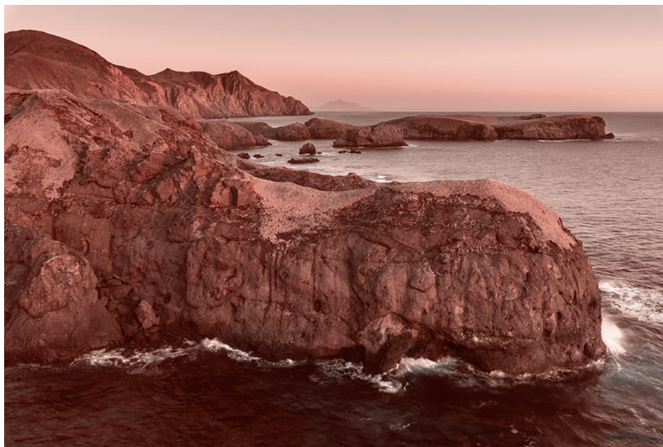
Остров Шикотан. Мыс Край света. 2017

Так, в «Памятной записке советского правительства от 27 января 1960 года» было сказано следующее (об американо-японском договоре и новых условиях исполнения «Московской декларации 1956»): «В связи с тем, что этот договор фактически лишает Японию независимости..., складывается новое положение, при котором невозможно осуществление обещания Советского правительства о передаче Японии островов Хабомаи и Шикотана... Советское правительство считает