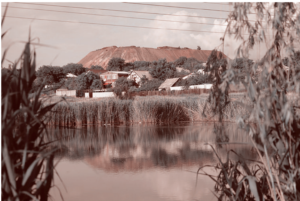
Красный Луч. 2017 (Фото — Александр Иванов)

и даже неухоженные деревья, и разбитые дороги.