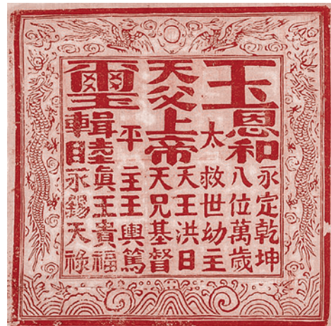
Печать Тайпинской революции. 1864

Вдохновившись этими видениями, Хун Сюцюань начинает проповедовать свое вероучение, в чем ему помогают его родственники и друзья, подчеркивающие именно мессианскую роль Хун Сюцюаня.