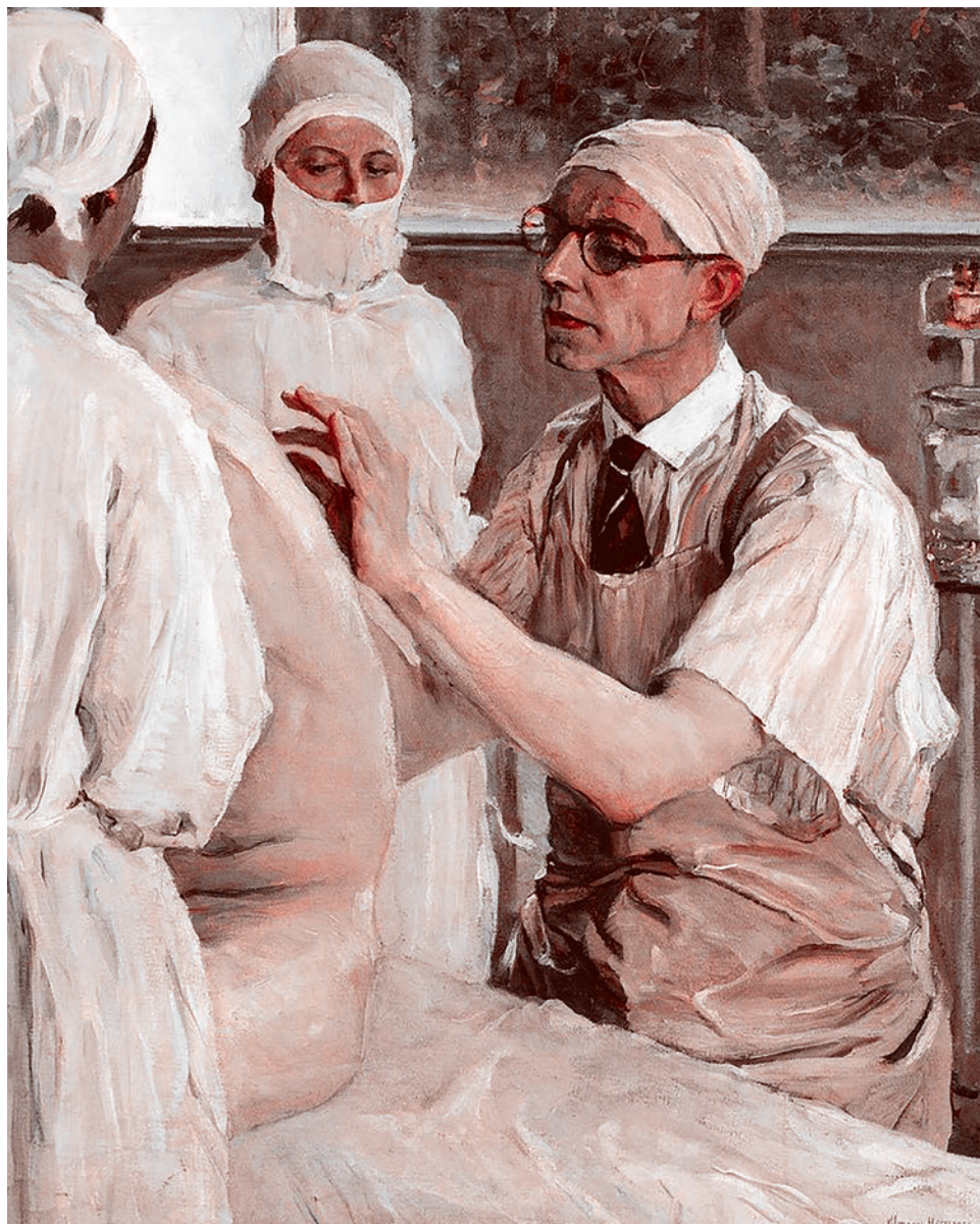
Михаил Нестеров. Портрет Хирурга С.С. Юдина

Приходится признать, что в отличие от своих западных (прежде всего американских) коллег российские врачи не объединены в сколько-нибудь сильные профессиональные организации, отстаивающие свои интересы. Складывается впечатление, что наши врачи не только не борются за свои права, но ждут, когда система бесплатной медицины окончательно «схлопнется» и останутся только платные услуги, в которых они (врачи) рассчитывают развернуться.