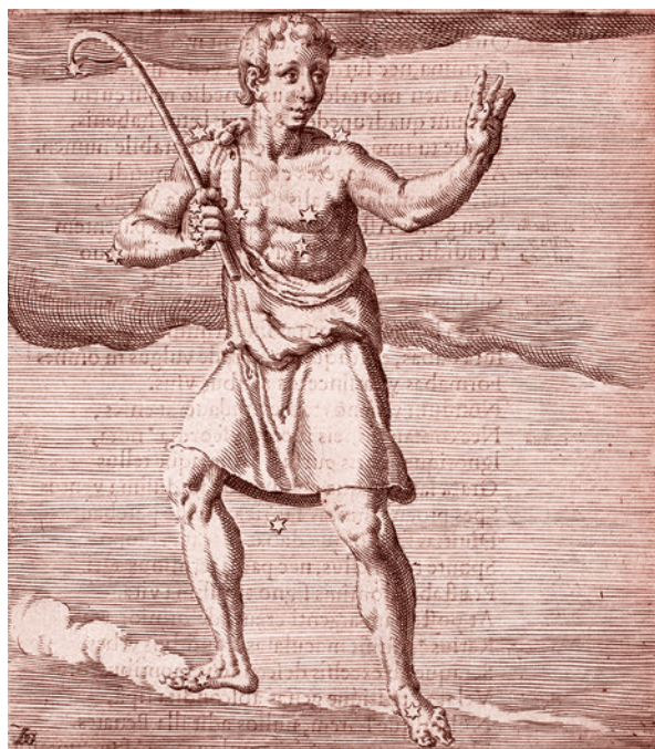
Якоб де Гейн II. «Арктофилак», Страж Медведицы. XVI в.

Ты восполняешь дефициты и говоришь: «Смотрите, вот зачем это нужно!