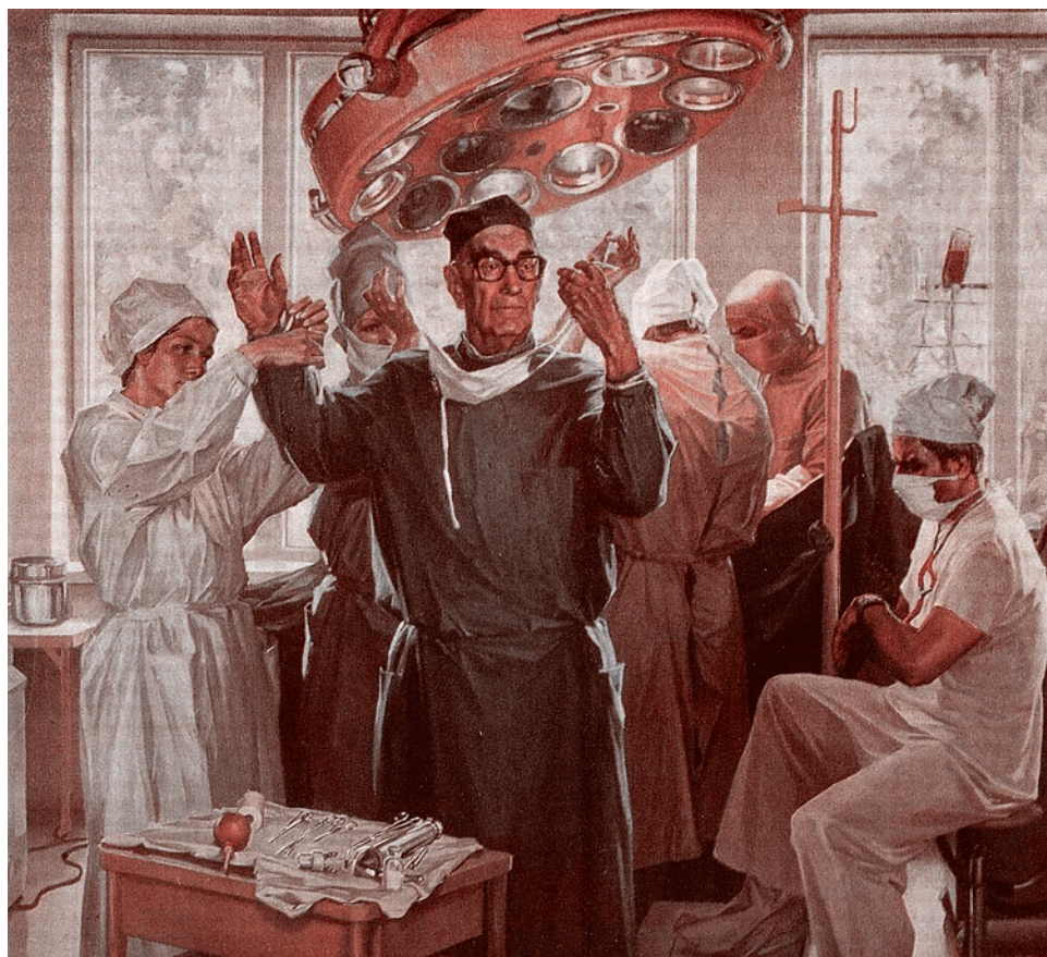
Евгений Корнеев. Портрет академика А.А. Бозуша. 1980