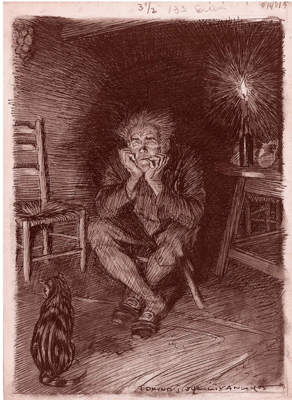
Эдмунд Дж. Салливан. Присев угрюмо и молчаливо перед своим дымным очагом. 1905

Есть основания полагать, что восторги Ахматовой по поводу «Мастера и Маргариты» были вызваны не только художественными достоинствами текста, но и его гностическим содержанием. Впрочем, гностическое мировоззрение советской интеллигенции, разрушившей Советский Со-