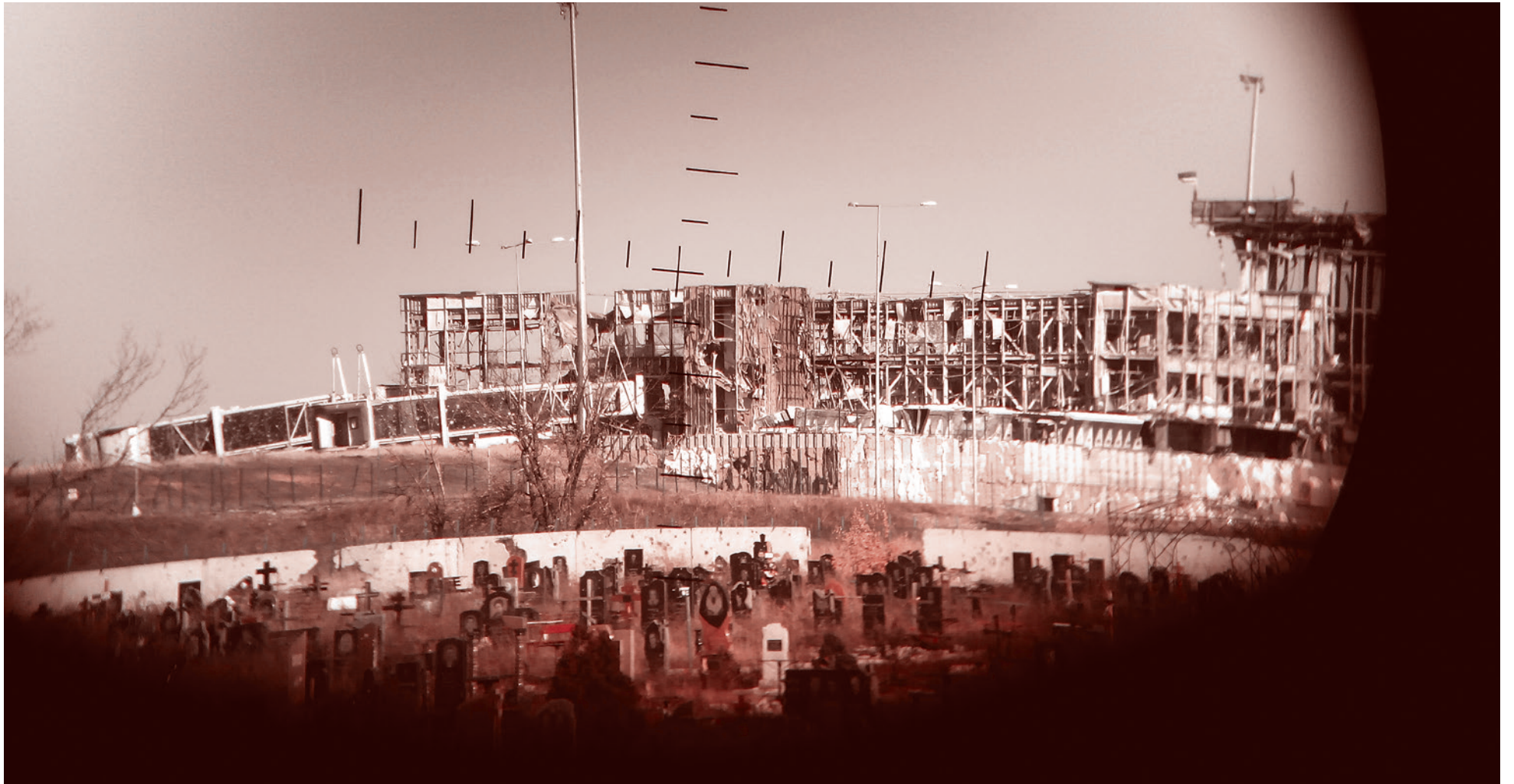
Донецкий аэропорт. Конец 2014 г.

Люди не знают, что такое война, пока не столкнутся с ней нос к носу. Мы легкомысленно живем в наших легкомысленных городах, вспоминая о войне в День Победы, который каждый раз проходит одинаково: утром парад, в течение дня — ряд плановых мероприятий, вечером салют. Но вряд ли Дни Победы, или другие патриотические мероприятия, или знакомство с разного рода историческими материалами добавляю хоть что-то к нашему знанию войны такой, какова она есть. Впрочем, бывают моменты, когда удается если не узнать что-то, то хотя бы странным образом ощутить отчаяние, смерть и одиночество, которыми наполнена любая война.