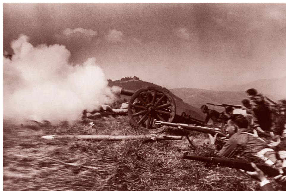
Дэвид Сеймур. Испания, республиканские солдаты в бою. 1936

Итак, диктаторам, в данном случае, Пиночету, надо отдать должное за восстановление чилийской экономики. Эти же аргументы мы слышали в 90-е годы и про спасительное правление Франко, восстановившего Испанию после Гражданской войны. Оставим за скобками исторические реалии — тяжелейшие последствия для Чили либерализации экономики и возвращения национализированных Альенде предприятий опять в руки западных компаний. В данном случае главное — не это.