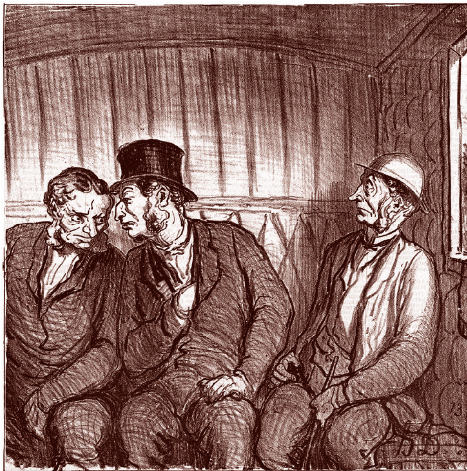
Оноре Домье. Они планируют заговор. 1864

Мои соратники попросили меня отвлечься от стратегической и идеологической проблематики и высказаться по текущим вопросам, которые очень запутаны и, как я убежден, никоим образом не сводятся к столь пугающим многим прямолинейным геополитическим конфликтам классического образца. Мое убеждение состоит в том, что такого конфликта нет, но есть нечто другое, гораздо более невнятное и опасное.