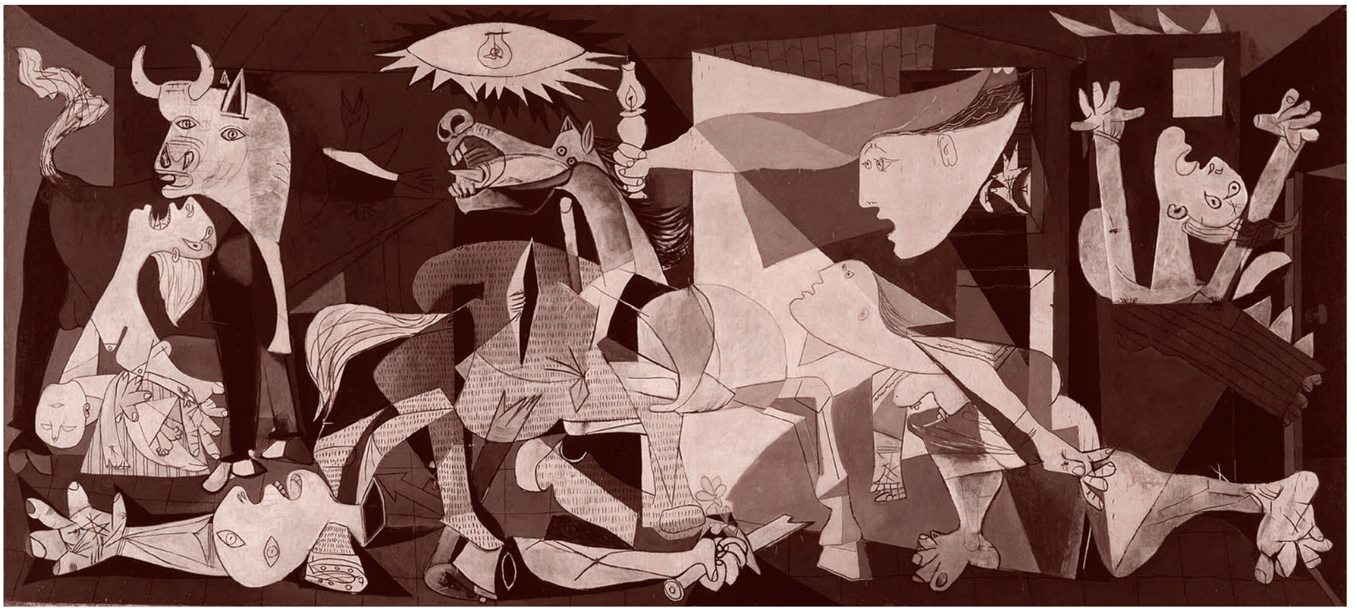
Пабло Пикассо. Герника. 1937

18 ноября, только в одном подвале, я насчитал триста мертвых детей. Я посчитал мертвых в каретах скорой помощи,