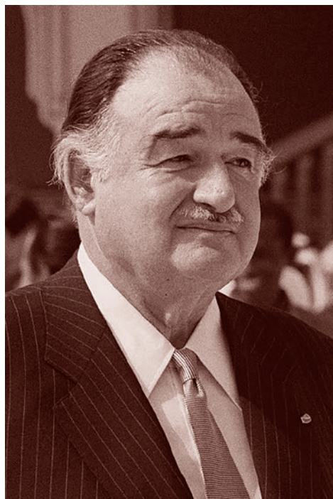
Александр де Маранш

Что такое подразделение «Аль-Кудс»? Это спецназ, входящий в КСИР. Задача этого спецназа — осуществление специальных операций за пределами территории Ирана.