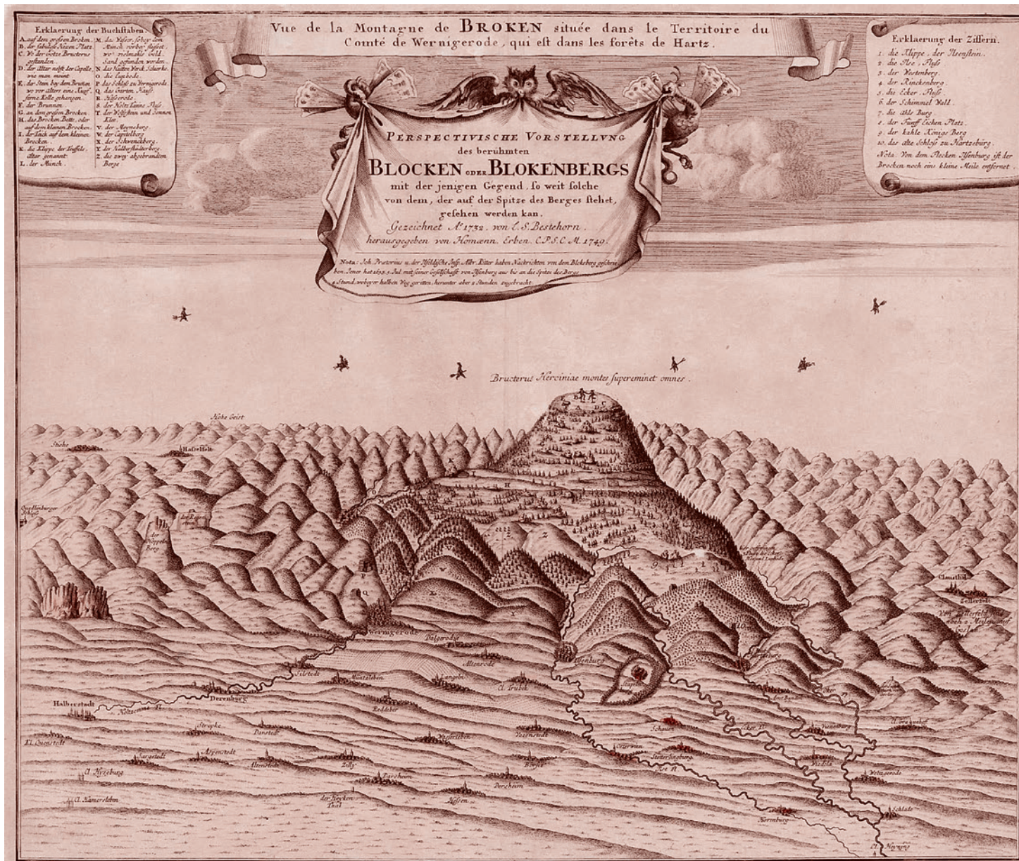
Наследники Гоманна. Вальпургиева ночь. 1749