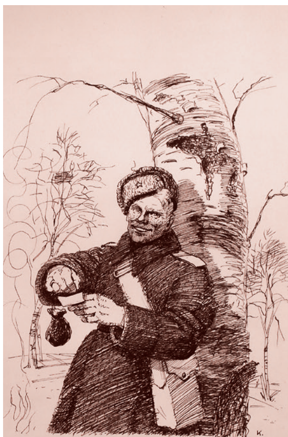
А. М. Каневский. На привале. Иллюстрация к поэме А. Т. Твардовского «Василий Тёркин». 1944

Ах, мой друг, читатель-дока, Окажи такую честь: Накажи меня жестоко, Но изволь сперва прочесть.