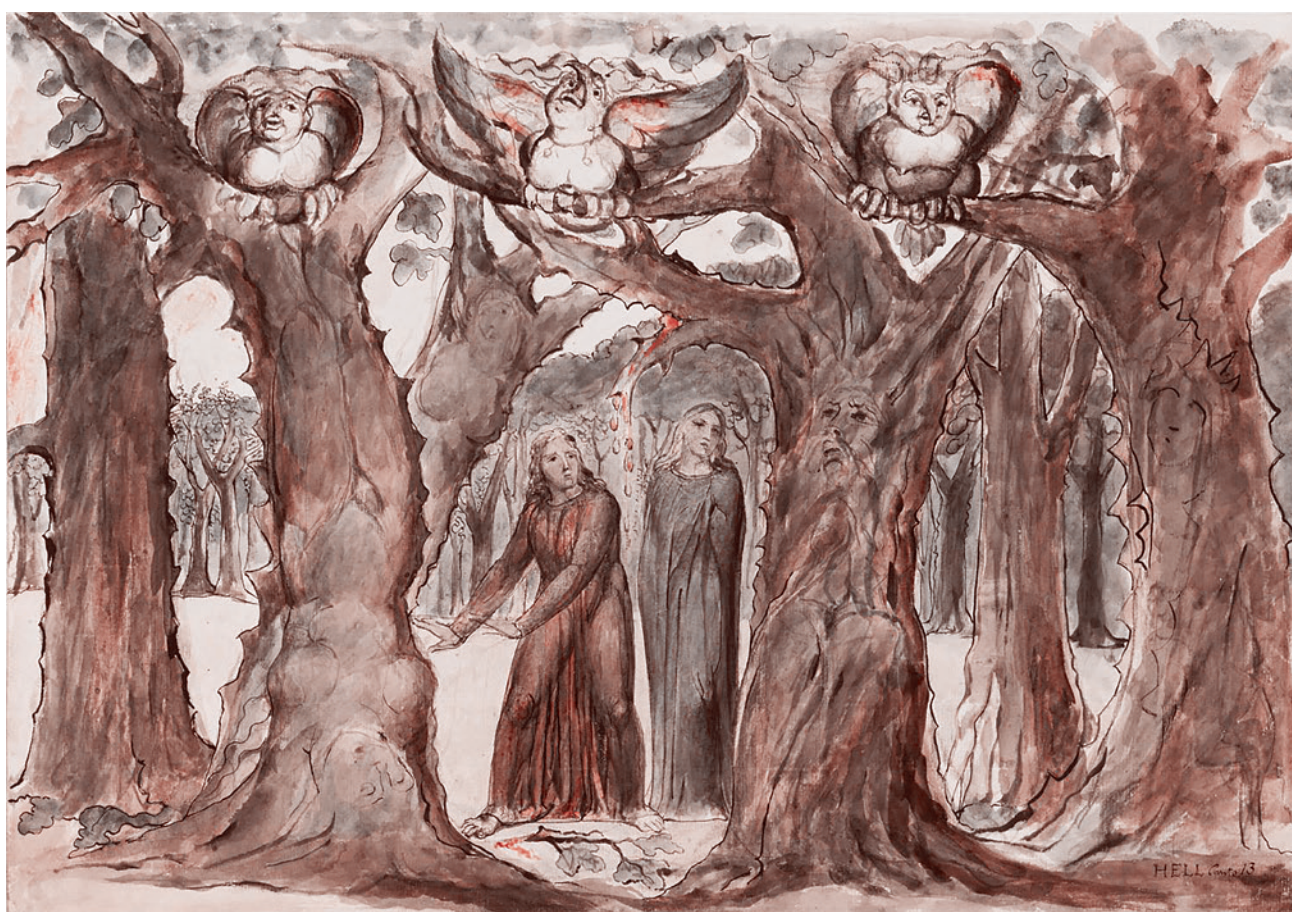
Уильям Блейк. Дерево самоубийц. 1824–1827

В годы перестройки советские люди предали своих предков и поддержали власть, растоптавшую созданное ими государство. Народ молчаливо или с одобрением наблюдал за тем, как власть имущие топили в грязи все, что создали деды, за что они умирали и ради чего жили. Сейчас наш народ за это предательство отцов расплачивается слабостью, апатией, потерей смысла своего существования. А что должно произойти с народом, который предаст своих детей? Вопрос не абстрактный.