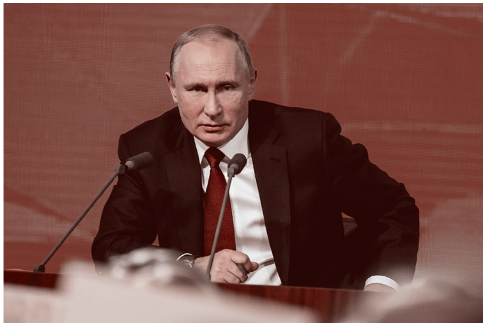
Владимир Путин на большой пресс-конференции 19 декабря 2019 г.