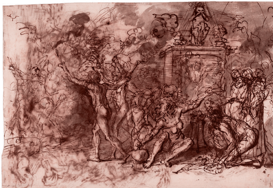
Сальватор Роза. Шабаш ведьм. 1615–1673

«Кстати, — говорит он, — не надо напрягаться сильно по поводу того, что мы обращаемся к демоническим сущностям, потому что природа ангельская и демоническая, иерархия ангельская и аггельская (демоническая) — она одна и та же. Разница только в том заключается, что как бы первые, они у власти находятся, а вторые — в оппозиции».