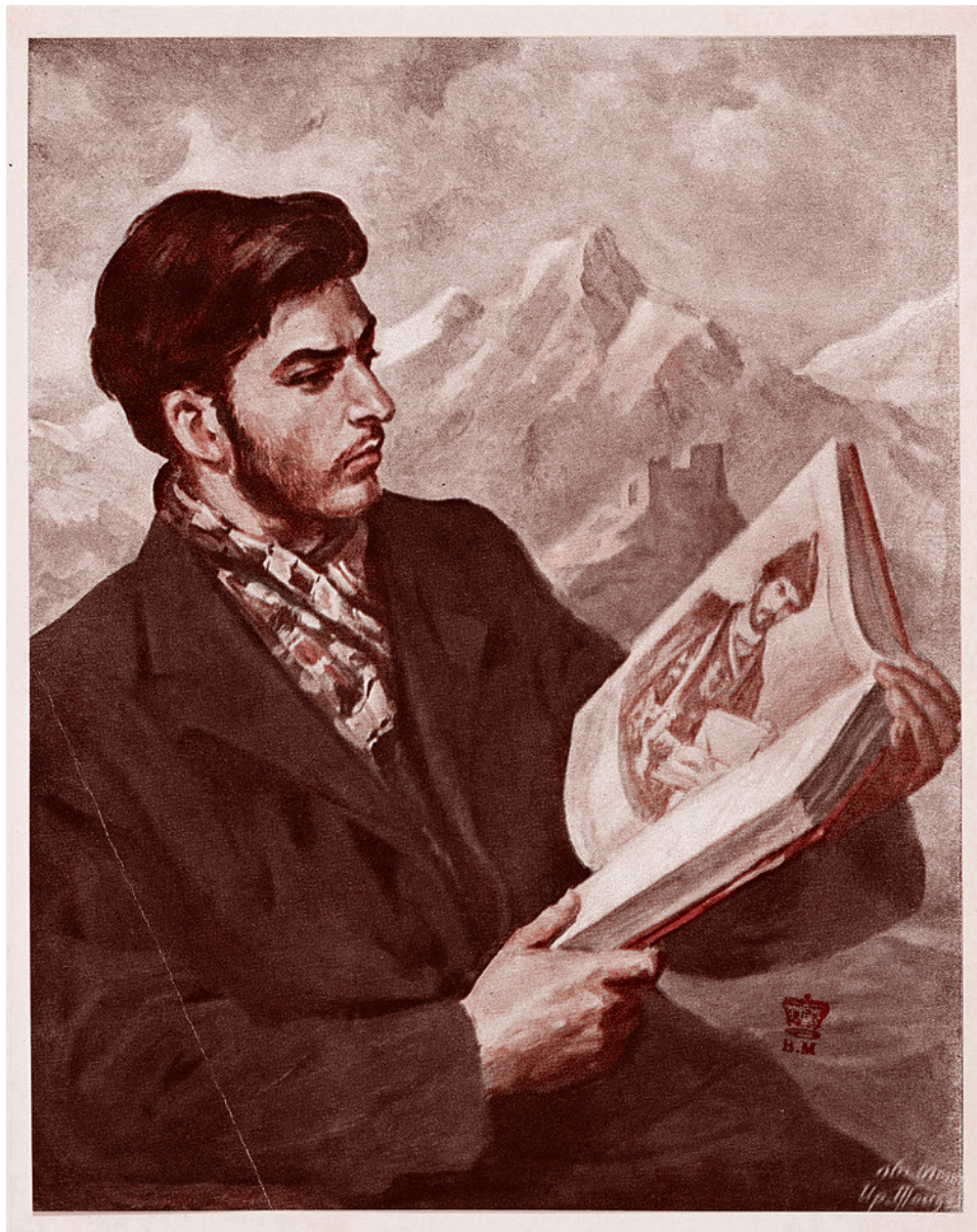
Ираклий Тоидзе. Молодой Сталин читает поэму Ш. Руставели «Витязь в тигровой шкуре». Фронтиспис к книге «Антология грузинской поэзии». 1948

Что находится в центре этого треугольника, в его точке сборки, которую правомочно называть сердцевинной сталинской сокровенности? Дабы не впадать в избыточную патетику, скажу, что в этой точке находится великое всемирно-истори-