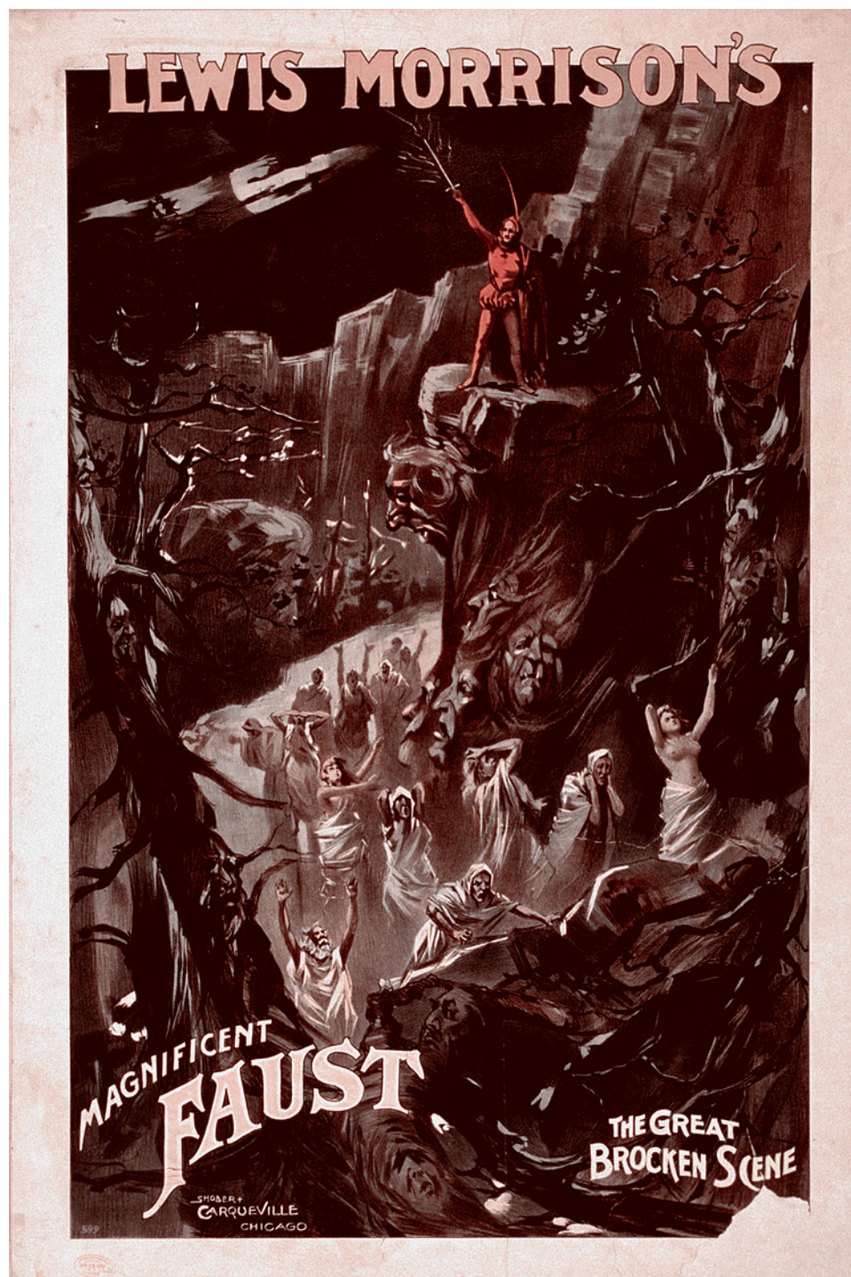
Сцена на Брокене. Театральная афиша. 1889