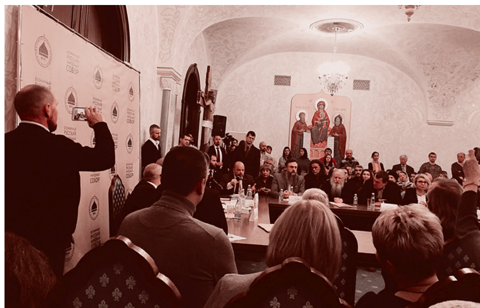
Расширенное заседание бюро президиума Всемирного Русского народного собрания (ВРНС) в храме Христа Спасителя в Москве. 6 декабря 2019 г.

ния», — объяснил суть проблемы Охлобыстин.