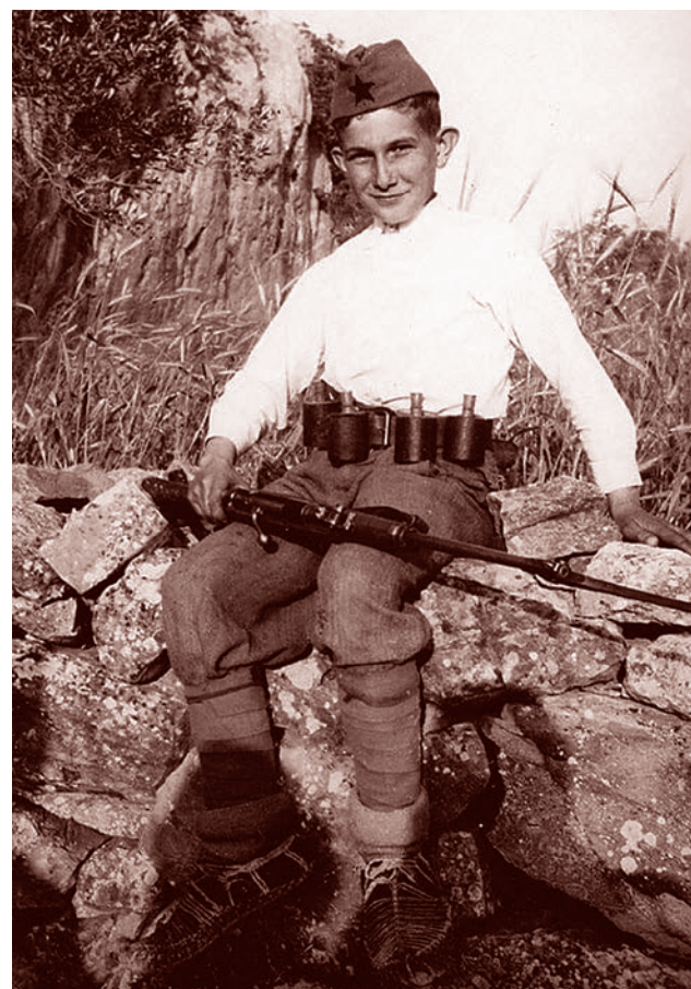
Юный югославский партизан. 1943