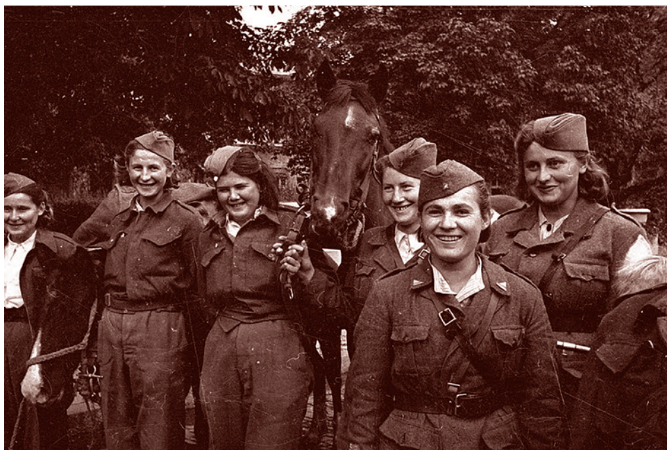
Югославские партизаны. 1944

лен против СССР. Вскоре к Пакту присоединились Венгрия (20 ноября), Румыния (23 ноября), Словакия (24 ноября), Болгария (1 марта 1941 г.). В итоге Югославия оказалась полностью окруженной прогерманскими странами, и ее правительство, решив не геройствовать, 25 марта 1941 года присоединилось к Пакту. В общем, как говорится, лавировали, лавировали, да не вылаживали.