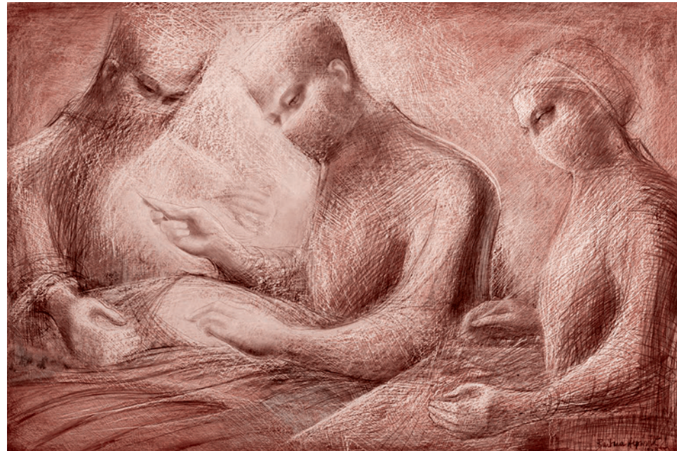
Барбара Хепворт. Скульптура 2. 1949

Однако, по заявлению медиков, все эти условия соблюдались, поэтому не было никакого здравого смысла отменять заплани-