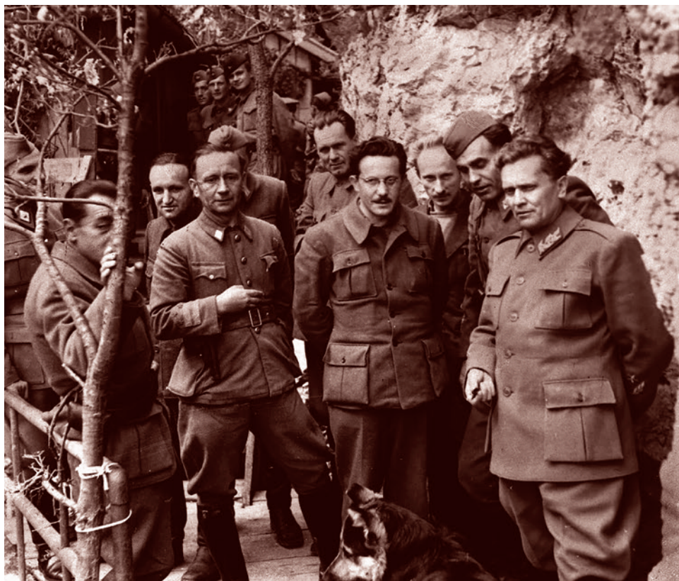
Иосип Броз Тито со своим штабом в горах Югославии. 1944

Однако более плотные связи с СССР Югославия наладить не успела (или не захотела), так как в сентябре 1940 года между Германией, Италией и Японией был подписан Тройственный пакт — договор о военно-политическом союзе, который, как уже понимали почти все, был направ-