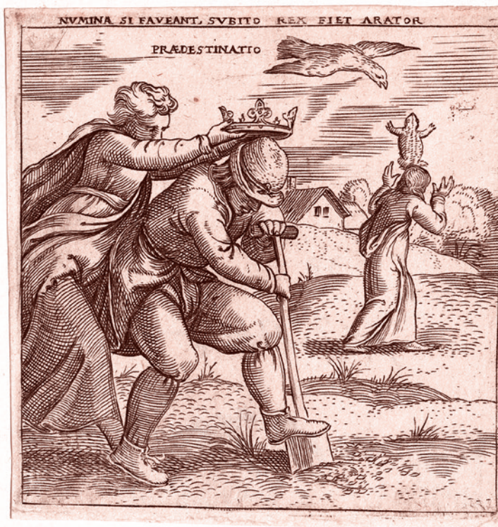
Гравировка Энея Вико. Предопределенность. Ок. 1545–1550 гг.

В манифесте Сергей Ервандович подчеркивает, что даже в природе альтруистическое поведение животных имеет огромное