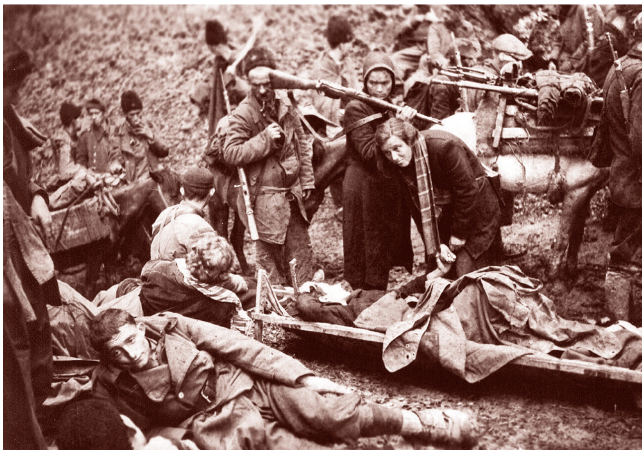
Партизанский лагерь в горах. 1943