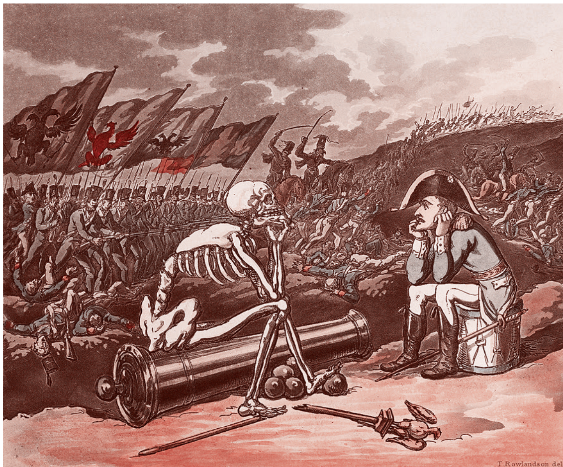
Томас Роулендсон. Смерть и Бонапарт — два короля террора. 1 января 1814 г.