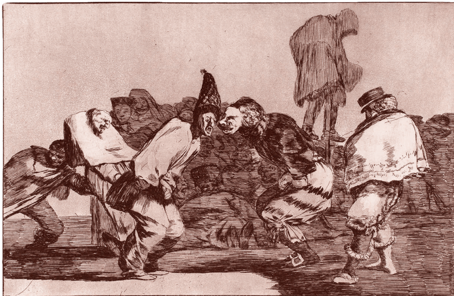
Франсиско Гойя. Карнавальное безумие. Лист 14 из серии «Диспаратес». Ок. 1816–1823 гг.