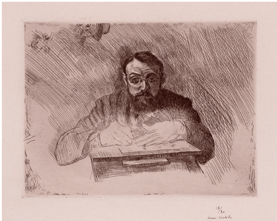
Анри Матисс. Автопортрет художника за гравировкой. 1900–1903

Этот вопрос может показаться надуманным. И я не обижусь, если вам так покажется. И все же мне кажется, что это достаточно глубокий вопрос. Как минимум — неслучайный. Вдумайтесь: человек добровольно и бесплатно готов сидеть сотни и сотни часов за письменным столом, отказывая себе в гораздо более приятных вещах: прогуляться, например... или выпастыся... или пойти на свидание... или... Да мало ли в чем? Ну почему он сидит и сидит, пишет и пишет? Что ему там, мёдом намазано?