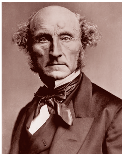
Джон Стюарт Милль

Продолжая свое сравнение мещанского государства с жирафом, обладающим особым внутренним устройством, являющимся патологическим с точки зрения оптимального сочетания частей своего тела, но неотменяемым для жирафа, Герцен (именуя жирафа по-латыни камелеопардалом), пишет: «Переднюю часть европейского камелеопардала составляет мещанство — об этом можно было спорить, если б дело не было так очевидно; но однажды согласившись в этом, нельзя не видеть всех последствий такого господства лавки и промышлен-