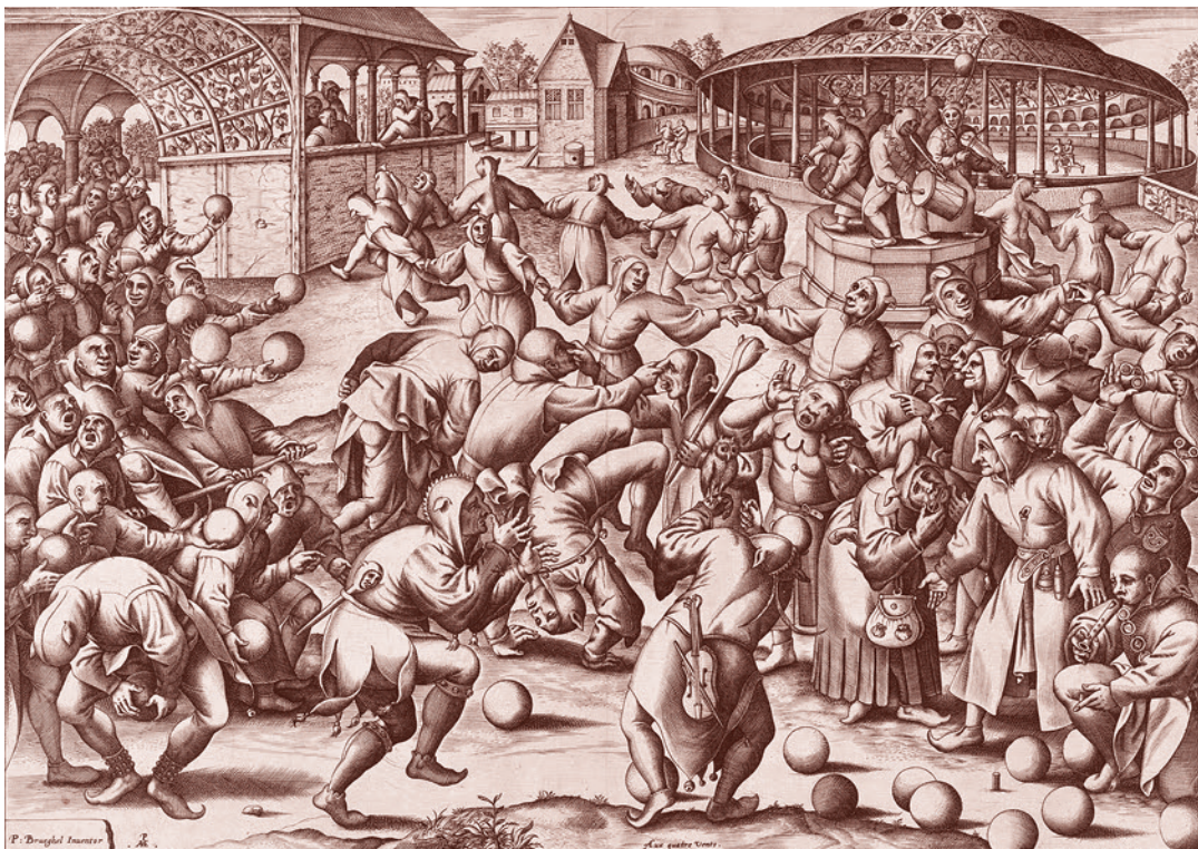
После Питера Брейгеля Старшего. Праздник дураков. После 1570 г.

Если вывести за скобки спецфактор, породивший то, что они назвали дурдомом, а этот фактор существовал, потому что уже тогда я по причине своей неангажированности и невесты откуда взявшейся готовности защищать Советский Союз не давал покоя одному недавно покинувшему земной мир высокопоставленному спецслужбисту, то остается это самое косвенное активное воздействие, порожденное самим фактом существования. Одна из ленинградских театральных критиков, если мне не изменяет память, аж доктор искусствоведения, сказала по этому поводу напрямую: «Если показанное нам является спектаклем, то я не критик. Потому